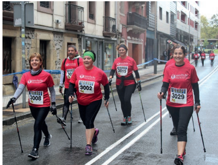
Ipar martxalari talde bat, Kale Nagusian. TXINTXARRI

Oso gustura aritu dira Ostadar Ipar Martxakoak lasterketan.