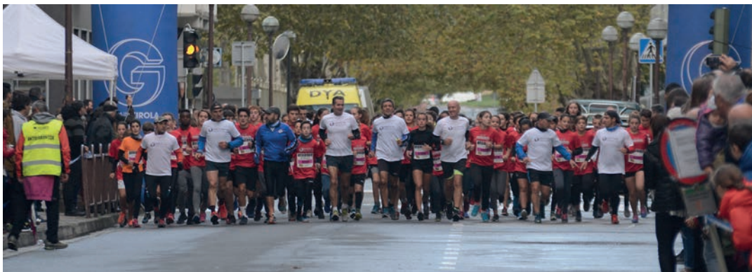
Ehunka gaztetxok parte hartu dute hemezortzigarren Korrika Festan. TXINTXARRI

Lasarte-Oriako krosak badu harrobia. 2001. urtetik gertatzen den bezala, ehunka neska-mutilek parte hartu dute Korrika Festaren hemezortzigarren edizioan. Azkarrago lasterka egin, edo mantsoago, bakar batek ere ez du irribarra galdu. Eredu dira helduentzat, eta herriarentzat. Jarrai dezatela kirolaz eta atletismoaz horrela gozatzeko.