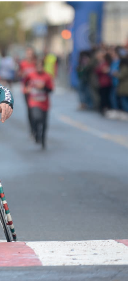
erki aritu dira denak. TXINTXARRI