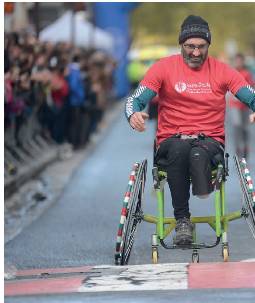
Ostadar Inklusioa kirol saileko hainbat kirolari ere animatu dira Korrika Festan parte hartzera. Ede