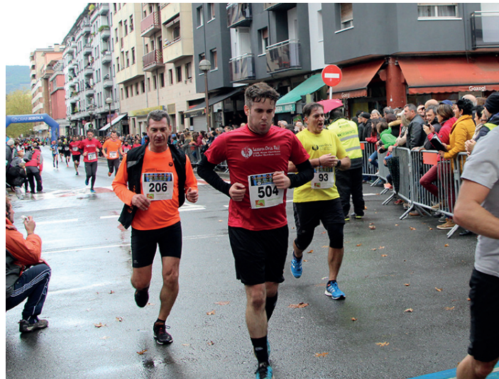
Kosta zait krosa bukatzea. Nire aurpegiak argi erakusten du. TXINTXARRI

Burua, hankak baino bizkorrago Sarritan azkarrago joaten da burua hankak baino. Hori uste dut nik behintzat. Hirugarren kilometroan gustura ari nintzen, eta ia ohartu gabe erritmoa bizkortu dut. Berehala konturatu