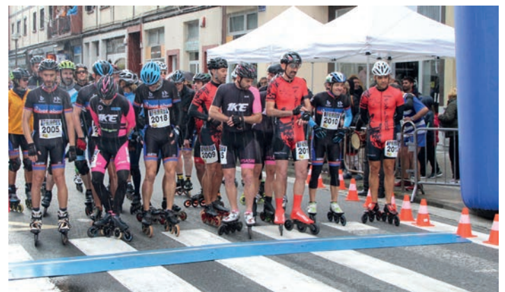
Patinatzaileak, irteeran.