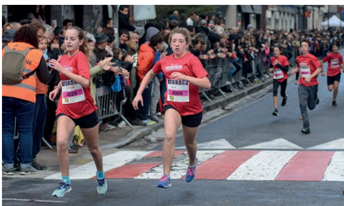
Infantil mailako lasterkariak bi itzuli eman dituzte. TXINTXARRI