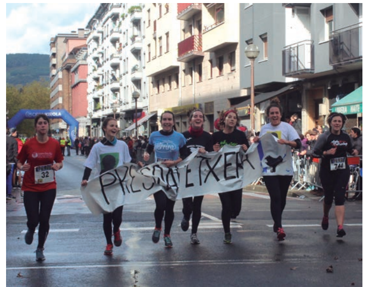
Urtero moduan presoan aldeko aldarria egin dute herritarrek krosean. TXINTXARRI

Argazki eta bideo gehiago ikusteko aukera dago txintxarri.eus atarian