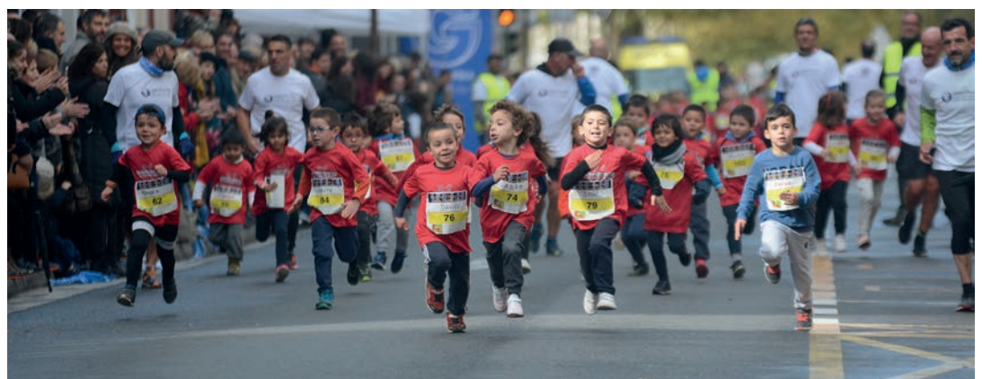
2013an jaiotakoak sei multzotan banatu dituzte antolatzaileek; ume askok eman dute izena Korrika Festan. TXINTXARRI