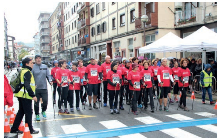
Azkenak irten ziren ipar martxalariak, kroseko elastikoa jantzita. TXINTXARRI