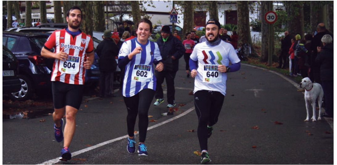
Realeko eta Athleticeko zaleak ere ikusi ahal izan dira krosean korrika. TXINTXARRI