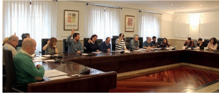
PSE-EEK bakarrik bozkatu du ordenantza fiskalen alde. TXINTXARRI

Lehenik, udalak zehaztutako birziklapen kopurura iritsi beharko da Lasarte-Oria: 2018an %46; 2019an %48; eta 2020an %50. Hori lortuz gero, urtean zehar 40 aldiz edo hilabetean lau aldiz organikoaren edukiontzia erabiltzen duten herritarrek jasoko dute hobaria. Beherapena hurrengo urteko