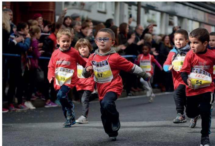
Den-dena eman dute gaztetxoek. TXINTXARRI