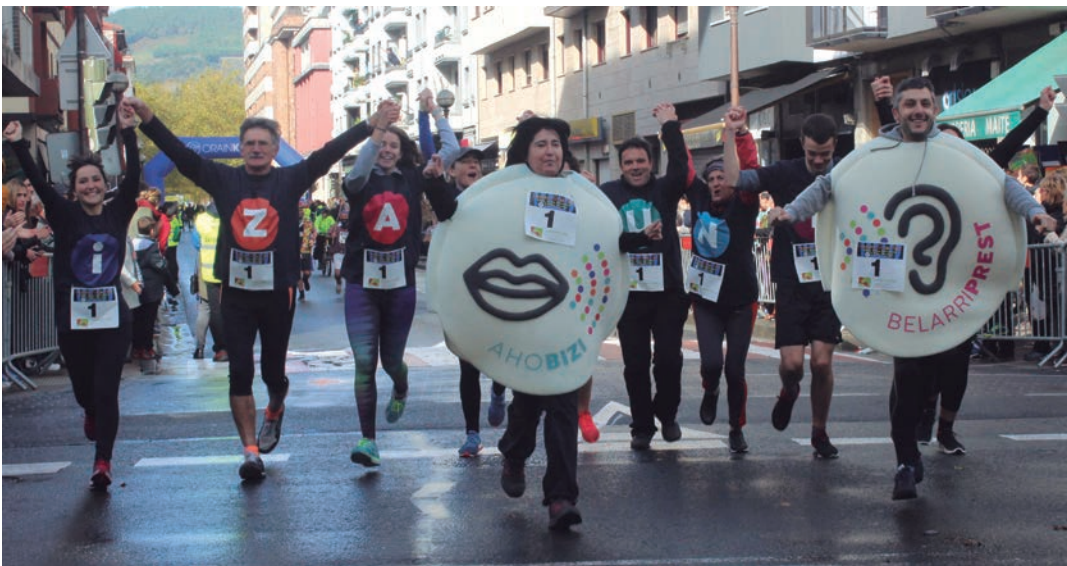
Euskaraldiko kideek lasterketako azken kilometroa elkarrekin egin dute. TXINTXARRI