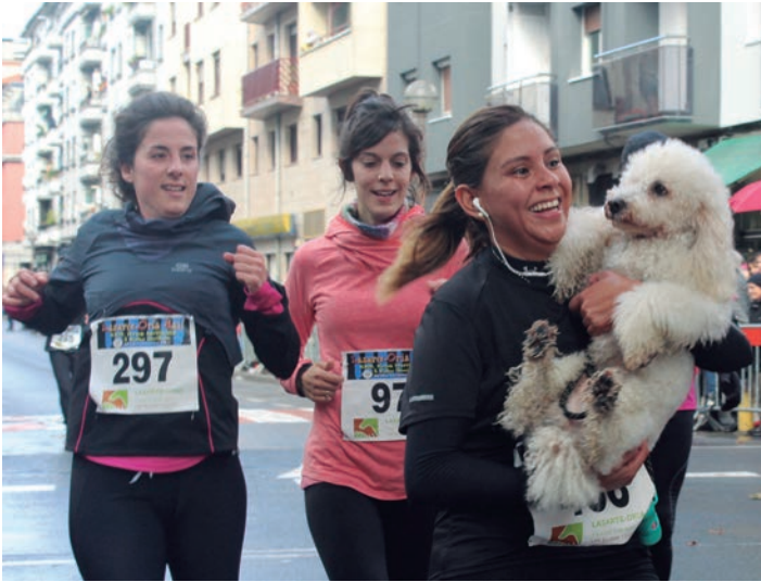
Txakurra besoetan hartuta iritsi zen helmugara kroseko lasterkari bat. TXINTXARRI