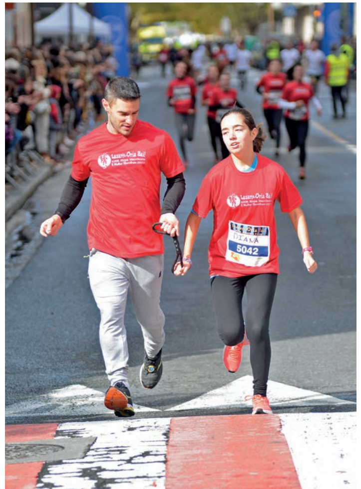
Ez dago oztoporik Korrika Festan lasterka egiteko. TXINTXARRI