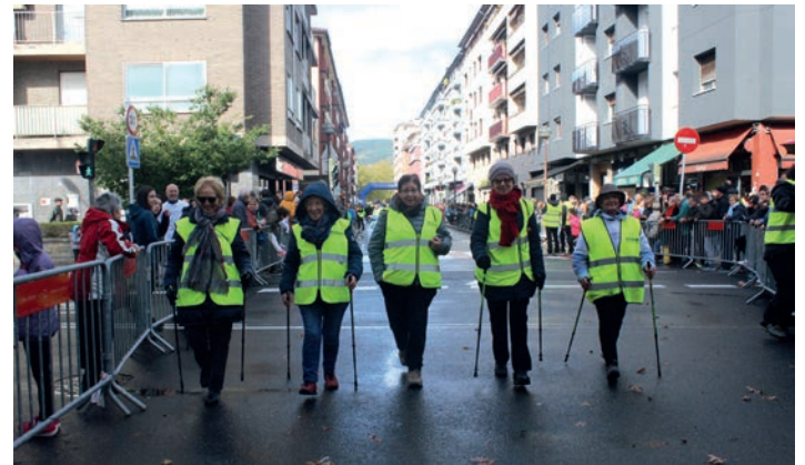
Boluntarioak, helmugara iristen. TXINTXARRI

Patinatzaileen lasterketa egonkortzeko urtea behar zuen aurtengo bigarren edizioak, baina eguraldiak ez du asko lagundu. Roller gutxiago atera dira, ziurrenik errepide bustiak uxatuta. Edonola ere, lehia polita izan dute; azken esprintean erabaki da lasterketa. Horrez gain, ez da ezbeharrik izan, eroriko larririk gabe helmugaratu baitira denak.