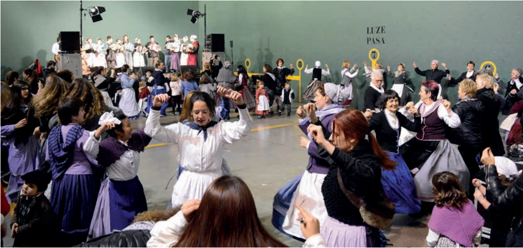
Nahiz eta eguraldi txarra egin, iaz herritar ugari hurbildu zen Loidibarreneko pilotalekura, Euskal Jaia ospatzera.