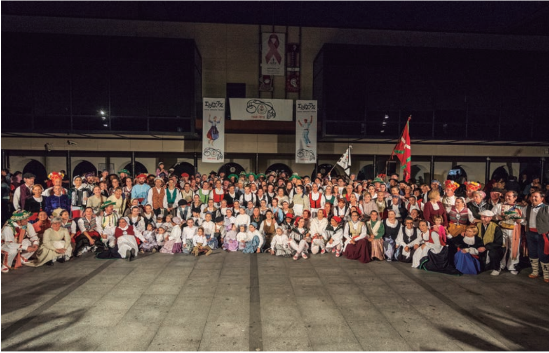
Talde argazki erraldoia atera zuten larunbat arratsaldeko ekintzetan parte hartu zuten herritarrek.