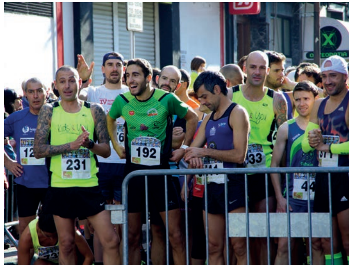
Lasarte-Oriako lasterkariak, iaz, irteeran. TXINTXARRI

Entrenamendu guztiak amaituta, iganderako atsedena hartzea besterik ez zaie geratzen korrikalari eta patinatzaileei. Askok azken unera arte utzi dute izen ematea, ziurrenik eguraldi iragarpenei begira. Orain artekoak ez dira oso baikorrak: hotza egingo du, hamar gradutik behera. Euria egiteko arrisku txikia ere badago. Edonola ere, asteazken gauerako 500 bat pertsonak eman zuten izena dagoeneko, gehienak herrikoak bertakoak. Halere, azken unera arte badago aukera dortsala eskuratzeko: gaur Manuel Lekuona kultur etxean