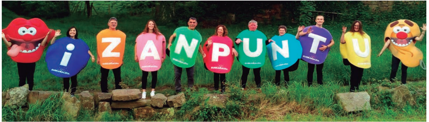
Lasarte-Oriako hamaikakoteko ideak puntuak soinean dituztela. LASARTE-ORIAKO EUSKARALDIA

Dinamizazioak berebiziko garrantzia badu ere, lantaldearekin batera egindako lana da. "Giro ezinhobea sortu