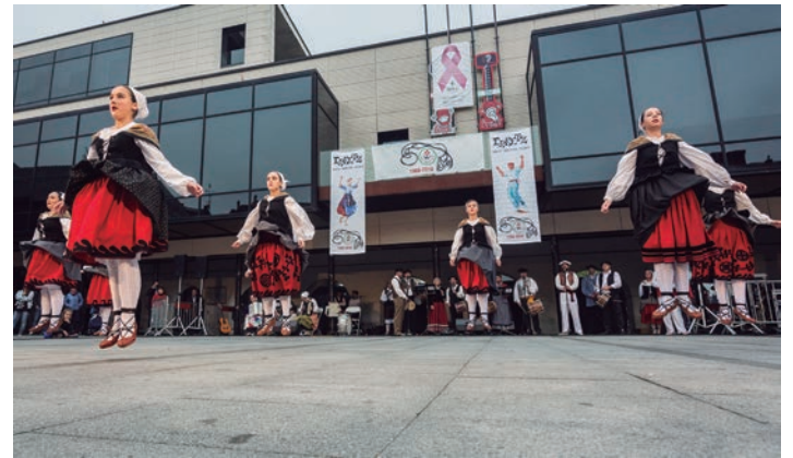
Agurra dantzatzu ekin zioten larunbateko dantza emanaldiari.

gaineak eta Txulalai dantzatu zituzten Erketz Txikiko neska-mutilek. Ondoren, helduen txanda berriro: Gipuzkoako alpagata eta brokel-dantza, Behe Nafarroako ingurutxoa, Jaurrieta, Eltziego, Ttun-ttun, Leitzako ingurutxoa, Lapurdi eta Gasteiz. Arin-arina, fandangoa eta kalejira ere dantzatu zituzten, bukatzeko. Okendon zeuden hainbat ikus-entzule ere animatu ziren plaza erdira irtetera.