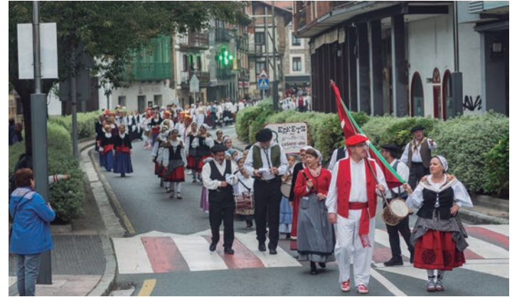
Besteak beste, Kale Nagusian ibili ziren desfilearen. TXINTXARRI

Bertan emanaldia egin zuten dantza taldeko belaunaldiek. Agurraren ostean, harrobiko dantzariak hartu zuten lekukoa: Baztango esku-dantza, Mahai