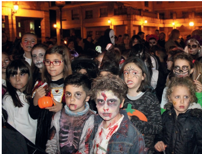
Arima galdu ugari bildu zen iaz Caddie plazan Halloween festan. TXINTXARRI

Arratsaldeko 18:00etatik aurrera, haurren gozameneko photocall, musika eta jokuak izango dira Caddie plazan. Honez gain, Trick or treat egingo dute auzoan zehar. Hainbat ezusteko ere izango dira, antolatzaileek azaldu dutenez: "Iazko ospakizunaren antzekoa