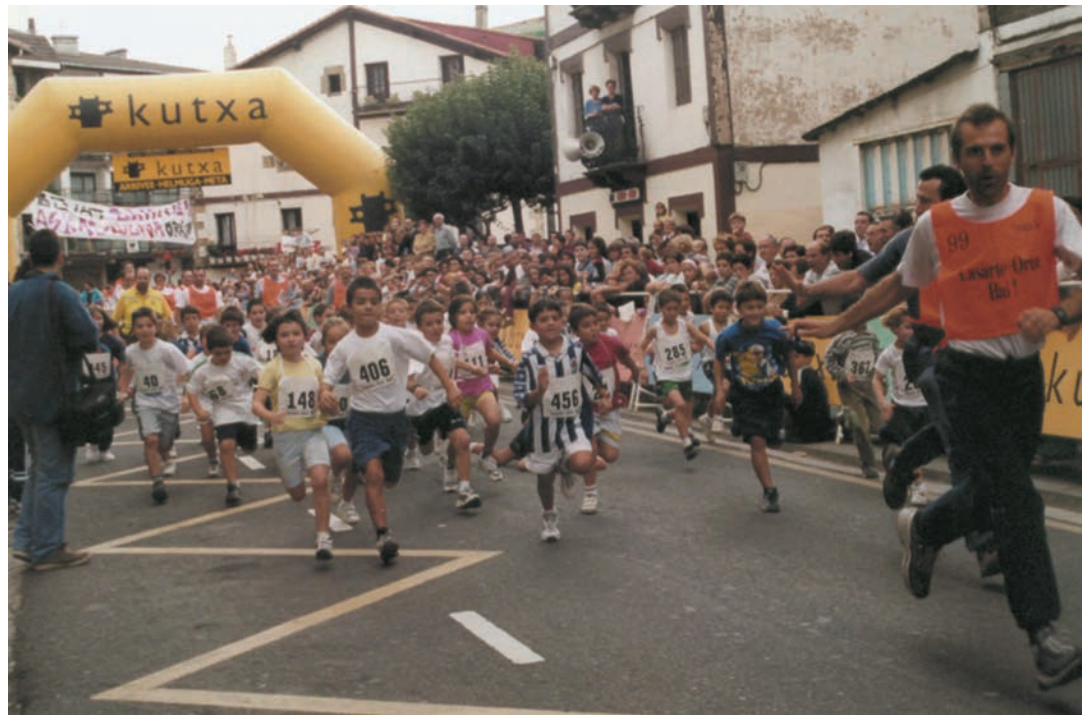
Lehen Korrika Festako irteera, 2001. urtean. TXINTXARRI

Ordulariari asko ez dio begiratzen Mujikak. "San Silvestre bat edo beste, baina ez dut beste lasterketarik egiten. Futbolearen ostadarren ibiltzen nintzen". Urtean entrenatutakoaren arabera, desberdin heltzen dio erronkari. "Hobeto baldin banago, gehiago saiatzen naiz estutzen. Baina beste urte batzuetan buelta suabe egiten dut. Aurten ere halaxe tokatzen zait; ez dut gehiegi entrenatu".