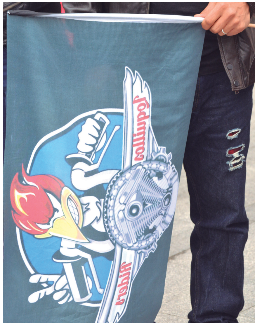
Loquillo Ridersen urteurrena izanik, taldearen zenbait bandera eta irudi ikusi ahal izan ziren.

Esan bezala, goizeko hamaiketan hasi dira orroka berriro motorrak. Kilometro-kontagailua martxan jarri, kaskoak ongi lotu eta errepidera atera dira motorzaleak. Andoainera joan dira, eta pare bat orduko ibilbidea egin ostean, herrira itzuli dira berriro. Buelta bat eman dute, eta Mendi Kafe Rock tabernan poteatu. Talde argazkia ere atera dute bertan, giro ederrean. Okendo plazan bazkaldu, eta euren depositoak gasolinaz bete dituzte, arratsaldeko eta gaueko ekitaldiei aurre egiteko. Bien bitartean, gaztetxoek ederki pasa dute puzgarrietan saltoka. Horiei ez zaie depositoa inoiz husten.