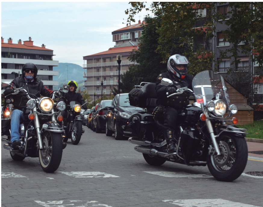
Sasoeta auzoko 2KN kafetegi paretik eman zioten hasiera ibilbideari motorzaleek. TXINTXARRI