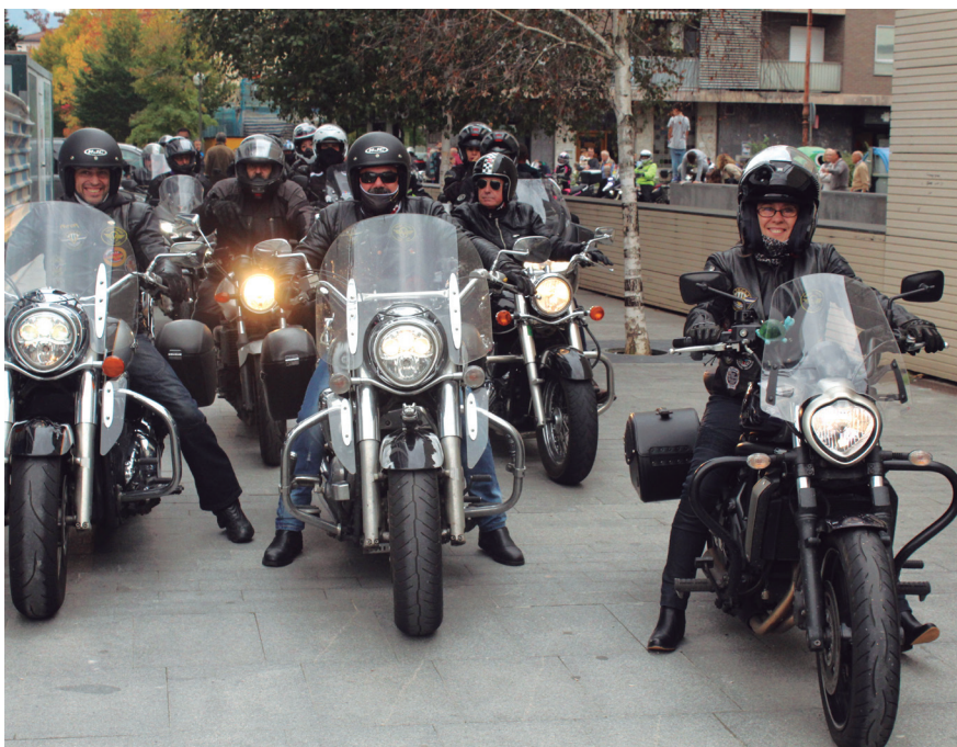
Hainbat motorzale, herritik barrena ibilbidea egin ostean, Okendora iritsi ziren unean. TXINTXARRI