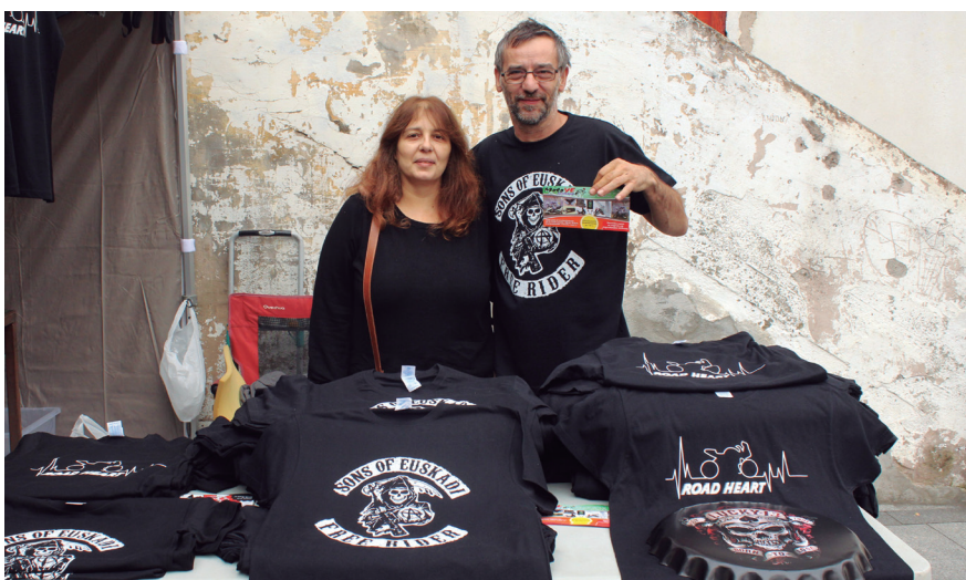
Okendora gerturatu zirenek kamisetak erosteko aukera ere izan zuten, bertan motorzaleek jarritako postuan. TXINTXARRI

Motorren burrunbek esnatu zuten larunbatean Lasarte-Oria. 2016an irten zen tailerretik Loquillo Riders motorzale elkarteak; badarama urtebete errepideetan, eta urtemuga ospatze aldera, egun osoko egitarauaz gozatu zuten Okendo plazan eta inguruetan. Zitzu bizian igaro da larunbata, baina festara batu direnei gasolina ugari geratzen zaie gorputzetan oraindik.