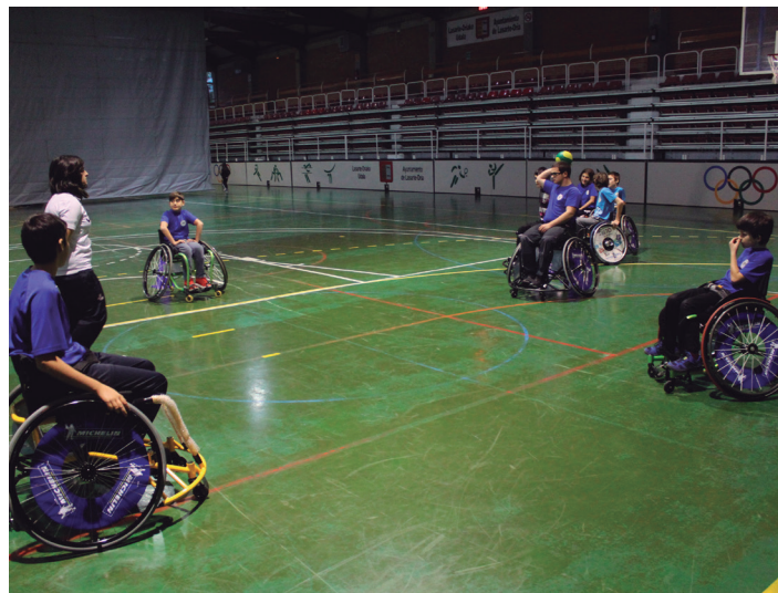
Ostadarreko taldekideak, asteazkeneko entrenamenduan.