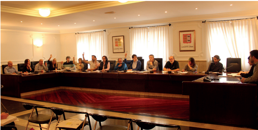
PSE-EEko zinegotzien bozei esker, aurrera ater dira ordenantza fiskalak. TXINTXARRI