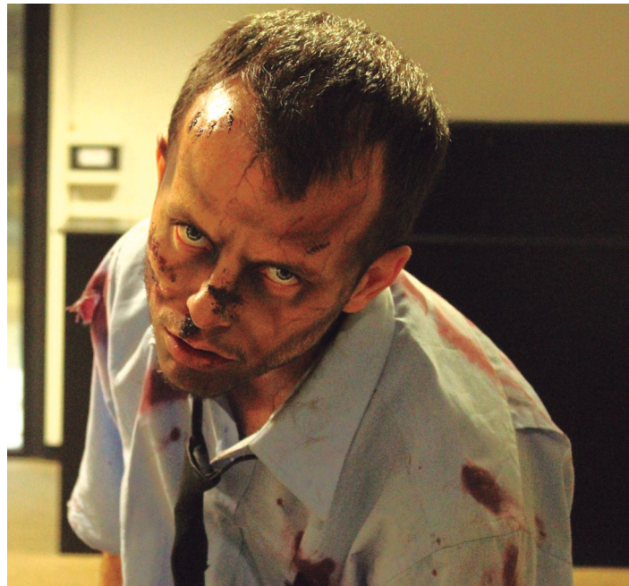
Gisa honetako zombiek parte hartuko dute Survival Zombie jokoa. TXINTXARRI

Zombiak ez direnek, berriz, lepoko berdea eramango dute, eta ihesean arituko dira uneoro. Jokuan zehar zenbait proba gainditu beharko dituzte, amaieran zombiek Lasarte-Oria zergatik kutsatu duten jakin ahal izateko. Baina zeregina ez da arrisku gabea: zombiak aurkituko dituzte bidean, eta horien kutsadura ekiditea lortu beharko dute.