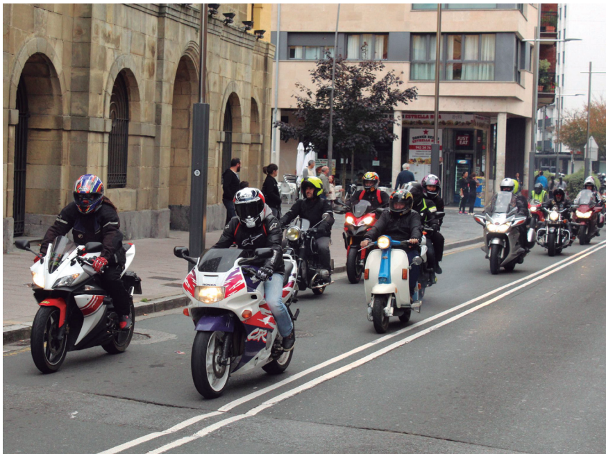
Motor ibilbidea Kale Nagusitik igaro zen unea. Moto ilara luzea osatu zuten errepideetan barrena. TXINTXARRI