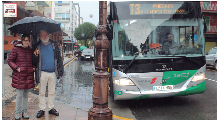
EH Bilduko zinegotziak Biyak Bat egoitza aurreko autobus geltokian.

"2011-2015 legealdian, alderdi sozialistak oposizioan behin eta berriz galdetzen zuten parkeen mantentze lanei buruz. Gaur, 2017ko azaroan, gero eta kexa gehiago jasotzen ari gara". Antxordokiren