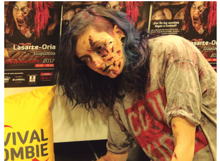
Zombiengandik ihes egin beharko dute parte hartzaileek kutsadura ekiditeko. TXINTXARRI

Hasiera, Michelingo frontoian Dagoeneko 476 pertsonak eman dute izena, eta egunerako 1.000 parte hartzaile espero dituzte. Antolatzaileek jakitera eman