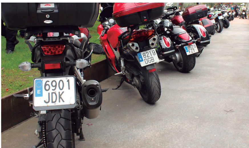
Behin ibilbidea amaituta, moto ilara luzea ikus zitekeen Askatasunaren parkean.