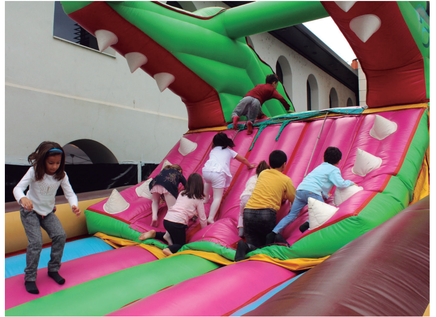
Urteurren festara gerturatu ziren gaztetxoek puzgarrietan ibiltzeko aukera izan zuten. TXINTXARRI

Loquillo Riders-en urteurren ospakizuna, iruditlan