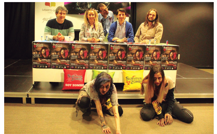
Iragan ostegunean egin zuten Survival Zombie rol jokoa aurkezpena. TXINTXARRI

dutenez, Bilbo eta Gasteizetik autobusak antolatu dituzte Lasarte-Oriara etortzeko.