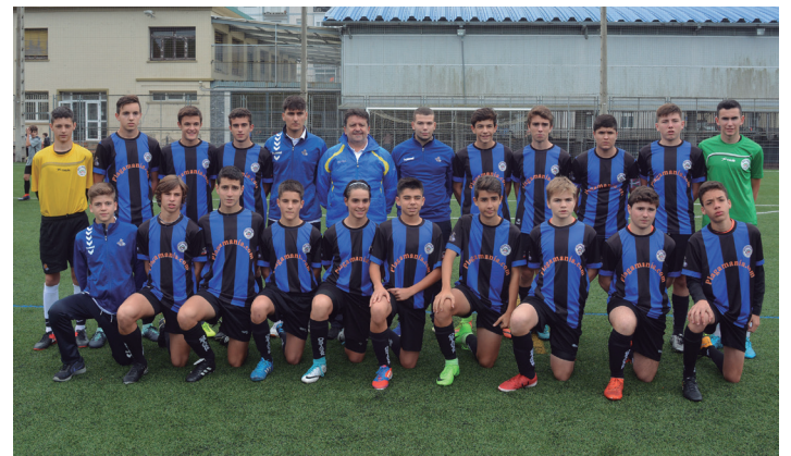
Denboraldi paregabea ari dira egiten Ohorezko Mailako kadeteak. TXINTXARRI

Esku-eskura eduki du garaipena Erregional Preferenteak, baina partiduko azken jokaldian sartu du 3-3koa Oiartzunek. Puntu banarekin konformatu behar izan dute bi taldeek. Saillapenaren behealdean dago taldea; lau puntu bildu ditu zortzi jardunalditan.