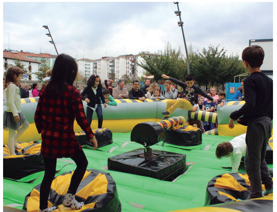
Etxeke gazteak Okendo plaza atzekaldean jarritako puzgarrietan jolasean. TXINTXARRI