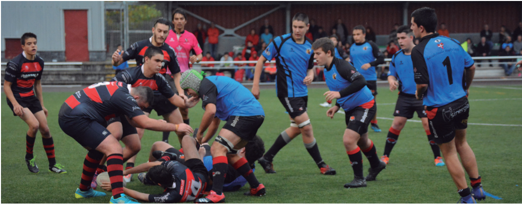
Aspaldiko partez, errugbi giroa arnastu da Michelinen, asteburuan. Irudian, 18 urtez azpiko hainbat jokalar, lehian. TXINTXARRI