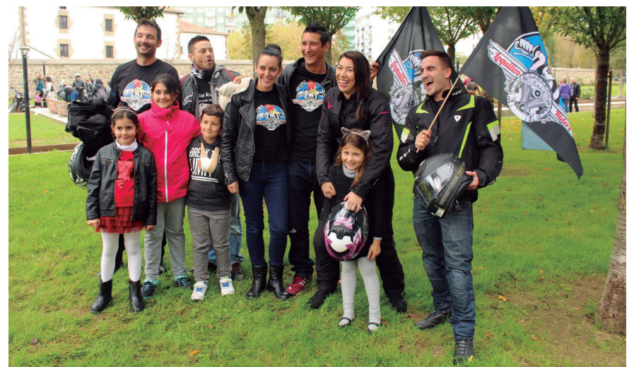
Loquillo Rider motorzale taldeko kideak pozik lehen urteurreneko ospakizun egunean. TXINTXARRI