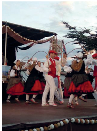
Erketz EDTko lagunak jaialdian. ERKETZ

A Coruñaiko bi dantza talde eta Suanceseko Nuestra Señora de Las Lindes y del Carmen taldearekin batera parte hartu zuen Erketzek jaialdian. Lasarte-Oriako taldeak bi agerraldi egin zituen: batean Agurra, Desafioa, Arku-dantza,