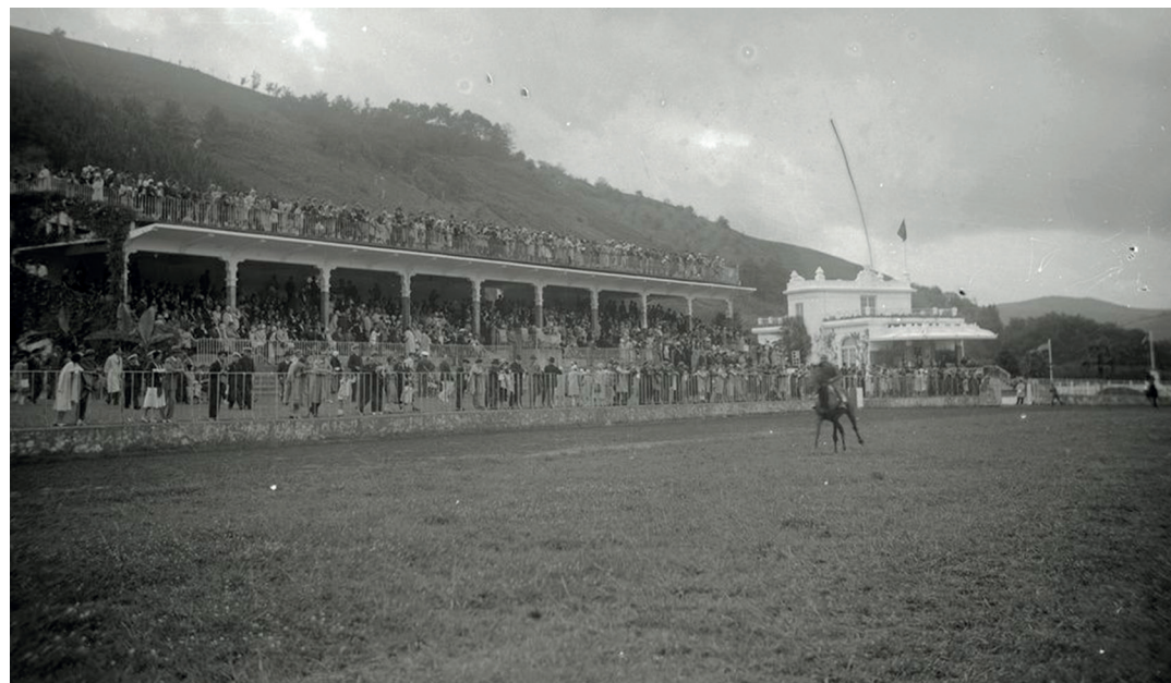
Gipuzkoa, Espainia eta nazioartetik etortzen ziren zaldi lasterketak ikustera.