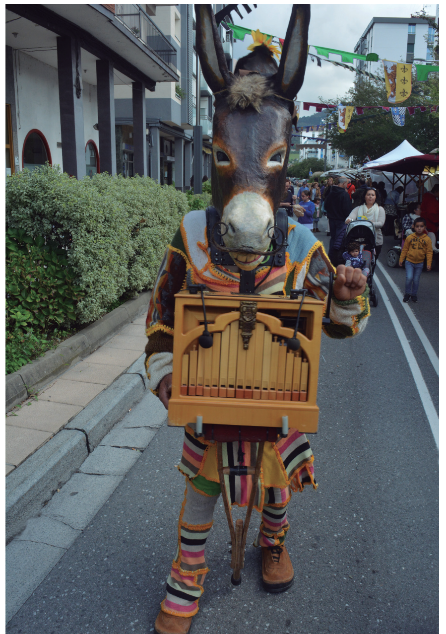
Koloretako arropak soinean zituen asto bat ere ibili zen azoka ingurua girotzen. TXINTXARRI