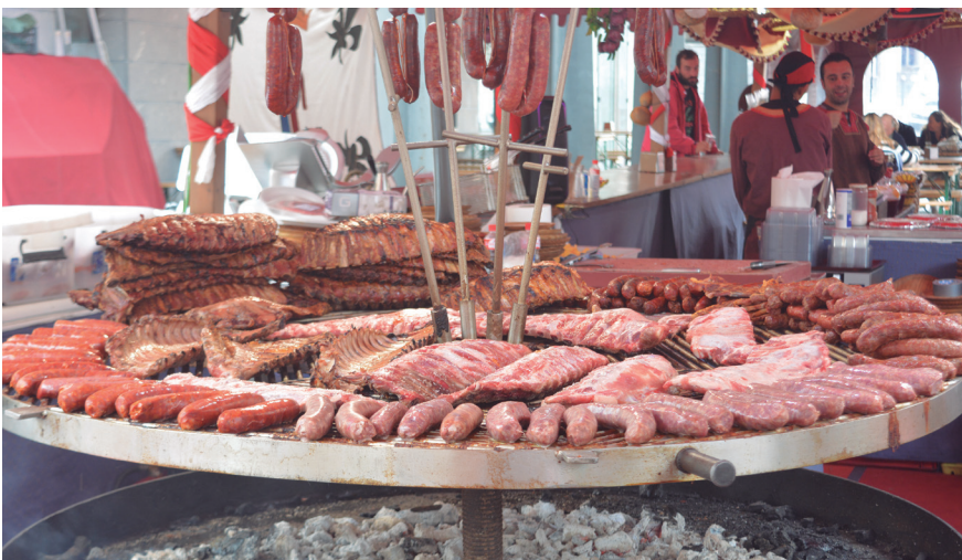
Hainbat jaki dastatzeko askotariko postuak ere izan ziren Lasarte-Oriako kaleetan. TXINTXARRI