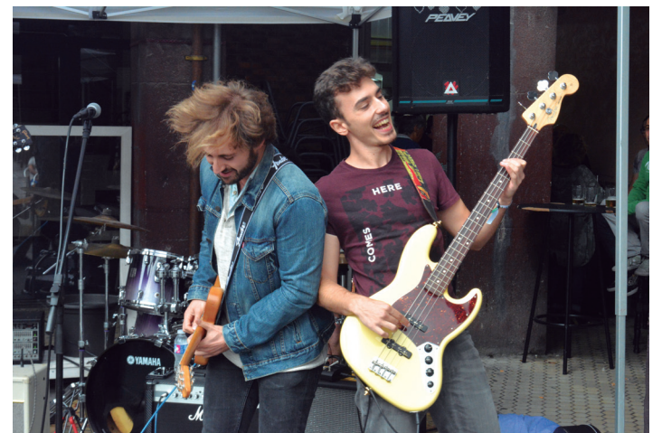
Bi musikari gitarra jotzen, Lasarte-Oriako kontzertuen unean. TXINTXARRI