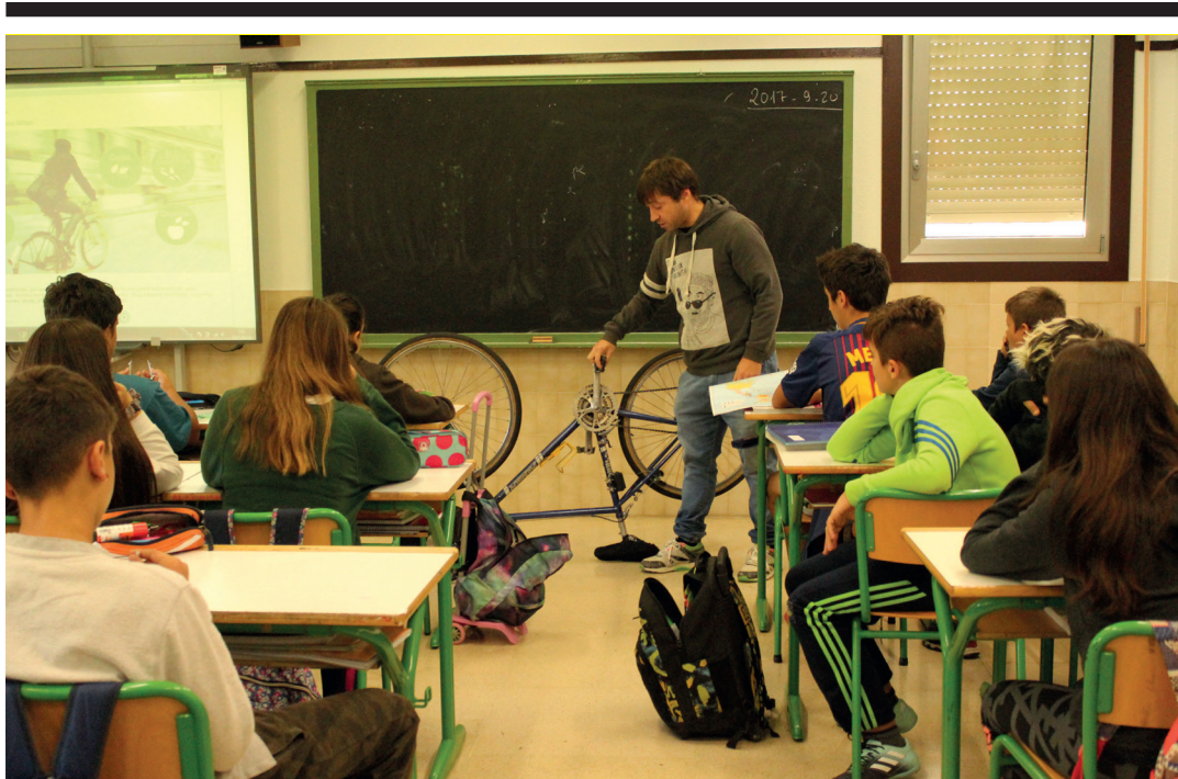
Artelatze Zigor Lamprek bizikleta eta bidegorriari buruzko saioak eskaini dizkie Oriarte ikastetxeko DBH2ko ikasleei.