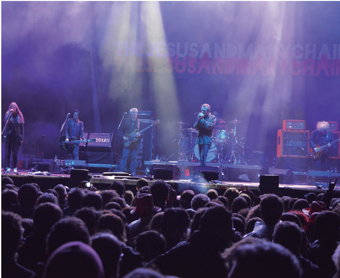
Eguraldiak batere lagundu ez bazuen ere, jende ugari gerturatu zen hipodromora, bertako musika emanaldiez gozatzera. TXINTXARRI