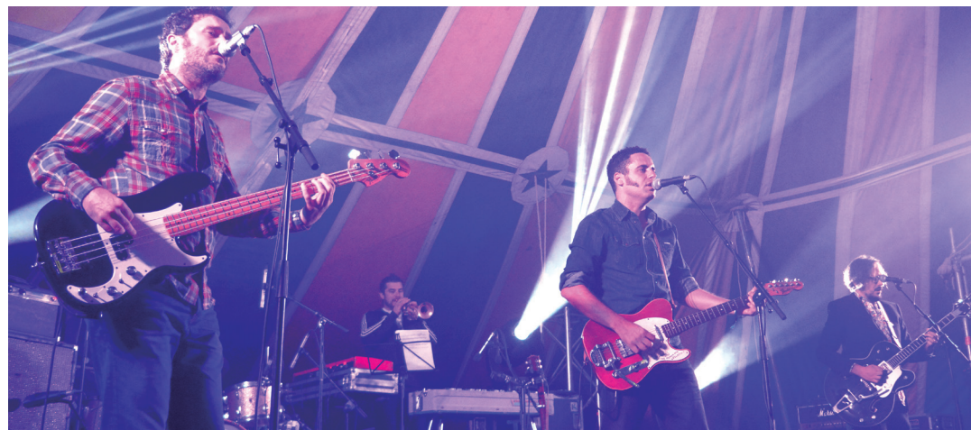
Jatorri eta estilo askotariko musika talde ugari aritu ziren hipodromoko agertokietan. TXINTXARRI