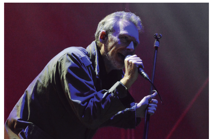
The Jesus and Mary Chain taldeak ikusle ugari erakarri zituen jaialdira. TXINTXARRI