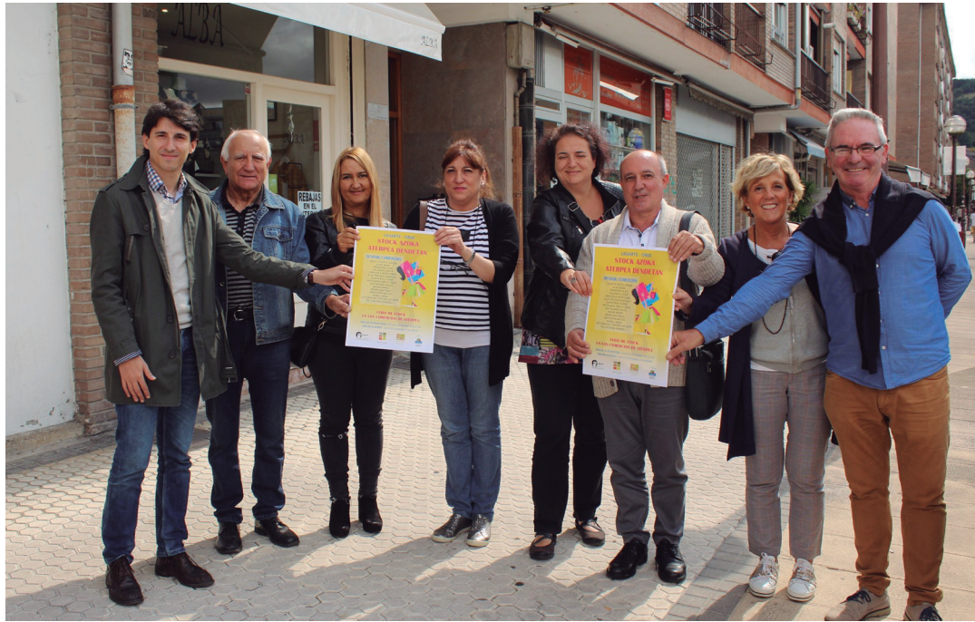
Aterpea Merkatarien elkarteko kideak, udal ordezkariak lagunduta, astearteko prentsaurrekoan. TXINTXARRI