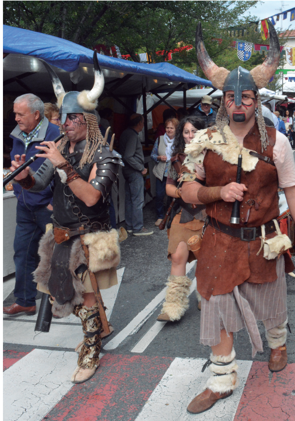
Azokara gerturatu zirenek musikaz ere gozatu ahal izan zuten. Haize instrumentuekin, eta danborrekin osatutako