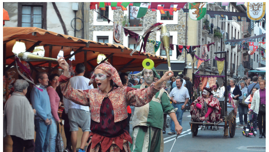
Kale antzerkiaren une bat, Kale Nagusian barrena. TXINTXARRI