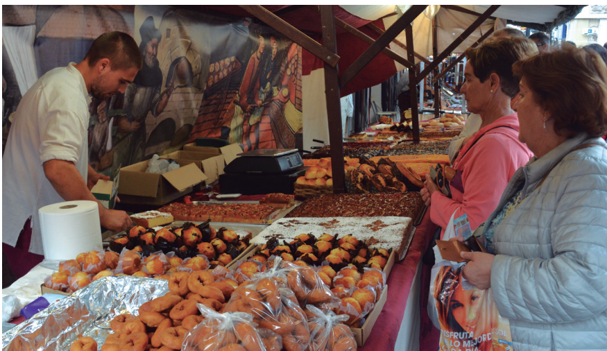
Erroskilak nola egiten zituzten ikusi ahal izan zuten bezeroek gozo postuetan. TXINTXARRI