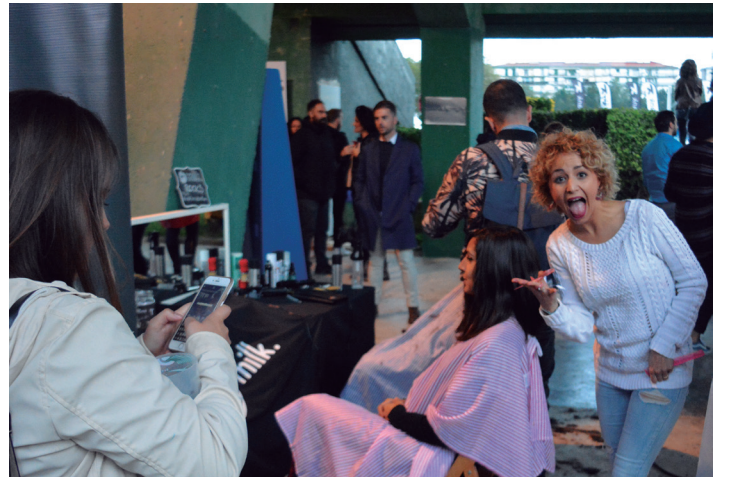
Musika emanaldiez gain, itxura aldatzeko postuak ere egon ziren jaialdian. TXINTXARRI

Herritar ugari animatu ziren kalera irten eta doinu zein pintxo desberdinak entzun eta dastatzera. Giro ederra sumatu zen egitasmoaren harira.