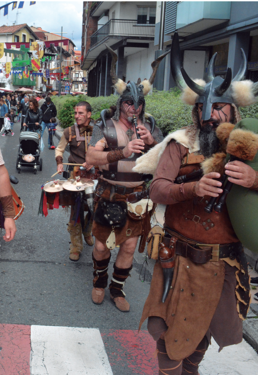
u zeltak gertutik entzun ahal izan ziren. TXINTXARRI