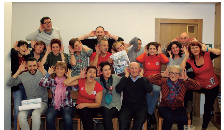
Iragan ikasturteko solaskideak, elkarrekin egindako ekintza batean. TXINTXARRI

Asteroko hitzorduez gain, hilabetean behin mintza praktika ere egiten dut kideek, elkar ezagutzeko. Gainera, harremanak estutzeko ekintza osagarriak antolatzen dira.