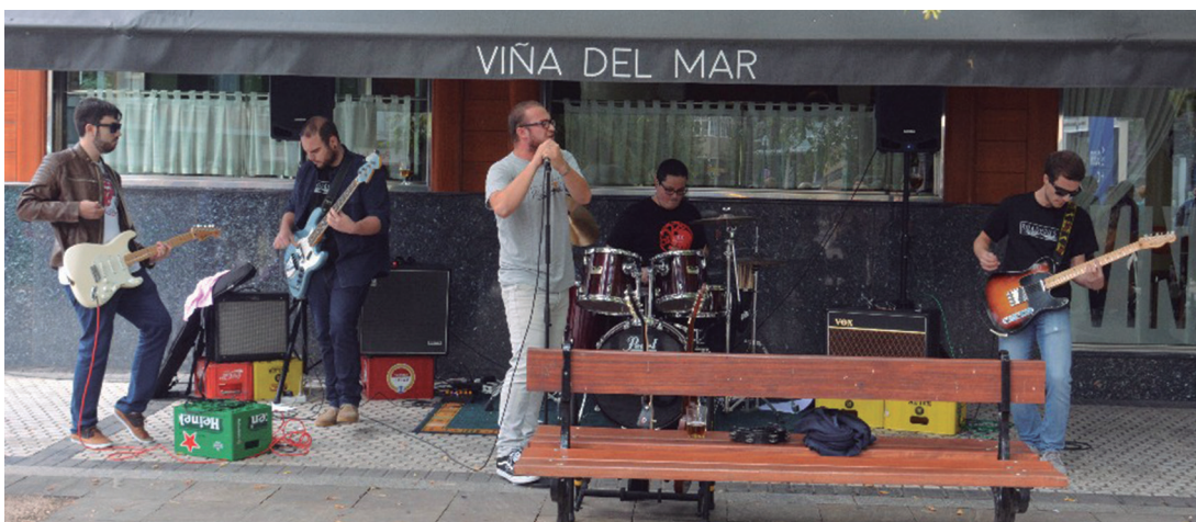
Roadhouse musika taldeak larunbatean eskaini zuen kontzertua, Aterpeak antolatutako pintxo musika egitasmoaren harira. TXINTXARRI