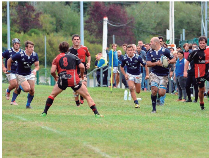
Babyauto Zarautzeko errugbilariak, defentsa lanetan Oviedoren aurka.

Nahiz eta Babyauto Zarautzek aurrera egiten saiatu, Oviedok eraso guztiak geratu zituen. Hala ere, metroak irabazten joan eta atsedenaldirako minutu baten faltan, Oviedoko jokalaria bat txartel horiaz 10 minuturako kanporatua izan zen. Ondorioz,