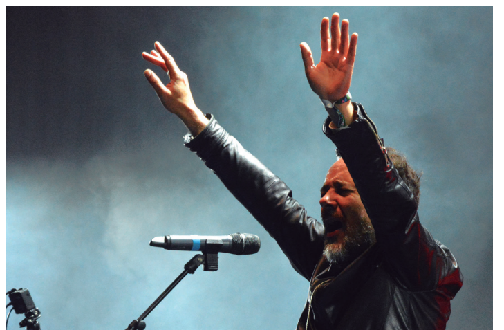
Gogo handiz eskaini zituzten emanaldiak aurtengo talde parte hartzaileek. TXINTXARRI