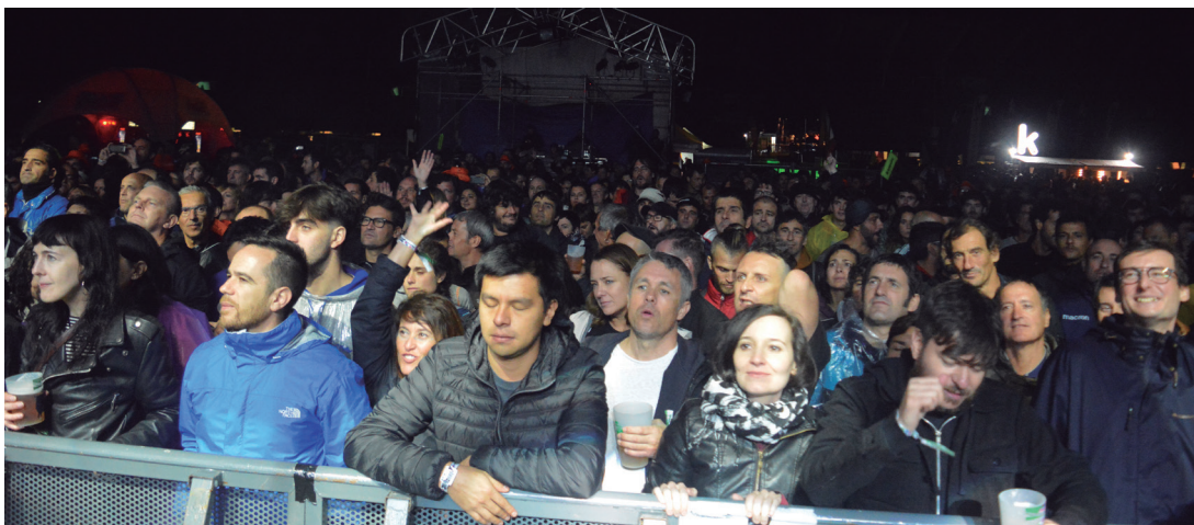
Musika zale ugari bildu ziren Kutxa Kultur jaialdiaren eremuan. TXINTXARRI