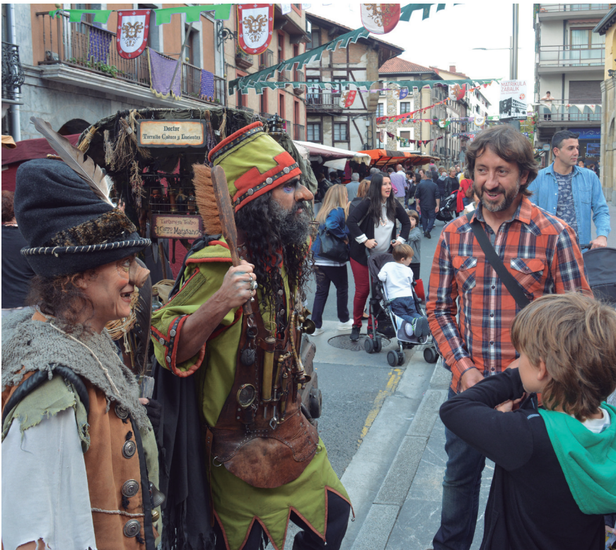
Kale ikuskizunak ikusi ahal izan zituzten azokara gerturatutakoek. TXINTXARRI