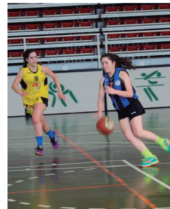
Iazko partida bat. TXINTXARRI

Beste hainbat emaitza ere utzi zituen saskibaloiak. Partizipazio kadete neskek jipoa jaso zuten Mutil Basketen partetik: 14-99.