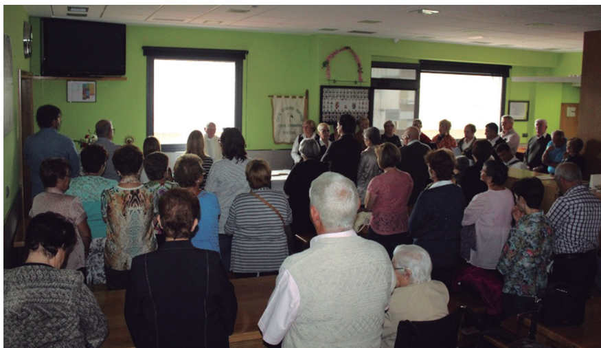
Urtero legez, Guadalupeko Ama Birjinaren omenez, meza egin zuten elkarteak. TXINTXARRI