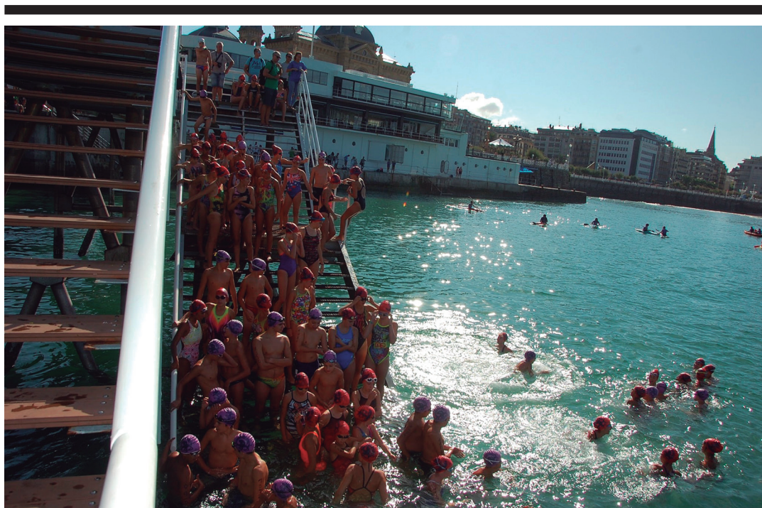
lazo zeharkaldiaren irudi bat. Aurten itsaso zakarra izan zute igerilariak. EASO IGERIKETA TALDEA