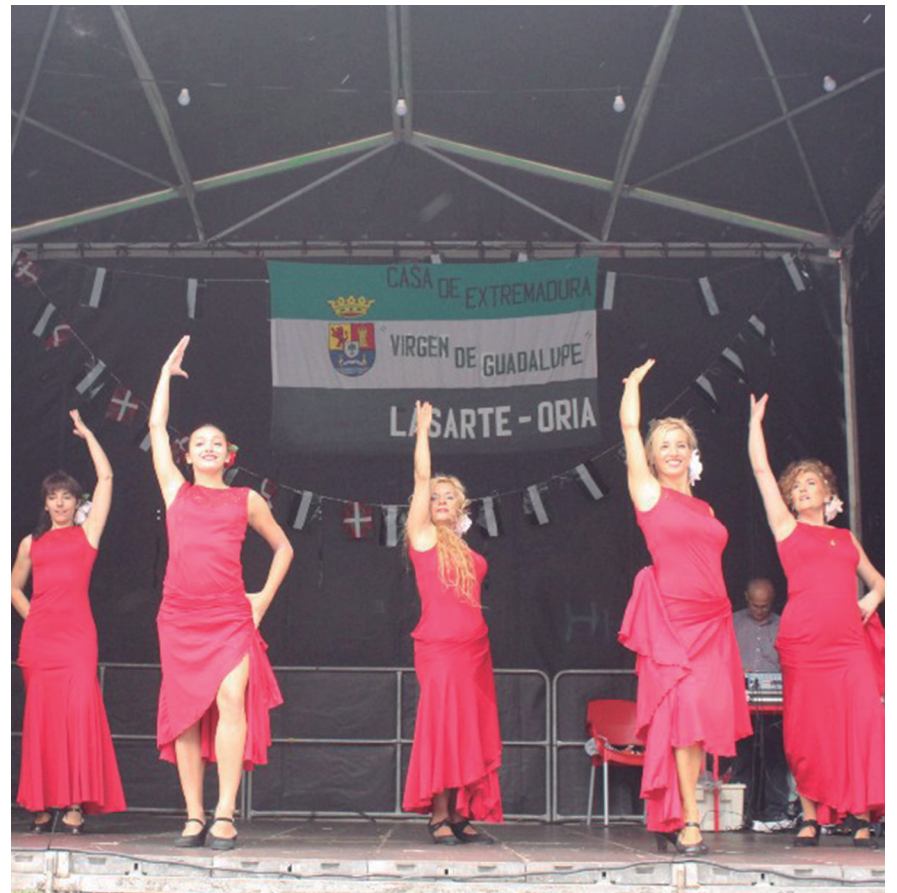
Beste zenbait taldeen artean, Lasarte-Oriako 'Zambra' taldeak dantza emanaldia eskaini zuen. TXINTXARRI