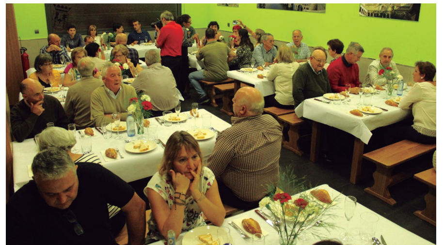
'Virgen de Guadalupe' elkarteko kideek afaria egin zuten unea. Udal ordezkariak ere bertan izan ziren.