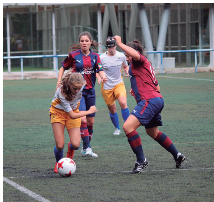
Añorgako jokalar bat, baloia babesten, eibartarren presiopean.

brontzeari esker lortu du Chourrautek Munduko Kopako bosgarren postua. Izan ere, Italiako proban ez zuen parte hartu. Pragakoa munduko zirkuituko lehen proba izan zen, eta hasi bezala bukatu du piraguistak txapelketa: podiumera igota. Baina Chourrautek dagoeneko burua Munduko Txapelketan du jarria. Iraila bukaeran jokatu da, Pauen, Frantzia. Kataluniako proba baliagarria izan zaio lehiaketan sartzeko.