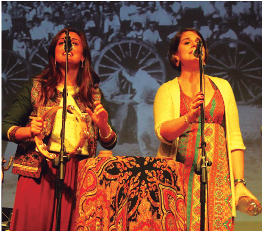
Askotariko musika doinu eta dantzak entzun eta ikusteko aukera izan zen.

Andaluziako doinuez gozatu ahal izan zuten, berriz, igande goizaldean. Eguerdian, Extremadurako eltzekaria jateko herri bazkaria egin zuten, eta arratsaldean, berriz, bola jokoa aritu ziren. Jai asteburuari amaiera emateko, Donostiako Extremadura etxeko 'Virgen de Guadalupe' koru eta dantza taldearen emanaldiaz gozatu ahal izan zen, eta bandera jaisierarekin bukatu zuten.