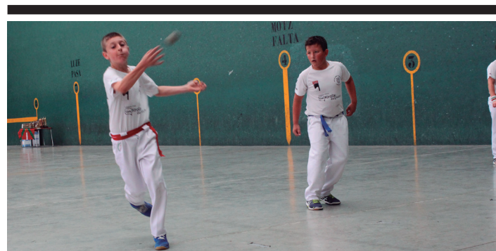
Sanpedroetako pilota jaialdia.

Denera 11 lasarteoriatarrek parte hartu dute. Kontxakoa proba aintzindaria da 1943. urtetik egiten dute.