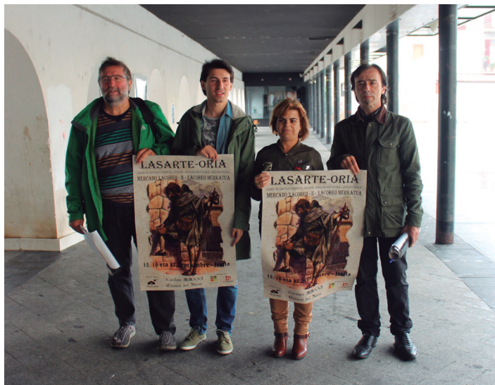
Azokaren sustatzaileak, aurkezpenean, joan den astelehenean. TXINTXARRI

Baina horrez gain, aisirako aukera ugari eskainiko ditu Done Jakue merkatuak. Carrasco