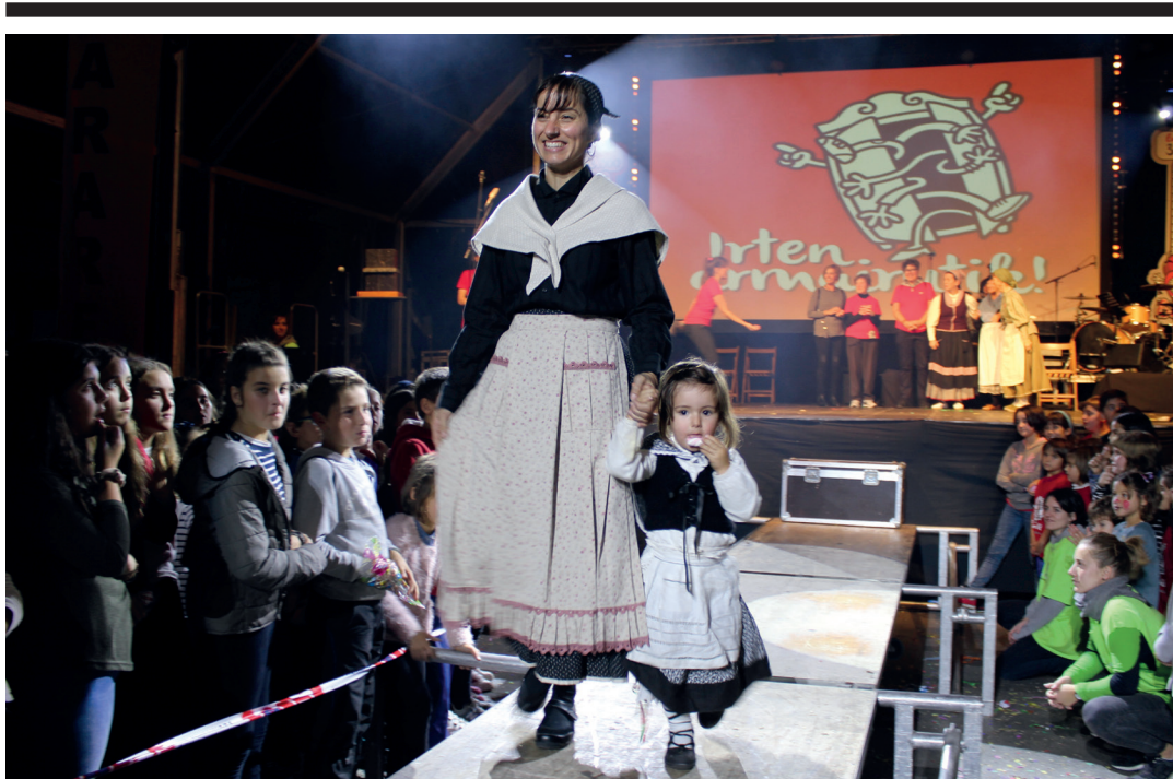
Euskal jantzien ikastaroko ikasleen erakusketa izan zen iaz Euskararen 9. Maratona. TXINTXARRI