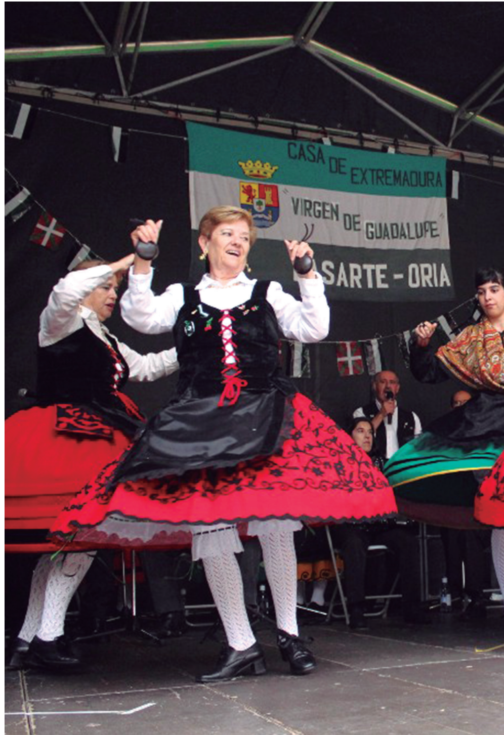
Extremadurako doinu eta dantza ugari abestu eta dantzatu zituzten Lasarte-Oriako 'Virgen de Guadalupe' elkarteak.