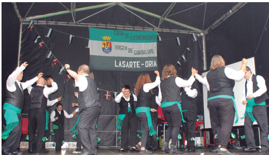
Jalguneko lagunek El carretín jota eskaini zieten plazan bildutako ikus-entzuleei. TXINTXARRI