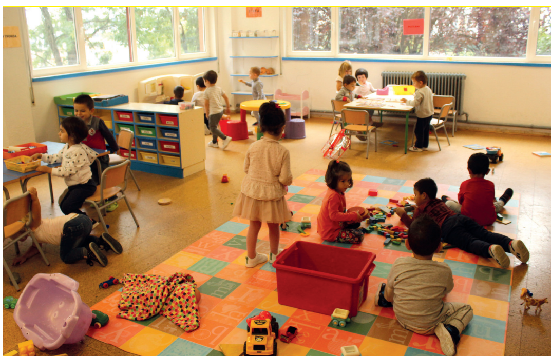
Ikasle txikiak gela berrietako txoko eta jostailu guztiak ikertu dituzte lehen egun hauetan. TXINTXARRI