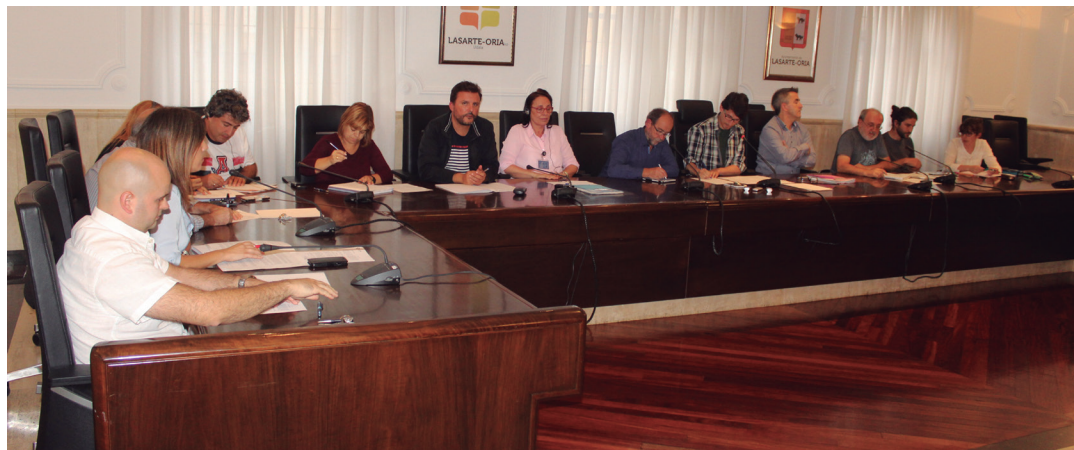
Udalbatzarreko zinegotziak, astearteko bilkuran. TXINTXARRI