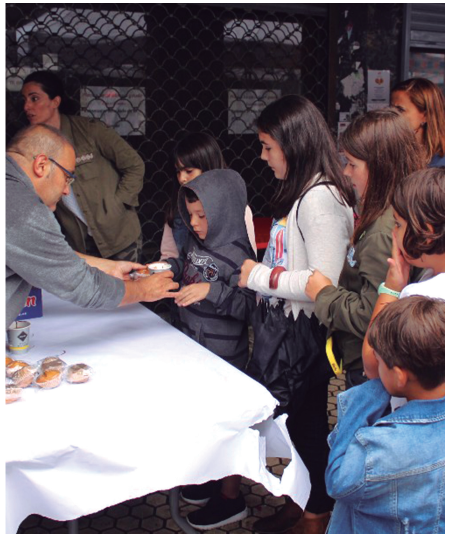
Haurrentzako zenbait ekintza ere antolatu zituzten; irudian txokolatada egin zen unea. TXINTXARRI