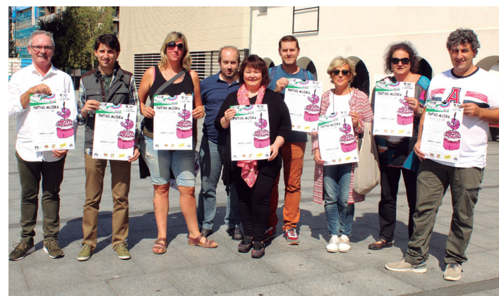
Herriko tabernariak Pintxo Musika ekimena aurkeztu zuten unean.

The Roadhouse (12:00etan, Ola kalean), Indian Feather (13:00etan, Jaizkibel plazan), eta Psychoacoustic (14:00etan, Landaberri DBH aurrean) taldeen kontzertuak izango dira.