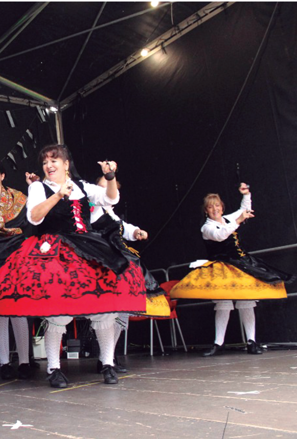
antolatutako ospakizun jaietan. TXINTXARRI