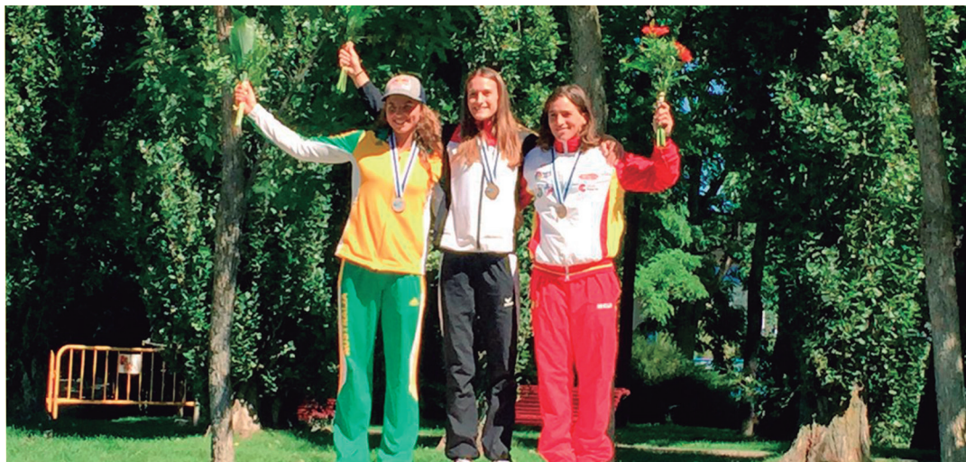
Jessica Fox, Ricarda Funk eta Maialen Chourraut.

Denbora onena lortu du lasarteoriatarrek, baina bi segunduko zigor batek aldendu du lehen postutik. Urrezko eta brontzezko bi dominekin, bosgarren postuan sailkatu da Munduko Kopan. Orain, hilaren bukaerako Munduko Txapelketan du arreta osoa