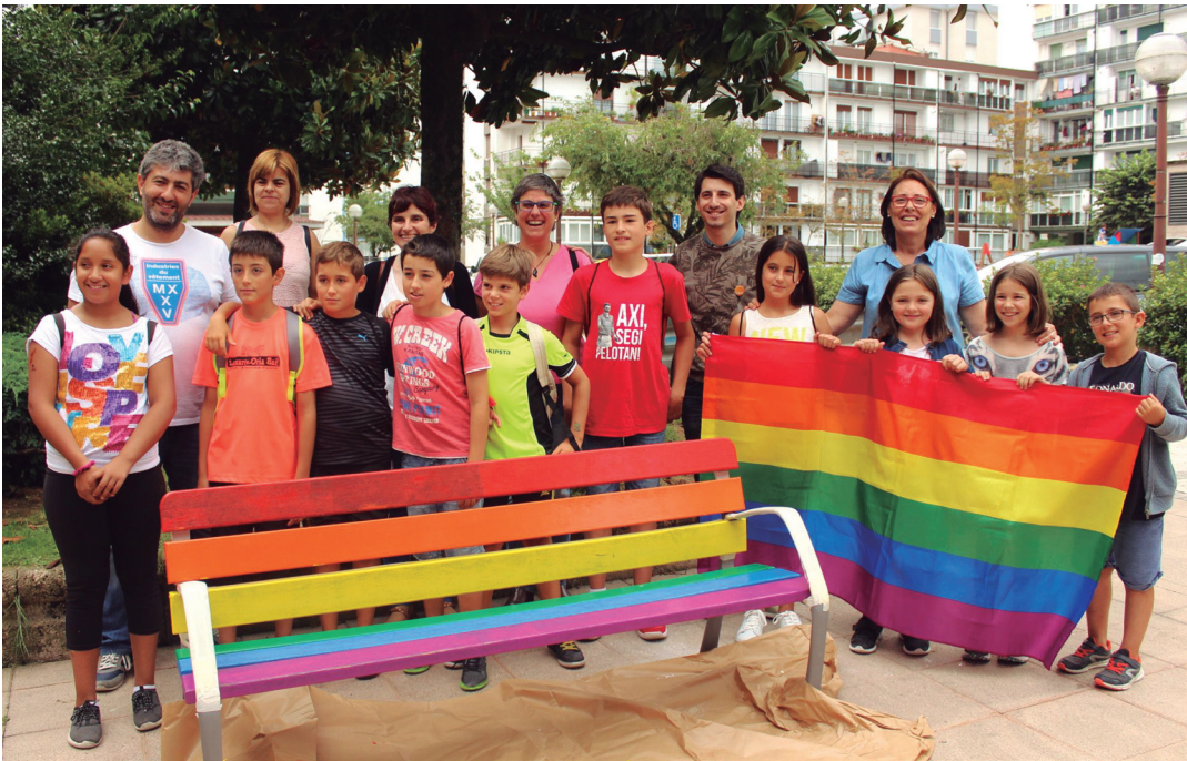
Txokotako gazteak udal ordezkariekin batera, Gambo plazan margotutako bankuaren aurrean. TXINTXARRI