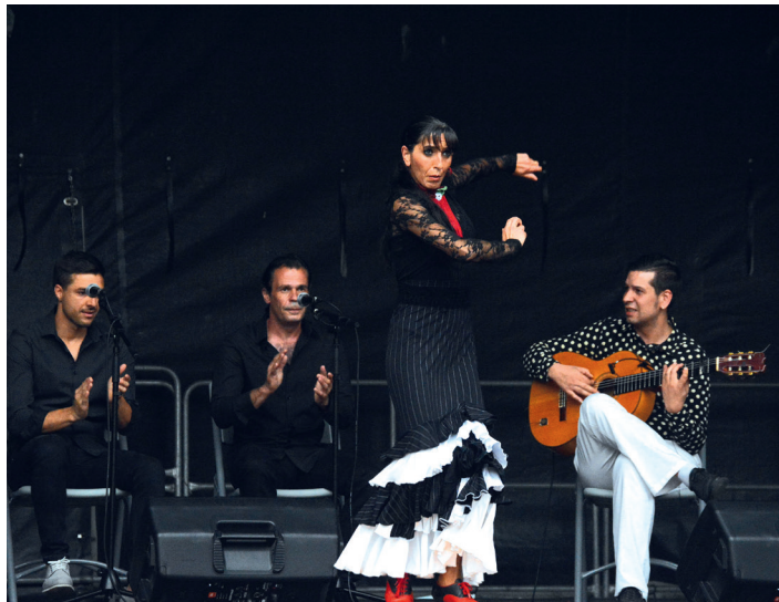
La Pulga eta Lagunak taldearen flamenko ikuskizuna, joan den astean. TXINTXARRI

Musikaz gainera, antzerkiak eta zinemaz ere gozatzeko aukera egongo da uztailean: Whiplash filma emango dute Okendo plazan uztailearen 20an. Hurrengo egunean, Hortzmuga taldeak Femmes antzezlanaz egingo du. Bestalde, Santa Ana egunean betiko azoka egingo dute, inguruko baserriko produktuekin. Eta, nola ez, Santa Ana parodia izango da ikusgai hilaren 26an.