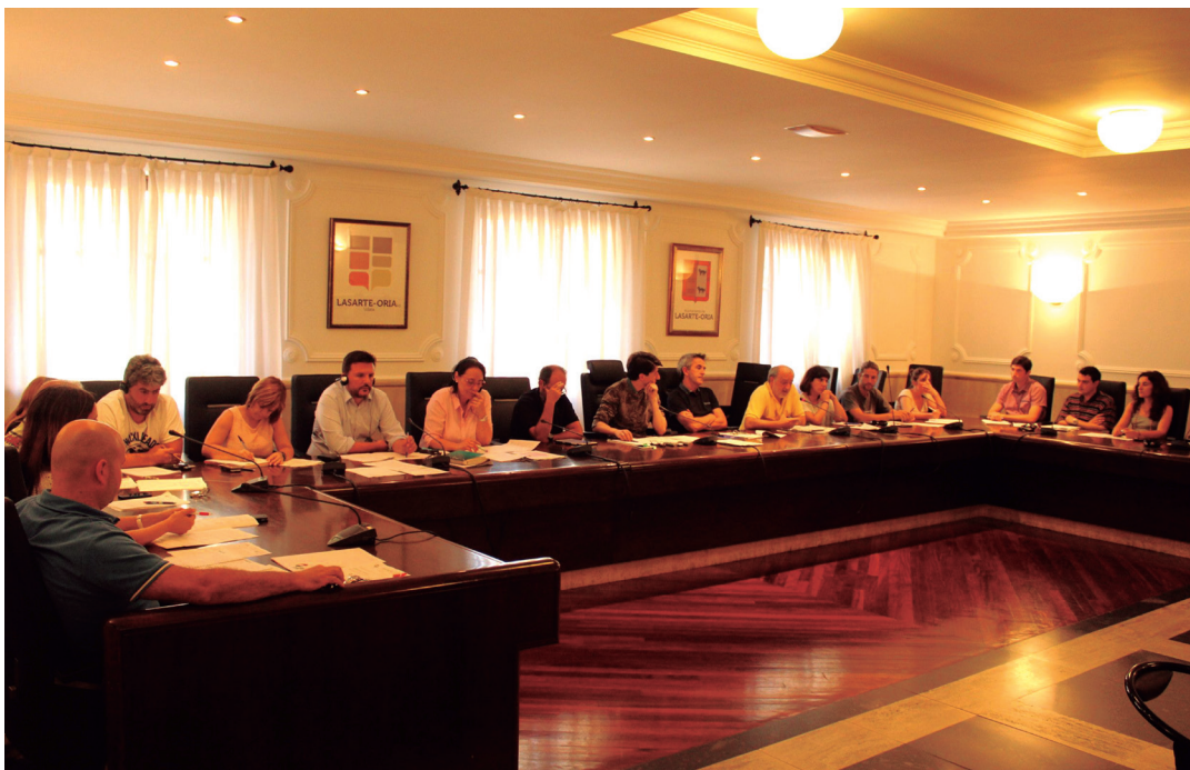
Udalbatzarrako kideak, joan den astearteko bilkuran. TXINTXARRI