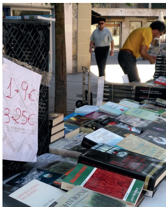
Azoka solidarioa Okendo plazan.

Herritarrek ere aukera baliatu dute udalbatzarrean parte hartzeko, eta Zataraingo obrak sortutako ezinegona plazaratu dute. San Frantziskoko bizilagun talde batek salatu duenez, uralita erabili dute lanetan, produktu kutsakorren trataerak eskatzen duen neurririk hartu gabe. Horretaz gain, ohartarazi dute transformadore handi bat etxebizitzetatik gertuegi dagoela. Udalak eraikuntza enpresaren txosten bat aurkeztu du, baina ez ditu bizilagunak asebate; "iruzurtzat" hartu dute.