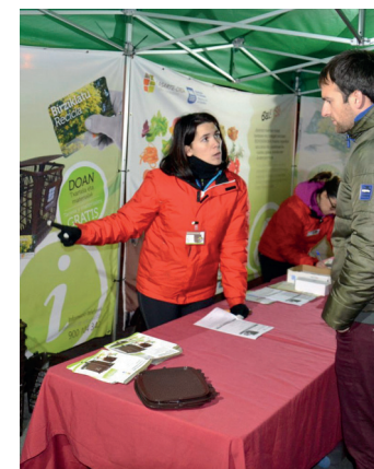
Edukiontzi marroiaren kanpaina. UDALA

Udaletik jakitera eman dutenez, izena emandako etxebizitza bakoitzeko 50 poltsa banatuko dituzte (bi pakete), eta horiek jasotzeko, txartela eraman beharko dute erabiltzaileek. Horrekin batera, NAN zenbakia eta izen-abizenak zein bizilekuaren helbidea jakinarazi beharko dituzte.