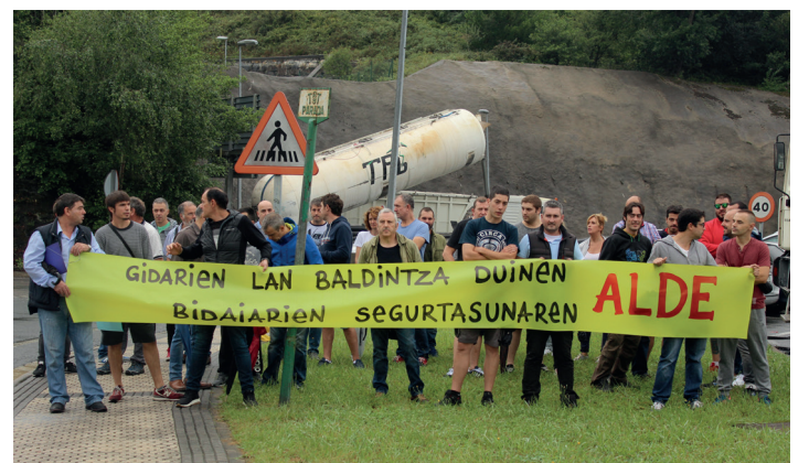
TSST-ko langileak astelehenean egindako elkarretaratzean. TXINTXARRI

Agerraldian bildutako LAB sindikatuko kideen arabera, istripua pasa eta ondoren hartutako neurrietan TSST enpresako "langileak ez dituztela aintzat hartu". Hori dela eta, salatu dute "gezurra dela hainbat hedabidetan agintari eta arduradun batzuek esandakoa".