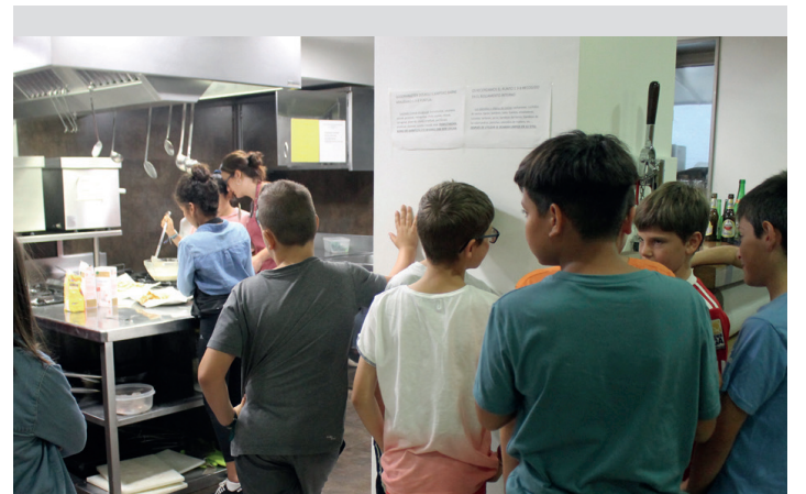
Jaki ezberdinak kozinatu zituzten txokotako herritar gazteek. TXINTXARRI

Sei kolore erabili zituzten horretarako, baina ez edozein. Aniztasunaren alde, homofobiaren kontra, ortzadarraren