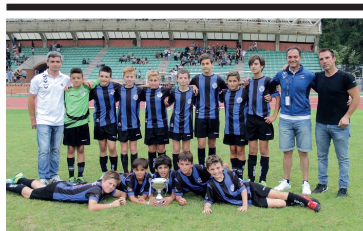
Kontsolazio fasean txapeldunorde geratu zen Ostadar. TXEMA VALLES

Oro har, denboraldi bikaina egin dute atleta lasarteoriatarrek. Bai herriko LOKE taldean aritzen direnek, baita kanpoko taldeekin lehiatzen dutenek ere. Gehienek bukatu dute, baina absolutu mailan lehiatuko dira batzuk oraindik ere.