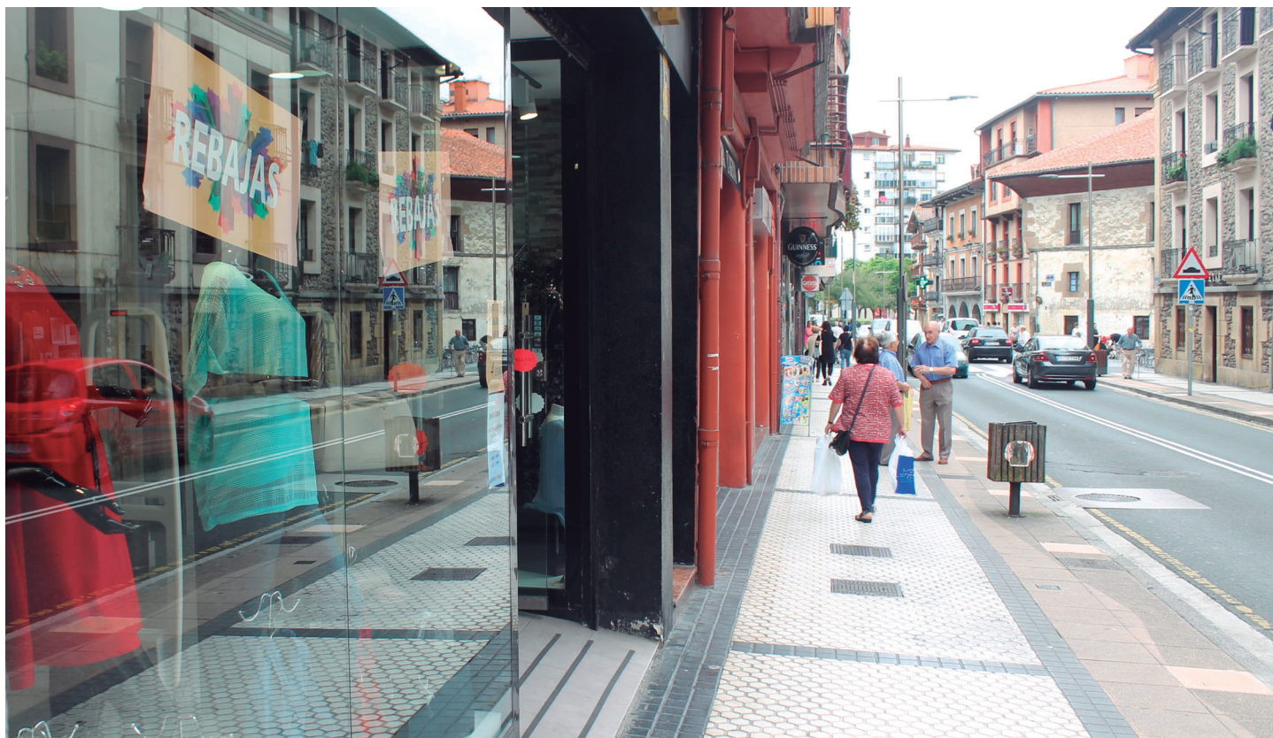
Lehia basatia jasaten dute dende merkataritza guneen partetik, batez ere arropa dende. TXINTXARRI

Euskal Herriko beste zonalde askotan egoera beretsuan daude dendariak. Eta joera da gero eta saltoki handi gehiago zabaltzea. Denda txikien etorkizunari buruz zalantzak ditu ere Gaindegiako Esnaolak. “2008. urtetik aurrera askok itxi dute. Eta iraun duten askok erretirorako adinari itxaroten ari dira”. Horrek airean uzten du tokiko merkataritzaren ereduak: “Merkatarien batez beste adinak laguntzen digu aurreikusten merkataritzaren hurrengo atzeraldia”. Baina mehatxua dena, aukera bat ere bihur daiteke: negozio berriak irekitzekoa.