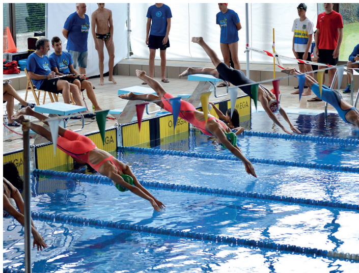
Buruntzaldea IKT-ko igerilariak igerilekura jauzi egiten.

Neska infantilak izan ziren txapelketan domina gehien etxeratu zituztenak. Parte