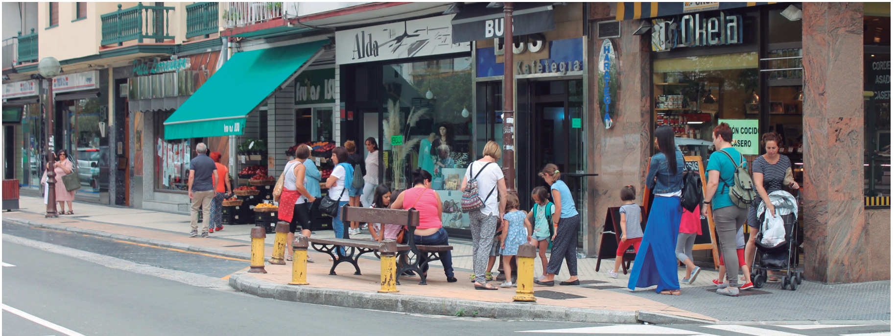
Herritarrak joan-etorrian Kale Nagusian, dendak irekita daudela. TXINTXARRI