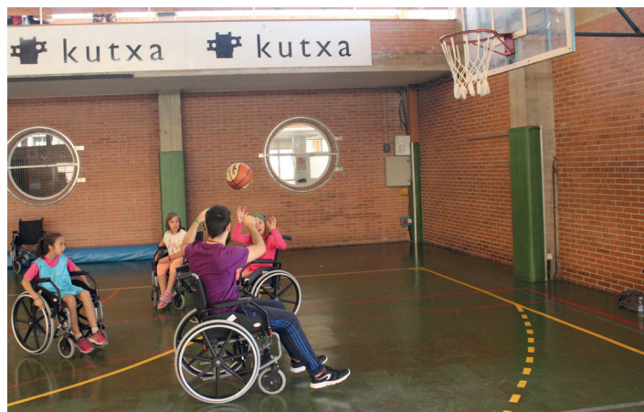
Besteak beste, saskibaloian jokatu zuten. TXINTXARRI

Joan den igandeko argazkiak ikusi nahi izanez gero, txintxarri.eus web orrialdean daude ikusgai, 'Multimedia' ataleko 'Argazkiak' azpiatalean.