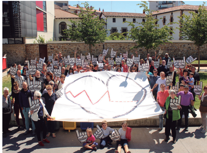
Maiatzaren 6an egingo den manifestaziora joateko deia egin zuen Sarek.

Larriki gaixo dauden Gomez eta beste hamabi euskal presoaren