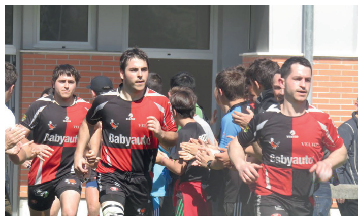
Rekondo anaiek hasieratik jokatu zuten. PAOLA VEGA