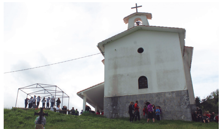
Santa Krutz eguna ospatuko da datorren igandean Azkorteko ermitan. TXINTXARRI

Antolatzaileek jakitera eman dutenez, bertara gerturatu nahi duenak oinez zein autobusez egin beharko du. Autobus zerbitzua goizeko 9:00etan hasiko da.