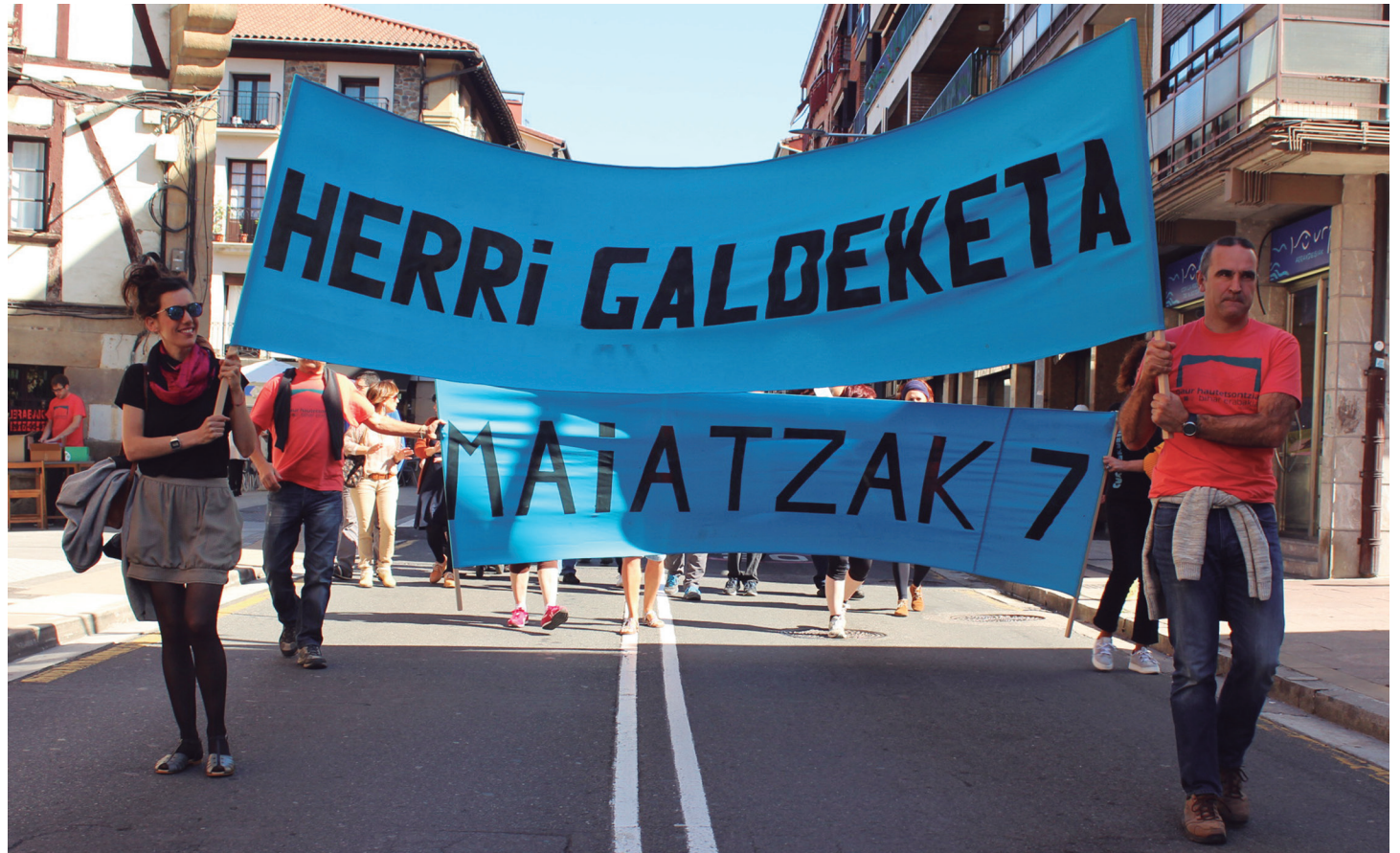
Herrian barrena ibili ziren, galdeketa eguna iragartzen zuen pankarta eta guzti, herritarrei gogorarazten datorren igandean herri galdeketa egingo dela TXINTXARRI

"ERABAKITZEKO ESKUBIDEA DIOGUNEAN, EZ DUGU INDEPENDENTZIA SOILIK ADIERAZTEN"