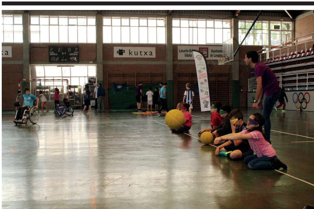
Urritasunen bat duten kirolarien ikuspuntua ezagutu zuten gaztetxoek igandean. TXINTXARRI