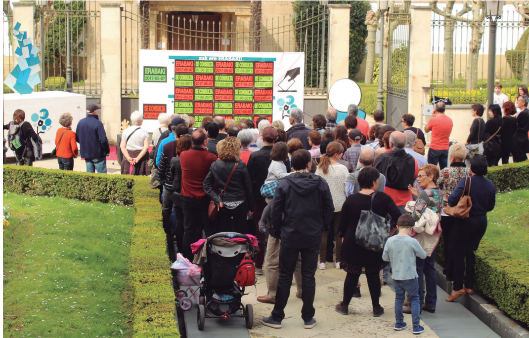
Martxoaren 3an, Brigitarren Komentu aurreko plazan egindako ekitaldian aurkeztu zituzten maiatzaren 7rako galderak. TXINTXARRI

Bidean, pausu garrantzitsu bat eman genuen hemen, Lasarte-Orian. Aurreko urtean mobilizatu genuen jende guztia saretu genuen eta Tutore Sistema jarri genuen martxan. 1000 pertsona saretu genituen.