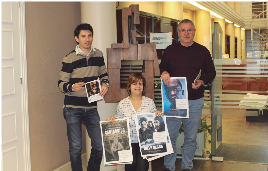
Udal ordezkariak egin zuten asteazkenean agendaren aurkezpena. TXINTXARRI