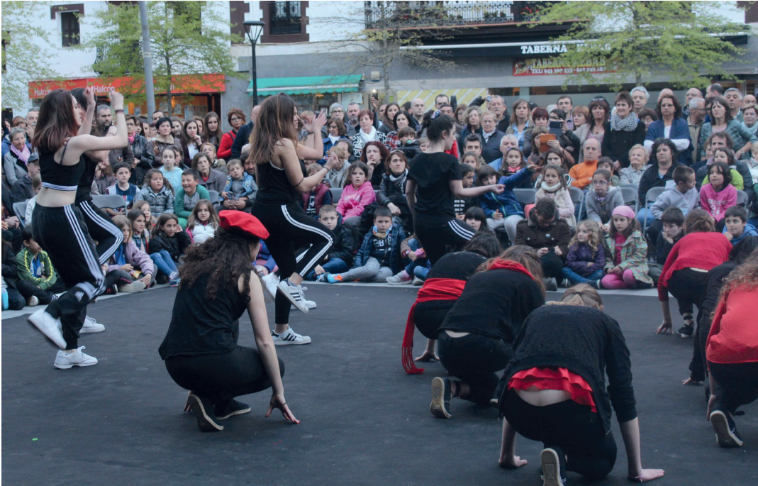
Lehenago urtean jende andana bildu zen Okendo plazan. TXINTXARRI