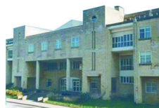
LARREKOETXE ERAIKINA 3. eta 4. DBH | BATXILERRA