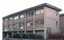
LANDABERRI ERAIKINA 1. eta 2. DBH

ORIENTE Institutua LASARTE-ORIA Bigarren Hezkuntza