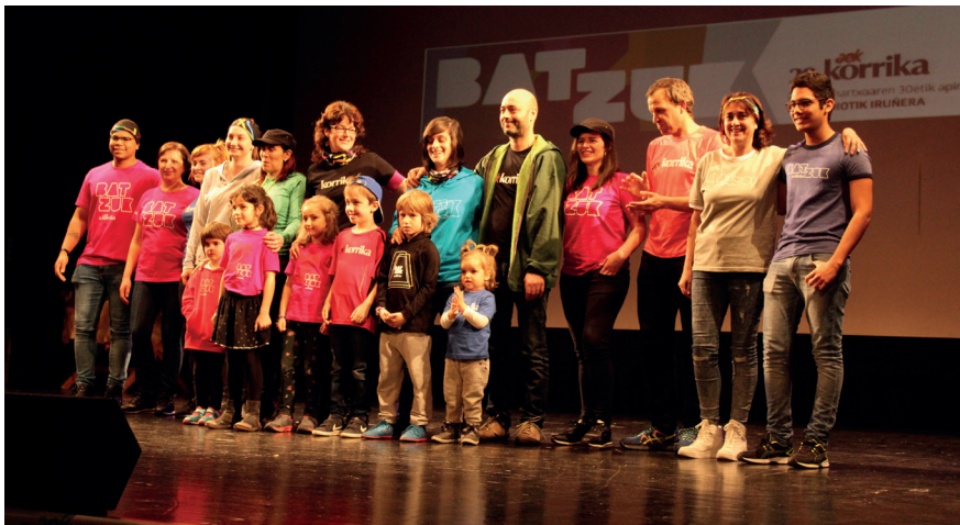
Muntteri-AEK euskaltegiko ikasleek desfilez erakutsi zituzten aurtengo Korrikako jantziak. TXINTXARRI