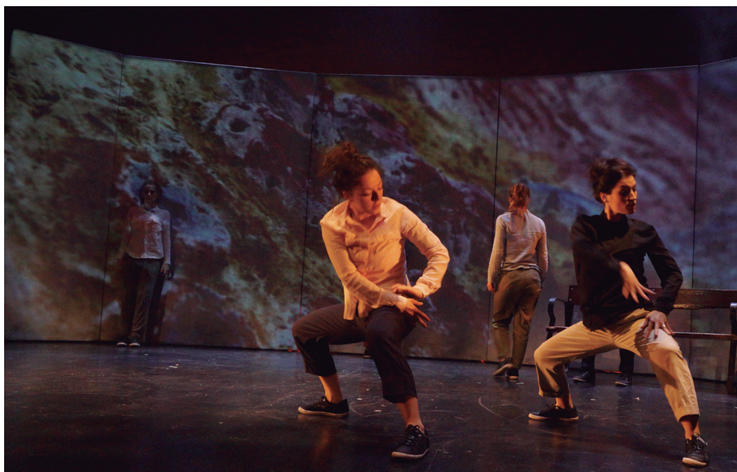
Haatik dantza konpainiak 'Hormek diote On Stage' dantza ikuskizuna taularatuko dute gaur kultur etxean.