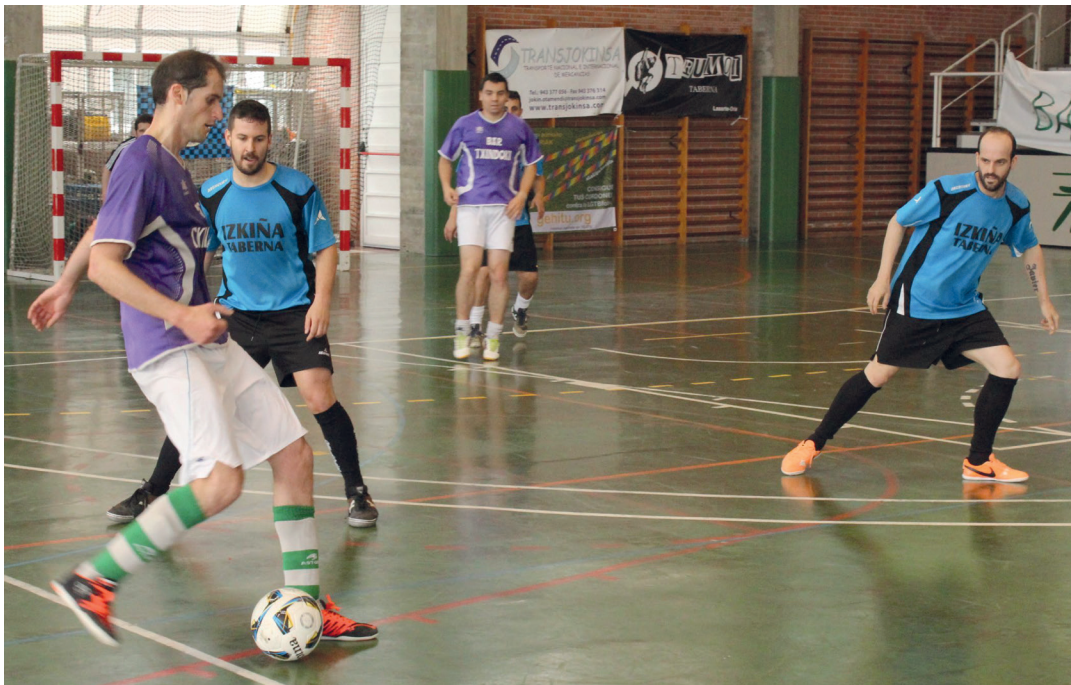
Pasa den urtean Izkiñak eta Txindokik jokatu zuten Txapelketako finala. TXINTXARRI