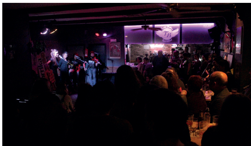
Lepo bete zen Furia Beltza taberna igandean: 'Bertso Korrika' egin zen bertan. TXINTXARRI