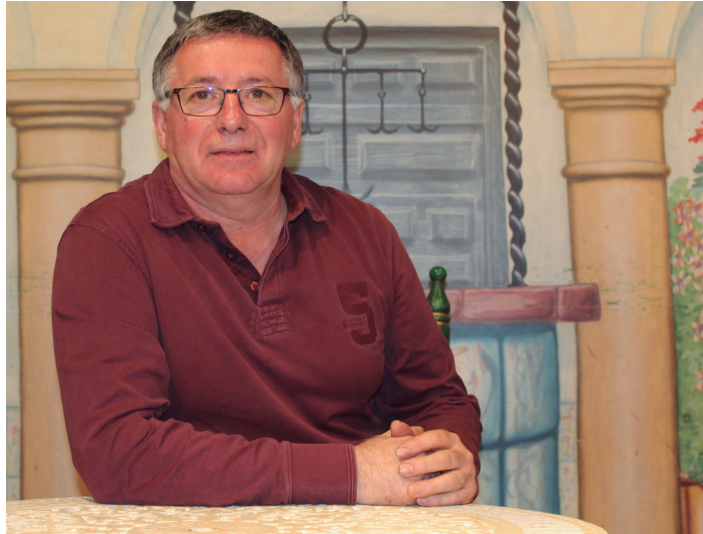
Hogeita bost urte bete ditu Lasarte-Oriako Semblante Andaluz Elkarteak. TXINTXARRI

Bai, mugimendu handia zegoen orduan Gipuzkoan, eta honen aurrean, motibazio txiki bat sortu zen Lasarte-Oriara etorri ginenon artean. Horrela, nola funtzionatzen zuten ikusteko, bisitak egiten hasi ginen zentro horietara. Horrela, 1992ko martxoaren 28an