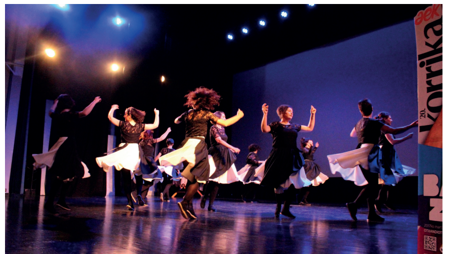
Kukuka eskolako dantzari talde batek koreografia ikusgarria taularatu zuen. TXINTXARRI