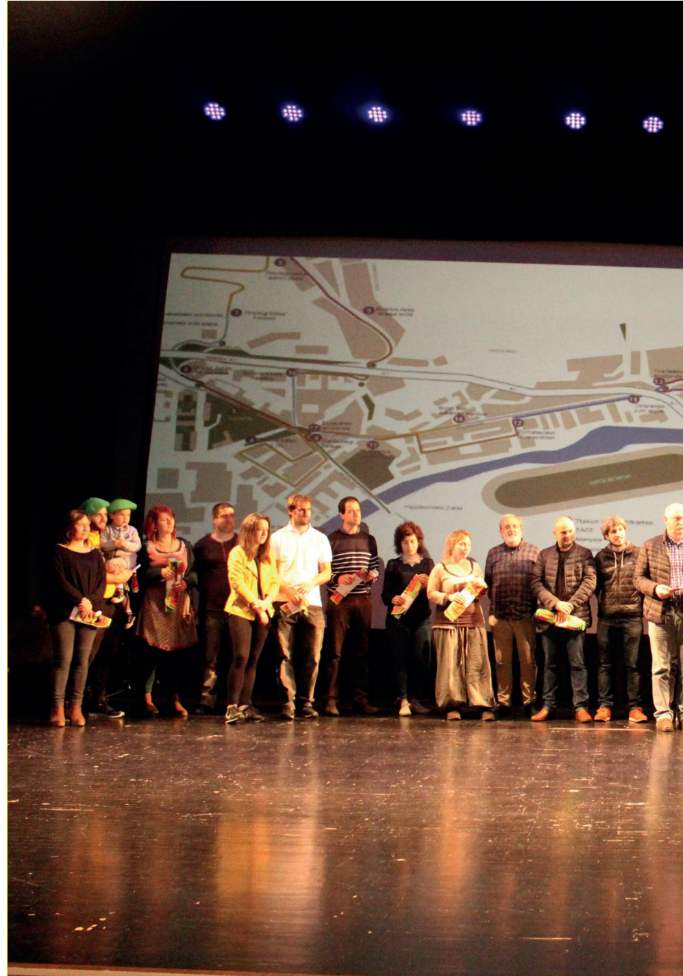
Gure herriko hainbat eragilek eramango dute 20. Korrikaren lekukoa apirilaren 4an. TXINTXARRI