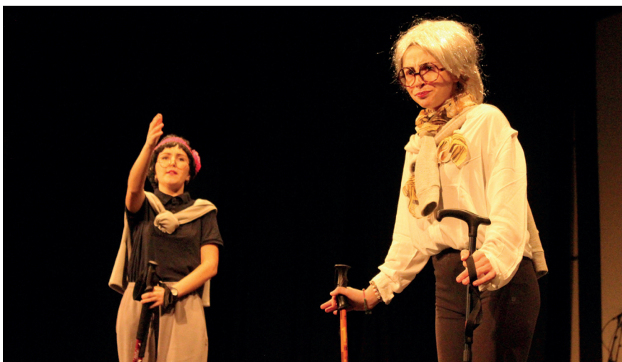
'Gure atsuek' eman zioten umore ukitua joan den ostiraleko aurkezpen ekitaldiari. TXINTXARRI