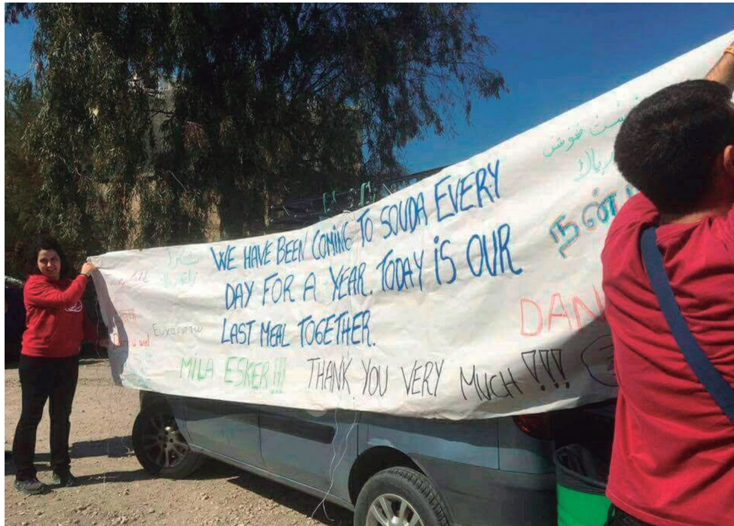
Martxoaren bostean azken bazkaria eman zuten Zaporeak proiektuak Chiosen eta boluntarioek eskerrak emateko pankarta bat egin zuten. NEREA ARTEAGA

Zer diote bertako errefuxiatuek? Desesperatuta daudela adierazten dute gehien. Nekatuta daude. Askotan pentsatzen dute guzti honetan zailena itsasoa zeharkatzea dela. Bertan nengoela, Argeliar batek esaten zidan bera etxetik atera eta Greziara iristeko hiru egun behar izan zituela, oso ondo joan zela bidaia, baina behin Chiosera iritsita, berak ez zuela bertan hainbeste denbora zain egon behar izatea espero; ez aurrera