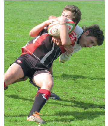
Gaztedi izan dute aurkari BELTZAK RT

16 urte azpiko Espainiako selekzioak ZRT Beltzak taldeko