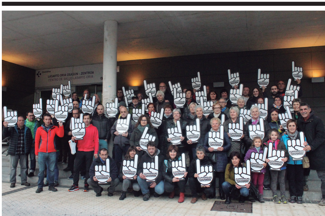
Lasarte-Oriako Sarek agerraldian mobilizazio gehiago iritsiko direla ere iragarri zuen. TXINTXARRI