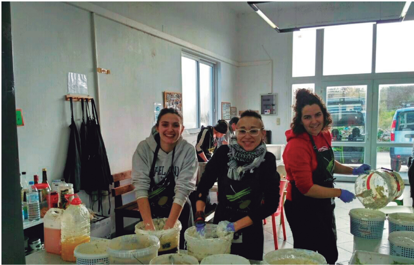
Zaporeak proiektuko boluntarioek Soudako kanpamentuko errefuxiatuentzat eguerdiko janaria prestatzen zuten, egunero-egunero. NEREA ARTEAGA

aritzen ginen lanean, bestetan ardura zehatz bat tokatzen zen eta beraz, hasierako egunetan horiek ikasten aritu nintzen. Zehazki zein izan da zure lan Chiosen?