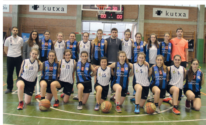
Junior mailako taldeek euren artean jokatu zuten.

Bizikletak plazan bertan garbitu ahalko dituzte baita ere, mangera bat baino gehiago jarriko dituztelako antolatzaileek helmuga-lerrotik gertu. Eta, azkenik, hala nahi dutenek, Maialen Chourraut Udal Kiroldegian dutxatu eta aldatu ahalko dira arropaz lasterketan amaitu ostean.