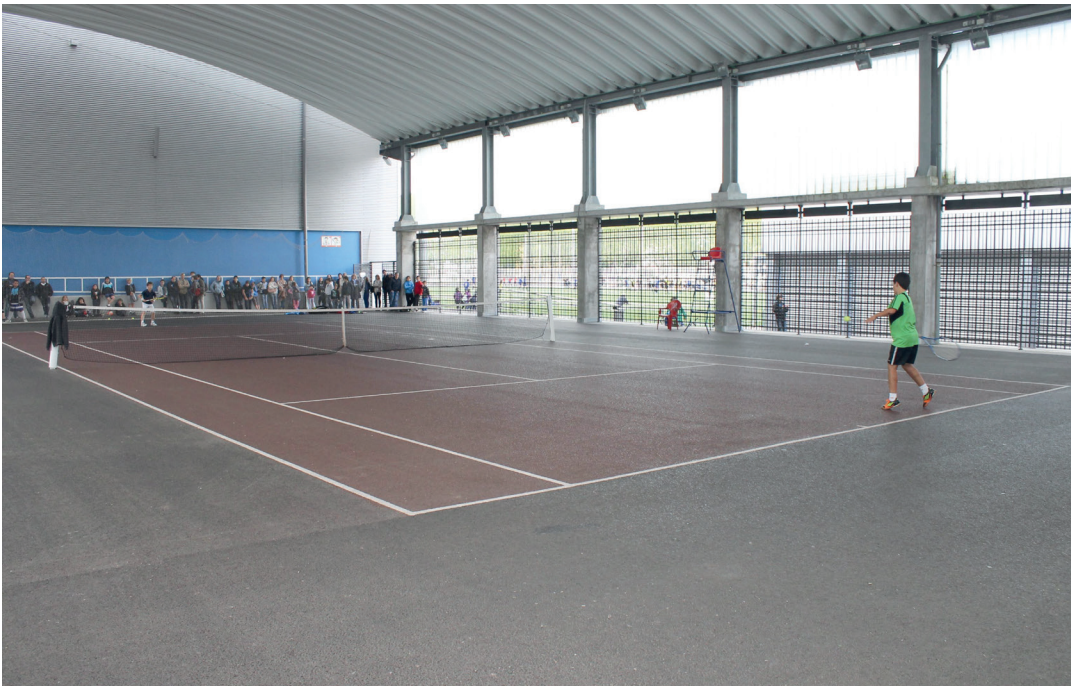
Urtero, Gipuzkoako Eskola Kiroleko tenis txapelketa antolatzen du LOKEK. TXINTXARRI