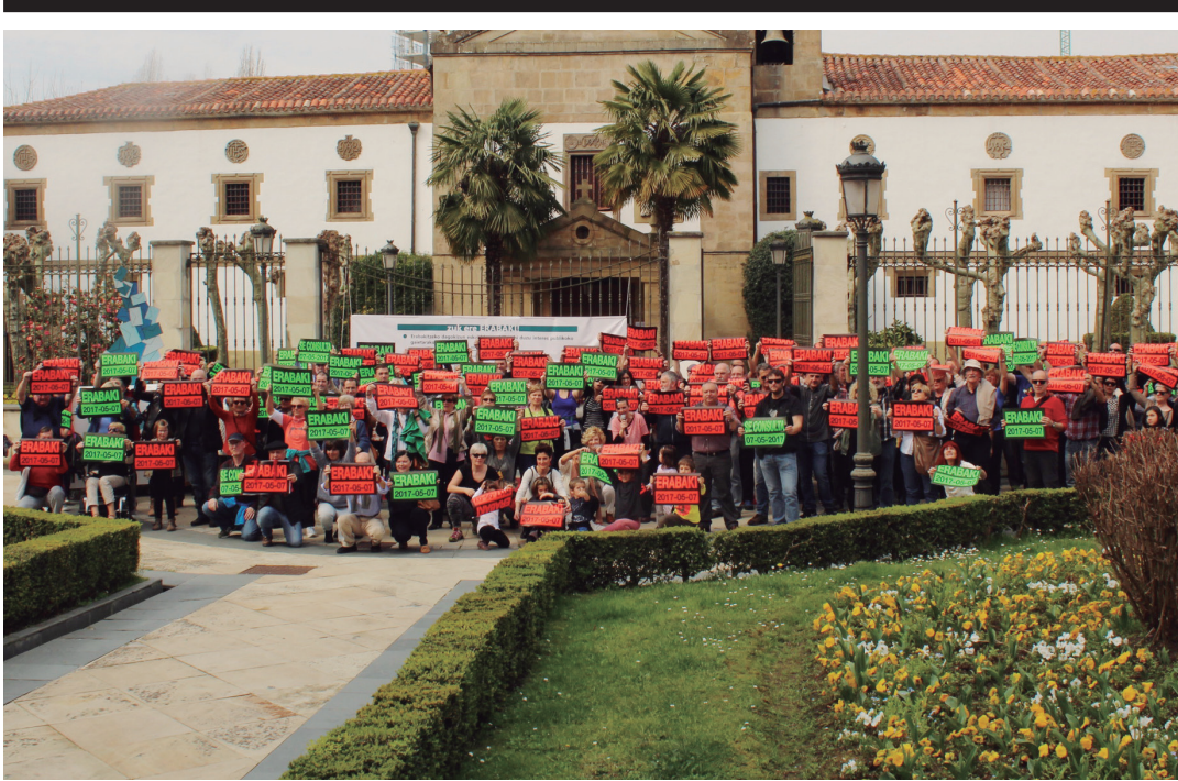
Larunbateko aurkezpen ekitaldiaren ostean talde-argazkia atera zuten bertaratutakoek. TXINTXARRI