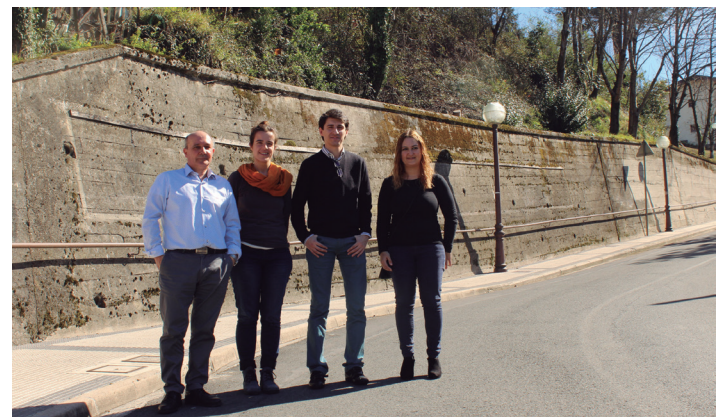
Udal ordezkariak, Arranbide kaleko horma parean. TXINTXARRI

Bestalde, aurreko urteetan bezala, herriko mural batzuk aukeratuko dira, itxuraberritzeko. Gaia berdintasuna izango da. Udalak deialdi irekia egingo du interesatuta dauden artistek euren proposamenak aukera ditzaten eta margolariek aurretik jakingo dute zein gune edukiko dituzten aukeran.