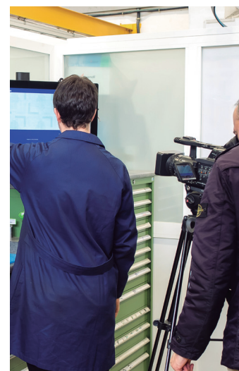
USURBILGO LANBIDE ESKOLA

ETB Usurbilgo Lanbide Eskolan izan da Teknopolis saiorako biltegi adimentsuaren grabazioa eginen. Grabazio honen helburua Usurbilgo Lanbide Eskolako Mekanika Alorrak martxan jarritako RFID teknologiaz hornituriko biltegi adimentsua ezagutaraztea izan da. Aurreikuspenak betez gero dokumentala ikusgai izango da apirilaren 8an, 13:30ean ETB1en eta hurrengo egunean 10:00etan ETB2n.