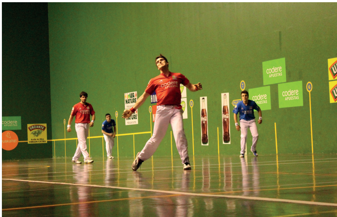
Arteaga II.a ederki aritu zen joan den ostiraleko neurketan, lehen atsedenaldirik aurrera batez ere. TXINTXARRI