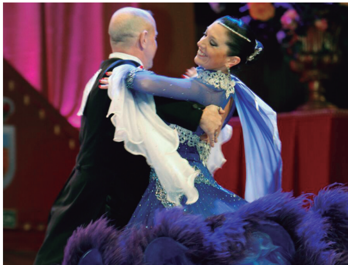
Amaia herritarra txapelketako une batean, Vals-a dantzatzen. MUEBT

Bai hori da, antolakuntzan aldaketak egon ziren eta iaztik Munduko dantza txapelketa izatera pasa zen. Orain izena 'MueBT' da eta lehen Europako txapelketa zen. Honetan parte hartzeko dantzari atzerritar askok errolda estatuko hiriren batean egiten zuten, senide edota lagun baten etxean. Hau asko gertatzen zen adibidez Hego Ameriketako jendearrekin baita Errusiarrekin ere. Hau dela eta antolakuntzak, txapelketa zabaldu eta Mundu mailako dantzariak hartzea erabaki zuen.