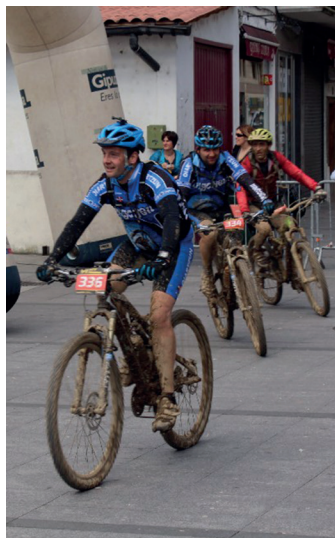
luzko edizioko irudi bat. TXINTXARRI

Internet bidez apuntatzeko epea lasterketa bezperan itxiko da; hau da, apirilaren 1ean, larunbatarekin, 16:00etan. Egun horretako arratsaldean bertan, 17:00etatik hasita eta 20:00etara, Urbil merkatal zentroan ere egongo da aukera lasterketan izena emateko, arestian esan bezala, 18 euroren truke.