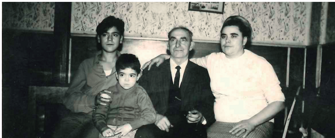
1960. urtean ireki zuten 'Galiza' taberna eta berrogeita hamazazpi urte eta gero, urtarrilaren bian itxi zituen ateak. ANGEL LÓPEZ