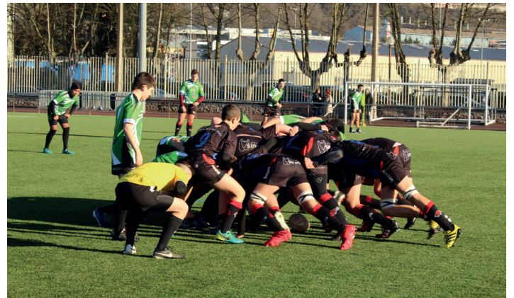
16 urtez azpiko Beltzak taldea Michelinen aritu zen larunbatean. TXINTXARRI

Balewk ezin izan zion eutsi Mikhouren erritmoari, eta azken hori nagusitu zen, 30:01eko denbora eginda. Balewk eta Irabarutak osatu zuten podiuma.