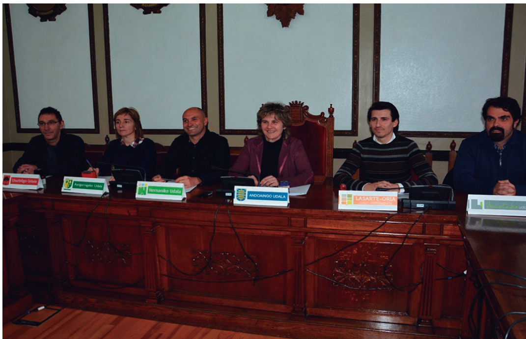
Sei udaletako alkateek egin zuten agerraldia ostiralean Andoainen. AIURRI