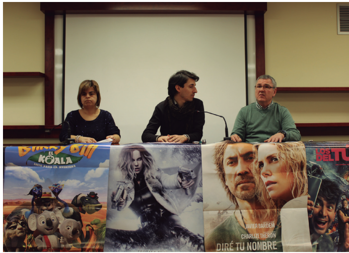
Asteazken eguerdian aurkeztu zuten otsaileko kultur agenda. TXINTXARRI

Bestalde, otsailaren 6an, 13an eta 20an, Danok Kideren eskutik, Itsaspeko Zinemaren Nazioarteko VI. Zikloa iritsiko da Manuel Lekuonara. Bertan, hamaika lan proiektatuko dira guztira, 19:00etan hasiko diren saioetan; "beren kalitateagatik harririk gaituzte", adierazi zuen asteazkeneko agerraldian Goitiak. Iraupen laburreko ikus-entzunezkoak izango dira gehienak, eta urpeko bizidun zertxobait gehiago jakiteko aukera eskainiko die ikustera animatzen direnei. 'Solopecios. Memoria Sumergida', '¿Qué le ha pasado al Gelidium?', 'Criaturas Olvidadas', 'La Conquete des Oceans', 'El último viaje del amiral de Kersaint', 'los secretos de la noche', 'Angelita', 'Fisterra', 'Raja empat Reefs', 'Expedición Wallacea', eta 'Travesía Getaria Zarauz, desde dentro' filmak