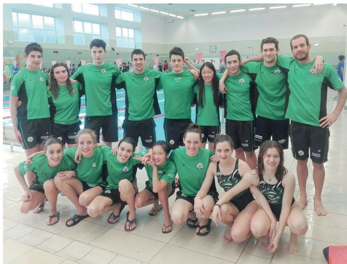
Neguko Ligako azken jardunaldian ateratako talde argazkia.