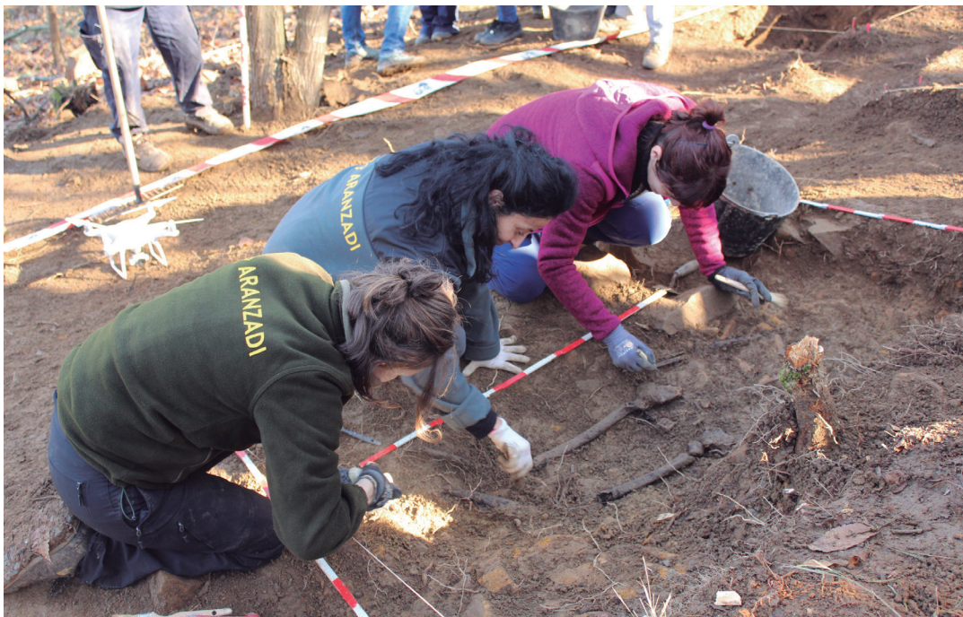
Giza-gorpuzki baten aztarna gehiago bistaratu zituzten larunbatean Txaldataxur gainean. TXINTXARRI