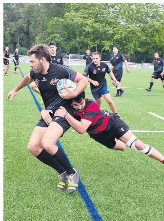
Partidako plakaje bat. TXINTXARRI