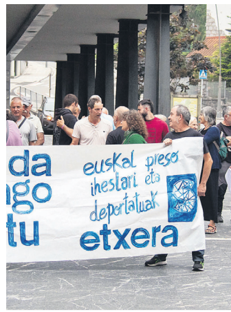
Maiatzaren 29ko ekintza. TXINTXARRI

Lasarte-Oriako Sarek esandakoaren arabera, mugarri izan