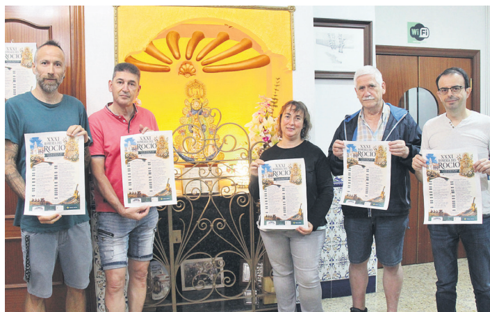
Semblanteko ordezkariak eta kultura zinegotzia, aurkezpena.