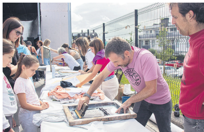
Festek iraun bitartean (eta amaitu ostean ere bai) janzteko moduko kamiseta asko serigrafiatu zituzten.