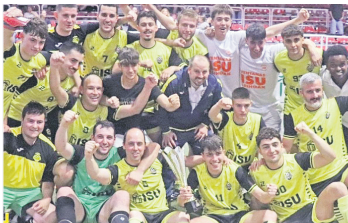
Eguzki ISU Leihoakeko jokalariek eta prestatzaileak, koparekin. EGUZKI AF