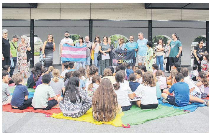
LGTBIQ+fobiaren aurkako eguna ospatu zuten Okendo plazan. TXINTXARRI