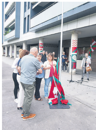
Ikurrina igotzen hastear. TXINTXARRI