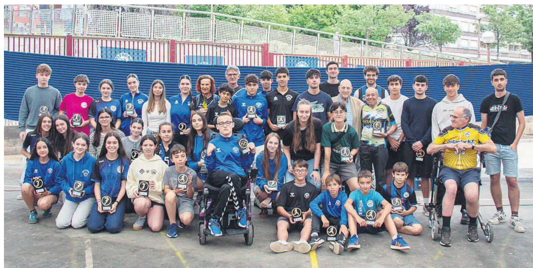
Ostadar SKTko sail ezberdinetako kideek zein sari bereziak jaso zituzten herritarrek talde argazki egin zuten.