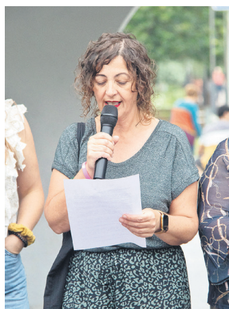
Manifestua irakurtzen. TXINTXARRI