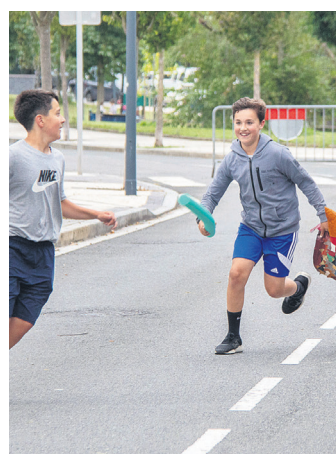
Buruhandiak izatera jostatzen. TXINTXARRI