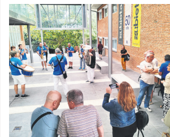
Ospakizun ekimenetako bat. ZUBIETA LE

Zubieta Lanbide Eskolak 50. urteurrena ospatu zuen maiatzaren 30ean. Ikasle ohiak, langile ohiak, egungo estudiante eta langileak, familiak eta herritarrak elkartu ziren.