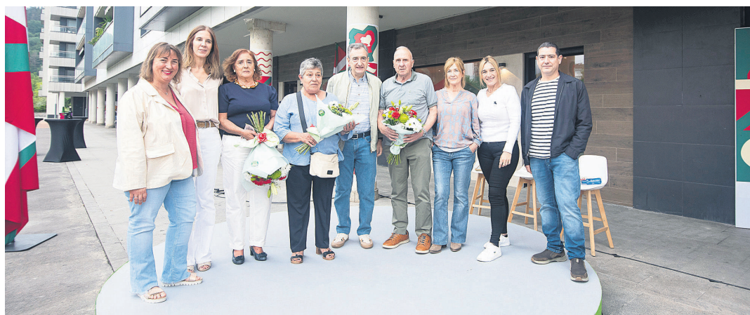
EAJko ordezkari politikoek eta irekiera ekitaldian aitortza jaso zutenek talde argazkia atera zuten batzoki aurrean. TXINTXARRI