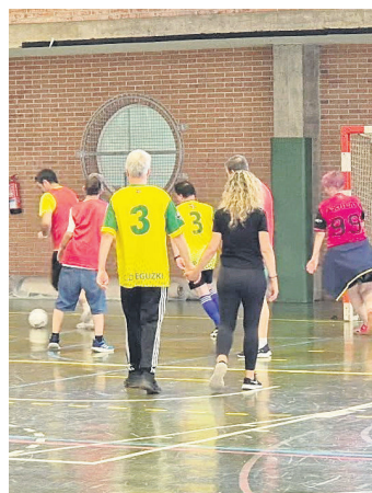
Jalgunekoez ederki jokatu zuten. JALGUNE