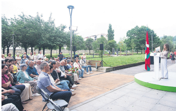
Lasarte-Oriako batzokiaren historiari buruz aritu zen Estitxu Alkorta. TXINTXARRI