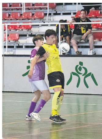
Kadete mailako finaleko irudia. TXINTXARRI