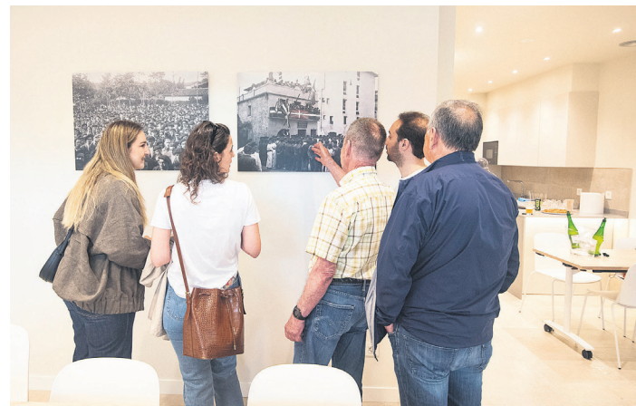
Batzoki barrualdea ezagutu zuten hala nahi izan zutenek. TXINTXARRI