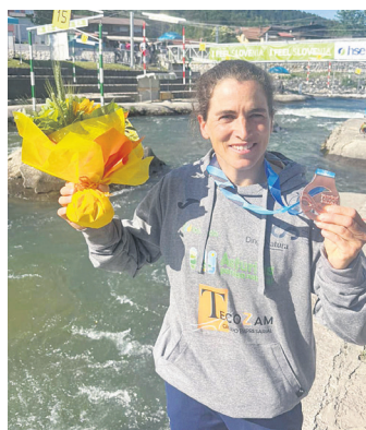
Chourraut, dominarekin. BAT BASQUE TEAM

Tacenekoa ez da Lasarte-Oriako palistak aurten eskuratzen duen lehen domina. Maiatzaren 17an, Kayak Krosetan Espainiako txa-