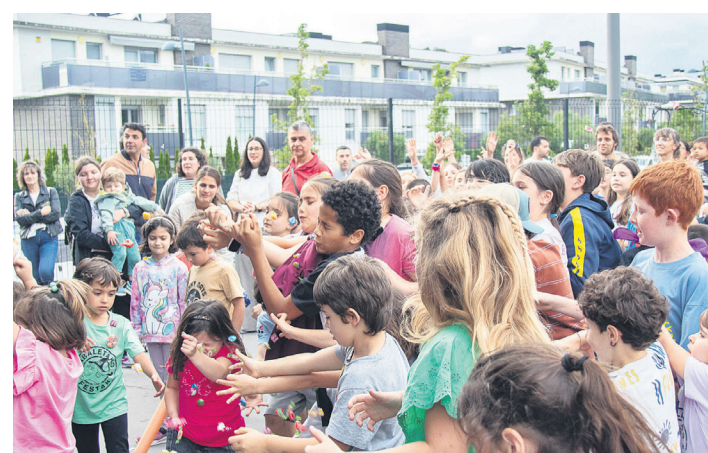
Goxorraketeekin jaurtitako gozokiak harrapatu nahian. TXINTXARRI