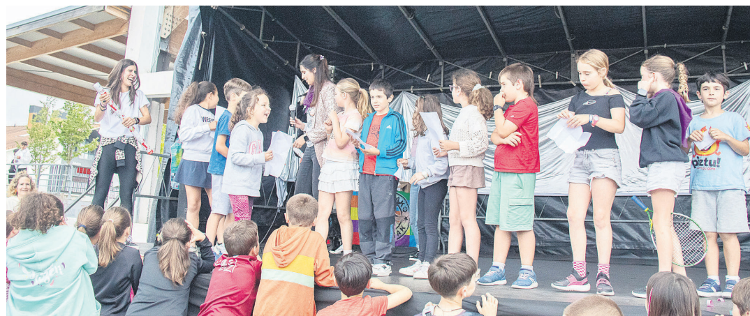
Festetako pregoia irakurtzeko prestatu ziren gaztetxoak. Urduritasunari aurre eginda, ederki aritu ziren denak. TXINTXARRI