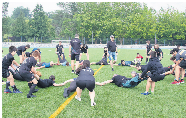
Goizean eskolako haur eta gurasoek joko eta partidaz gozatu zuten. TXINTXARRI