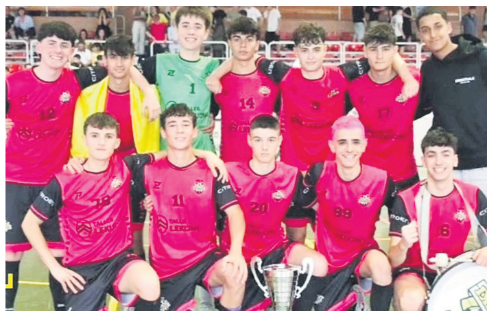
Gazteen mailako taldea, garaikurrarekin. EGUZKI AF