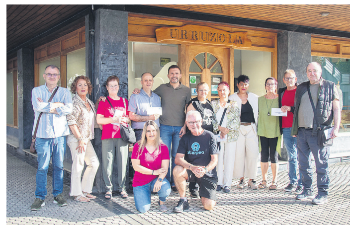
Urruzola mertzerian egin dute sari banaketa ekitaldia. TXINTXARRI

ASPEGI Gipuzkoako Emakume Profesional eta Enpresarien Elkartek antolatu zuen jarduera hori Beterri-Buruntza Manko-