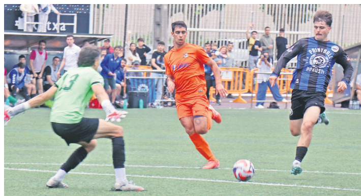
Ostadar SKTko jokalaria, erasoan, Ordiziaren atezainaren aurrean. TXEMA VALLES

Lehenik eta behin, Isaac Farre argazkilaria omendu zuten. Imaginen bidez jaso ditu herriko makina bat ekitaldi, jai ugari Farrek, zortzi urtez. Egindako