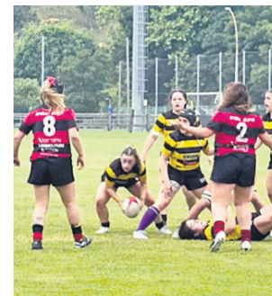
Finaleko irudia. EUSKADI RUGBY

Borroka lehiatua izan zen zelaian. Lehen zatian gorri-beltzak markagailuan entsegu eta gauzatzeari 7-0 aurea hartu zuten arren, aurkariak ez zuen amore eman eta bigarren zatian bi entseguri esker, garaipena erdietsi zuen.