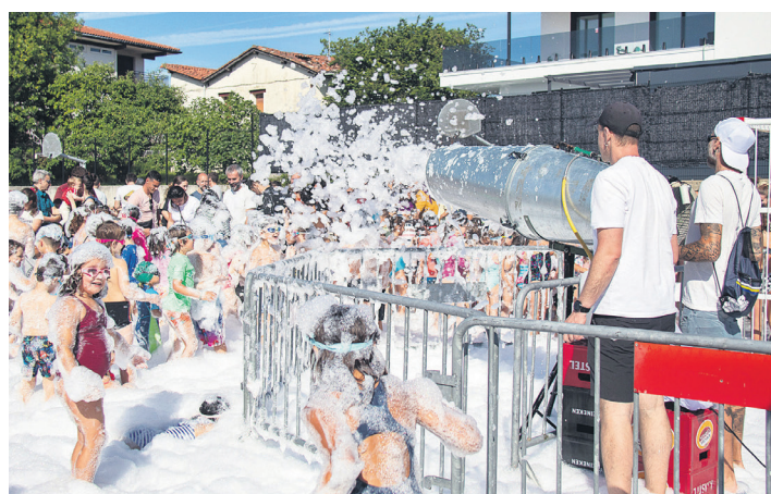
Apar festa asteazkenera aurreratuta, bete-beteen asmatu zuten. TXINTXARRI