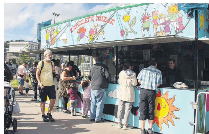
Pintxo goxoak eta edari freskoak zerbitzatzen ari dira txosnan.