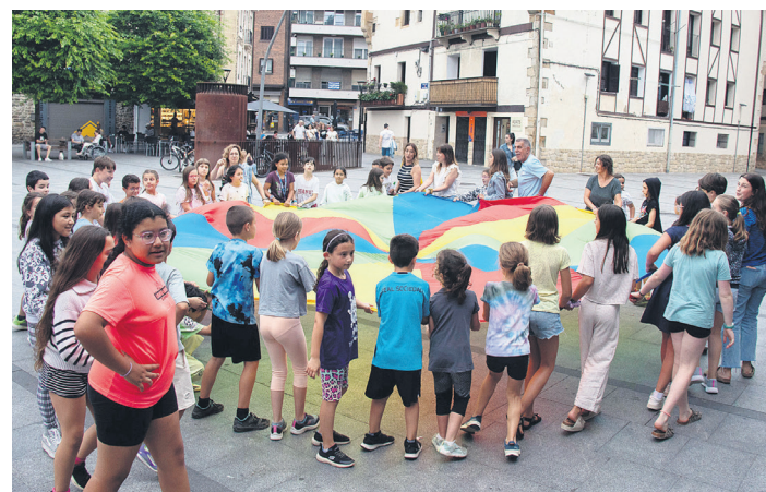
Koloretako oihala astindu zuten parte hartzaile guztiek, elkarrekin. TXINTXARRI