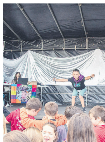
Talentu Bila lehiaketa. TXINTXARRI