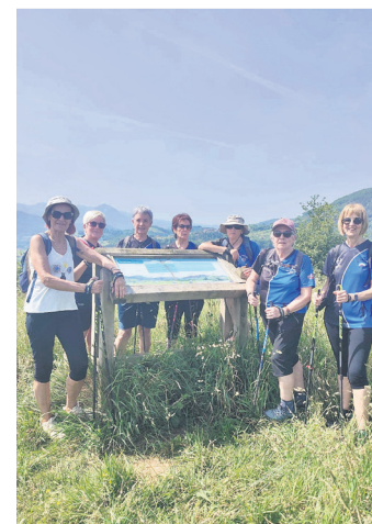
OSTADAR IPAR MARTXA

Astebete lehenago, aldiz, urteko azken irteeraz gozatu zuten, Irura-Basagain-Billabona. Eguraldi ikusgarria izan zuten 8,5 kilometroko bidea egiteko.