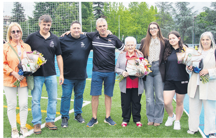
Zendutako Izar Beltzen familiei lore sortak eman zizkieten. TXINTXARRI