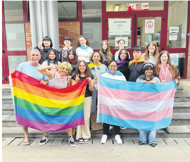
Oriarte BHiko ikasle eta irakasleak, Bizipoza taldeko kideekin.

Amaitzean den kurtsoan zehar egindako lana eta izandako inplikazioa eskertuta, urriaren 17ko eta 18ko 11. Euskararen Maratoian parte hartzera gonbidatu zituzten, aurtur egindako lana zein etorkizuneari buruzko azalpenak emateko leporaino beteta egongo den Okendo plazan. Beste hamaika egitasmo, eragile eta norbanak bezalaxe, Bizipozako kideek ere parte hartuko dute euskararen aldeko jarduerara erraldoi horretan.