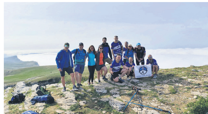
LOTMEko kideak, Beriain tontorrean; atzean, hodei itsasoa.