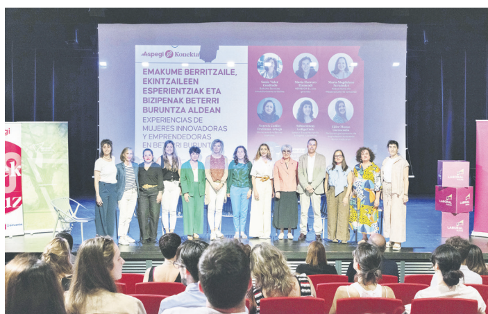
Konektatuz-eko mahai inguruko partaideak eta ordezkari politikoak. BETERRI-BURUNTZA