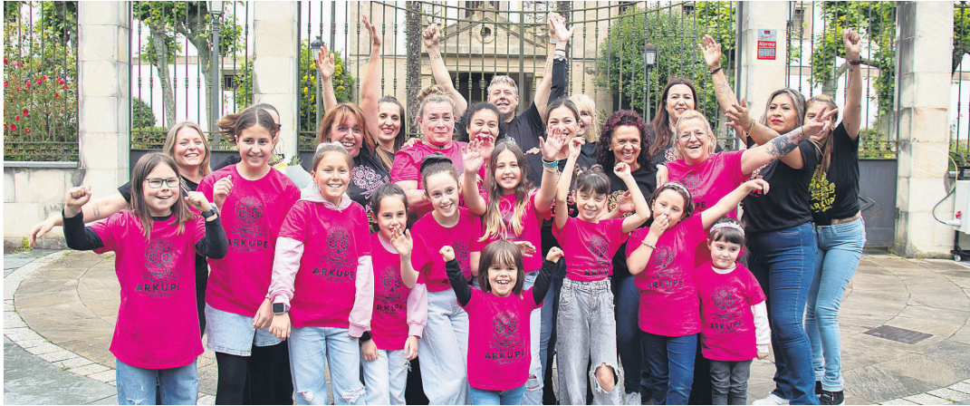
Arkupe tabernako kideek zunba saio animatua aurrera eramán zuten Ama Brigitarren komentu pareko plazan. TXINTXARRI