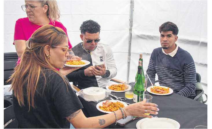
Itsaski paella goxoa jatera animatu ziren zenbait herritar. TXINTXARRI