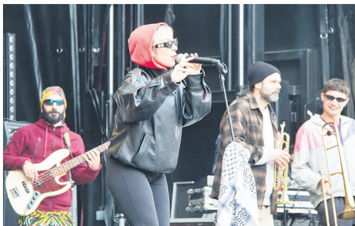
Agoteak taldekoen kontzertuko une bat.

baituzten. Indarberitzeko asmoz, txoznan edota foodtruck-etan edatekoa zein jatekoa hartu zuten. San Pedro Jaiak ailegatzeko hilabete eskas falta delarik, beroketa lan itzela izan zen Andatza Festibala.