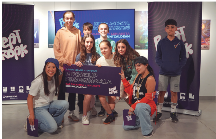
Irabazleak eta aurkezleak, elkarrekin. AIURRI

Zuen kasuan, hainbeste partaide izanik, nola moldatu zarete denen artean abestia osatzeko? Denon artean antolatu ginen, eta ondo moldatu gara. Lehe-