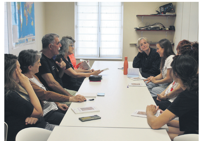
Nahia Intxaustirekin solastatu dira, berriki, Irakurle Txoko kideak. TXINTXARRI

Saioa borobiltzeko, mokadutxoak egin zuten bertaratuak, elkarrekin. Iritziak trukatzeko ere baliatu zuten tarte hori.