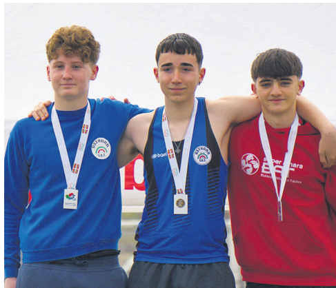
Ezkerrean, Corman eta Martin pisuko podiumean. Eskuinean, proba konbinatueta lasterketa.