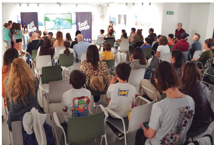
Ikusle ugari bertaratu zen sari-banaketa ekitaldira. AIURRI

nengo, bakoitzak bere zatia egin zuen. Ondoren, bakoitzak bere zatia aurkeztu, eta denon artean abestiaren errepika osatu genuen. Beste herriekin alderatuta, gu izan gara partaide gehien izan dituenak, eta hori positiboa izan da, ideia desberdinak batuta rapa politoa baita.