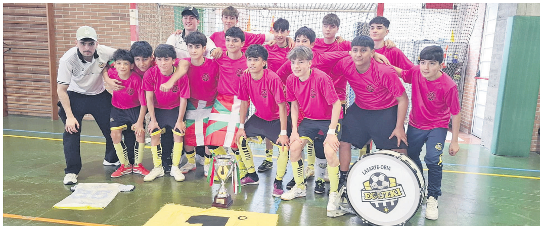
Eguzki Escalerilla taberna taldeko kideak, Euskal Kopako garaikurrekin.

Hitzordu garrantzitsua zuten ere infantil mailako Eguzki An-