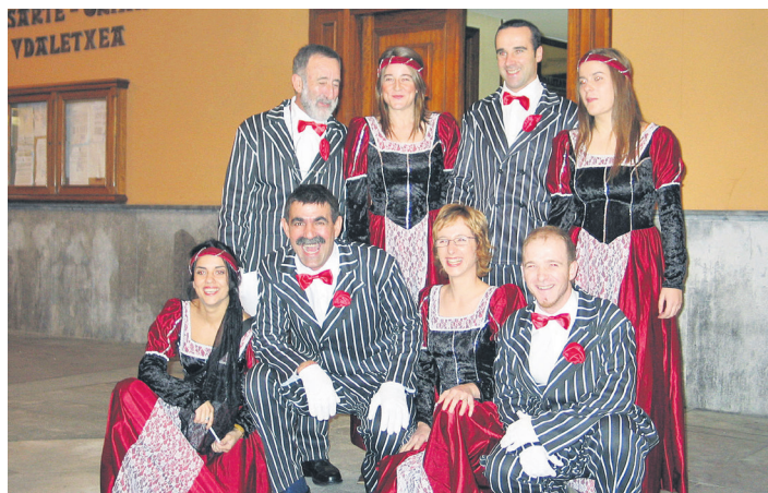
2004ko zortzikoteko kideak, dotore jantzita, hasiera ekitaldian.

Hori iragartzeko ekitaldia hilaren 27an egingo dute, asteazkenez, Jalgi kafe antzokian, 19:00etatik aurrera. Zortzikoteko kideen berri ematez gain, euskararen erabilera sustatzea eta komunitatea elkartzea xede dituen ekitaldiaren leloa eta logotipoa aurkeztuko dituzte. Antolatzaileek herritar guztiak (norbanakoak nahiz eragileak) gonbidatu dituzte aurkezpen