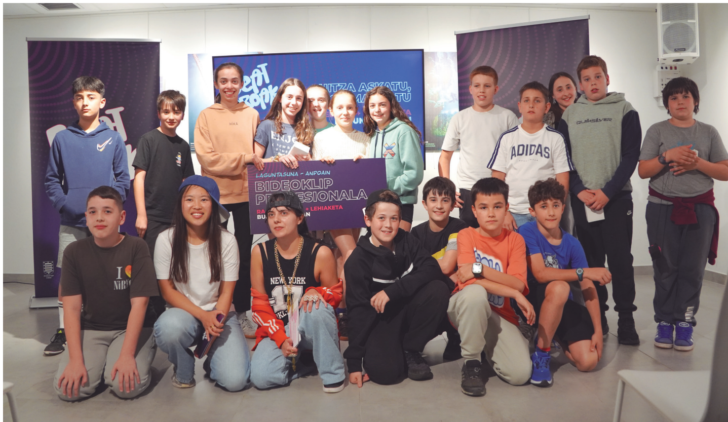
Sari banaketa ekitaldian, Beat Eroak ekimeneko protagonistak eta aurkezleak, elkarrekin, Astigarragako Erribera kulturgunean. AIURRI