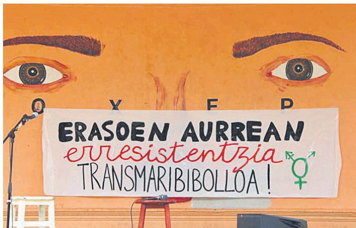
'Erasoen aurrean erresistentzia transmaribibolloa!' lelopean mobilizatu ziren. NOAUA

LGBTIQ+ fobiaren aurkako nazioarteko egunaren (maiatzak 17) eta LGBTIQ+ harrotasunaren nazioarteko egunaren (ekainak 28) harira, hainbat ekintza iragarri zituen Lasarte-Oriako Udalak. Horien artean lehena, Zaindu maite duzun oro tailerra aurrera eramaten behar zuten Somoslas Bitxis-ek, baina osasun arra-