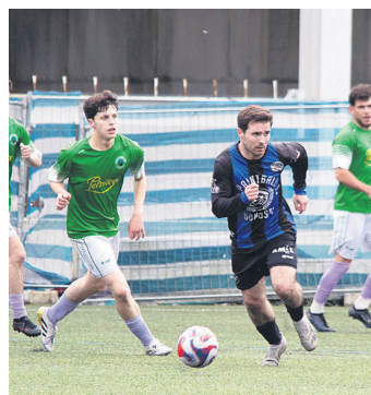
Ostadar, erasoan.