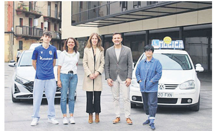
Okendo plazan batu dira egitasmoaren berri emateko. TXINTXARRI

deen izaera politikoaz. Horri lotuta, azpimarratu zuen "oztopo handia" izaten ari dela Espainiako Konstituzioa, justizia linguistikoa erdiesteko bidean. Beste gai interesgarri asko jorratu zituzten ondorengo hizlariak ere.