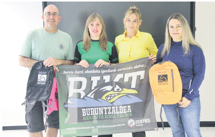
Buruntzaldea IKTKo arduradunak zein udal ordezkariak, aurkezpenean.

Saioan estilo ezberdinetako hamahiru proba egingo dira erlojuz kontrako serietan. Serieak marka eta kategorija bidez osatuko dira, genero eta gaitasuna edo desgaitasuna kontuan hartu gabe. Txapelketako jardunaren