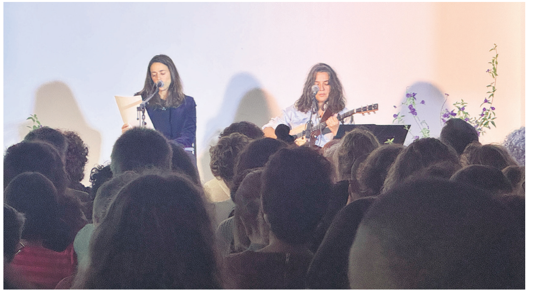
Jende ugari bertaratu zen Zabaleta Auzolan elkartera; ikusmin handia piztu zuen saioak.