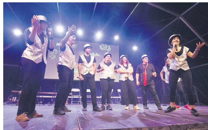
Zortzi herritar hauek dinamizatu zuten 2022ko Euskararen 10. Maratoialdia. TXINTXARRI