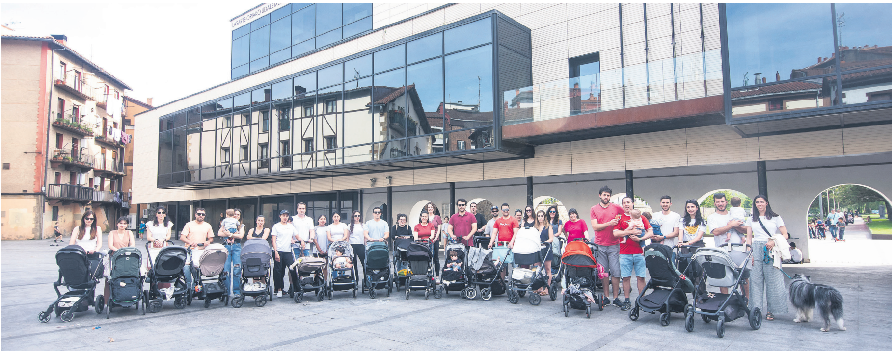
Euren seme-alabak Lasarte-Orian hezi nahi dituzte gurasoek eta 2026-2027 ikasturtea irailean hasiko dela kontuan izanda, haur eskolaren egoera "ahalik eta azkarren lantzea" eskatu dute.