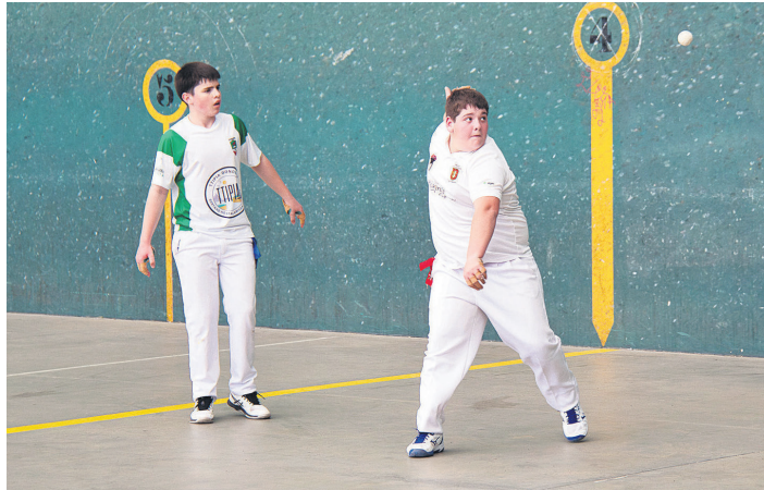
Intzako pilotari federatuek lau eta Erdiko txapelketa hasi dute. TXINTXARRI

Lehiaketa honetara Infantil I. eta III. mailan eta Alebin II. kategorian aurkeztu ditu bikoak Intzak.