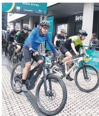
Ziztu bizian atera ziren. TXINTXARRI