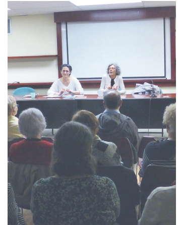
Aurkezpeneko une bat. UDAL LIBURUTEGIA

Esan bezala, hiru belaunalditako emakumeen arteko harremana da Tortugas lanaren ardatza, eta, kontakizuna "sinesgarria" egite aldera, "asko" dokumentatu dela kontatu du, pertsonaien azalean jarri eta bakoitzaren adierazteko eta hitz egiteko modua prestatzeko. Hori horrela izanik, liburuaren muina hauxe da: memoria, baloreak eta bestelakoak nola transmititzen dizkien amek alabei. Horrez gain, gaurkotasan askoko beste kontu batzuk jorratu ditu: klima