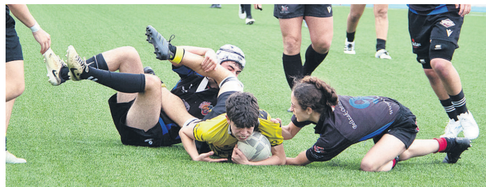
Zarautz Beltzak Eibar eta Getxoko 16 urtez azpiko gazteak, lehiatzen. TXINTXARRI

Bigarren zatian, Getxok maldan gora jarri zien partida Beltzei, 5-26. Baina etxekoek ez zuten amorarik eman eta berdinketa eskuratu arte borrokatu zuten. Azken minutuetan bi taldeek garaipenaren entsegu eskuratzeko lehia bizia izan zuten, baina puntu banaketarekin konformatu behar izan ziren.