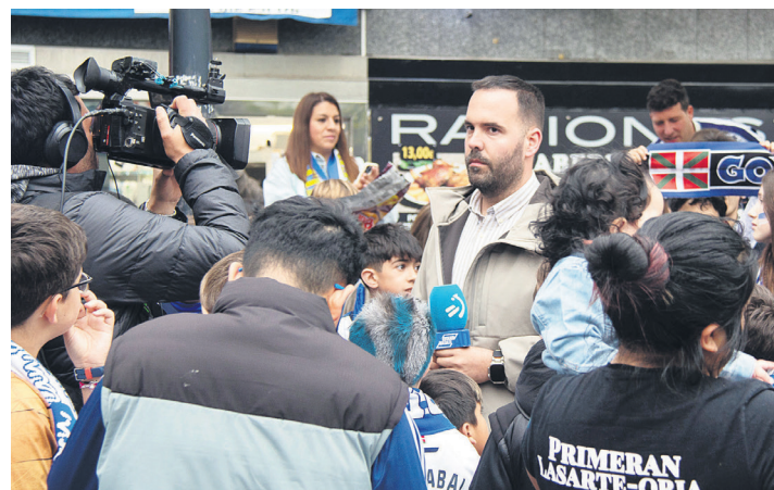
Eitbko kideak arratsalde osoan zehar izan ziren herriko giroaren jarraipena egiten.