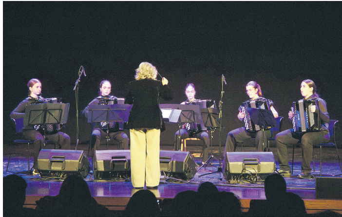
Leioako Kontserbatorioko ikasleek ekin zioten emanaldiari.

2004ko ekainaren 26an aurrera eramane zuten aurreneko jaialdia Zero Setteko kideek, urte horretako San Pedro Jaie egitarauaren barruan. Lau talde etorri ziren kultur etxera: G. Rossini orkestra italiarra, Oker folk taldea, jazz eta folka uztartzen zituen UHNE eta Zero Sette bera. Bi hamarkada igaro badira ere, helburu nagusiak ez dituzte aldatu