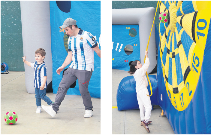
Haur, gaztetxo eta gurasoek puzgarrietako eremuaz gozatu zuten. TXINTXARRI