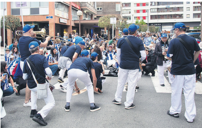
Dantzan izan ziren herritarrak Oaintxe in deu! txarangakoen doinuekin. TXINTXARRI