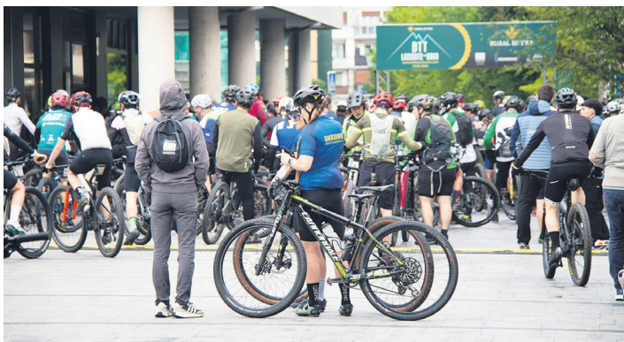
Mercero plazan bildu ziren BTT probako parte hartzaileak. TXINTXARRI