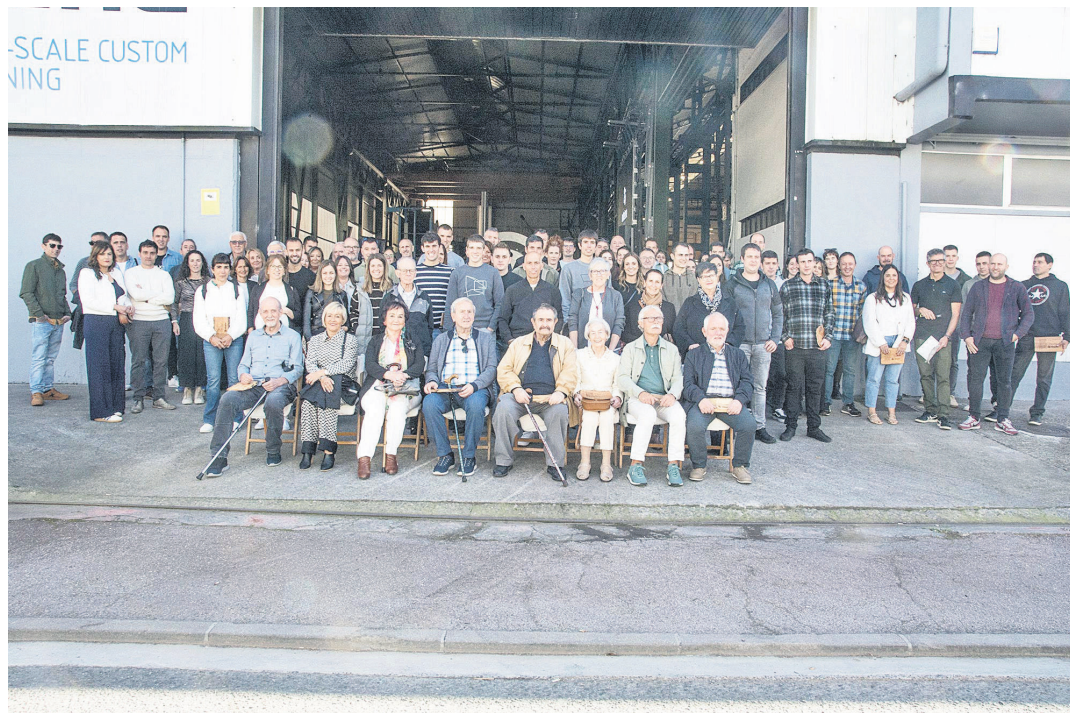
Kooperatiba gisa 25 urte bete zituztela ospatu zuten Talleres Mitxelenako langileek eta sortzaileek iaz. TALLERES MITXELENA

Egunerokoa pieza handien mekanizazioaz arduratzen gara, espezialistak gara horretan: 14-17 metrotako ardatzak; diametro handiagoa duten piezak ere bai, 40 tonara artekoak; eta fresado-