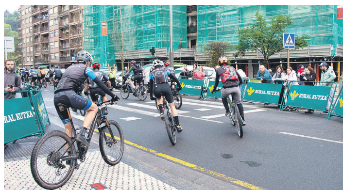
Txirrindulariek ikusleen berotasuna sentitu zuten irteera puntuan eta helmugan. TXINTXARRI