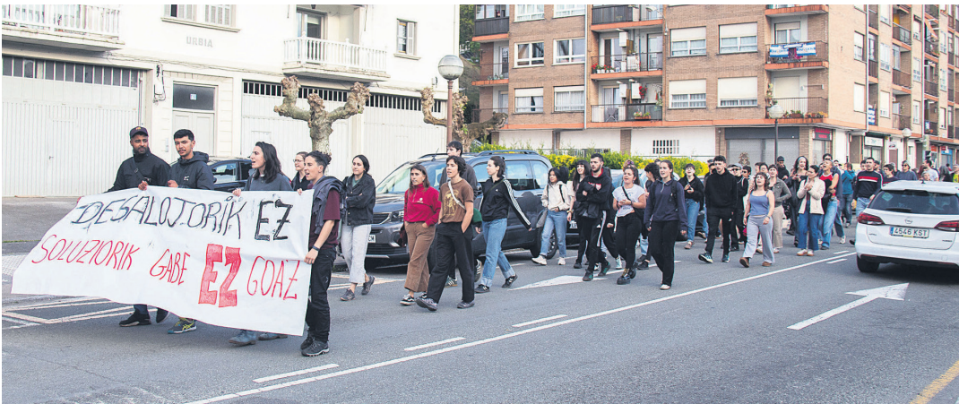
Txartel hotel paretik abiatu eta Kale Nagusia zeharkatu zuten manifestariek, Okendo plazara iritsi aurretik. TXINTXARRI