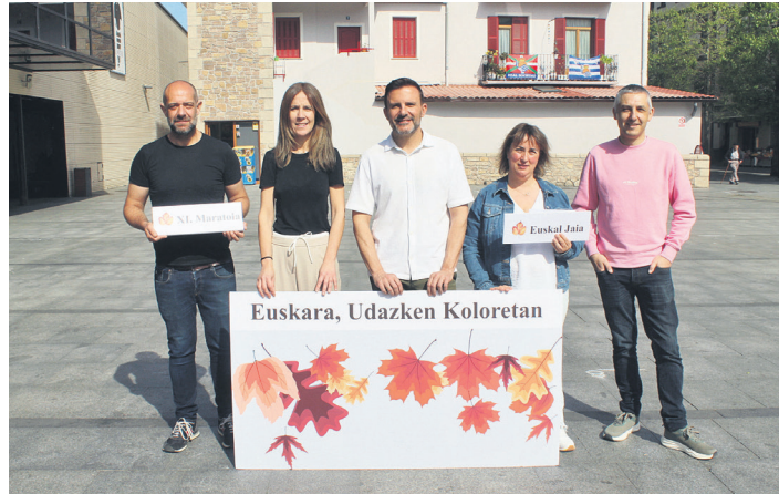
Okendo plazan eman duteekimene berri antolatzaileek. TXINTXARRI

Alkortak azaldu du urriaren 17an eta 18an izango dela Euskararen Maratoiaren hamaikagarren edizioa. Hala, gogora ekarri du azken aldia 2020an egin behar zela, baina Koronabirusak eragindako osasun larrialdia medio, 2022an ospatu zela. Hala, nabarmendu du "ilusioarekin" ari direla ekimen horren antolaketa lanetan, dagoeneko herri eragileekin elkarlanean. Primizia gisa esan du "berrikuntza batzuk" izango dituela aurtengoak, nahiz eta oinarrian, tradiziozko egitu-