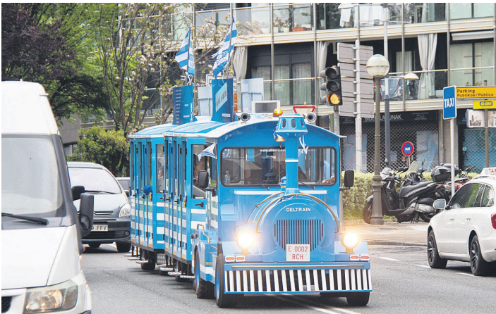
Txu-txu trenak herriko kaleak alaitu eta kolore txuri-urdinez bete zituen. TXINTXARRI