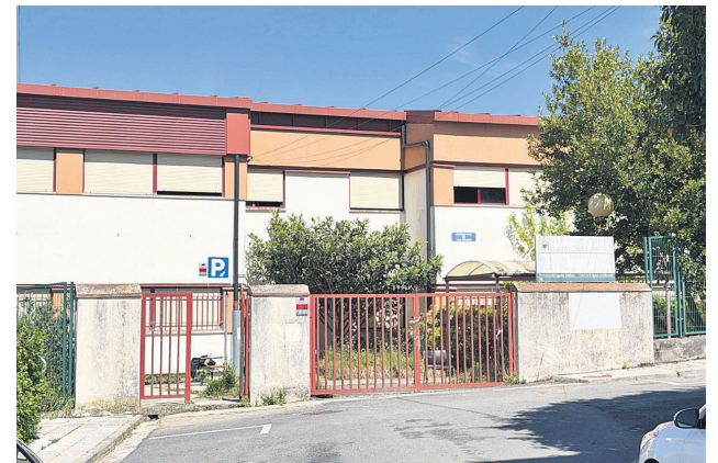
Oztarango eskola zaharren eraikin kanpoaldea. LASARTE-ORIAKO UDALA

Finean, bertako bizilagunen arabera, poliziak eman zien prozesu judizialaren berri; bai Ertzaintzak bai herriko udaltzaingoak. Ildo beretik, gehitu zuten desalojoaren agindua hilaren 15ean jaso zutela, hots, estatuko PSOEk gidatutako gobernuak migratzaileentzako ezohiko erregulazioa iragarri zuen egun berean. Etxerik gabe, erregularizatzeko prozesua "zaildu" egiten delarik, argi eta garbi azpimarratu nahi izan zuten "Oztarango eskola zaharreko bizilagunen erregularizatzeko prozesuak urratu" dituztela Eusko Jaurlaritzak eta Lasarte-Oriako Udalak. "Kapitalismoaren eta instituzioen utzikeriaren aurrean", adierazi zuten "autogestioa eta okupazioa" direla baldintza duinak lortzeko tresna "erreal" bakkak.