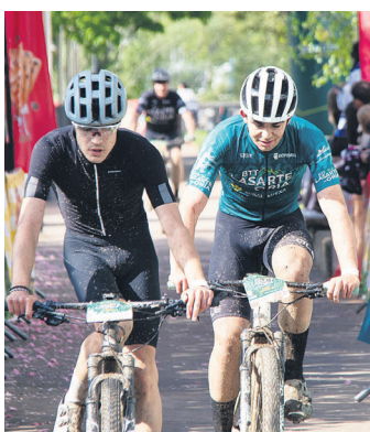
Lokatzuak iritsi ziren helmugara. TXINTXARRI