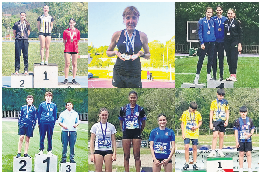
Podiumean izan ziren herriko atletetako batzuk.