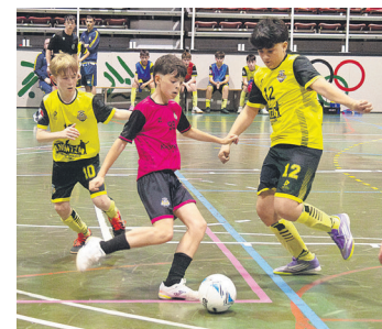
Infantilen derbiko irudia. TXINTXARRI

Eguzki Areta Futboleko harrobiko kideek, gainera, azken hilabeteetan, Euskadiko zein Gipuzkoako Selekzioen deia jaso dute entrenamendu saioak egiteko.