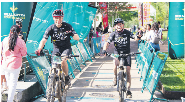
Guztiei irekitako jarduera da BTT proba eta adin guztietako zaletuak izan ziren parte hartzen. TXINTXARRI