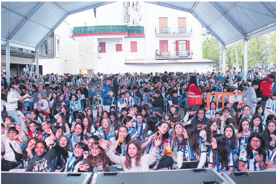
Adin guztietako herritarrek Okendoko karpa bete zuten Errege Kopa ikusteko. TXINTXARRI