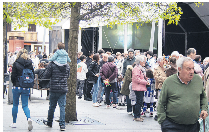
Goiz eta arratsalde, ilara luzea izan zen txu-txu trenean igotzeko. TXINTXARRI