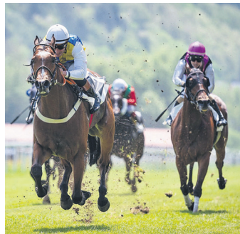
Bosgarren lasterketa.

Ezuste korik ere izan zen pistan zein sari banaketan. Hala nola, lehen sarian Real Sociedad taldeko Alvaro Odriozola jokalariren Bernardo zalditegiko Darkava -k eskuratu zuen saria eta horrez gain, Kopako garai-