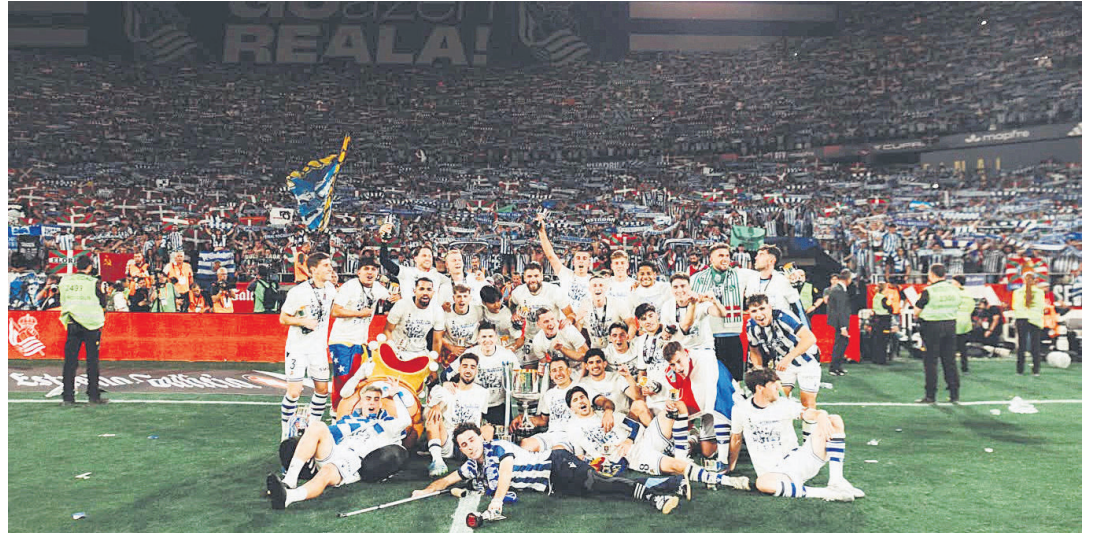
Realeko jokalariek koparekin; atzean, Cartujara bidaiatu iren jarraitzaileak.