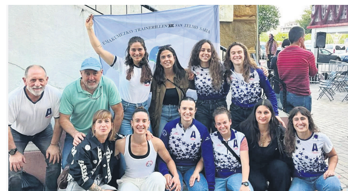
DONOSTIA ARRAUN LAGUNAK