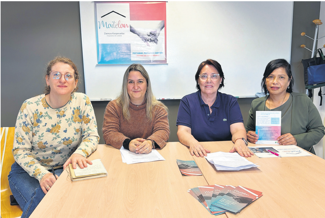
Asteon eman dute programaren berri Sexuen Elkarbizitzarako Emakumeen Zentroan. LASARTE-ORIAKO UDALA