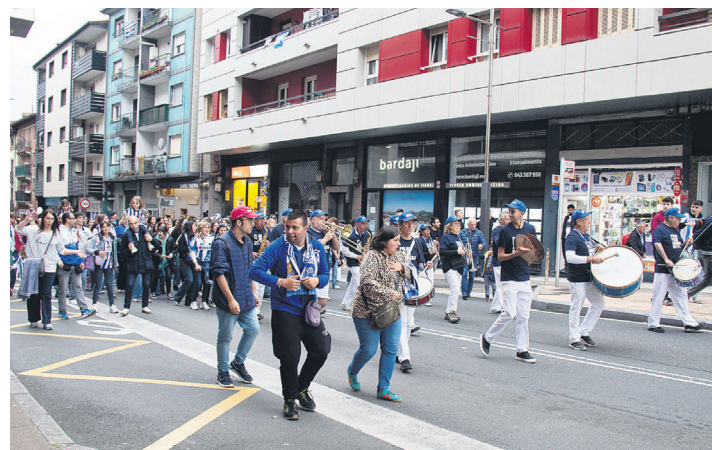
Giro ederra jarri zuen Oaintxe in deu! taldeak egun osoan zehar. TXINTXARRI