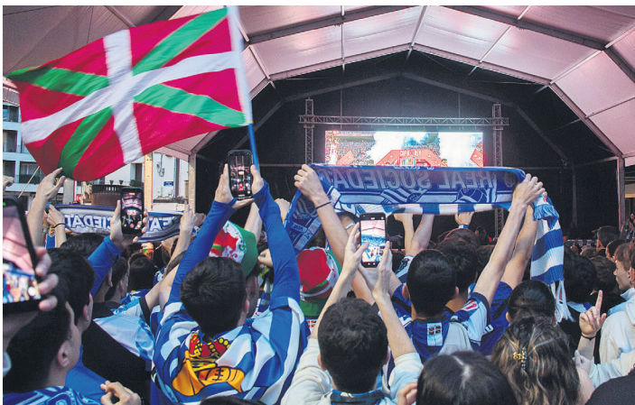
Kantuan eta lepokoak astinduz, ospatu zen Kopako garaipena karpan. TXINTXARRI