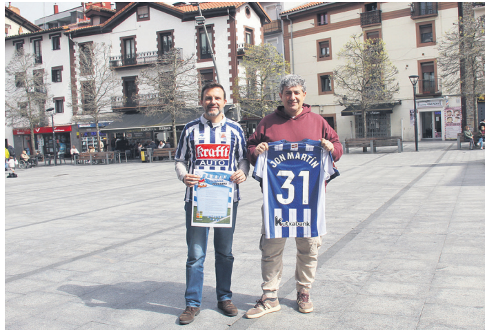
Udal ordezkariak pantaila erraldoia jarriko den Okendo plazan. TXINTXARRI

Eguerdiaren Oaintxe in de! txarangak jai giroa hedatzeko herriko plazetatik kalejira egingo du eta arratsaldean, 19:30ean, zaleekin batera erdialdeko kaleetatik barrena egingo du bidea. "Herritarrek Okendo plazan biltzea nahi dugu eta txarangarekin batera ibilbide txiki bat egitea, Okendo plazan amaituta", azaldu du Alonsok.