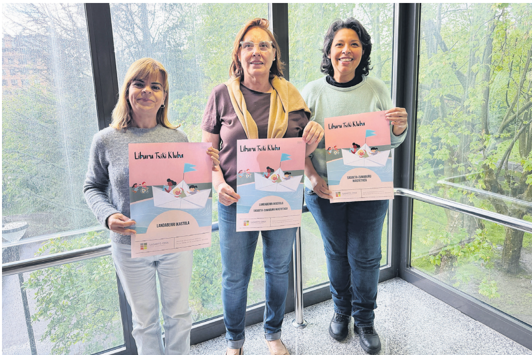
Mirentxun aurkeztu dute arduradunek Liburu Txiki Kluba. LASARTE-ORIAKO UDALA