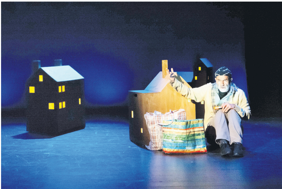
Aukeratu gabeko bakardade egoeran dauden pertsonaiak haragitzen dituzte aktoreek. ADOS TEATROA

ekin genion lanari: sekuentziak eta eszenak eman zizkiguten baina ez kronologikoki. Kanpotik, agian, zertxobait kaotiko gisa ikus daiteke baina obra bizirik zegoen hasieratik eta aukera izan dugu ekarpen asko egiteko.