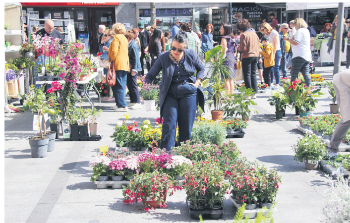
Herritarren jakin-mina piztu ohi du lore eta landareen azokak. TXINTXARRI

Salerosketarako azoka ez ezik, dibulgaziokoa eta familia girokoa izango da. 10:00etatik 14:30era bereziki haurrei zuzendutako ekimen ugari burutuko dituzte Okendon, hala nola egurrezko jolas tradizionalak edota lore eta landareen munduarekin lotutako jardueri buruzko tailerak.