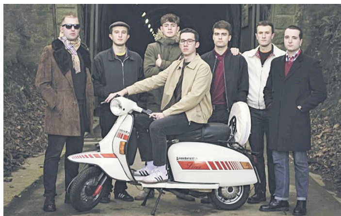
Skakeo proiektua amaitu eta Treverb Reggae taldea eratu dute. OIHAVELINO

Itxaroenea albuma argitaratu dute berriki eta, iragarri dutenez, "reggae doinuak plazara eramateko ilusio eta motibazio izugarria" dute. Norabide horretan, hasi dira jada kontzertuak ematen. Oroel Otal-ek