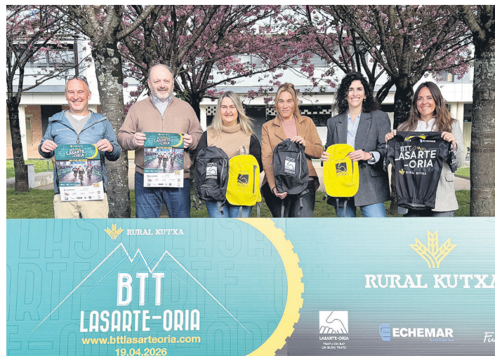
Probako antolatzaileak eta udal ordezkariak, BTT probako aurkezpenean.

Antolatzaileek probak zaletuen artean sortutako interesa azpimarratu zuten; dortsalak duela