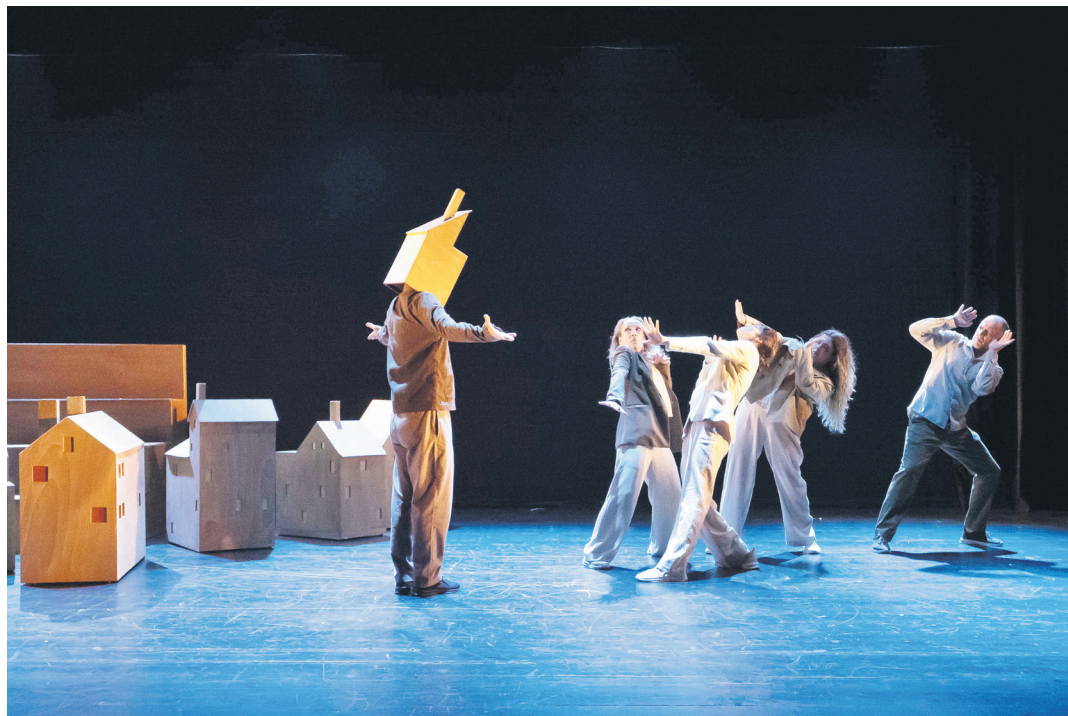
'52 Hertz' antzeztaneko eszenetako bat.