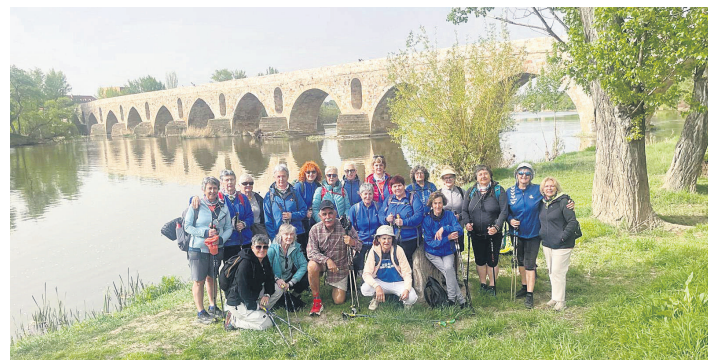
OSTADAR IPAR MARTXA

Ostadar Ipar Martxa taldeko kideek ez dute atsedunik izan Pazzo Astean. Gaztela eta Leongo txokoetan barrena izan dira kirola eta bisita kulturalak uztartuz. Leon eta Zamora (argazkian) hiriburuak, Ciñera de Gordoneko meatzeak, Carbajosa, Sobarriba, La Bañeza, Santa Colomba de la Vegako eliza, Pobladura del Valle, Benavente... ibilbide eta leku ederrak ezagutu dituzte bidaiak iraun duen bost egunetan.