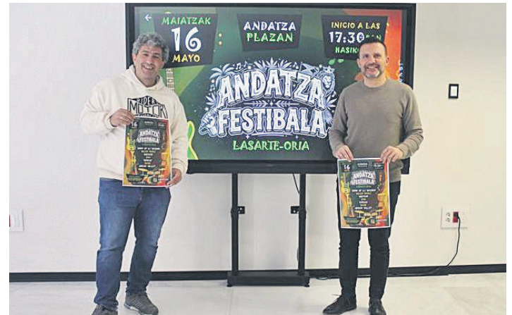
Udal ordezkariak, festibala aurkezteko agerraldian.

grabatu, nahastu eta masterizatu du albuma Arga Music Studio-n. Pantx Records eta Zuretzako Mezua zigiluekin ere kolaboratu dute Treverb taldeko musikari lasarteoriatarrek.