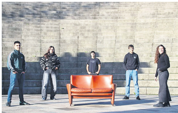
Ertz taldeko boskoteak 'Bidaia' albuma argitaratu du. MAITANE EIZMENDI