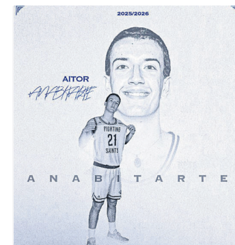
Fitxaketako irudia. GIPUZKOA BASKET

Ligako azken partidak eta ACB ligara igotzeko playoffa jokatu ditu Anabitartek. Gipuzkoa