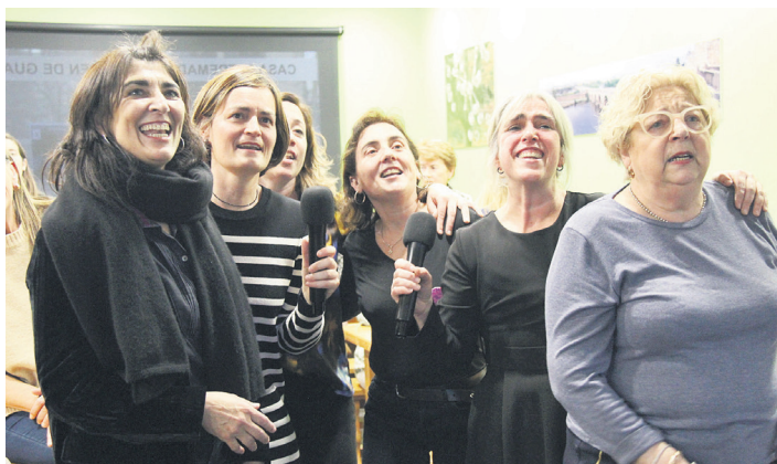
Karaoketan abestuz amaitu zuten ospakizun eguna. TXINTXARRI