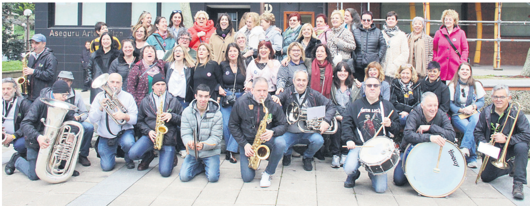
Oaintxe in deu! txarangako lagunekin batera egin zuten ibilbidea emakume elkartekideek. TXINTXARRI