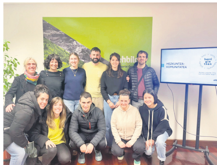
EH Bilduko ordezkariak eta herriko eragileak, elkartu ostean.

Aipatzekoa ere bada, ekimen horien harira, EH Bilduk 15.000 euroko diru partida gordetzea proposatu duela, besteak beste, herriko hezkuntza komunitatearen erronkak zehazteko eta diagnostikoaren lanketarako.