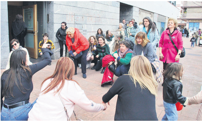
Extremadura Etxearen atarian egin zuten dantzan azkeneko. TXINTXARRI