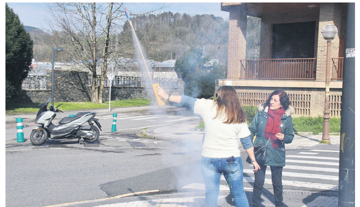
Semblante Andaluz elkartearen atarian jaurti zuten lehen txupina. TXINTXARRI