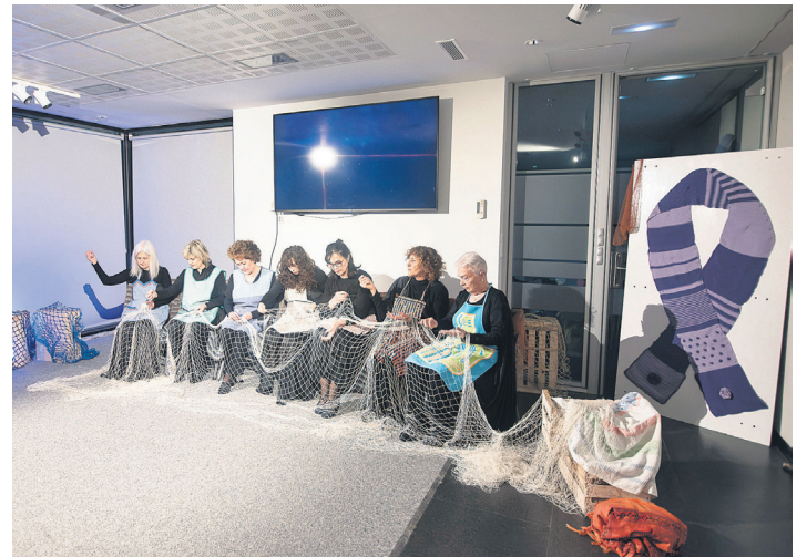
KikiliSalda taldeko antzezleak, emanaldia hasi berrikan.