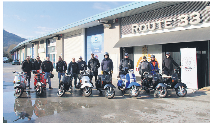
Orian dagoen Route 33 tabernatik abiatu ziren partaideak. TXINTXARRI