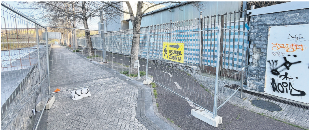
Hesi batzuk eta seinale bat jarri dituzte pasealekua itxi duten eremuan. TXINTXARRI