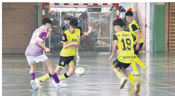
Eguzki Goxokis Goxuak eta Lauburu KE Ibarra jokalariek, baloia borrokatzen.