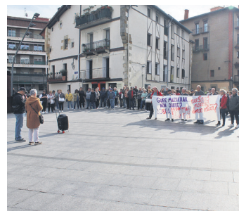
LOOPAren elkarretaratze bat. TXINTXARRI