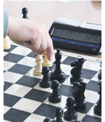
Xake partida bat. TXINTXARRI

Taula A taldeak, aldiz, garai berria eskuratu zuen lehen mailarako igoerako lehiaren. Ber-