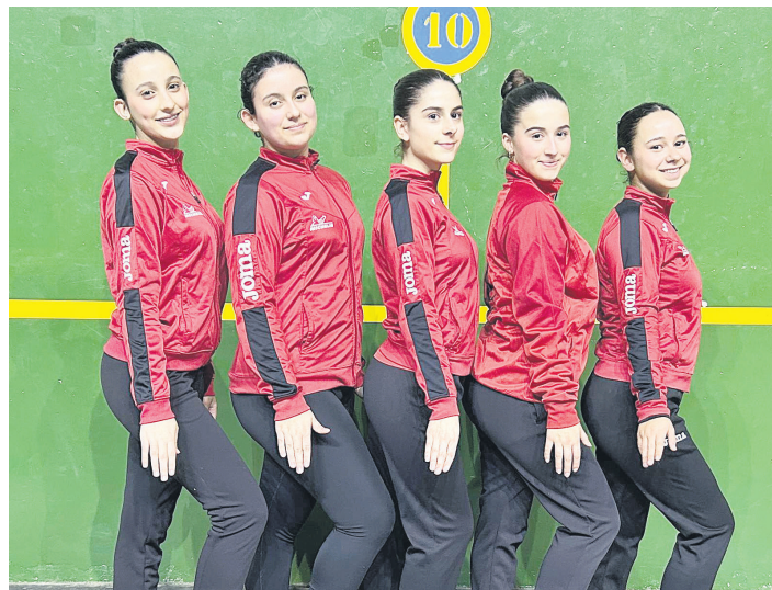
Kadete C taldeko kideak. LOKE GIMNASTIKA

Gainerako kideak mailaren arabera uztaia, pilota, xingola edo borrekin lanean aritu ziren proban