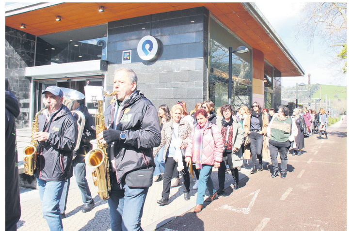
Txupinazoaren ostean txarangarekin kalejiran abiatu ziren. TXINTXARRI

Laburbilduz, gogoan izateko eguna izan zen. Parte hartzaileek orain arte Emakume Elkartekideen Topaketa ospatu ez arren, argi erakutsi dute horrelako ospakizuna egitearen beharra, belaunaldi askotariko emakumeak batzeaz gain, euren lana laudatzeko aukera ederra ematen baitie.