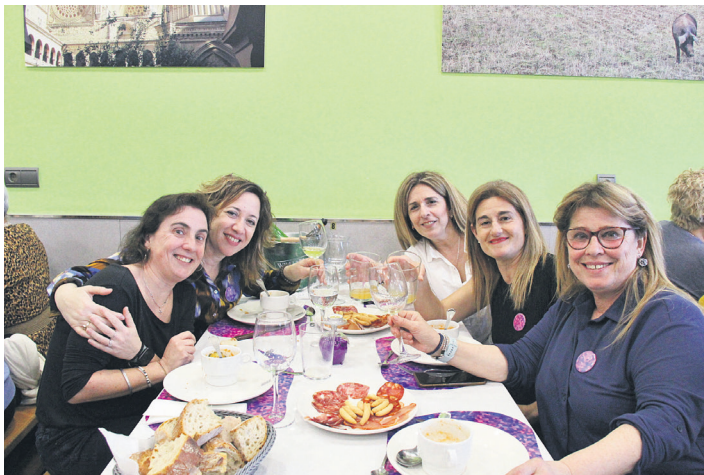
Irribarrea ez zuten une bakar batez ere galdu, ezta bazkaltzerakoan ere, noski! TXINTXARRI