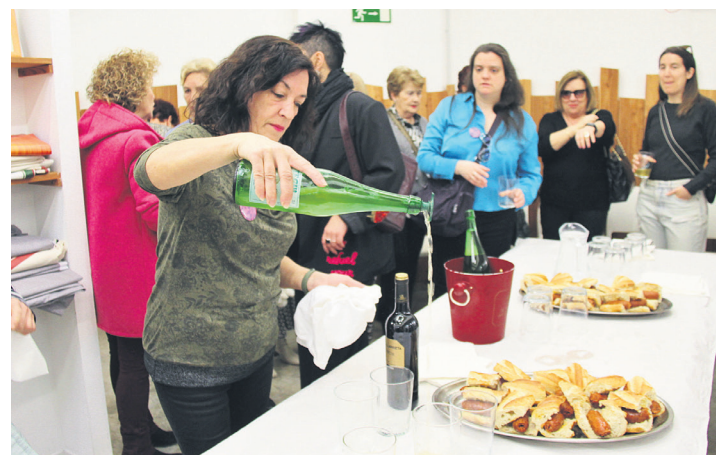
Elkarte bakoitzean indarrak berritu zituzten, bapo jan eta edanda. TXINTXARRI