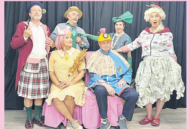
TESS konpainiak erakutsiko du 'La cantante calva'. V. EUGENIA ANTZOKIA

Txalo Produzioak-ek Amak antzezlaren emanaldia egingo du,