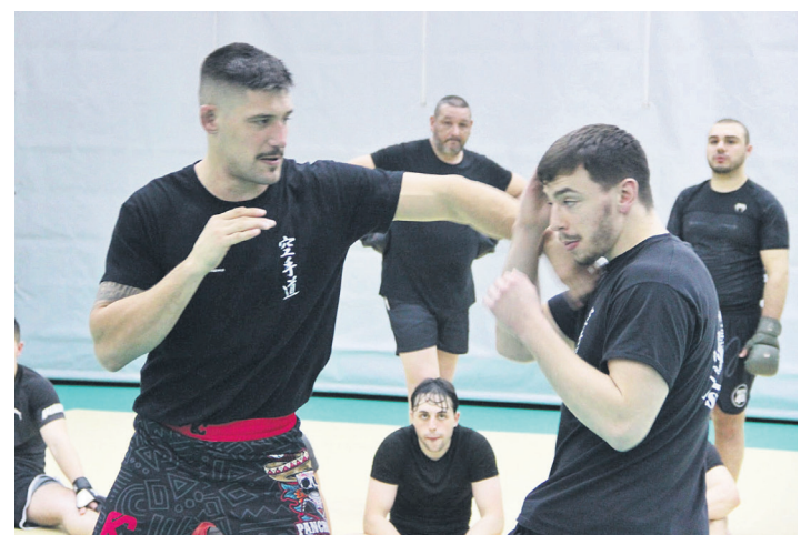
LOKE BORROKA ARTE MISTOAK

Eskolarteko lehiaketako bigarren saioa izango dute Donostiako Carmelo Balda kiroldegian. Alebinak izango dira lehenak lehiatzen hilaren 22an, arratsaldean eta infantilek, aldiz, hilaren 23an goizean. Horiek ere gogor egingo dute lan euren lehietako finalean egoteko.