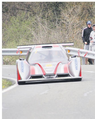
Iazko Opakuako igoerako irudia. A. MANSO

Lehia hasteko prest agertu da gidaria eta eguraldiarekin ere gogoratu da: "Gogotsu nago. Andatzatik Aiara igoera etetik gertu dagoen proba bat da. Eguraldia lagun izatea besterik