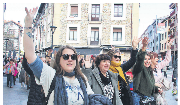
Herriko kale eta bazterrak girotu zituzten topaketako partaideek. TXINTXARRI