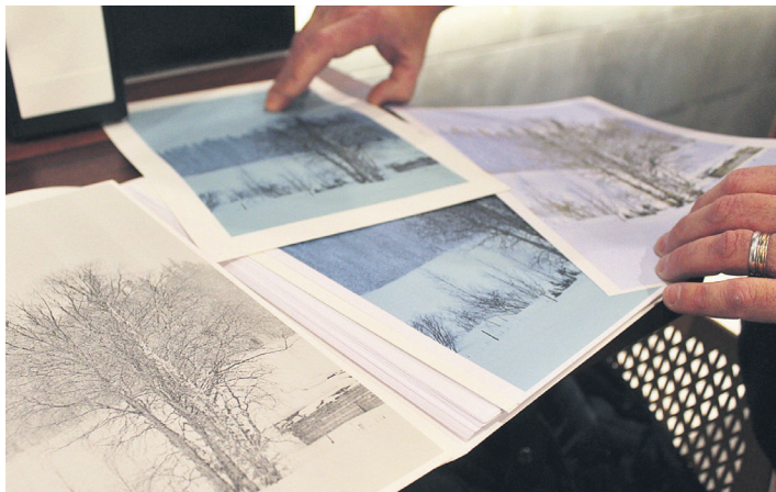
Gaztetatik du argazkilaritzarako zaletasuna erakusketaren egileak. TXINTXARRI

taketa eginda, horiek nola kokatu nahiko erraz erabaki nuen, erraztasuna baitut aurrez nola geratuko diren irudikatzen.