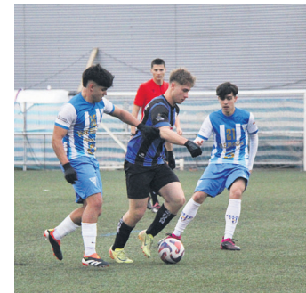
Erregional mailako derbia. TXINTXARRI

Epailearen azken txistuarekin bat neurketa hasierako postuak trukatu zituzten herriko taldeek; Ostadar SKTk laugarren postura igo zen eta Texas bosgarrenera jaitsi zen. Hurrengo fasean,