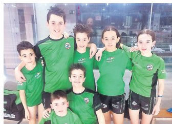
Alebin taldea. BURUNTZALDEA IKT

Alebin mailako zazpi kide izan ziren lehenak igerilekura jauzi egiten. Ligako hirugarren jardunaldia 200 m. bizkar probarekin hasi zuten gaztetxoek eta marka hobekuntza "nabarmenak" egin zituzten. Bular estiloko 50 metroko proba izan zen hurrena: "Asko landu ez arren, igeriketa erak ez ziren batera txarrak izan". Jardunari amaiera emateko 40x50 m. lau estilo erreleboari egin zitoten aurre.