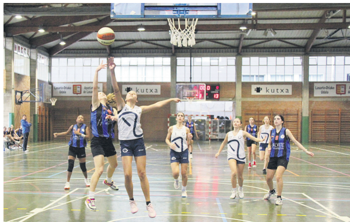
Ostadar eta Antigua Luberriko jokalariek, lehen. TXINTXARRI

Lehen kanporaketa Antigua Luberriren aurka jokatu zuen hilaren 18an talde-urdirin beltzak Maialen Chourraut kiroldegian.