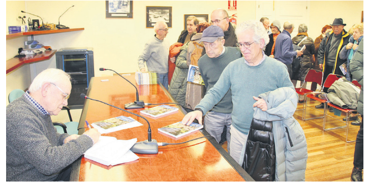
Ale bat eskuratu eta egileak sinatzeko aukera izan zuten bertaraturakoek.

Miguel de Oquendoren bizitzari buruzko zenbait zertzelada emanda, liburuen edukira pasatu zen. Lehena, El héroe cántabro . Vida del Señor D. Antonio de Oquendo , 1666. urtean idatzi zuen Antonio aitaren oharretan oinarrituta. Zenbait gatazkatan izandako parte hartzea aztertzen du eta helburu du "bere balentriak