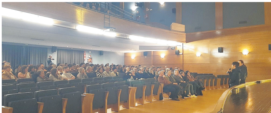
OKENDO ZINEMA TALDEA