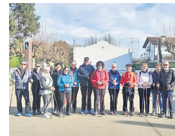
OSTADAR IPAR MARTXA

Horrez gain, ipar martxa taldea, euren irteera egutegiari jarraipena emateko, Deba-Ondarru ibilbidea