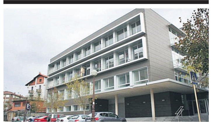
Anbulatorioaren artxiboko irudi bat. TXINTXARRI