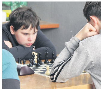
Jokariak, lehian. TXINTXARRI

A taldeko kideak ederki borrokatu ziren lehia ezberdinetan.