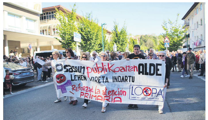
Osasun zentro paretik abiatuko dira manifestariak.

Bestalde, hilabeteko kultura agendak aurrera darrai eta hurrengo antzeztana Artedramaren Miñan izango da, bihar (hilak 25), kultur etxean, 20:00etan.