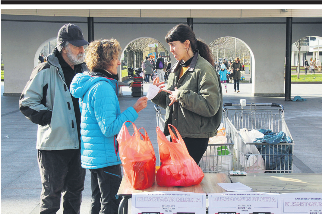
Elkartasun sareko kideetako bat, bi lasarteoriatarri informazioa ematen. TXINTXARRI