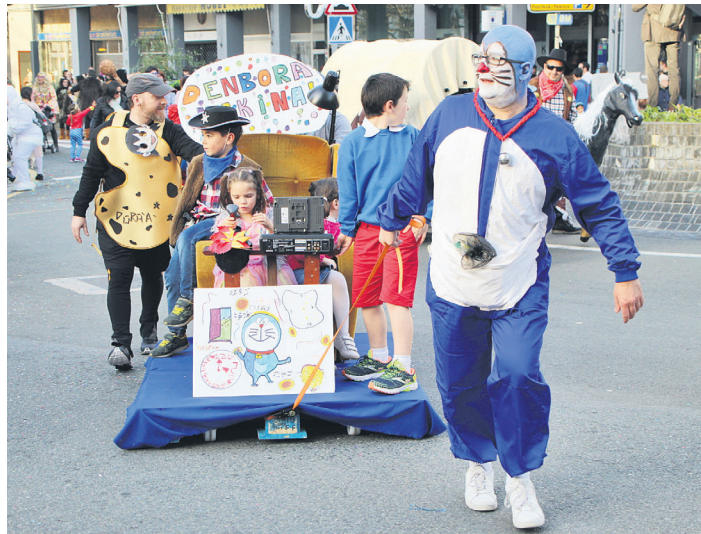
'Doraemon' euskaraz ikusi bitartean hazi dira herriko belaunaldi ugari. TXINTXARRI

Inauteri astebururako (egun handia martxoaren 1a izango da, larunbata) mozorroak prestatzeko zeinbat gomendio eman ditu Sorgin Jaiak. "Erabiliko dituzuen jantziak etxean dituzuen oihal, arropa zahar edota bigarren eskuko arroparekin egitera animatzen zaituztegu, eskuz egiteak berezitasuna eta xarma emango dielako mozorroei, eta, gainera, kontsumo