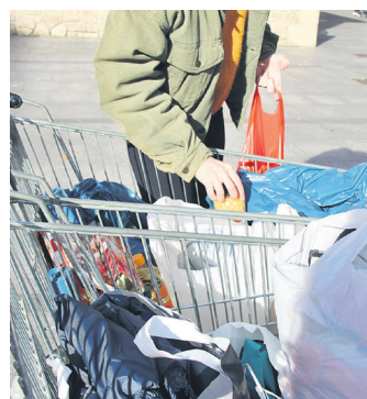
Jasotakoa, karrora sartzen. TXINTXARRI

Elkartasun sareko kideek jakinaz dute ehun afaritik gora emateko elkartuko direla hila-bete bakoitzeko azken asteartean. Horrekin batera, Donostiako Udalaren jarrera deitoratu du: "Negu gorria da eta ez dute baliabiderik jarri kale egoeran dauden pertsonen beharrik asetzeko". Horregatik erabaki dute arropa eta urteko garai honetarako bestelako jantziak ere biltzea, afariak prestatzeko elikagaiez gain.