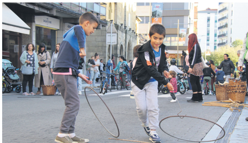
Bi haur, uztaiekin jolasean, Kale Nagusian. TXINTXARRI