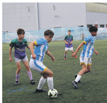
Kadeteen partidako irudia. TXINTXARRI

Kadete mailako taldeak eman zion hasiera egunari. Neurketa borrokatua jokatu zuten zuri-ur-