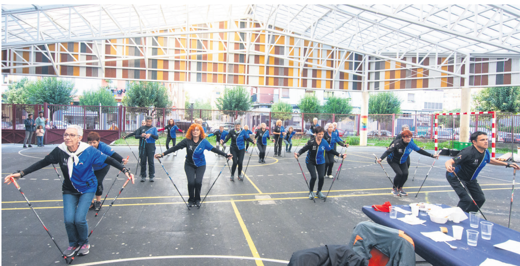
Ostadar Ipar Martxakoek koreografia berezi bat prestatu dute, ETS taldearen 'Aukera berriak' abestiaren gainean. TXINTXARRI