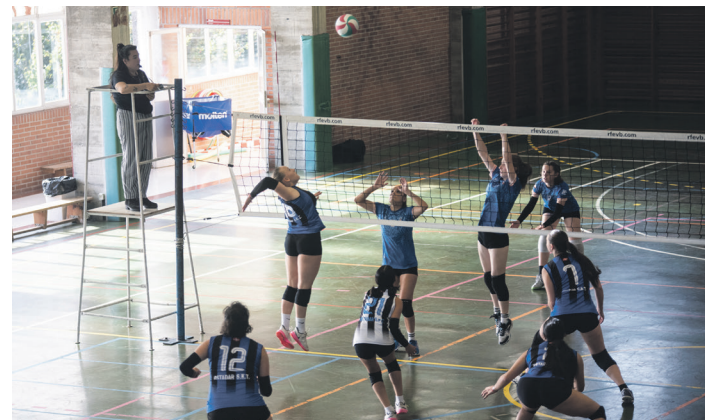
Bera Beraren aurka jokatu duen lagunartekoko irudia.