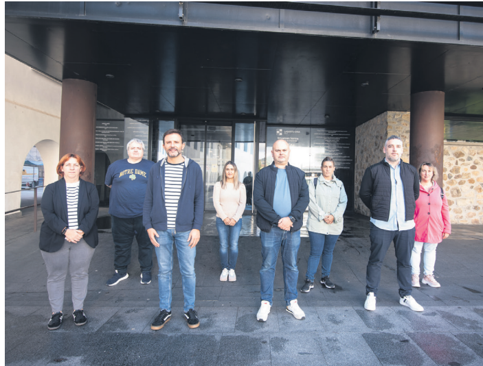
Gobernu taldeko zinegotzietako zortzi, udaletxe atarian. TXINTXARRI

Aurreko legealdietan udal gobernuarena zen programazioaren "zati handi bat" bereganatzea ere leporatu diote koalizio subiranistari. "Orain, kritika batzuk egiten ditu ezer zehatzik ekarri