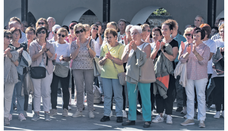
Dozenaka herritarrek bat egin zuten mobilizazioarekin. TXINTXARRI

"Gabezietan larriena" iruditzen zaiena da "Osakidetzako arduradunek etorkizunerako iragartzen duten osasun publikoaren eredua". Azaldu zuten familientzako erreferentziazko pertsona ez dela medikua izango, erizaina baizik. "Zer medikuntza pre-