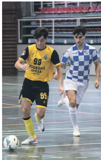
Gazteen mailako neurketa.

Egun bat lehenago, Maialen Chourraut kiroldegiko kantxan,