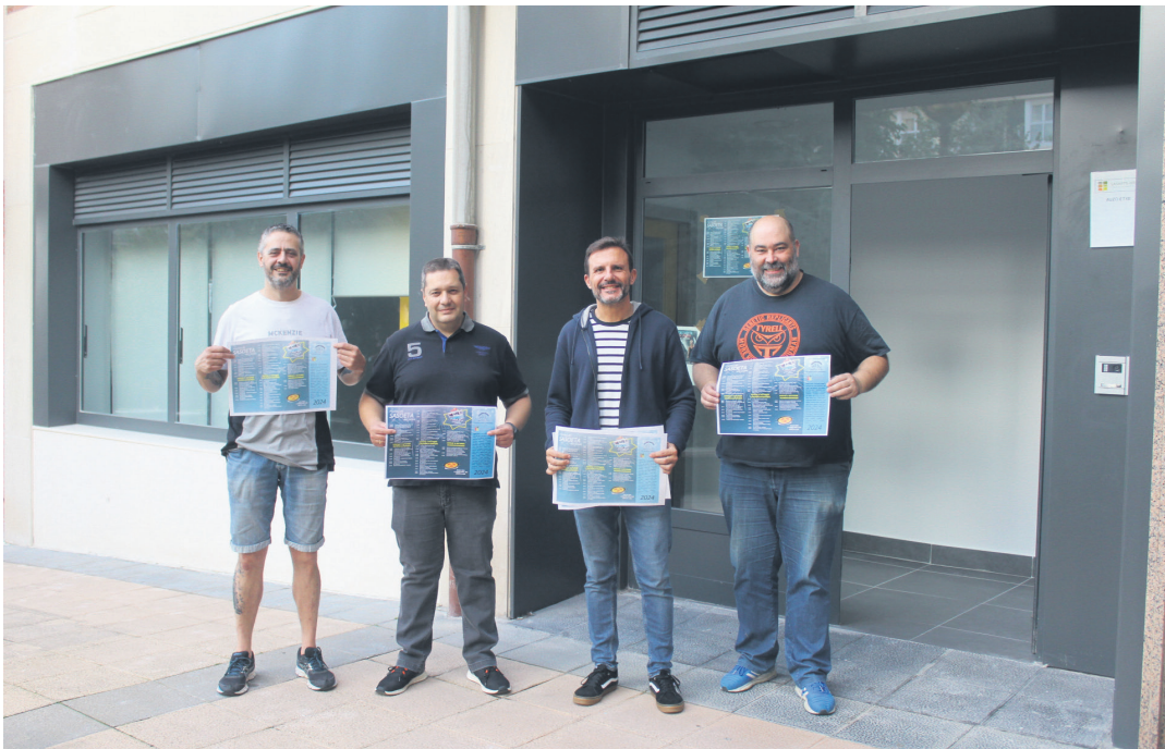
Sasoeta Sasoian elkarteko zuzendaritza batzordeko kideak eta alkatea aurtengo festak iragartzeko agerraldian. TXINTXARRI