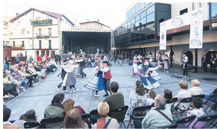
Okendo plazan ospatu zuten VI. Dantzari Eguna. TXINTXARRI

Dantzarako jantziak kalekoenagatik ordezkatu eta Semblante Andaluz elkarteak Atso Bakarren duen egoitzan bapo afaldu zuten Erketzeko eta Makaiako lagunek. Kontu kontari aritu ziren giro ederrean, eta, nola ez, afalostean mahaietatik altxa eta dantzatze- ra animatu ziren asko.