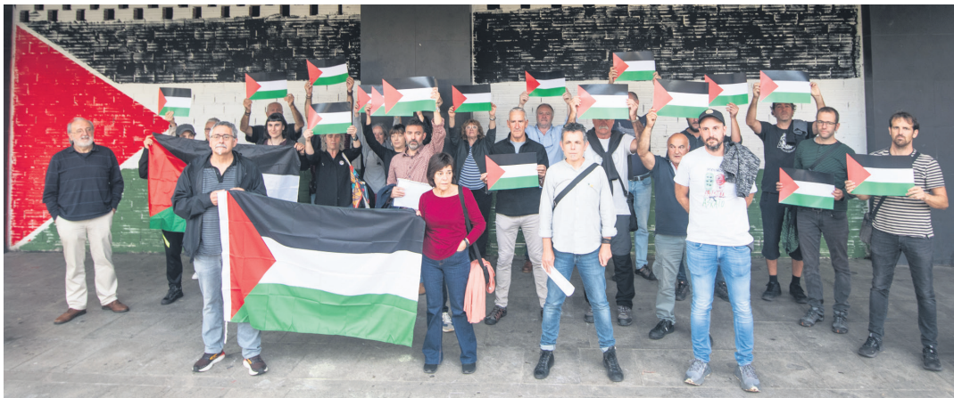
Lasarte-Oria Palestinarekin Herri Ekimeneko kideek Askatasunaren parkeko mural aurrean egin dute agerraldia. TXINTXARRI