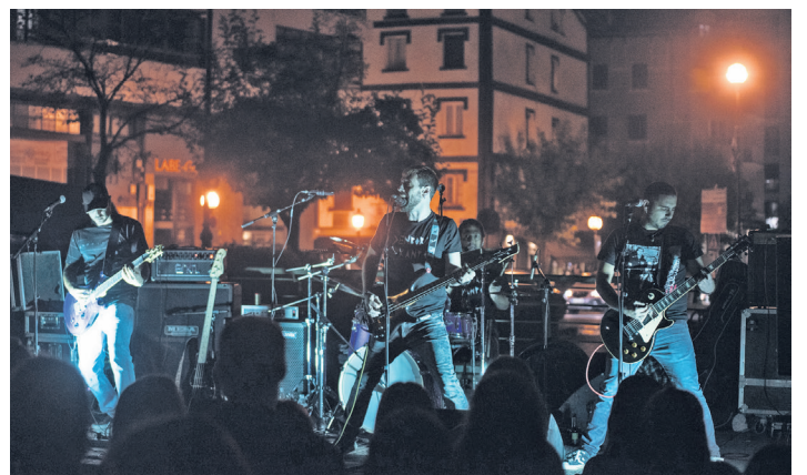
Denboraz Kanpo taldea, 'Dragonera' kantua jotzen. TXINTXARRI