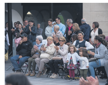
Dantzari eta musikarien lana eskertu zuten ikus-entzuleek. TXINTXARRI