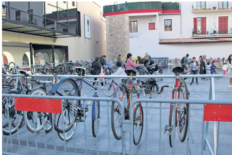
Erakutsitako ibilgailuen erdiak saldu zituzten bigarren eskuko azokan. TXINTXARRI

Egun bat geroago 10 urte bete zituen Ostadar Ipar Martxa taldeak ere parte hartu zuen Mugikortasun Egunean eta Okendo plazatik abiatuta ibilaldi bat egin zuten parte hartzaileek, makilak eskuetan hartuta.