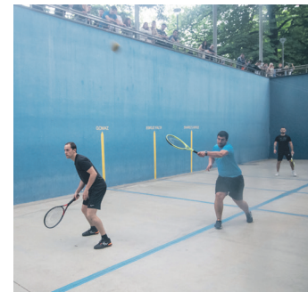
Bikotekako txapelketako irudia. TXINTXARRI

Txapelketa federatura jauzi egingez, iraileko azken asteburuan, Intza KEko Nagusien 3. mailako pilotariak txanponaren bi aldeak