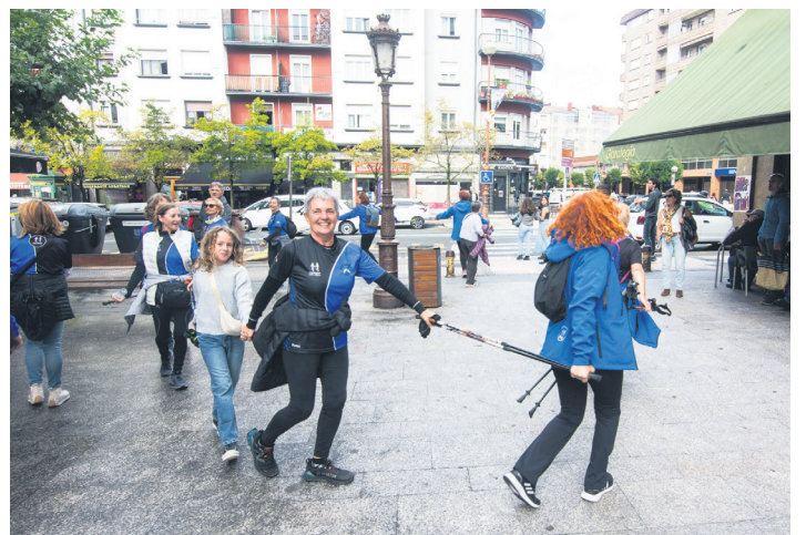
Bazkaldu aurretik kalejiran ibili ziren ipar martxalariak. TXINTXARRI