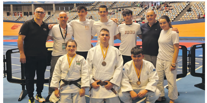
Euskadiko ordezkaritza, Valentziako Superkopan. LOKE JUDO

Eta bien bitartean, hilaren 5ean eta 6an, Onilgo Nazioarteko igoera lehiatuko du Alacanten, Valentziako Erkidegoan. Gogotsu doa herritarra, "bigarren geratzen denak alde ireki dezake eta gu izatea espero dugu. Bestela Ibizako proba ere geratzen zaigu", adierazi du.