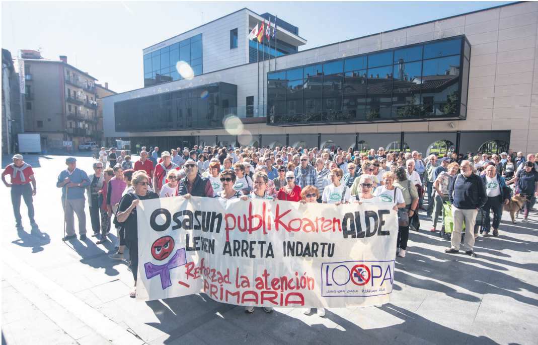
Okendo plazan kontzentrazioa egin eta gero manifestazioan abiatu ziren partaideak Correosen bulegora. TXINTXARRI