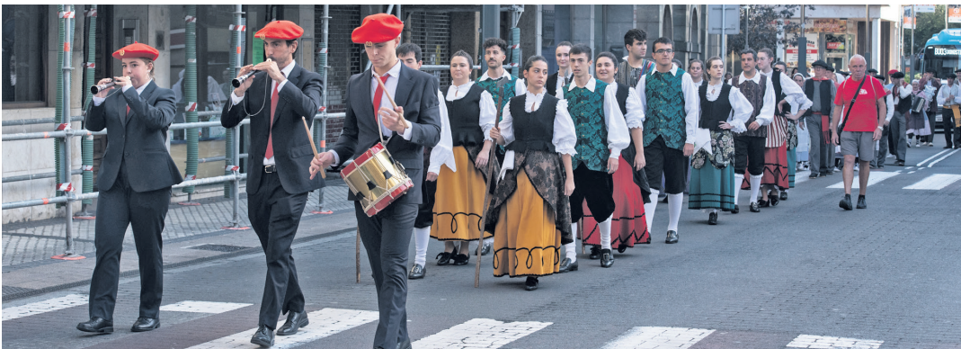
Makaia eta Erketzeko kideek erdigunea zeharkatu zuten, kalejiran.