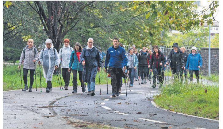
Goizean goiz makilak hartu eta ibilaldia egin zuten herrian barrena. TXINTXARRI

Trikipoteoa egin zuten ondoren, festa giroan, Arkupe eta Buenetxea tabernetan tragoak hartuta. Oriarte Landaberi eraikinera bazkaltzera joan zirenerako ia prest zeuden Beltzak errugbi taldeko kideek prestatutako paella goxoak. Sabelak ongi beteta zituztela hasi zen arratsaldeko emanaldi sorta, gauera arte luzatu zena.