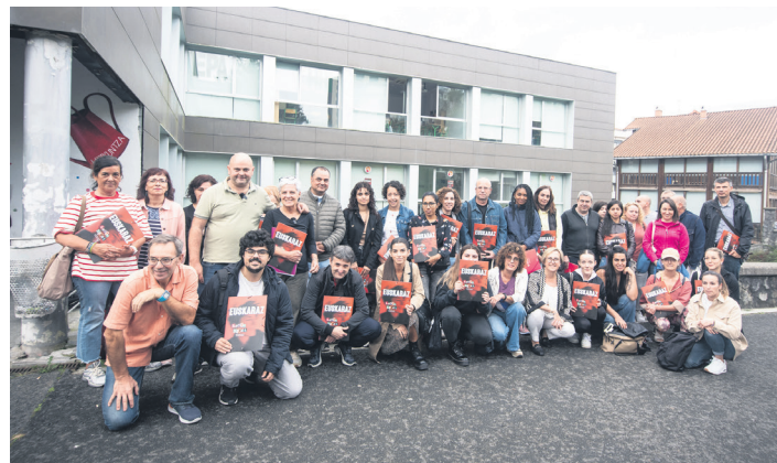
Udal Euskaltegiko arduradun, irakasle eta ikasle talde argazkia.

Aurrez aurreko hamar talde osatu dituzte astean lau egunez aritzeko; astelehenetik ostegunera eta A1 mailatik C1 mailara. Horrez gain, zenbait ikasleek sarean ikasiko dute baina geroago hasiko dira, hilaren 15ean, Galanek azaldu zuenez. "Helbu-