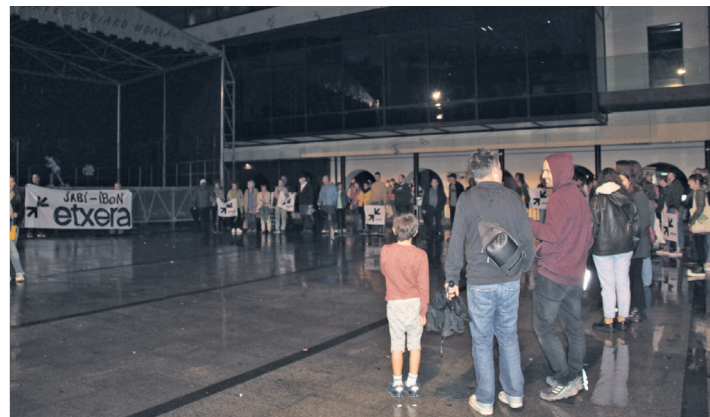
Okendo plazan amaitu zuten mobilizazioa. TXINTXARRI

laren 25ean Behin Betiko dinamika abiatzea. "Bakeari, konponbideari eta elkarbizitzari atea behin betiko irekitzeko unea dela eskatzera gatoz", eta azken hila-beteetako bidetik, presoen auziari "behin betiko aterabidea" ematea aldarrikatzera. Halaber, 2025eko urtarrilaren 11n Bilboko kaleak bete nahi dituzte, "euskal presoen auziaren konponbidea zein biolentzia ezberdinen biktimen errokonozimendua berehala eta behin betiko iritsi dadila eskatzeko".