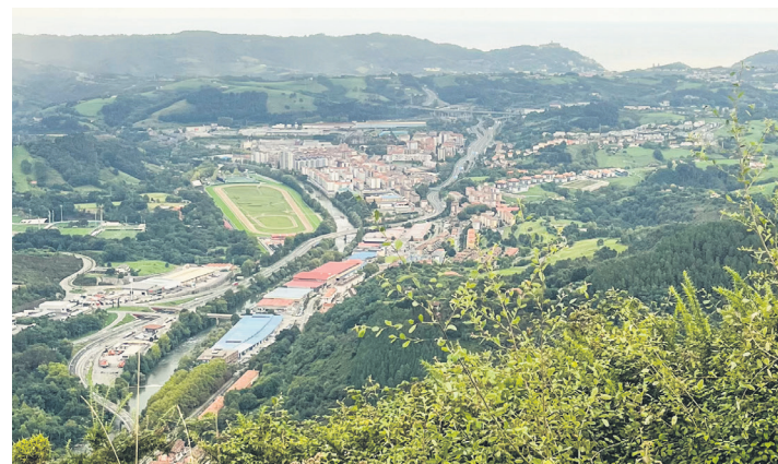
Artxiboko irudi honetan Lasarte-Oria ikus daiteke, Buruntza menditik.

adierazten du Lasarte-Oriak udalerririk bat eremu tentsionatu izendatzeko bete beharreko baldintzak betetzen zituela. Bi betekizun behar dira izendapen hori lortzeko; lehenik eta behin kontuan hartzen da 2017 eta 2022 urteen artea alokairuen prezioa %17 baino gehiago hazi ez izana, eta Lasarte-Oriaren kasuan, %18,15eko igoera izan duela zehaztu du. Bigarrenak, berriz, herritarrek alokairuak ordaindu ahal izateko egin beharreko ahalegin ekonomikoari erreparatu dio. Horri dagokionez, azaldu du herritarren batz besteko diru sarrerak kontuan hartuta, horretara bideratu beharreko