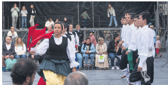
Makaiako dantzari talde bat, emanaldi betean. TXINTXARRI