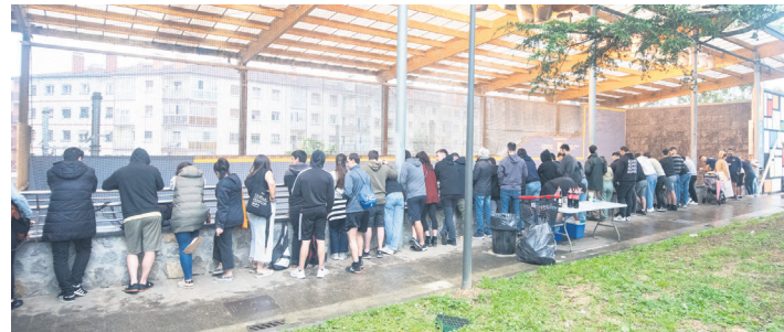
Herriar ugari bertaratu ziren Trinketera egun osoan zehar. TXINTXARRI

Arratsaldeko lauetan hasi ziren semifinalak: lehenengo, Arruti