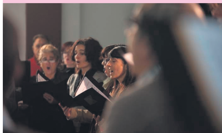
Alboka koruaren artxiboko irudi bat. TXINTXARRI

Kale Nagusitik Andatza plazara, 21:30ean.