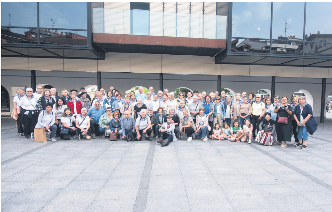
Xumela eta Biotzetik koruetako kideek kuadrilla ederra osatu zuten. TXINTXARRI