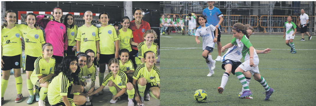
Ezkerrean, Martutene KEk eraman zuen garaikurra. Eskuinean, neurketa bateko irudia. TXINTXARRI