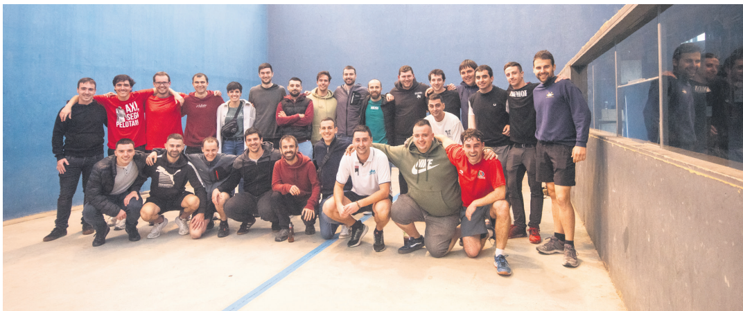
Txapelketako partaide eta antolatzaileek talde argazkia atera zuten finalaren ostean. TXINTXARRI