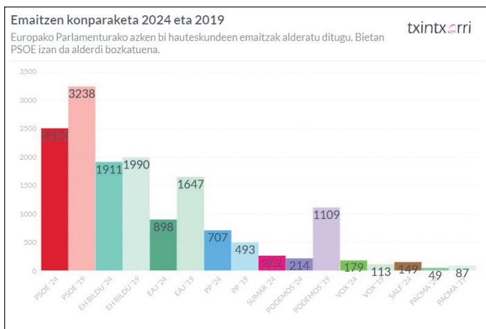
Alderdi gehienek 2019an baino boto gutxiago jaso dituzte. TXINTXARRI

18 urterekin, ikastolatik ateratzen zarenean, zaila da gero zer egin nahi duzun argi izatea. LEINN niretzat, hazkunde pertsonalerako tresna bat izan da, neure burua ezagutzeko, mota guztietako jendea ezagutzeko, mundua eta kultura desberdinak ezagutzeko, nire indargune eta ahulguneak aurkitzeko eta etorkizunean zer nahi dudana erabakitzeke balio izan dit.