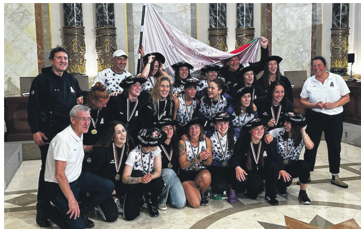
Donostia Arraun Lagunak Euskadiko txapelketako garaikurrekin. IÑAKI GABARAIN

Hemezortzi segundo gehiago egin zituen Orio Orialkik (14.43,66) baina Ondarroa zein Tolosaldearen antzera hamar segundoko zigorra jaso zuten, behar baino aurrerago hasteagatik; itsasoak ez zuen ontziki