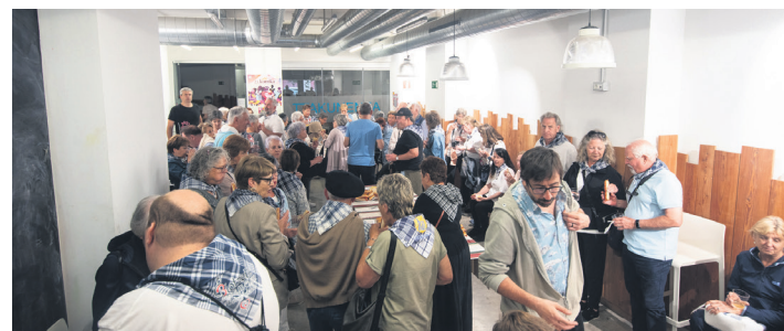
Jana eta edana izan zuten partaideek Ttakunenea elkartean. TXINTXARRI