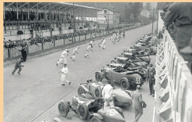
Gidariak korrika joaten ziren autoetan sartzera.

Toponimiaren webgunea zure eskura: toponimia.lasarte-oria.eus LASARTE-ORIAren ondarea