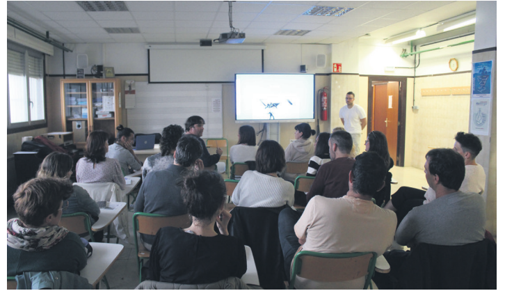
Gailuen erabilera goiztiarrek bezalako kezkatutako hogeit guraso batu dira.

Landaberri Guraso Elkarteak gonbidatuta, ongizate digitalean aditua den Telmo Lazkano izan da Oriarte-Landaberri ikastetxean. 'Gazteak eta gailu digitalak. Zeren aurrean gaude?' hitzaldia eskaini du. Hogeit bat ikus-entzule bertaratu dira