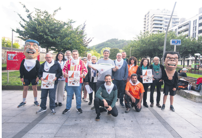
Udal ordezkariak eta herriko eragileak egitarauaren berri emateko agerraldian. TXINTXARRI

Festa egun ofizialei hasiera eman aurretik, aurrekari izango diren ekimenak aurkeztu ditu; herri eragileek antolatzen dituzte horiek, hala nola, mahai jolasen, gimnastika eta lerroko dantzen erakustaldiak, edota Alboka koruaren eta Erketz EDTaren emanaldiak eta Udal Musika Eskolako ikasleen kontzertuak. Gogoan izan du baita ere, LOTMEk aurrera eramango duen mendi irteera. Ez du egitarau osoaren aurkezpena egin;