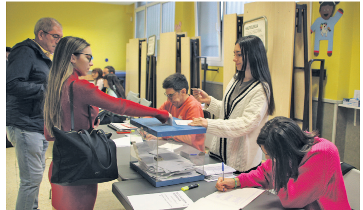
Hauteskunde hauetan 7.048 herritarrek bozkatu dute.

Herritarrek hautetsontzietan utzitako 7.048 botoetatik 24 izan ziren baliogabeak; zuriak, berriz, 35. Bestela esanda, hautagaitza aurkeztu zuten zerrendek 6.989 bozka jaso zituzten denera.