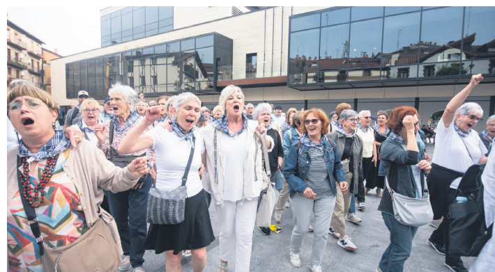
Denbora gutxian harreman estua egin zuten. TXINTXARRI