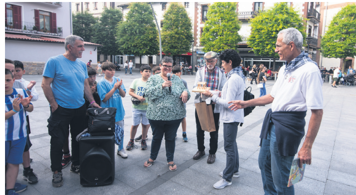
Ttakun KEk oroigarri bat oparitu zien Boisetik etorritako lagunei.