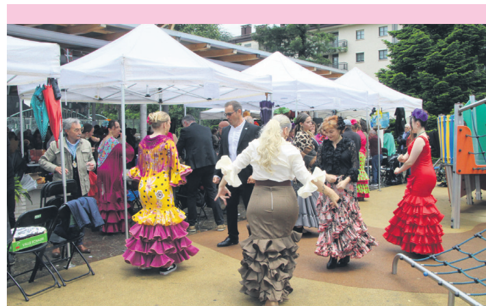
Gogotik dantzatu dute Rocioko erromeria gerturatutakoek. TXINTXARRI

Horrez gain, aurten ere San Joan bezperako soka dantzan eta San Pedro eguneko mezan parte hartuko duela jakinarazi du.