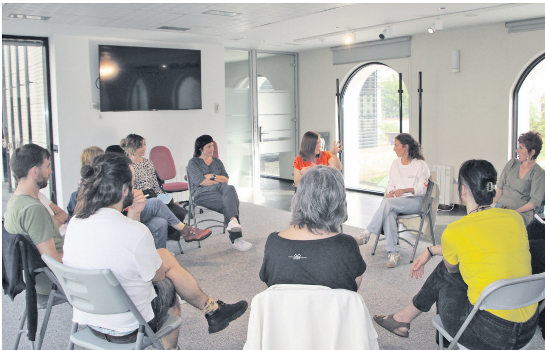
Lizar Begoñaren 'Mundu zitalaren kontra' landu zuten Antonio Mercero aretoan. TXINTXARRI