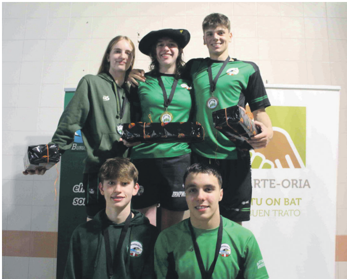
Buruntzaldea IKTko bost kide izan ziren podiumean.