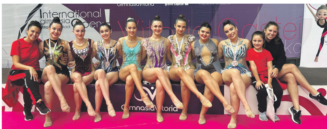
Open torneoan parte hartu zuten LOKEko gimnastak eta entrenatzaileak. LOKE GIMNASTIKA

tearra, Orioko, Sanse, Intxaurdi A eta B, Aierru, Touring, Martutene, eta Aiztondo A eta B. Bazkaltzeko tartearren ondoren, kanporaketei