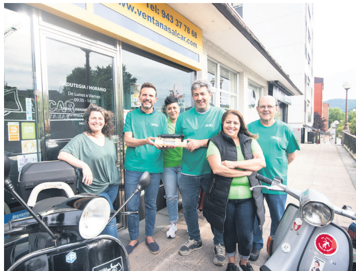
Scooter Club Euskadikoek orroigarri bat eman diote udalari. TXINTXARRI

Urteotan guztiotan norbanako, eragile, babesle eta erakundeak