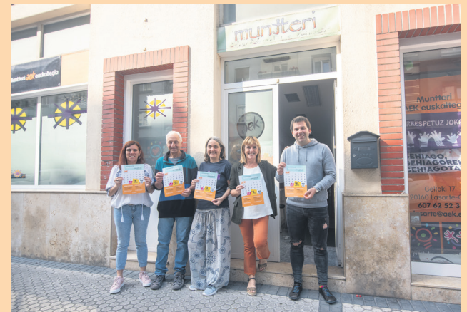
Hilaren 19an ate irekien jardunaldia egingo dute euskaltegian. TXINTXARRI