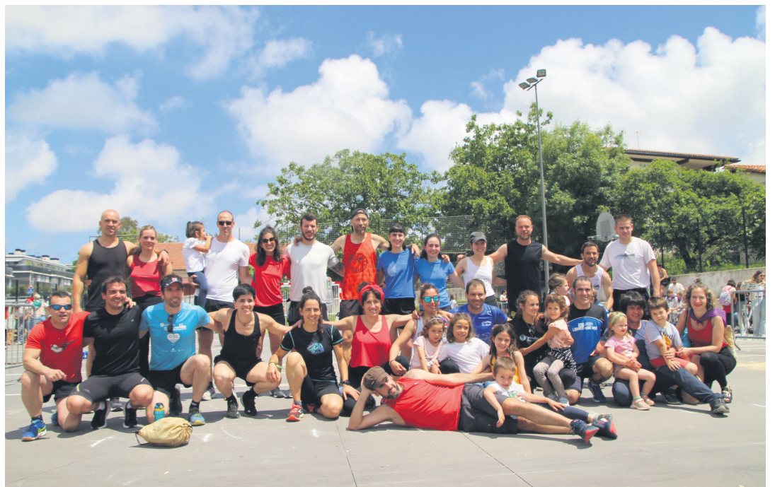
Aurtengo proba mistoko parte hartzaileak, lanak amaitu berritan. TXINTXARRI