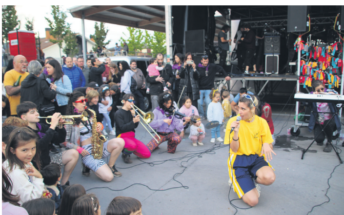
Elektropottottek girotu zuen larunbat arratsaldea. TXINTXARRI