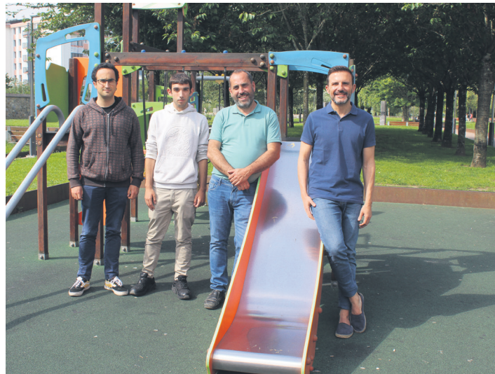
Udalaren Udako Txokoen aurkezpen agerraldiko irudia.

Velasco hartu du hitza, eta txokoen gaineko informazioa eman. Esan du bi txanda eskainiko dituztela; uztailaren 3tik 30era lehena, eta, abuztuaren 1etik 30era, bigarrena; hala nahi dutenek, bietan parte hartzeko aukera izango dute. Jakinarazi du horietan aritu ahal izateko izen emate epea datorren astelehenean, hilak 10, irekiko dela eta hilaren 19an amaituko. Bi bide izango dituzte interesdunek horretarako; lehena, kultur etxeko garai bateko kafetegira joanda (17:00etatik 20:00etarako ordutegian); bigarrena, berriz, sarean. Azken aukera horretarako (eta txokoen gaineko informazio osoa kontsultatzeko) honako web ataria erabil daiteke: www.udakotxokoaklasarte-oria.com . Inskripzioa sarean egiten dutenek, izen emate orria deskargatu, bete eta arduradunek