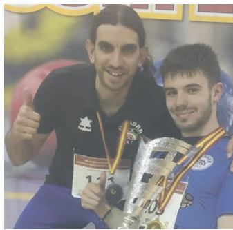
Santin, garaikurrarekin. OSTADAR INKLUSIOA

Barkaka BC2 kategorian lehiatu zen urdin-beltza. Saillapen fasean hiru neurketari aurre egin zien B multzoan eta hirurak irabazi ostean, multzoko lehen