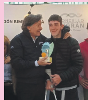
Goenaga, saria jasotzen. OSTADAR INKLUSIOA

Inklusioko saileko arduradunek aipatu dutenez, kirolariak "nazioarteko txapelketen zirkuituari ekin aurretik sasoi olean dagoela erakutsi du".