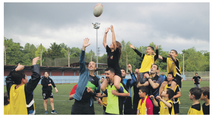
Errugbi eskolako haurrek zein senideek ederki gozatu zuten goizean. TXINTXARRI

Eta amaitzean guztiek hirugarren denboraz gozatu ahal izan zuten.