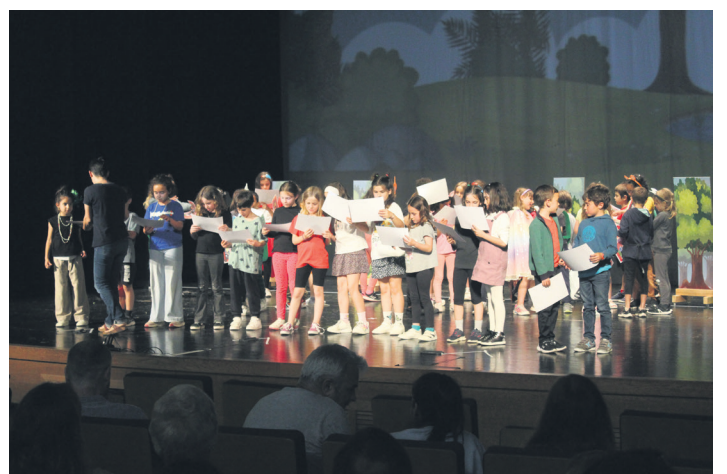
Erakustaldiaren amaieran, diploma bana jaso dute ikasleek, irakasleen eskutik. TXINTXARRI