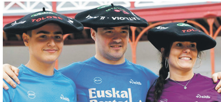
Telleria (erdian), II. mailako gainerako irabazleekin. EUSKAL PENTATLOIA

Korner batean guztia aldatu zen, ordea; aurkariak gola egin eta berpiztu zen. Ostadarrek saiatu arren, ezin izan zuen neurketa berdindu eta Ohorezko mailako igoerako ametsa hurrengo urterako utzi beharko du taldeak.