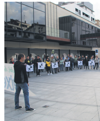
Partaideak, Okendo plazan. TXINTXARRI

Lasterbia hamargarrenez aurrera eramango dute Abadiñon ekainaren 14an eta 15ean. Egun horretan hamarkada beteko da Sare Herritarrak San Telmo Museoa euskal preso, iheslari eta deportatuen eskubideen aldeko herritar sarea aurkeztu zuela. Aurrera eramandako bi-