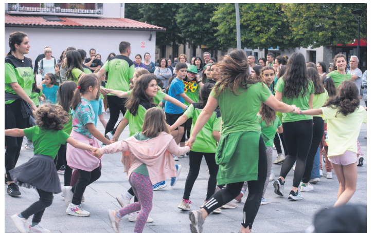
Okendo plazan bukatu zuten desfilea, kalejira eginda. TXINTXARRI