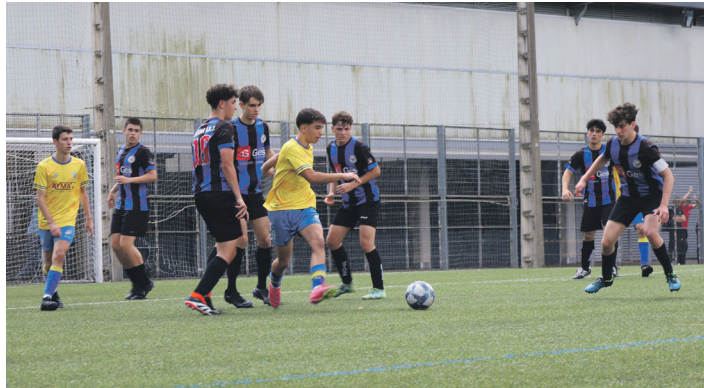
Jubenil taldeko jokalariek defentsa lanetan.