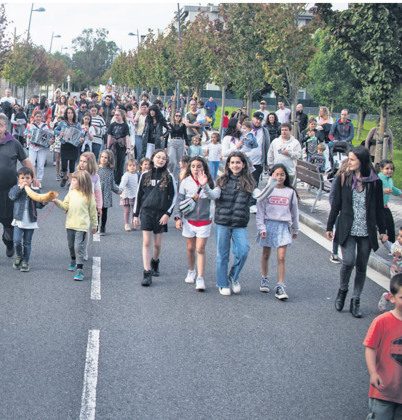
baina, aurreko urteetan bezala, jendetza bildu zen Teresa Sorgiñaren inguruan. TXINTXARRI