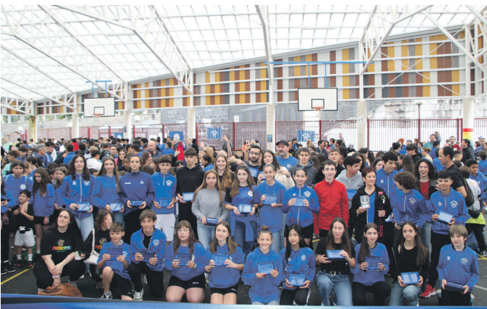
Ostadar SKTko sarituen talde argazkia. TXINTXARRI

Klubari agur esango dioten entrenatzaile batzuei oparia eta aipamen berezia egin zizkieten eta zenbait jokalariren gurasoek ere oroigarriak jaso zituzten.