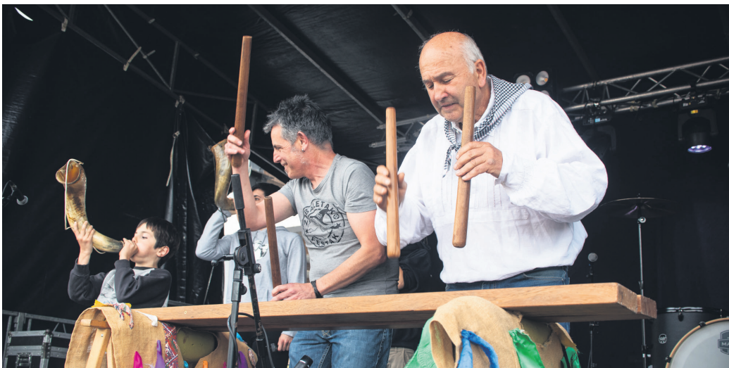
Txalaparta eta adar doinuekin egin zioten ongietorria auzoko zaindariari. TXINTXARRI