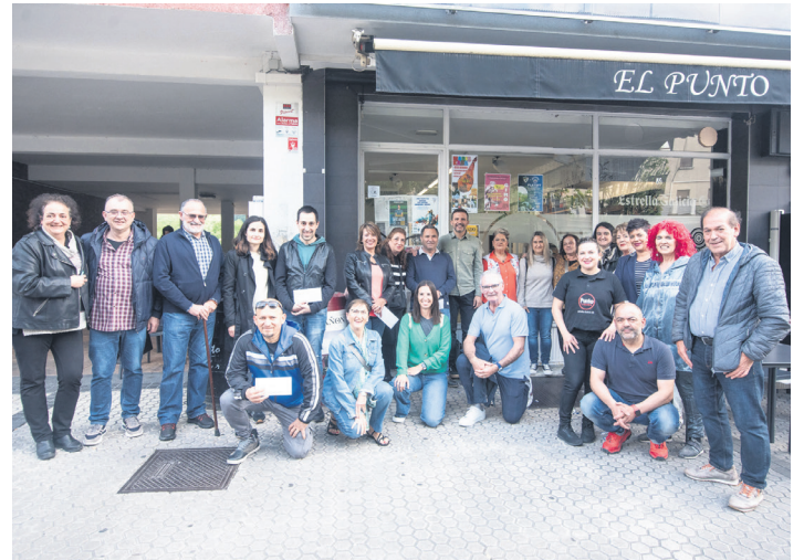
El Punto tabernan banatu zituzten sariak. TXINTXARRI

Udaberriko Festaren beste alorretako bat izan da maiatzaren 13tik 25era herriko 70 dena baino gehiagotan egindako kanpaina: horietan erosi zuten guztiak zozketa batean sartu ziren eta zortzi pertsonak 250