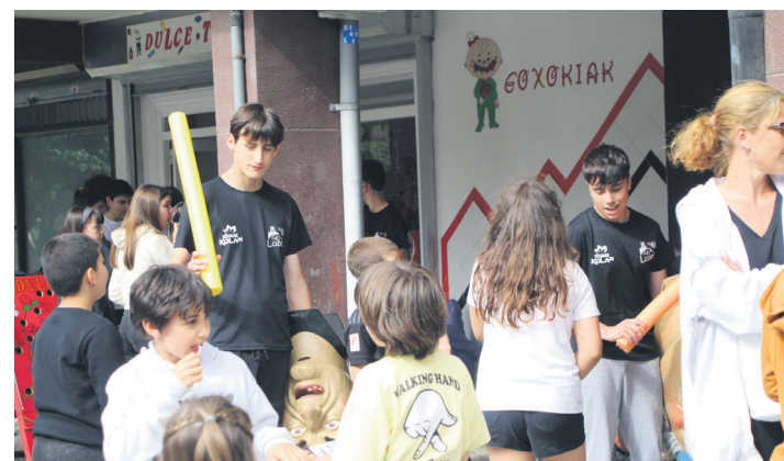
Auzotar ugari ibili ziren Dulce Tentacion denda inguruan. TXINTXARRI

Aipatu establezimendu horrek makina bat jardueretan parte hartzen du urtean zehar, Sasoetari eta herriari bizia emateko helburuz. Azkenaldian, adibidez, Aterpea elkartean Udaberriko Festan edota Erreginaren Kopako finalaren aurretik Realari animoak emateko jaialdian.