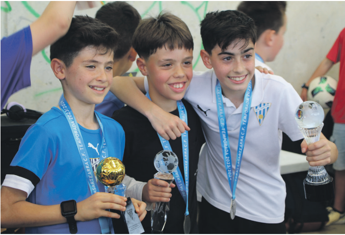
Texaseko jokalariek poz-pez jaso zituzten euren domina eta sariak.