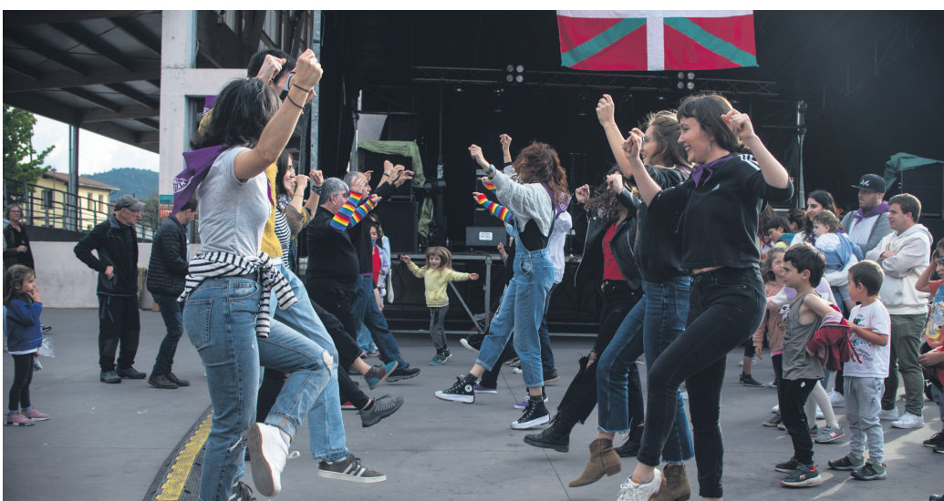
Sorgin Dantza herrikoa dantzatu zuten jaietako pregoia irakurri ostean.