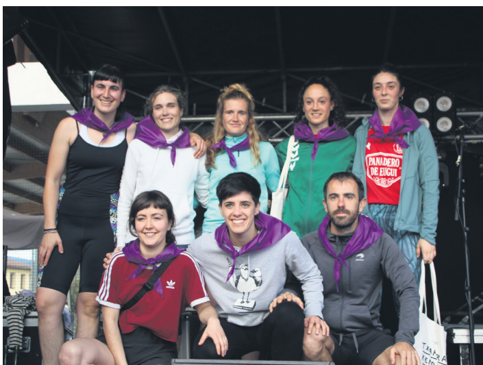
Aurtengo pala eta frontenis txapelketetako finalistak. TXINTXARRI