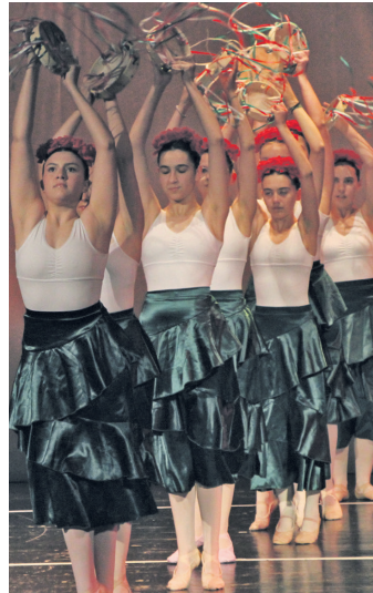
Dantzari talde bat.

Gauza bera egingo dute hilaren 17, 18 eta 19an instrumentuekin aritu diren ikasleek: gitarra klasikoa nahiz elektrikoa, zeharkako flauta, pianoa, biolina... Egun horietako bakoitzean kontzertu bat emango dute kultur etxeko auditorioan, 19:00etatik aurrera. Sarrera doakoa dela jakinarazi dute antolatzaileek.