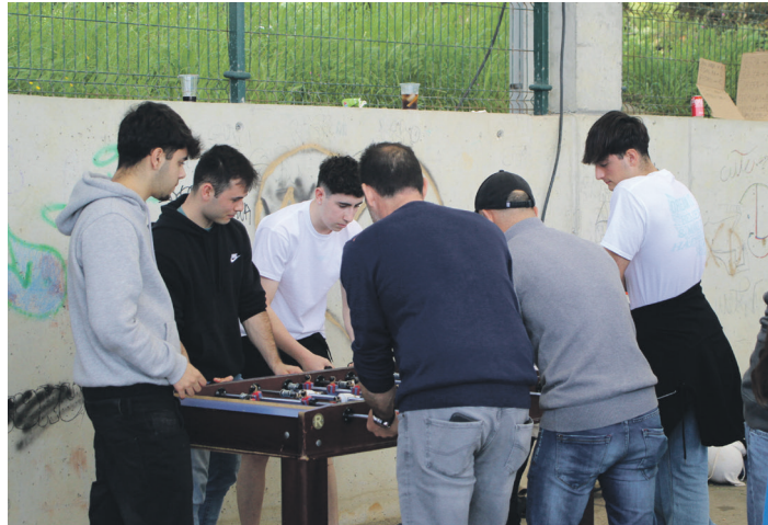
Sari banaketa baino lehen futbol edo futbolin partidak izan ziren. TXINTXARRI