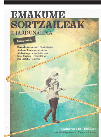
Jardunaldiaren kartela. IHITTEN ELKARTEA

dearen "balantzea egin" eta emandako pausoak "balioan jartzeko" ekitaldi burutuko dute ekainaren 23an San Telmo Museoa bertan. Ibilbidearen parte izan zirenei gonbitea luzatu zieten ekimen horietan parte hartzeko.