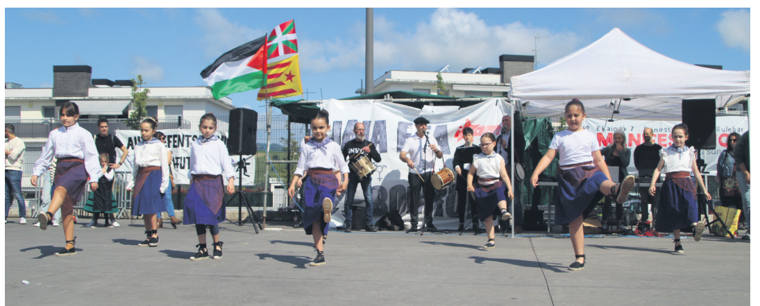
Kukukako dantzariak emanaldi bikainak egin zituzten herriko txistularien taldearen laguntzarekin. TXINTXARRI