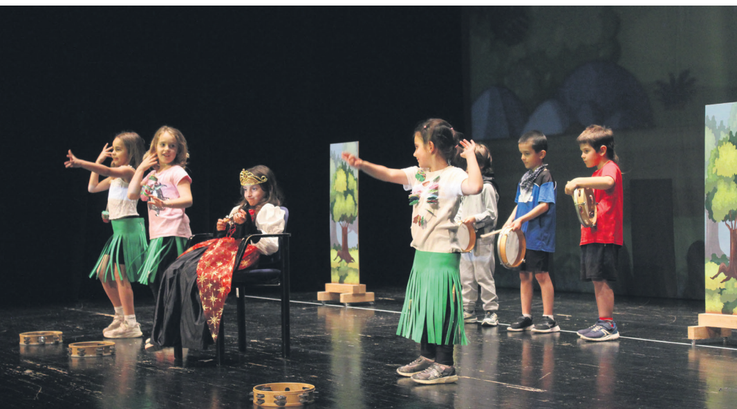
Antzerki obra koloretsu bezain landuak oholtzaratu dituzte LH 1-2 eta 3. mailako gaztetxoek. TXINTXARRI