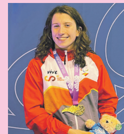
Zudaire, urrezko dominarekin. INCLUSWIM

Joko Paralimpiarrak prestatzeko bidean, Limogeseko World Para Swimming World Series proban ere izango da kirolari gaztea hilaren 7tik 10era.