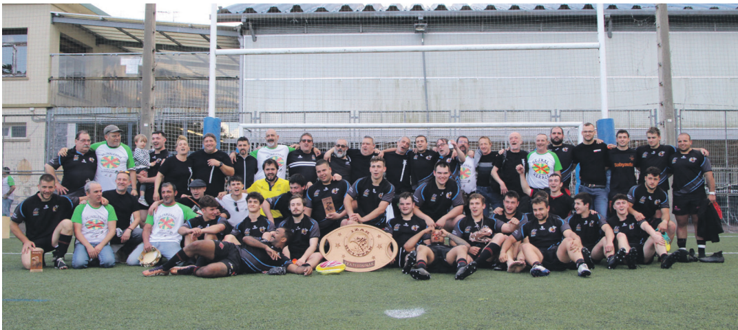
Beltzak errugbi taldeko kide ohiak eta Beltzak Lasarteorian ZRT taldea.