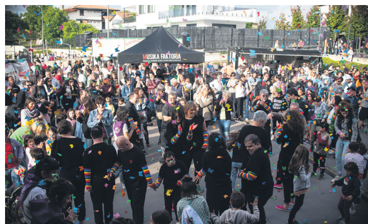
Emanaldi koloretsua egin zuen Jalgune elkarteak, konfeti eta guzti. TXINTXARRI