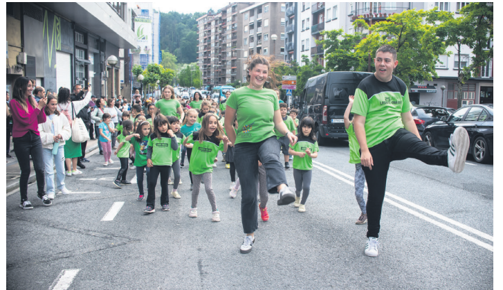
Dantzan eta irri egiten igaro zuten desfile osoa Kukukako irakasle eta ikasleek.

Aurtengo egitasmoari amaiera emateko, gaur eta bihar, hilak 7 eta 8, dantza ikasleak igoko dira eszenatokira.