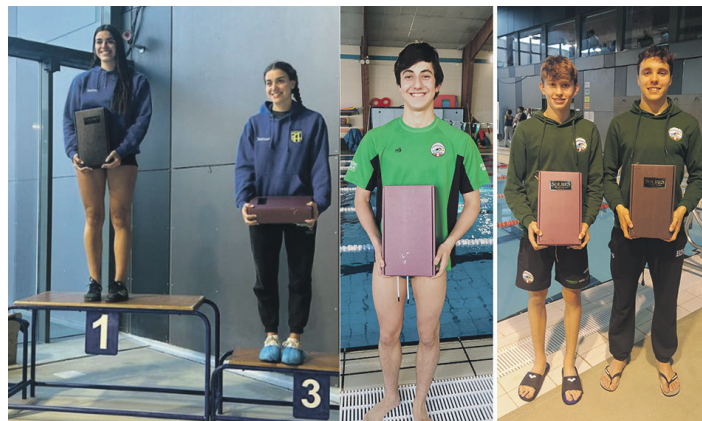
Martin ahizpak eta Buruntzaldea IKTKo kideak, sariek. BIDASOA XXI / BURUNTZALDEA IKT

Egun bat geroago, Ordiziako Majori kiroldegiko igerilekuan,