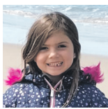
Ainara Zorionak sorgina!!! Muxu haundi bat familiaren partez.