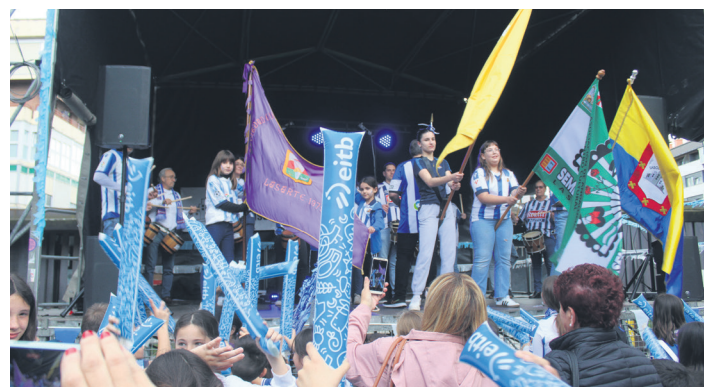
Realaren eta Lasarte-Oriako ereserkiak jo zituzten danborradako kideak. TXINTXARRI

Realeko jokalarien eskertza mezu bat entzun ahal izan zuten plazan bildutakoek, eta festa-ekin aurrera egiteko, danborrak