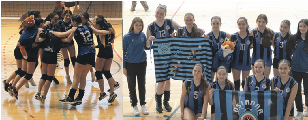
Ezkerrean, infantil A taldea garaipena eta Gipuzkoako txapelketa ospatzen. Eskuinean, infantil taldea. OSTADAR BOLEIBOLA