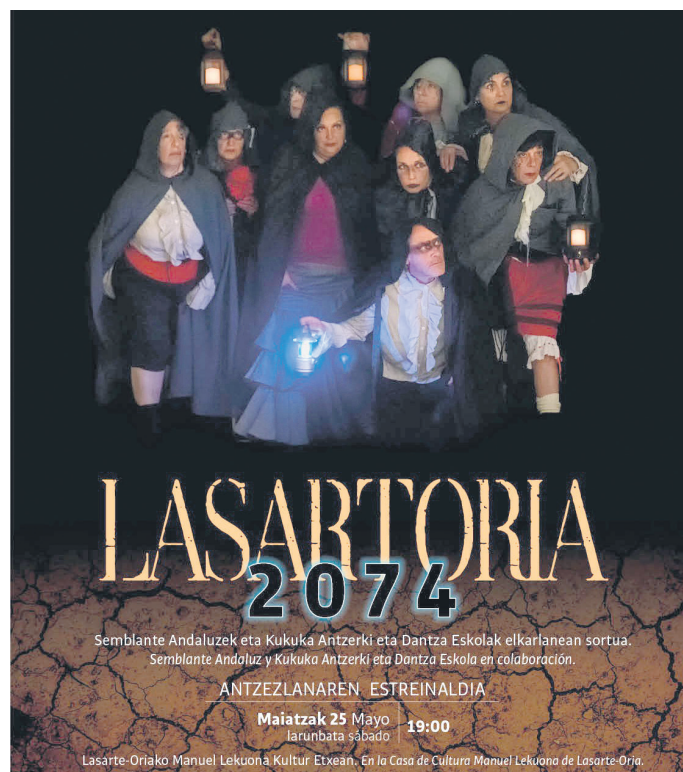
Afiza hau prestatu dute antolatzaileek antzerki obra iragartzeko. ANTOLATZAILAK

Semblante Andaluz elkarteko hogeitau bat lagun arituko gara, eta Kukukatik, aldiz, bederatzi aktore eta hogeitau bat dantzari. Xumela koruak ere parte hartuko du, eta herriko musikariak ere izango dira, gitarra elektriko,