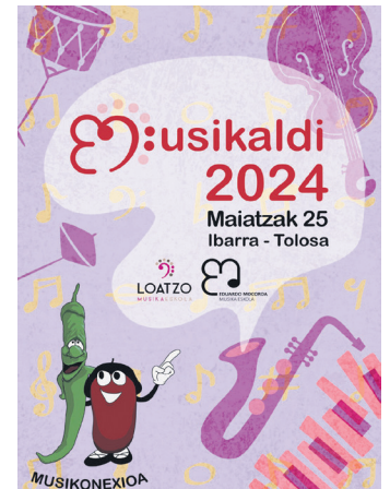
Ekimena iragartzeko afixa. MUSIKALDI

Herri ugaritako musika eskoletako kideak 09:30-10:00ak artean iritsiko dira Musikaldira eta 10:00etan hasiko den aurkezpen ekitaldian parte hartuko dute, Zumardi Han-