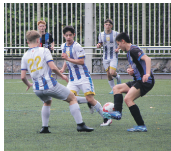
Jubenilen lehia. TXINTXARRI

Multzoko bigarren amaitu du Ostadarrek lehia buru izan den