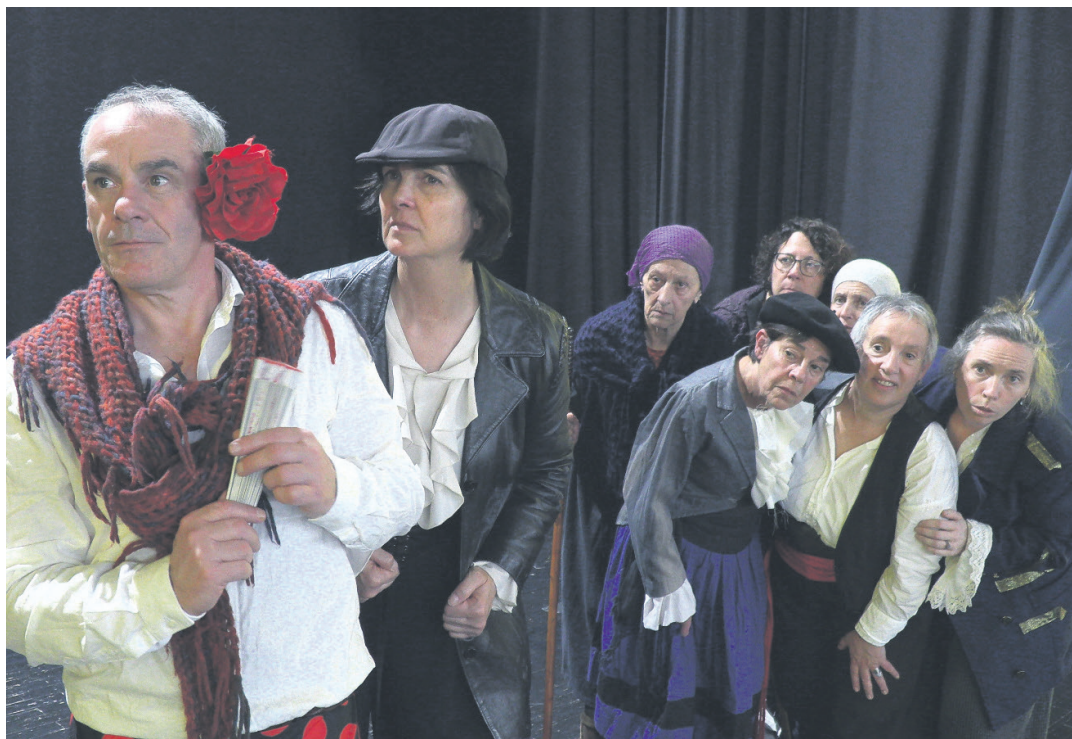
Irudiotan ageri dira Lasartoria 2074 obrako hainbat antzezle, jantziak soinean, entseatzan. KUKUKA ANTZERKI ETA DANTZA ESKOLA