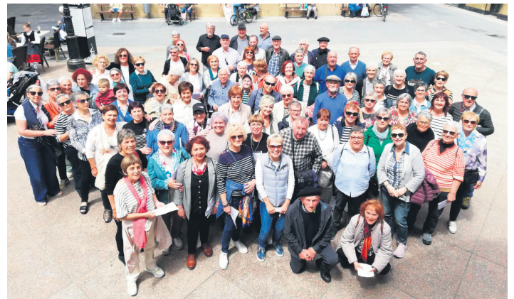
Xumela, Montetxio eta Olagarro koruetako kideak, Zarautzen. XUMELA KORUA