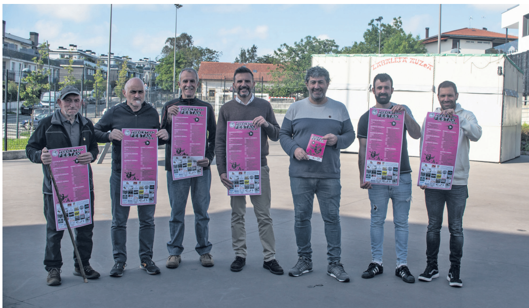
Zabaleta Auzolan elkarteko kideak eta udal ordezkariak, jaietako txosna atzean dutela.