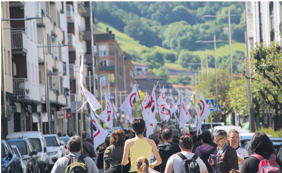
Erraustegiaren Aurkako Mugimenduaren deialdiarekin bat egindakoak, erraustegira bidean. TXINTXARRI