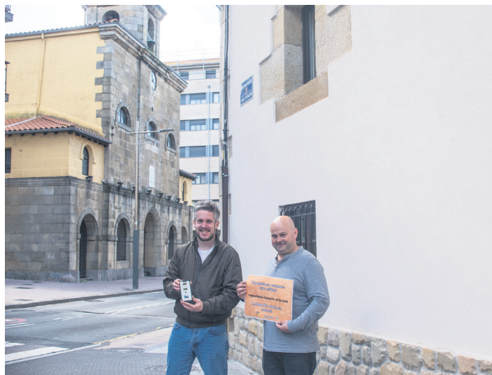
Herritarrek galdera lehiaketan parte hartzera animatu dituzte antolatzaileek. TXINTXARRI

Informazio gehiago topatuko duzue TXINTXARRI aldizkariaren webgunearen Toponimia kanal berezian.