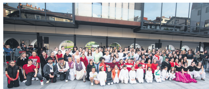
Elkar agurtu aurretik talde argazkia atera zuten partaideek. TXINTXARRI