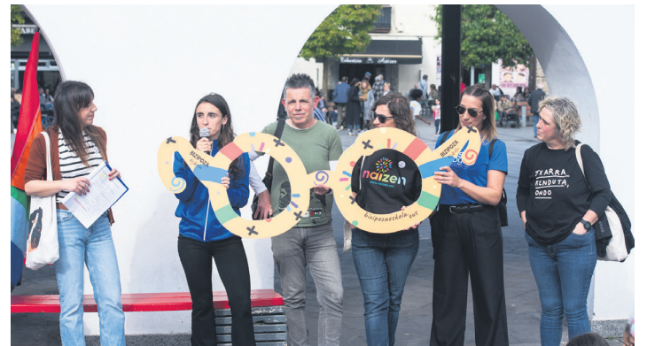
Lasarte-Oriako Bizipoza taldeko eragileek hitza hartu zuten.