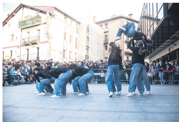
Akrobaziaren bat edo beste egin zuten dantzariak. TXINTXARRI