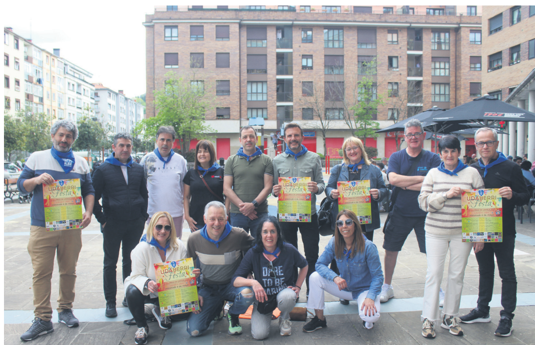
ILBE Iñigo de Loiola Bizilagun Elkarteko kideak, auzotarrak eta udal ordezkariak ekimenaren aurkezpen agerraldian.