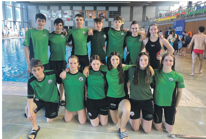
Gipuzkoako Kluben arteko Kopan parte hartu zuten igerilariak. BURUNTZALDEA IKT

Emaitzei dagokionez, igeriketa taldeko hamalau igerilariren