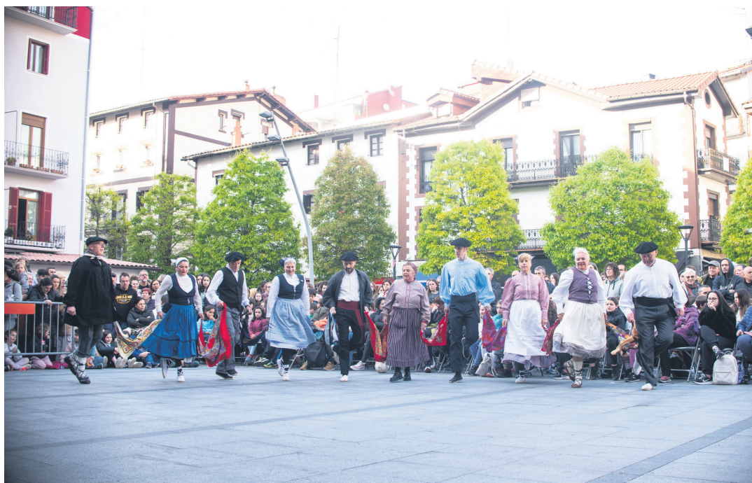
Erketz EDTko dantzariak zapi dantza koloretsua aurrera eraman zuten. TXINTXARRI