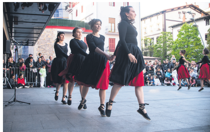
Kukukako helduen taldeetako bat, emanaldiari ekiten. TXINTXARRI

Makina bat taldek lagundu zuten dantzaren zuhaitza Okendon loratzen, emanaldi ederrak eginda. Elkar agurtu aurretik talde argazkia atera zuten elkarrekin, historiarako.