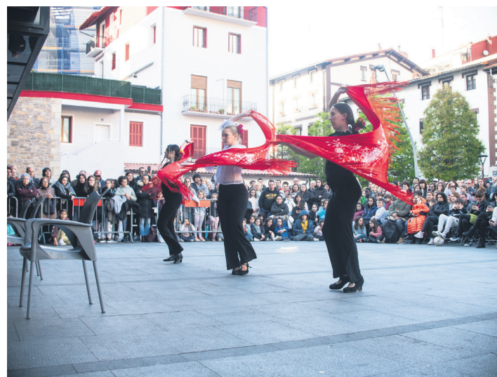
Semblante Andaluzeko hirukote gazteak trebezia handia erakutsi zuten. TXINTXARRI