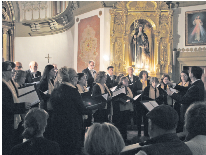
San Salvatore abesbatzak kontzertua eman zuen Ama Brigitarren komentuan.