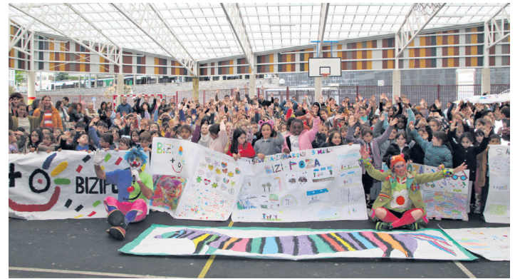
Lehen saioa herriko ikastetxeetako haurrekin egin zuten. TXINTXARRI

Zipriztintzea da Bizipoza Eskolaren nahia: ingurua, norbera, besteak... Haur eta nerabeak begirada berrian hezi eta haiekin batera, helduek ere gauza bera egitea. Horretarako bali-