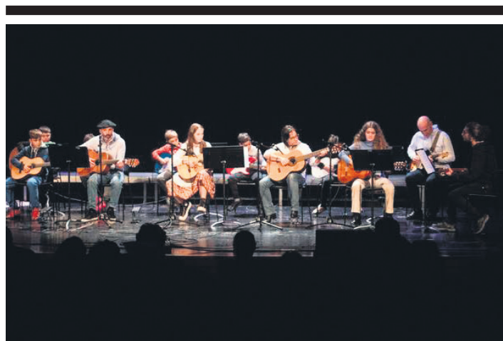
Artxiboko irudi honetan Udal Musika Eskolako gitarra jotzaileak ageri dira.

Lasarte-Oriako PSE-EEk deituta, 35 bat lagunek parte hartu zuten Pedro Sanchez Espainiako gobernuko presidenteari babesa adierazteko elkarretaratzean. Herriko Etxearen aurrean bildu ziren, apirilaren 27an, 11:00etan No todo vale zioen paperak eskuan, eta "merez du" oihukatu dute, gaztelaniaz.