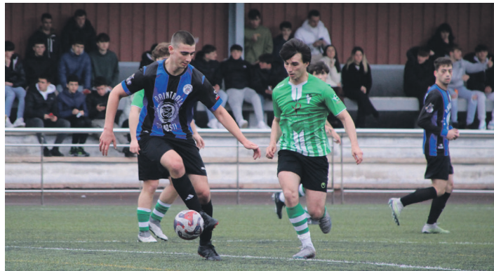
Ostadarreko, jokalaria baloia kontrolatzen.

Alde jarri zitzaizen neurketa lehen minutuan aurkariak bere atean gola sartu ostean, baina etxeko taldeak ere ederki egin