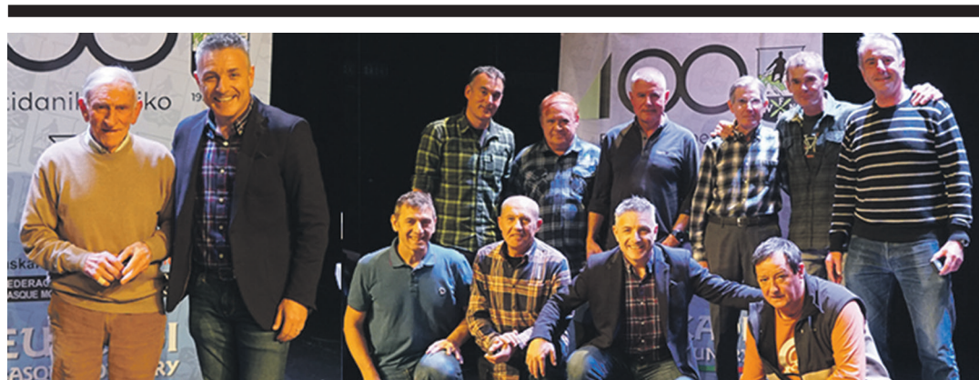
EUSKAL MENDIZALE ELKARTEA

Hil horretako 6an eta 7an, lehenik (17:30) infantil mailako neskak eta ostean (18:30) kadete mailakoak bilduko dira zelaian.