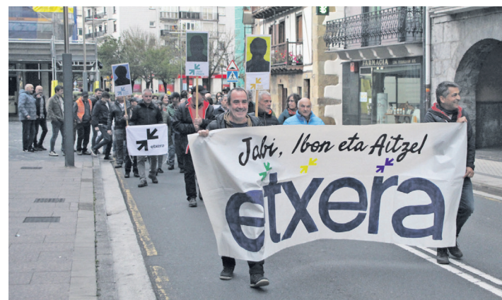
Ohi bezala, Elizatze plazatik abiatu ziren manifestariak. TXINTXARRI

Gaiarekiko oso zabalduak dauden premisa oker batzuen adibideak ere ekarri ditu ikus-entzuleen artera, eta, esan, horiekin hautsi egin behar dela. Adierazi du, adibidez, heriotzaren aurkako jarrera naivea bazter utzi behar dela, eta gertatzen ari denaren errua erlijioak duela pentsatzea ere okerra dela. Horrekin batera, "hau Hamasek hasi du" edota "bi aldetako fanatismo erlijiosoa" bezalako usteak ere bazter utzi behar direla.