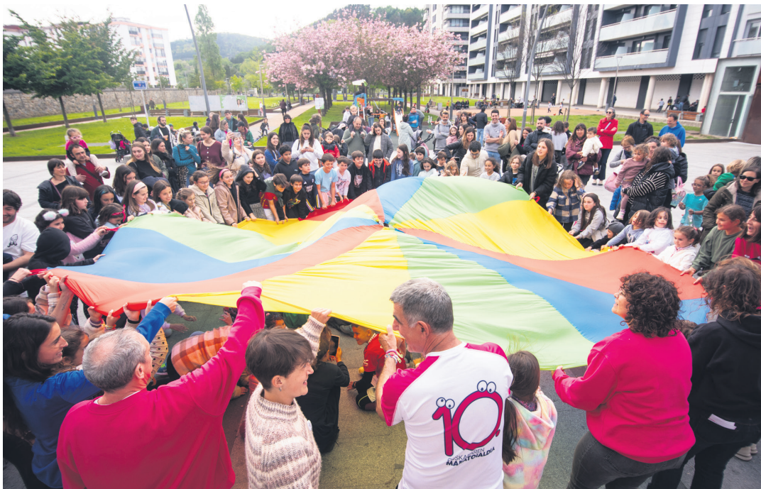
Bizipozaren oihal koloretsua lau haizetara astindu zuten. TXINTXARRI