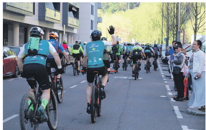
Kusleen animoen artean, BTT zaletuek gogotsu egin zituzten probako lehen metroak. TXINTXARRI

Mendietako bide eta aldapak gaindituz, ibilbide motza, ertaina edo luzea burutu zuten parte hartzaileek. Hipodromoko zubitik herrira sartu eta Askatasunaren parkeko helmugako