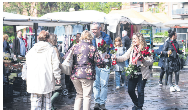
PSE-EEko kideek, ohi bezala, larrosak banatu zituzten. TXINTXARRI