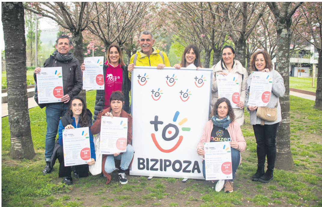
Bizipoza osatzen duten elkarteetako batzuetako nahiz herriko ikastetxetako ordezkariak, egitasmoa aurkezten. TXINTXARRI