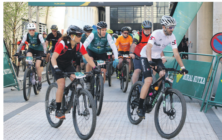
Parte hartzaileek irria ahoan zutela zeharkatu zuten Askatasun parkeko zuzengunea. TXINTXARRI