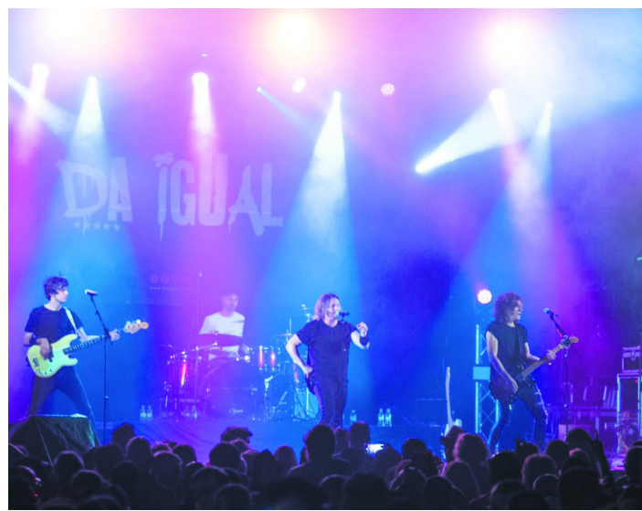
Star Ways musika taldeak iaz ere jo zuen Okendo plazan.