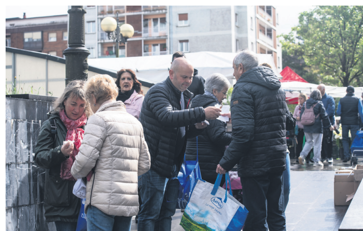
EAJko udal taldeko kideak Andatza plazako azoka sarreran izan ziren. TXINTXARRI