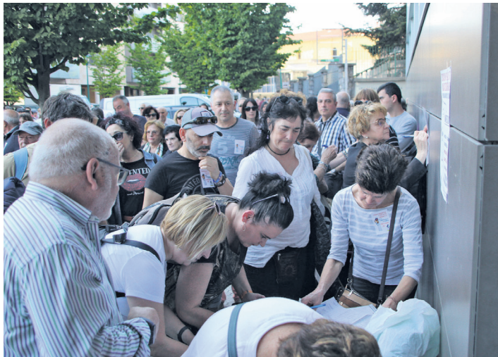
Oraindik zenbatzeko dituen atxikimendu mordo bat bildu ditu LOOPAK. TXINTXARRI