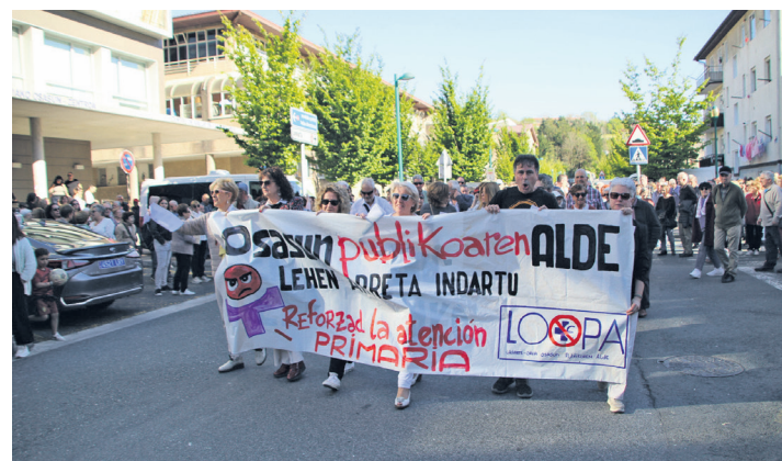
Herriko osasun zentro ataritik abiatu zen mobilizazioa. TXINTXARRI

Hori horrela, kalitatezko osasun zerbitzu publikoa desgaiten ari direla "egiazatu" dutenez, protesta egitea erabaki zuten, egoera ez baitzaie kasuala iruditzen. "Ez da kasualitatea, osasun-laguntza pribatizatze politikak kontziente baten emaitza da, osasun sistema dual ba-