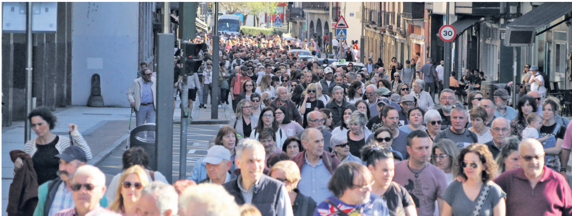
Osasun publiko eta kalitatezko bat eskatzeko manifestazioa azken urteetan herrian egindako jendetsuena izan zen. Irudian, manifestariak Kale Nagusia zeharkatzen. TXINTXARRI