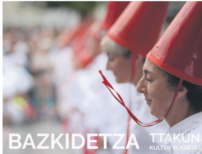
Sorgin Dantza da Ttakunen jardueretako bat. TXINTXARRI

Hori horrela izanik, euskara elkarteak bazkidetza egitasmo bat jarri du martxan. Bat egiten dutenek 60 euro ordainduko dituzte urtean eta eragile horren