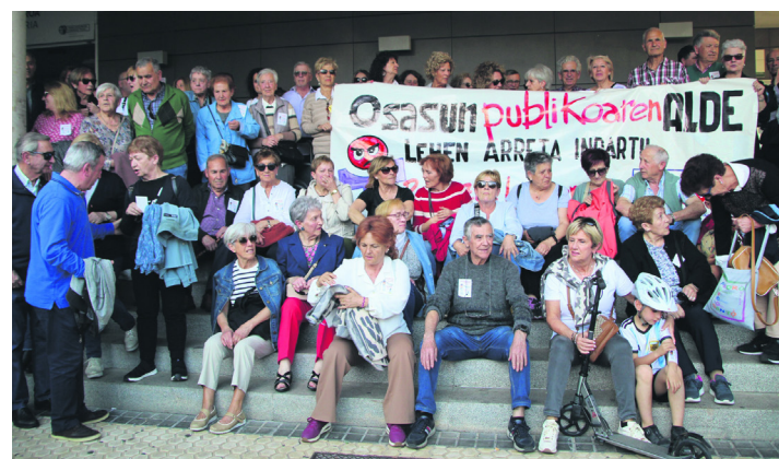
Hasitako toki berean bukatu zuten mobilizazioa. TXINTXARRI

tetara garamatzana". Hau da, osasun sare pribatua, ordaintzeko diru nahikoa dutenentzat, eta osasun sare publikoa, "eskasa eta desgaiturata", txiroentzako eta gizarte sektore babesgabeentzako. "Onartezina" zaie osasunerako eskubidea oinarritzako giza eskubideetako bat