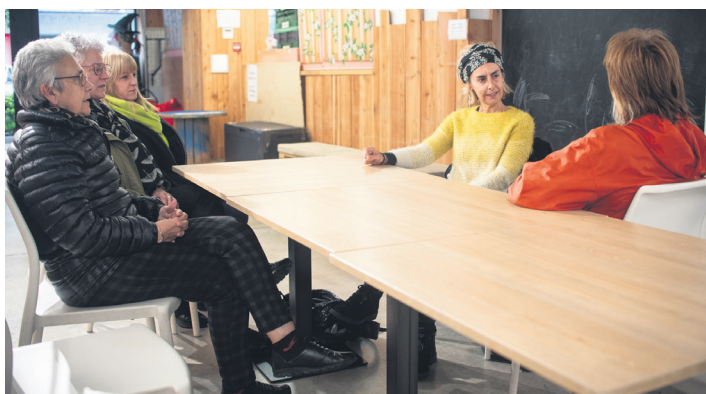
LOOPAKO zenbait kide, elkarren artean solasean. TXINTXARRI

LOOPA plataformarekin elkartu da TXINTXARRI manifestazioa egin eta egun batzuetara. Ekintza horren balorazio "oso positiboa" egin dute partaideek: "Espero genuena baino jende gehiagok parte hartu du; ikusi dugu kalean dagoela haserre eta herritarrek euren ezinegona adierazteko go-go dutela". Balioan jarri dute "adin eta kolore desberdinetako pertsonak" bat egin izana.