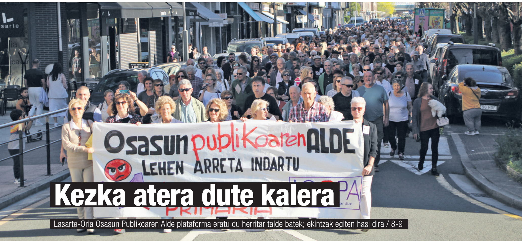
Lasarte-Oria Osasun Publikoaren Alde plataforma eratu du herritar talde batek; ekintzak egiten hasi dira / 8-9