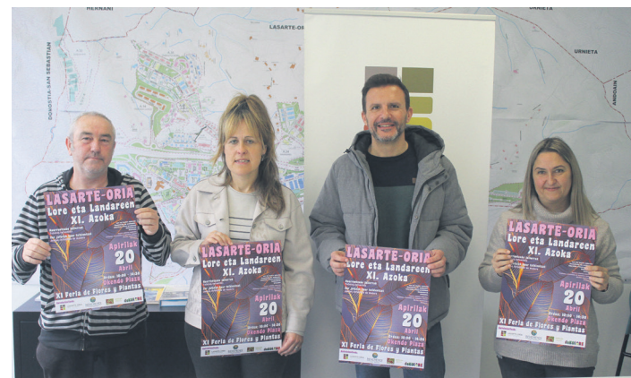
Azokaren antolatzaileak, jarduera aurkezteko prentsaurreakoan.

Iragarri dute, urtero bezala, herritarren iritziekin batera, "epaimahai tekniko" batena ere kontuan hartuko dutela afixa irabazlea izendatzeko. Epaimahai hori "gai adituak diren zenbait herritarrek" osatuko duela ere argitu dute. Prozesu hori amaitutakoan iragarriko dute irabazlea zein den.