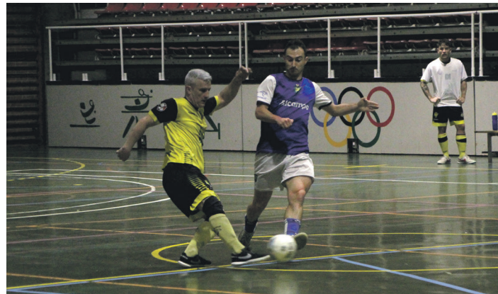
Eguzki Arkupe Rehabilitaciones eta Oartzun taldeen arteko neurketako irudia. TXINTXARRI

Eguzki ISU Leioak taldeak kopa lehiaketako bigarren jardunaldia jokatu zuen Irunen, hilaren 12an. Irun Futsal Ganarrari taldeari