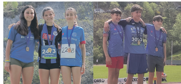
Redondo (ezker) eta Murgiondo (eskuin), podiumean. G. REDONDO / J. MURGIENDO

Lasarte-Oriako judoka gazteek lan ederra egin eta hiruk euren mailatan podiumeko hirugarren mailara igotzea lortu zuten: Diez (57 kilo azpiko kategorian), Linazasoro (63 kilo baino gehiagoko maila) eta Curiel (66 kilo baino gehiagoko kategorian). Pozo, aldiz, podiumetik gertu geratu zen 44 kilo azpiko mailan; zazpigarren izan zen.