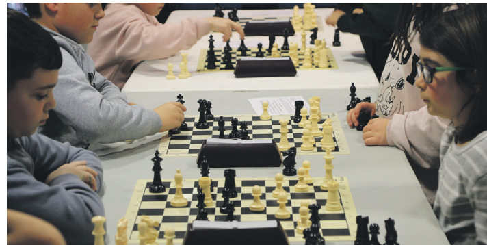
Eskolarteko txapelketako neurketetako bat.