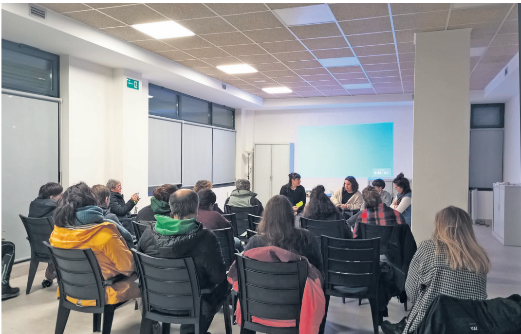
Herritarren jakin-mina piztu zuen Izan Iñurriko kideekin Zabaleta Auzolanen lokalean egindako emanaldi eta solasaldiak. ASUNAK