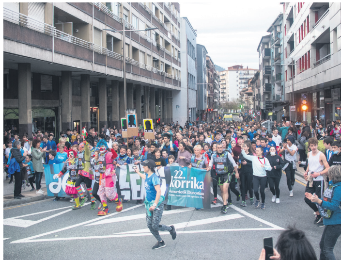
Lasterkariak, Kale Nagusian barrena, 22. Korrika herritik igaro zenean. TXINTXARRI

Goiburu horri erreferentzia eginda, Korrika Kulturala izenez ezagutzen diren ekimenen antolatzaileek harro egon nahi dute gure herriak 23. Korrikari egiten dion harrerarekin. Lehen girotze jarduera gaur bertan aurrera eramango dute, hilak 1, kultur etxean, 20:00etan, Okendo Zinema Taldearekin elkarlanean: Bizkarsoro filma proiektu