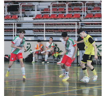
Neurketako irudia. TXINTXARRI