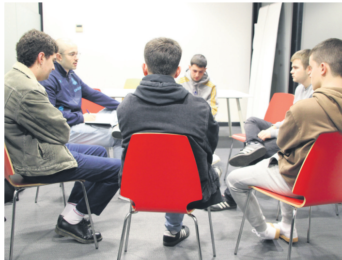
GKSren herriko komitearen lehen bilera. TXINTXARRI

Urte urte, soldaten balioa jaitsi egin da eta horrek are gehiago zaildu du gazte langileen emantzipatzeko aukera; oinarritzko eskubidea izan arren, "batzuen interesengatik, pribilegio bat da". Sarrera eginda,