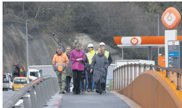
Ubarretxena eta Mendocza, zubi bat zeharkatzen. GIPUZKOAKO FORU ALDUNDIA

webgunea ( www.lasarte-oria.eus ) erabili behar dute. Modu hori ez erabili eta ideiak fisikoki helarazi nahi dituztenek etxean jasotako eskuorriak bete eta udal postontzietan utzi behar dituzte, gune hauetan daudenetan: Emakumearen Zentroa, kultur etxea, Gaztelekua, Antonio Mercero gunea eta Maialen Chourraut kirodegia.