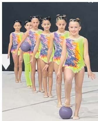
Alebin C taldea lehiari. LOKE GIMNASTIKA

Izotzaldia urtu ostean, bigarren fasea prestatzen hasiko dira