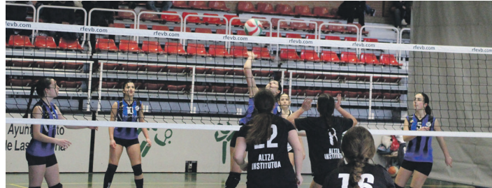
Kadete mailako Ostadar-Altza partidako irudia. TXINTXARRI

Arratsaldean, Euskal Ligako II. mailako taldearen txanda izan zen; Gasteizko IKA Ekialdearen aurka neurtu zituen indarrak eta 1-3 galdu. Ederki borrokatu ziren bi taldeak eta talde urdin-beltzak lehen seta eskuratu (25-22) arren, gasteiztarrek itzuli