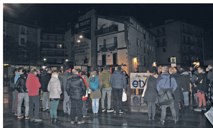
Okendo plazan irakurri zuten manifestua.