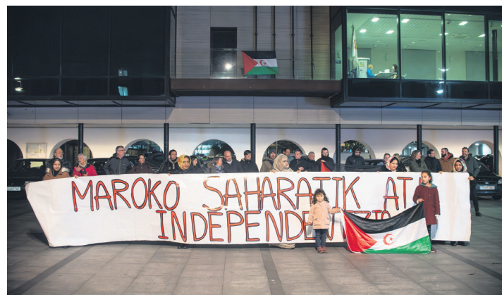
'Maroko saharatik at! Independentzia' zioen kartelak.