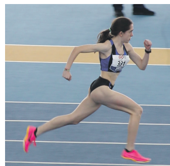
Alkorta, Espainiako txapelketan. OSTADAR ATL.

Gipuzkoako txapelketarekin batera, proba libreak ere izan ziren Donostian. Herriko ordez-