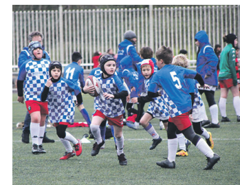
Errugbi partidetakoa bat. TXINTXARRI

Valladoliden 16 urtez azpiko Euskadiko selekzioak Gaztela Leonen aurka jokatu zuen Erkidegoen