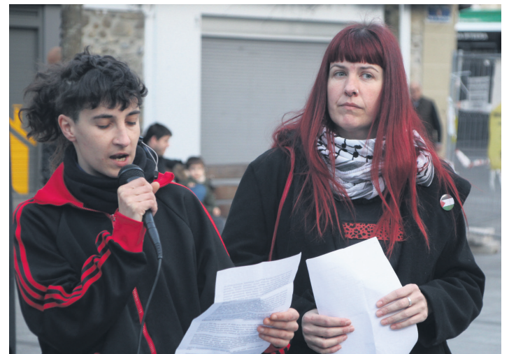
Lasarte-Oria Palestinarekin Herri Dinamikako bi kide, azalpenak ematen. TXINTXARRI

joan den astean Gipuzkoako Foru Aldundiak CAFeko zuzendaria, "justu momentu honetan", saritu izana gaitzetsi dute. Herrian, berriz, taldeak jarritako mozioa ezeztatu eta eztabaidatzeari uko egin zion bozeramaileen batzarrak. "Zentsura, isiltasuna, konplizitatea. Demokraziaren alde eta biolentziaren kontra ahoak betetzen dituzten horiek, horrelako genozidio baten aurrean isilik geratzea eta eztabaidak zentsuratzea erabakitzen dute".