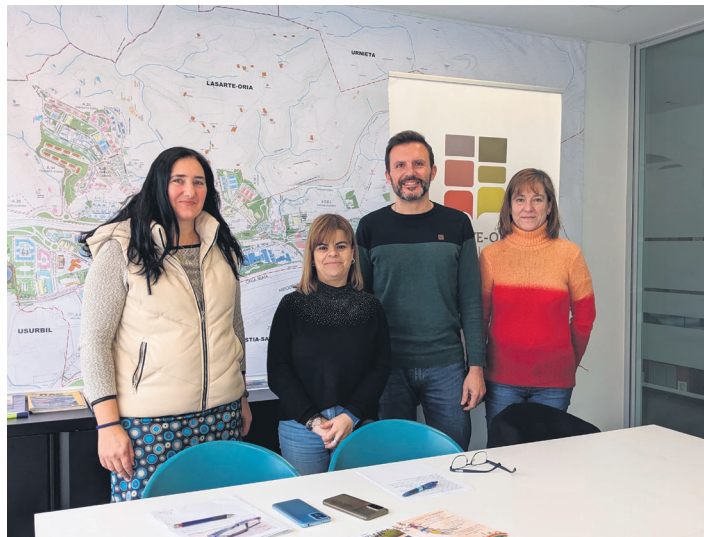
Udal ordezkariak eta ikastetxeetako zuzendaritzetakoak ekimena aurkezten. TXINTXARRI

Eguraldi ona eginez gero, Okendo plazan aurrera eramango dute aipatu festa. Euria egingo balu, berriz, Oriarte Institutuko estalkira lekualdatuko dute, eta, oso-oso eguraldi txarra egingo balu, aldiz, Manuel Lekuona Kultur Etxean egingo dutela jakinarazi dute. Lasarte-Oriako familiak deitu dituzte larunbateko jardueran parte hartzera. Egitaraua ere iragarri dute; honako ekimenak aurrera eramango dituzte. 09:30ean izango da hasiera. Haurrek egingo dituzten marrazki eta idatziko dituzten esaldiak sare