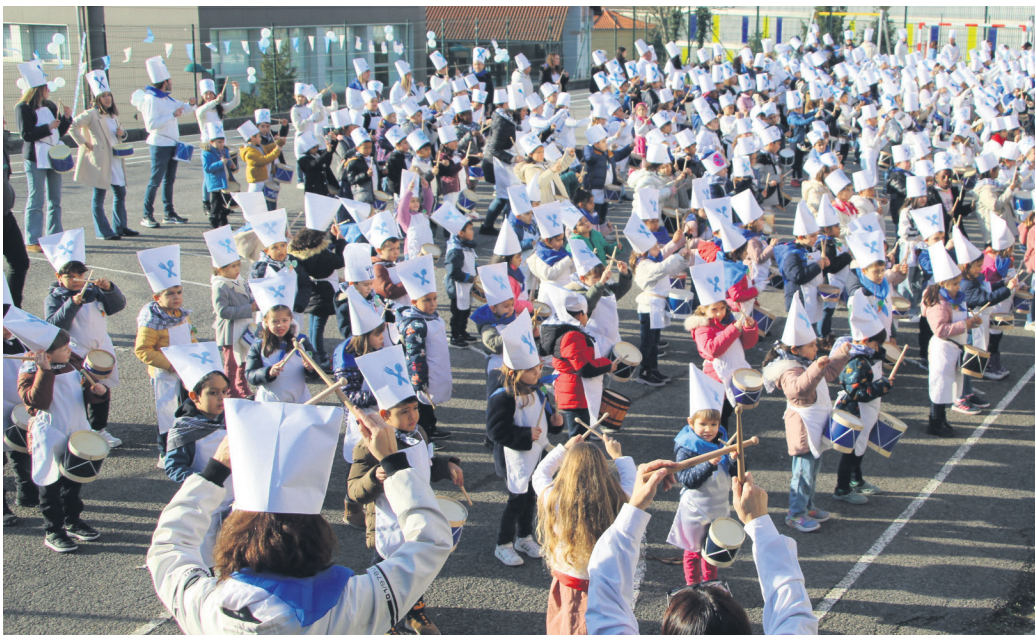
Sasoeta-Zumaburuko ikasle guztiak ere kanpoan jotzera animatu ziren.