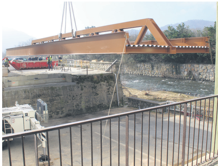
Zumaburu parkea eta Erribera kalea lotuko ditu zubi honek.