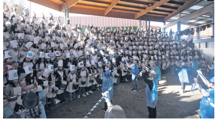
Landaberi LHko ikasle eta irakasleak, ohi bezala, anfiteatroan aritu ziren. TXINTXARRI

Danborradek ireki dute herriko ikastetxeetako ikasle eta irakasleek urtean zehar aurrera eramaten dituzten ospakizunen sorta. Laster jarraituko dute Santa Agenda bezperarekin edota inauteriekin.