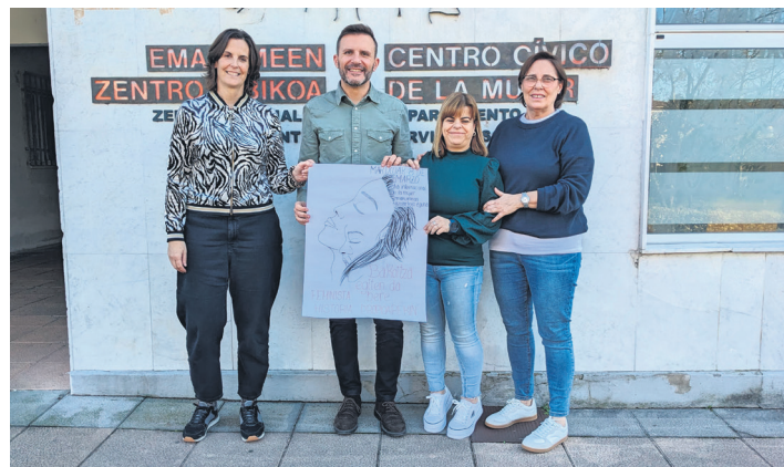
Udal ordezkari eta teknikariak, lehiaketa aurkezten. TXINTXARRI

Galdera eta erreguen tartean ere zenbait gai mahaigaineratu zituzten. Udalaren YouTube kanalean ikus daiteke saioa osorik.