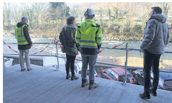
Obren arduradunak eta alkatea, miradorean, Oria ibaira begira.

bat jarri eta herritarrek Oria ibaia eta inguruak ikus ditzaten bertatik. Horiez gain aldaketa gehiago egingo dituzte, hala nola, eremu horretako argiteria berritzea, LED teknologia erabilita.