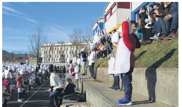
Adi jarraitu zituzten danbor jotzaileek zuzendarien jarraibideak. TXINTXARRI