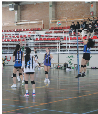
2. mailako Euskal Ligako neurketako irudia. TXINTXARRI

Ongi hasi du urtea eta bigarren itzulia Ostadarreko Euskal Ligako II. mailako taldeak. Hil