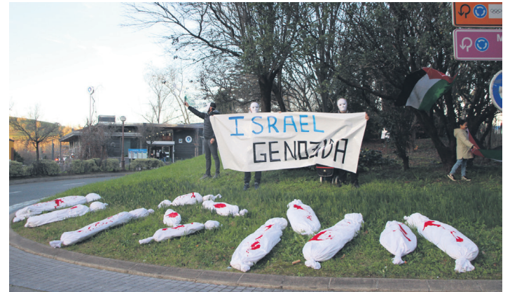
Tajamar biribilgunean egindako ekintza ikusgarria. TXINTXARRI

Era berean, Israelek Euskal Herrian ere babesa baduela nabarmendu zuten. Eusko Jaur-laritzak zuzeneko inbertsioak ditu CAF enpresaren bidez eta