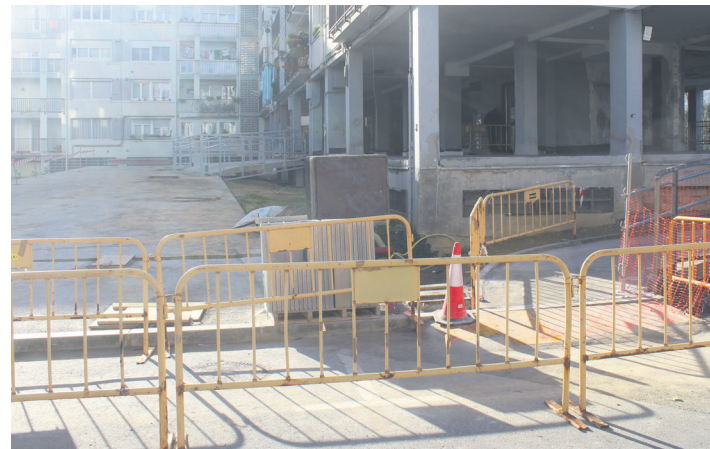
Ezkerrean, oinezkoentzako pasabideetako bat, eta, eskuinean, bidegorria. TXINTXARRI

robide horiek luzatu egin dituzte horren aldapatsuak ez izateko) eta lurra inpermeabilizaten, likidoak isur ez daitezten; ibaiertzeko paseoko bidegorria osatzeko zatia egiten; eta zorua zabaltzen, miradore