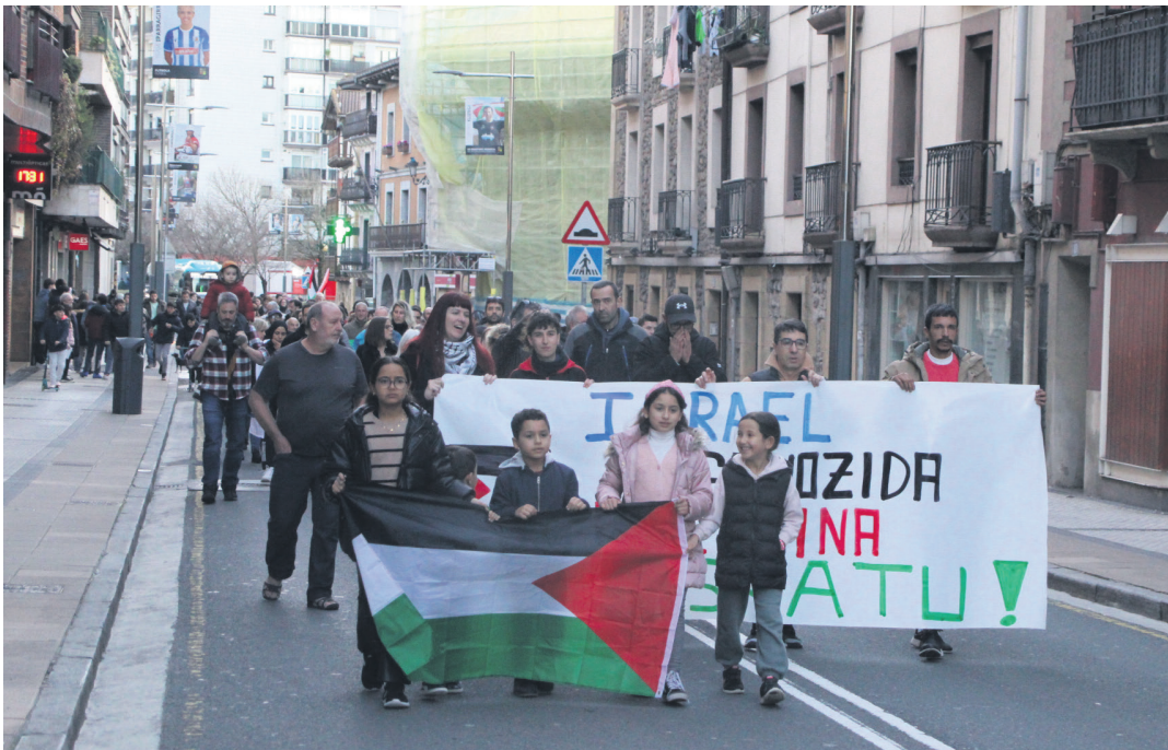
Lasarte-Oria Palestinarekin Herri Dinamikaren manifestazioan 150 bat herritarrek parte hartu zuten. TXINTXARRI