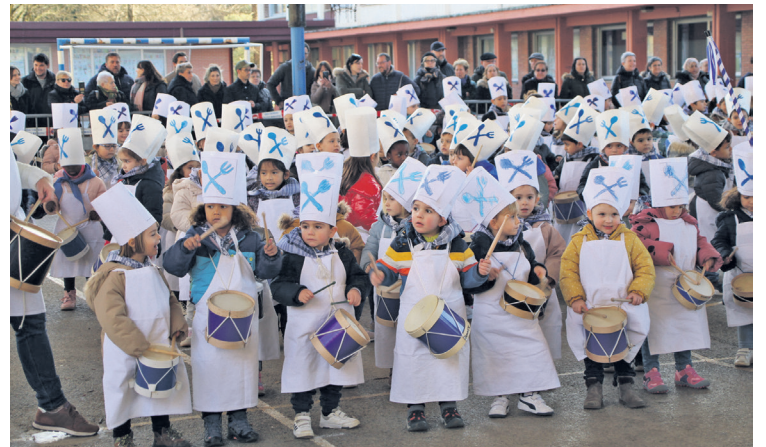
Garaikoetxeako txikiak dotore irten ziren patio estalira. TXINTXARRI