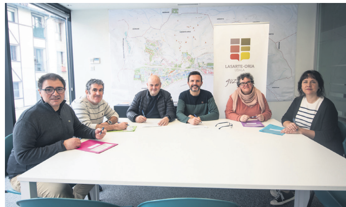
Hitzarmenak sinatu dituzten eragileetako nahiz udaleko ordezkariak. TXINTXARRI

Bestalde, herriko ikastetxeetako hiru guraso elkarteekin (Sasoeta-Zumaburuko Burunzpe,