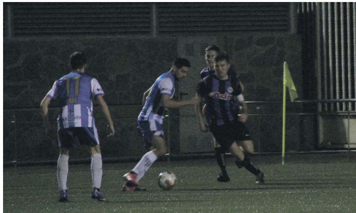
Erregionalean I. mailako Texas Lasartearra eta Ostadarren arteko neurketako irudia. TXINTXARRI

Ondorioz, Texas Lasartearra bere multzoko bigarren sailka-