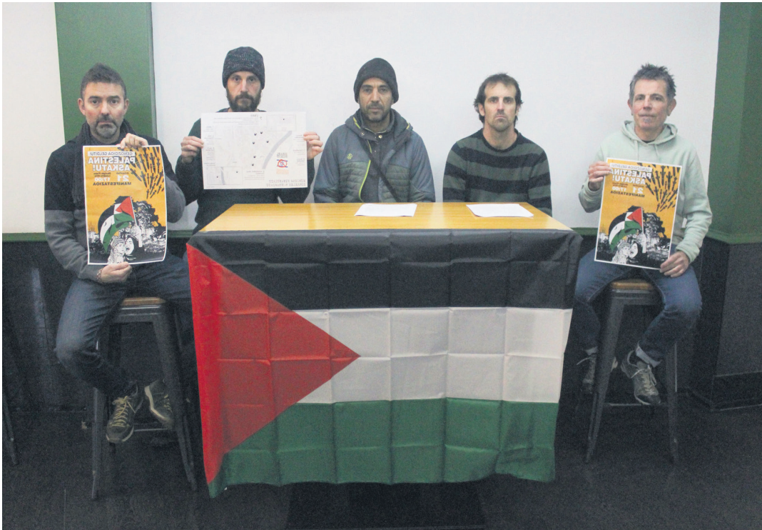
Lasarte-Oria Palestinarekin Herri Dinamikako kideak, Agora tabernan, deialdiak aurkezteko agerraldian.