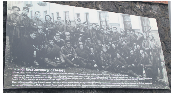
Identifikatzeko gai izan diren gudarien izenak ageri dira.