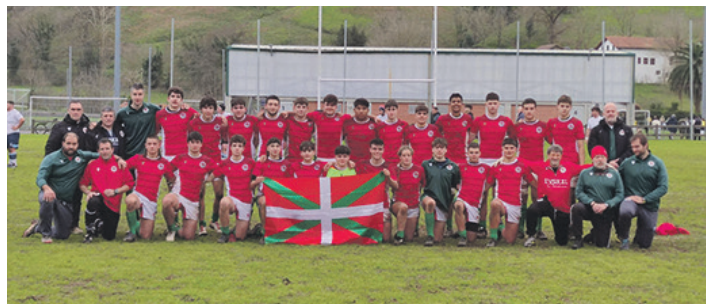
16 urtez azpiko taldea, neurketa baino lehen. EUSKADIKO ERRUGBI FEDERAZIOA

Garai horretako gainerako hitzorduak ostiralez jokatuko dira, zehazki, apirilaren 5ean,