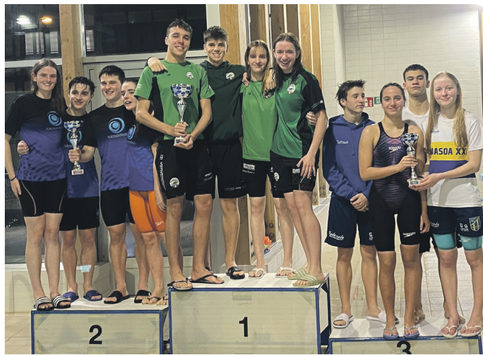
Buruntzaldea IKTko erreleboetako bat podiumera igo zen. BURUNTZALDEA IKT

Garaikurrez gain, igeriketa taldeko gazteek guztira 26 marka pertsonal ondu zituzten eta batzuk, gainera, Gipuzkoako zein Euskal Herriko txapelketetara-