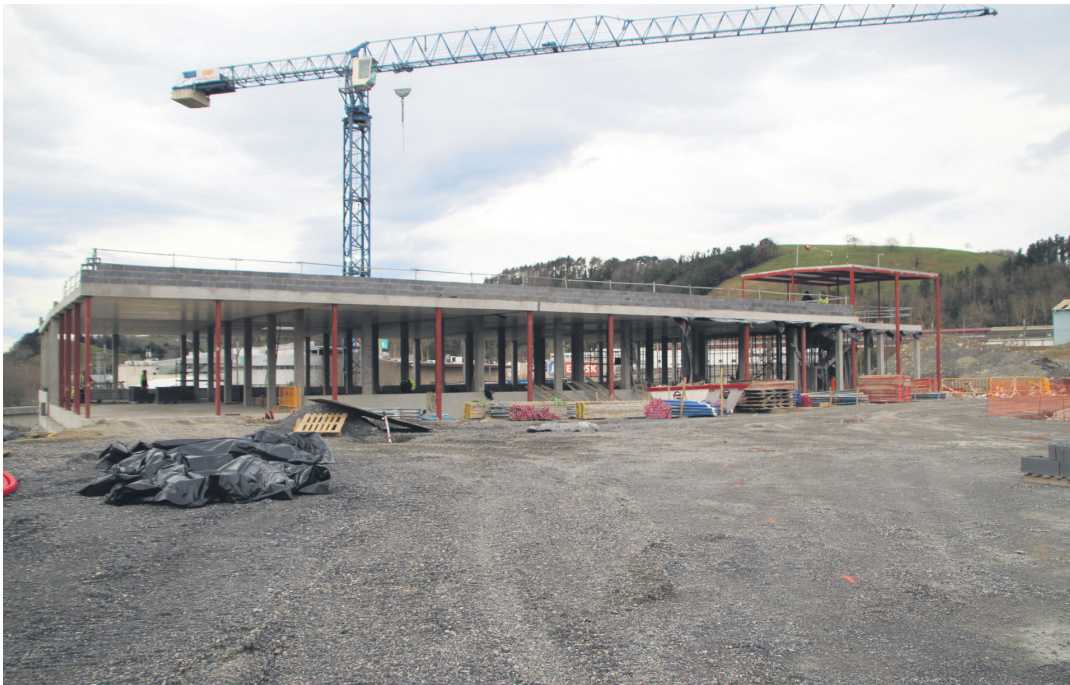
Eraikinaren egitura lanak bukatu dituzte, eta ezustekorik ezean, maiatzerako amaituta egongo da kirol eremua.