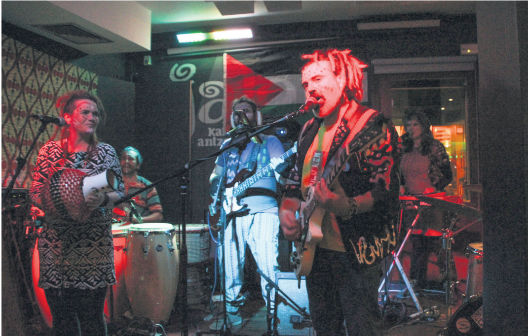
Makulu Ken taldeak Jalgin eman duen azken kontzertuko uneetako bat.