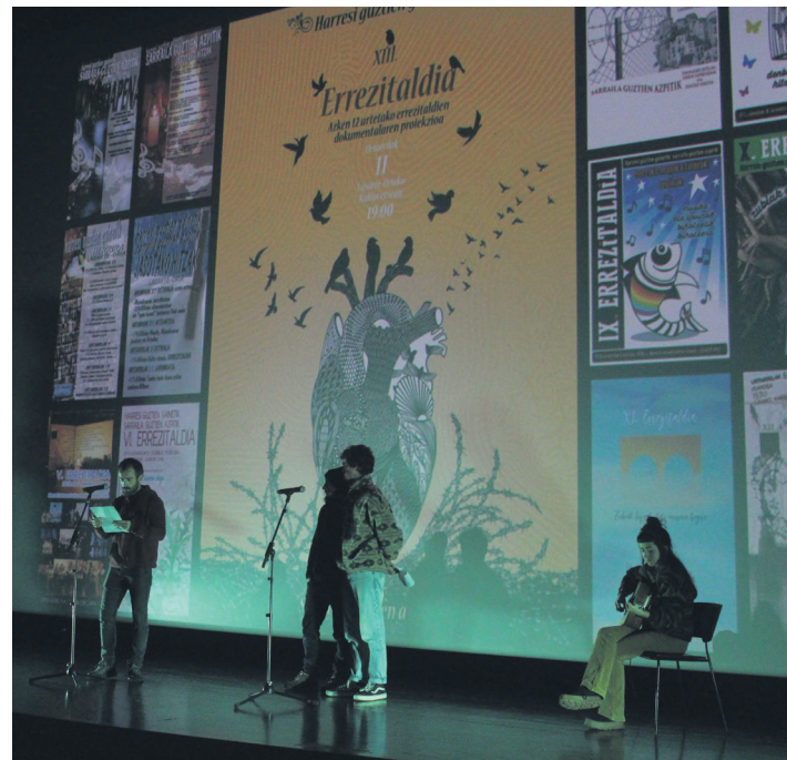
Ibon Fernandez Iradi eta Aitzel Iriondo lartzaren idatziak irakurri zituzten.