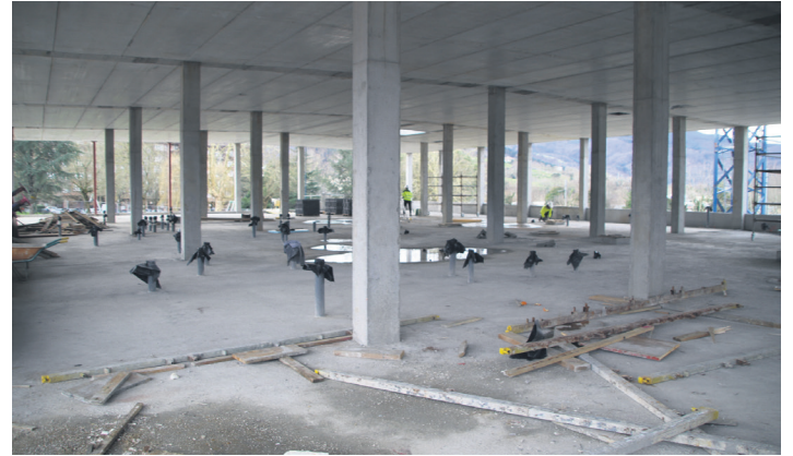
Porlanez eta metalez egindako egituraren argazki bat, barrualdetik aterata.

Horma perimetrala egiteko Froilan Elespe parketik zihoan pa-