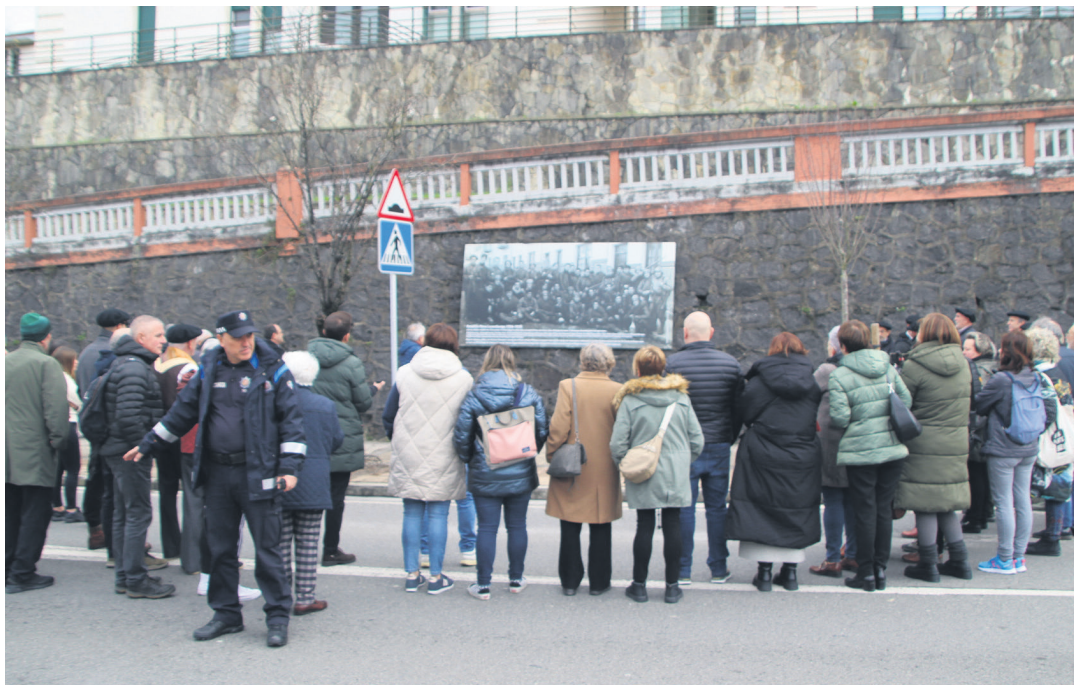
Argazki historikoa ezagutarazi eta bertan ikusgai dena azaldu zuen Islada Ezkutatuak elkarteak. TXINTXARRI