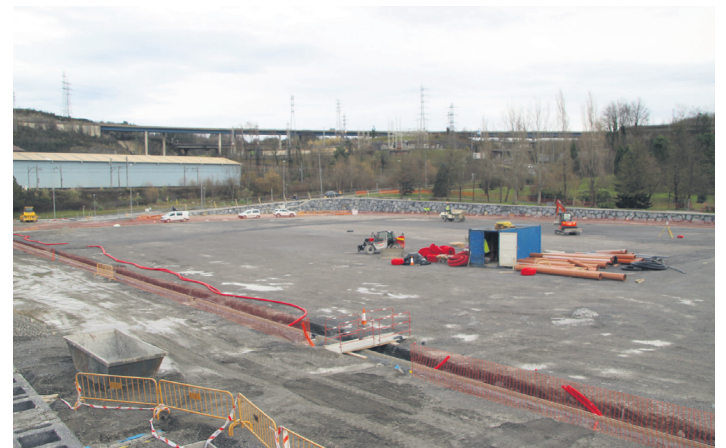
Euri urak biltzeko sarea instalatzen ari dira orain. TXINTXARRI

sealekuetako bat moldatu dutela azaldu du, eta, aipatu, kirol eremura Green plazatik eta trenbide ondotik oinez eta bizikletaz iritsi ahal izango direla erabiltzaileak.