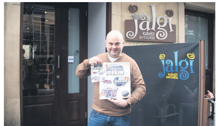
Jalgi kafe antzokia toki aproposa da solaskideak elkartzeko.