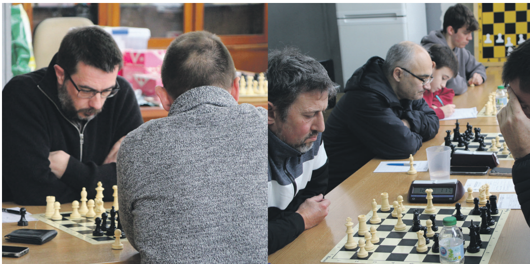
Taula Xake Klubeko kideek hitzordu bikoitza izan zuten Blas de Lezoko lokalean.