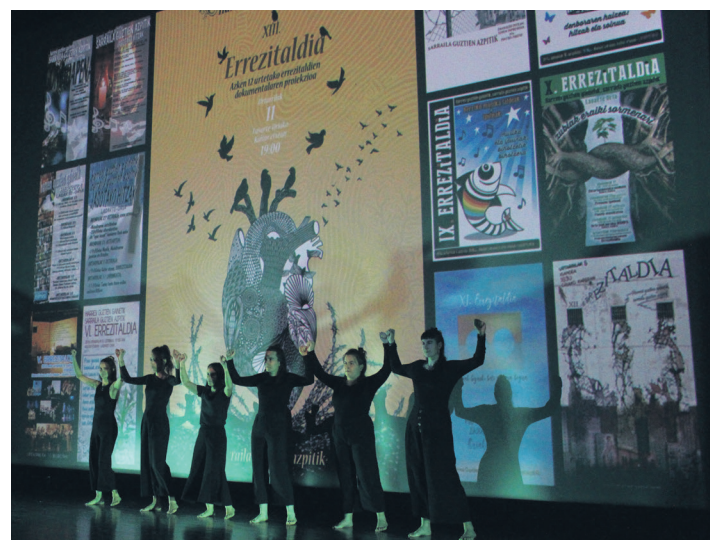
Kukukako kideek sorkuntza dantza bat taularatu zuten. TXINTXARRI

Proiektzioak atzera begiratu eta egindako bidea gogoratzeko ere balio izan du; orain arteko edizioetako irudi eta bideoak tartekatuta zituzten. Iturralde-Balardi familia ere gogoan izan zuten ekimenean.