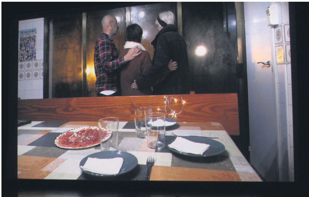
Gallaga, Iriondo eta Fernandez senideak, horiek espetxetik noiz etxeratuko diren zain.