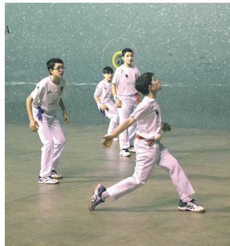
Intza 1 infantilen neurketa. TXINTXARRI

Eta arratsaldeari amaiera emateko modalitate aldaketa izan zen; eskutik gomazko palara. 2. mai-