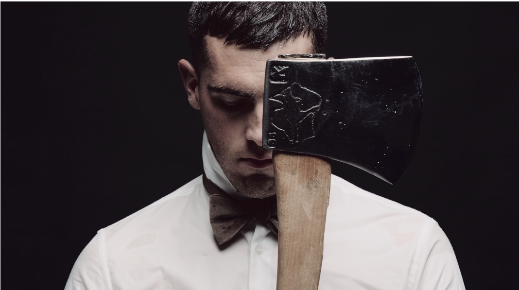
Pieza guztiak konpondu eta ordezkatzeko dituzte Bertakok, igogailuaren bizitza erabilgarria iritsi arte. BERTAKO