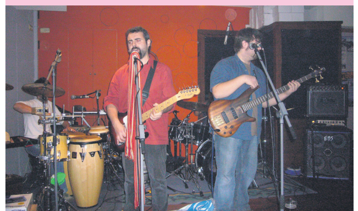
2007ko Multimuskalean jo zuen estreinakoz Makulu Kenek. TXINTXARRI