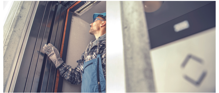
Igogailuen mantentze-lanak egiten ditu Bertako enpresak. BERTAKO

Enpresa euskalduna eta euskaltzalea da Bertako. Ahalik eta zerbitzu gehienak euskaraz eskaintzen ditu. "Edozelan ere, onartzen dugu gure teknikari guztiak ez direla euskal hiztunak; batzuk badira; beste batzuk ez. Baina euskararekin konprometituta gaude eta ahal dugun zerbitzu gehienak euskaraz eskaintzen ditugu. Adibide bat jartzerren, Tuteran aurrekontuak eta fakturak euskaraz eta gaztelaniaz egiten ditugu". Beste konpromiso batzuk ere baditu euskarare-