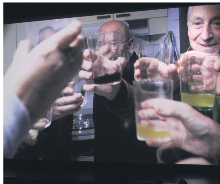
Mahaia-aren inguruan topa egin zuten dokumentaleko protagonistek. TXINTXARRI