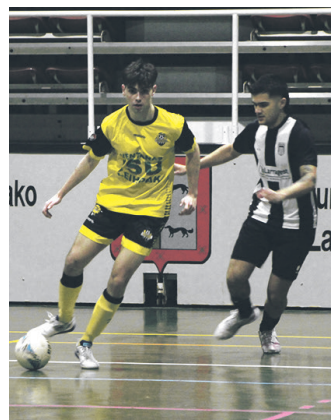
3. mailako partidako irudia. TXINTXARRI

Kadete mailan lortu zen beste puntu bat. Harrobiko hiru taldeek Antiguokoren aurka izan zuten hitzordua batzuk etxean eta