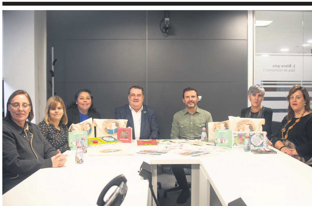
Udaleko, Foru Aldundiko, Espainiako Gobernuko eta Mestiza GKEko kideak elkartu dira aurkezpenean. TXINTXARRI