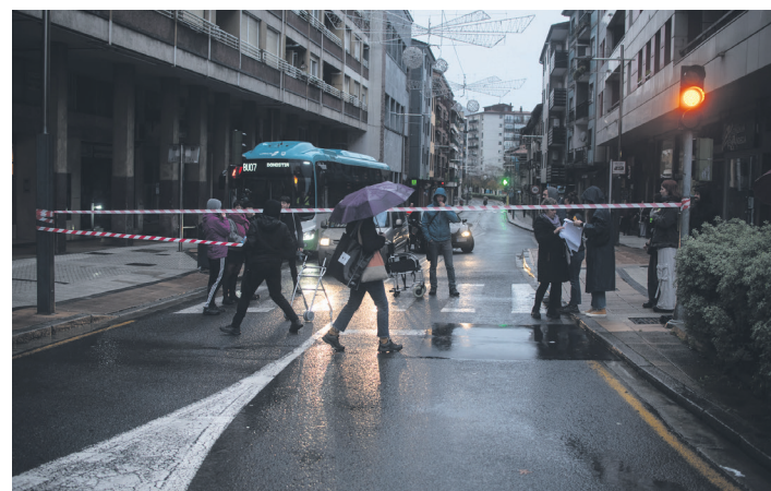
Tajamar biribilgunera sarbideak moztu zituzten goizeko lehen orduan. TXINTXARRI

Bazkalostean, asko izan ziren eskualdeko manifestaziora joan zirenak, Hernanira.