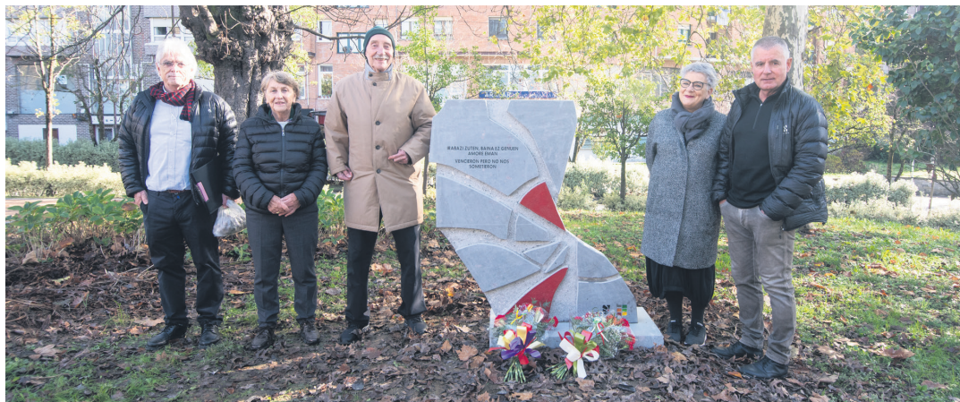
Islada Ezkutatuak elkarteko kideen lanaren emaitza da Frankismoaren biktima izandako lasarteoriatarrei omenaldia. TXINTXARRI