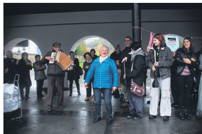
Kantu, dantza eta irrintziak ez ziren falta izan. TXINTXARRI