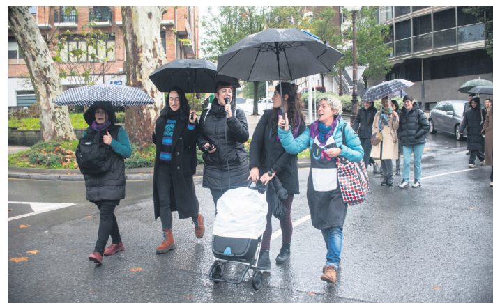
Gaur egungo zaintza sistemaren aurkako aldarriak egin zituzten. TXINTXARRI