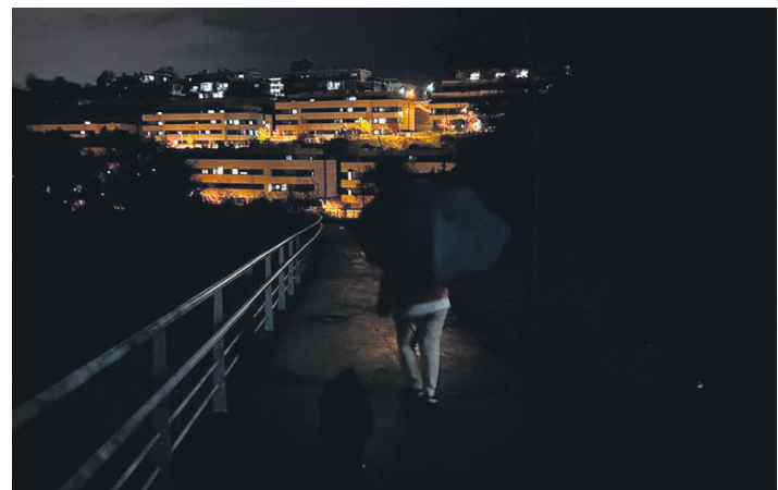
Gaztainzulo atzealdeko pasabidearen eremu bat, egunez eta gauez. Bizilagunek telefono mugikorren linternak erabili behar izaten dituzte.

beltz ezabatzeko pakete baten barruan doa Gaztainzuloko argiteriarena; administrazioaren urratsak errespetatu behar dira plegu eta lizitazioak egin behar direlako".