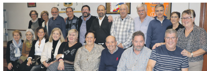
Taldeko kideak eta bikoteak mahaiaren inguruan bildu ziren. OSTADAR ZIKLOTURISMO TALDEA

Bi taldeak pozarren daude neurketarekin. Garaipenari esker, seniorrak lehen postuaren borrokan jarraitzen dute. Jubencil, berriz, neurketa egindako lana nabarmentzen dute, "zaila zen aurkariari beldurra sartu genion".