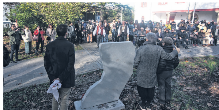
Oroitarria ikusgai jarri ondoren, dantzariak Agurra dantzatu zuten. TXINTXARRI

zela zehaztuz. "Lasarteoriatarrek azpiratuak izan ziren, eta etxe honetatik zuzendu zen erreprezio horren zati handi bat, nork biziraun eta nor exekutatu izan behar zen erabakita, jainkoak balira bezala". Oroimen historikoaren garrantzia ere nabarmendu zuen Valdiviak, "betebehar morala" izateaz gain, errepikatzea saihesteko ezinbestekotzat joz.