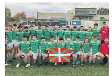
Euskadiko taldea. EUSKADI RUGBY