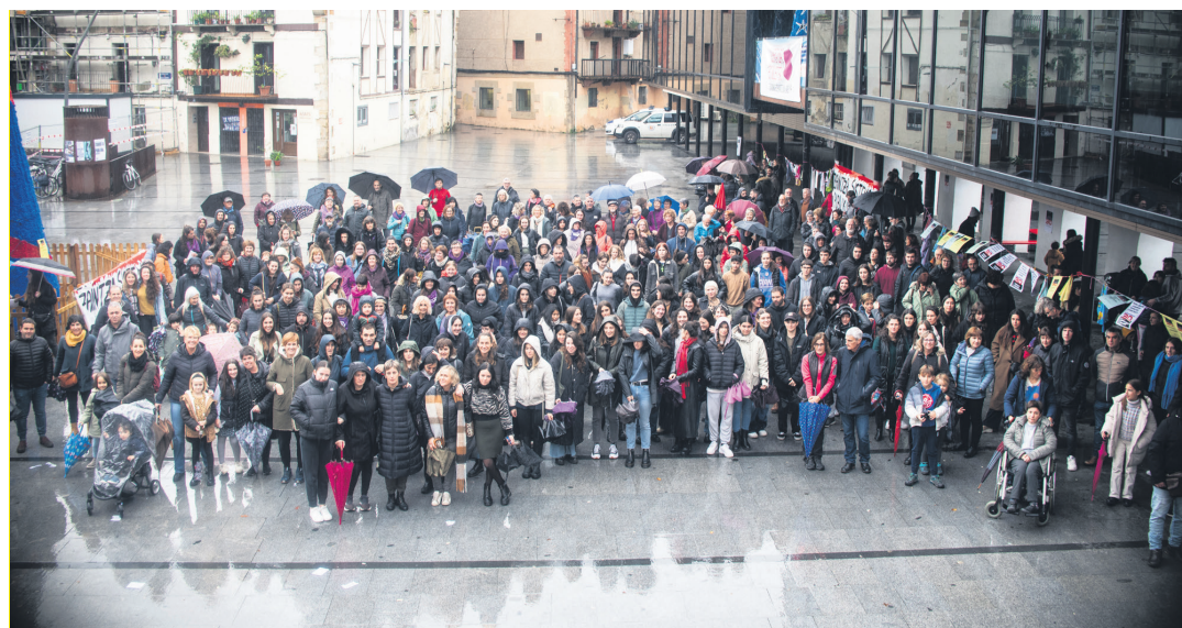
Eguerdiko elkarretaratzean jendetza bildu zen, zaintza sistema publiko eta komunitario bat eskatzeko.