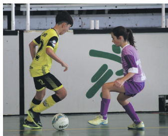
Neurketako irudia.

Eguzkiko jokalariek ez zuten lehen zati ona izan. Defentsan ahul ari ziren; presioak ez zuen bere helburua betetzen eta aurkariak lasai jokatzen zuen. Erasoan ere zailtasunak izan zituz-