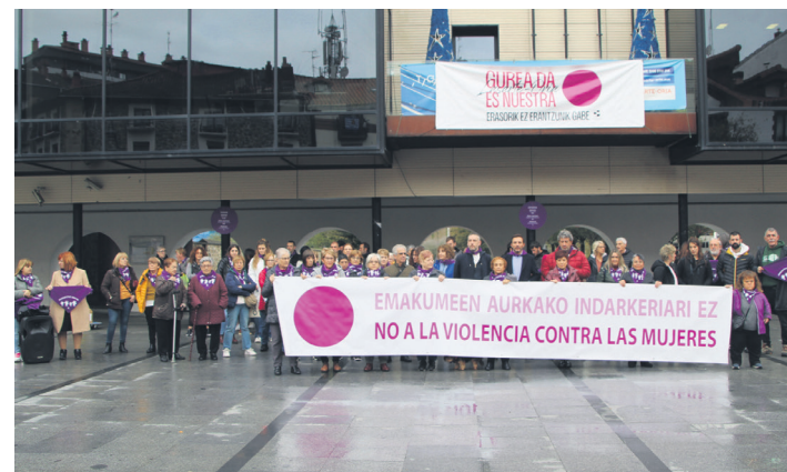
'Emakumeen aurkako indarkeriari ez' lelodun pankarta erakutsi dute.

Egizabalena izan da udalak Emakumeen Kontrako Indarkeriaren Aurkako Egunaren harira aurrean antolatutako azken ikuskizuna. Edonola ere, gogorarazi du gaur arte (hilak 1) zabalik dagoela Ni naiz naizena erakusketa, hamar pertsona transen bizipenekin ondutakoa. Kultur etxeko 1. solairuan dago.