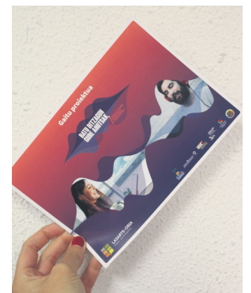
GAITUren eskuorria. TXINTXARRI

rian sartu beharko dute, eta "hitz egin" botoiari sakatu. Webguneak esaldi bat eskainiko die irakurtzeko, hortaz, esaldia esan, eta botoiarekin grabazioa amaituko dute. Lehenengoa egin ostean, beste esaldi bat eskainiko die, eta, horrela, bost grabatu arte. Ostean, "bidali" botoia sakatu beharko da, amaitzeko. Nahi adina esaldi graba ditzaketela ere ohartarazi dute. Gauzak horrela, ahalik eta lasarteoriar gehienek parte hartzea da proposamena.