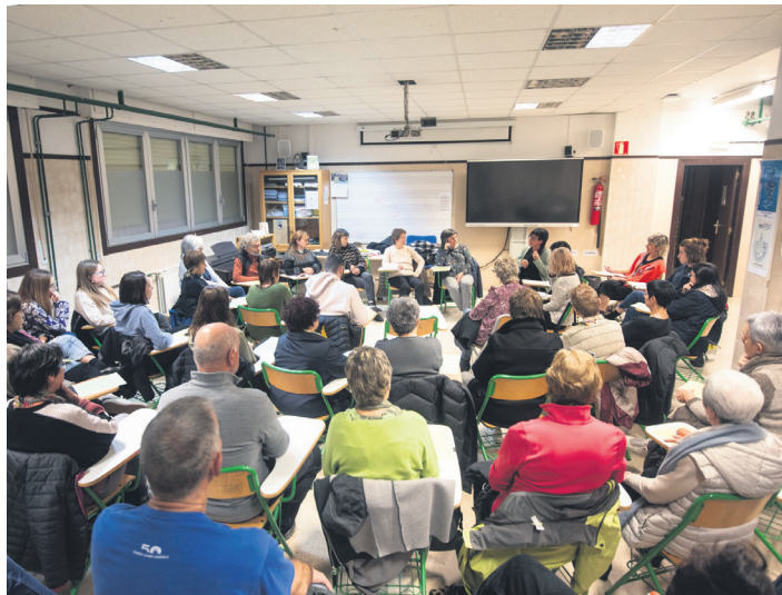
Lasarteoriatar ugari bertaratu ziren saio irekira.