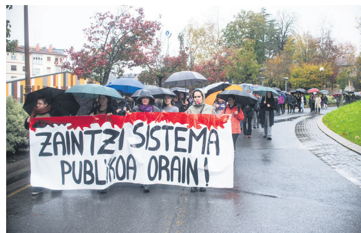
Kale bira egitearekin batera herriko zaintzaren egoera ikusarazi zuten.