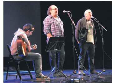
Lizardi eta Labaka, bertsotan. TXINTXARRI

Hitzordua etzi izango da, hilak 3, 18:00etan, kultur etxeko auditorioan. Sarrera doakoa izango dela jakinarazi dute antolatzaileek.