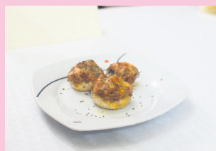
Txanpinoi beteak. TXINTXARRI

Jaki goxo askoak prestatu dituzte herriko sei ostalaritza establezimenduk gaur (hilak 24) hasiko den pintxo biderako: Plan B, Araeta, Herriko Etxea, Lasarte-Berri, Arima eta Buenetxea animatu dira aurten.