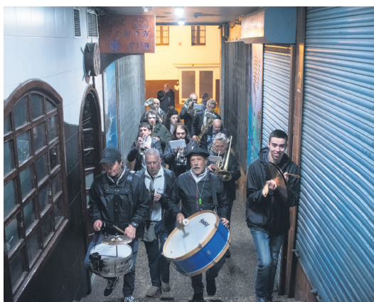
Oaintxe in deul txarangako lagunak, erdigunetik. TXINTXARRI