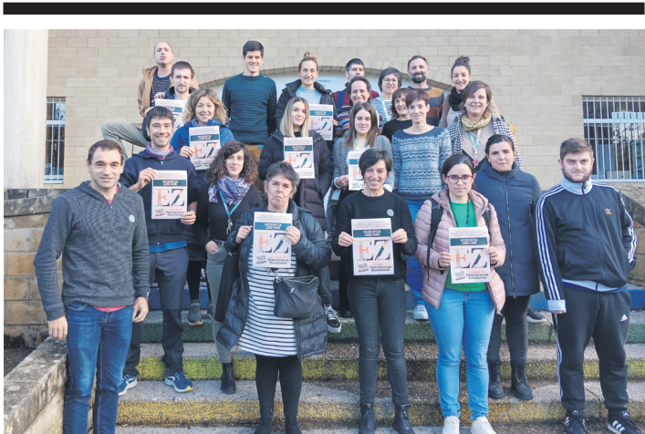
ORRIARTEKO IRAKASLE GELA

Baina gaur, telebista piztu eta albistegietan Gaza ikusi dut, edo Gaza izan zenekoa, ez ibai, ez putzu, usaina kirats eta giroa lauso. Burdina, harria eta hautsa, hondakina hondakinaren gainean, kolorea galdu arte suntsitua.