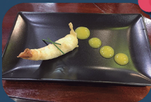
LASARTE BERRI TABERNA Tigre otarrainxka zitriko tenpura mango kremarekin