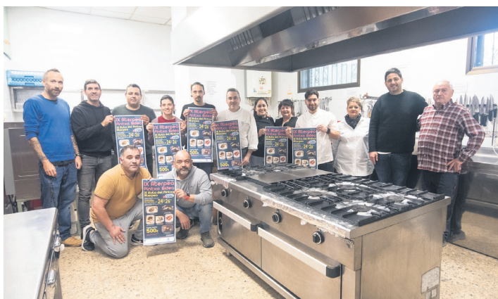
Semblante Andaluz elkarteak aurkeztu dute egitasmoa. TXINTXARRI