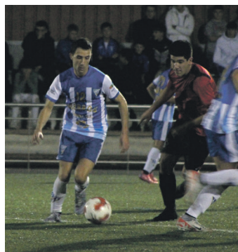
Jokalaria baloiarekin ihesi. TXINTXARRI

Bigarren zatia lekuz kanpo hasi zuen etxeko hamaikakoak eta bi hutsez baliatuz, Usurbilek estuasun larrian jarri zuen etxeko taldea, 0-2. Urdin-zuriek ez zuen amore emango, ordea. Texasek aldaketak egin eta "aire freskoa"