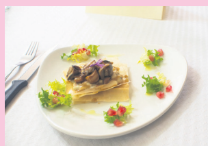
Onddo kurruskaria. TXINTXARRI

PLAN B KAFETEGIA (HIPODROMO ETORBIDEA, 15)