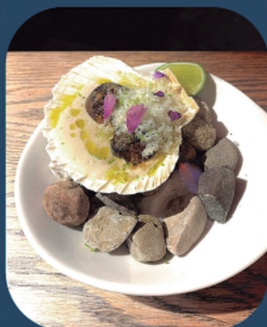
ARAETA SAGARDOTEGIA 'Cantara': itsasoa eta lurra fusionatzen dituen bieira gratinatua