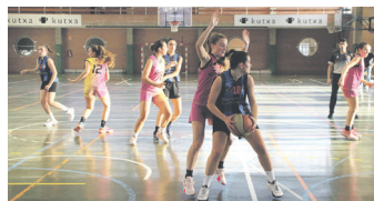
Neurketako irudia. TXINTXARRI

Partida berdinduta hasi zen, baina defentsa huts batzuek zarauztarrek 8-0 aurreratzea ekarri zuen. Talde urdin-beltzak ongi erantzun zuten, ordea. Defentsa berregin eta aldea sei puntutara jaistea lortu