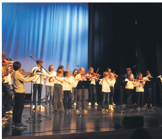
Biolin jotzaile kuadrilla hau ederki aritu zen. TXINTXARRI

Hurrengo egunean, iluntzean, Arrieskalleta elkartetik abiatuta erdigunean barrena ibili zen Oaintxe in deul txaranga. Ez ziren bakarrak izan, herriko txistularien taldea ere animatu baitzen kalejira egitera, Jalgi kafe antzokian bukatu zena. Horrez gain, Alboka Abesbatzak igande honetako (hilak 26) meza girotuko du, San Pedro parrokiakoa, 12:30ean. Kantatu ostean, abeslari eta bazkideak bazkaltzera joango dira. Bestalde, Gipuzkoako Errioxa Etxeak antolatutako Udazken Kulturalean parte hartu dute.