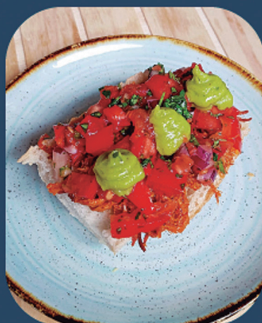
ARIMA GASTROTABERNA Txerri haragi marinatua, guakamole eta 'pico de gallo' saltsa mexikarrekin