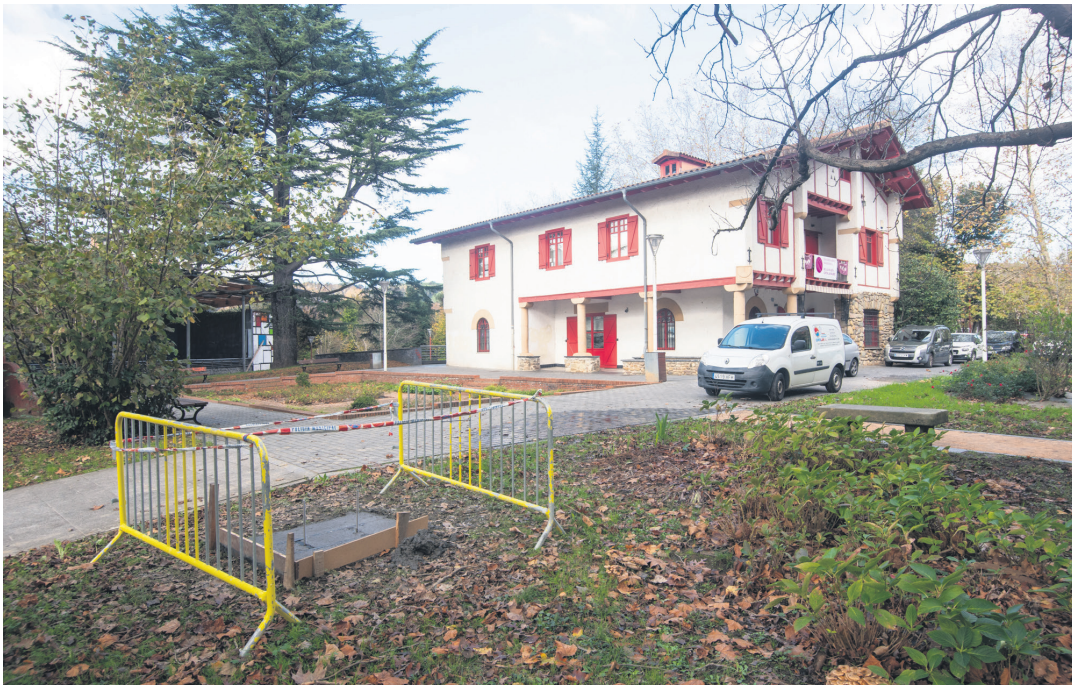
Monolitoa jartzeko eremua, hesi artean dagoena, prest dago honezkerok. Atzean, Mirentxu eraikina. TXINTXARRI