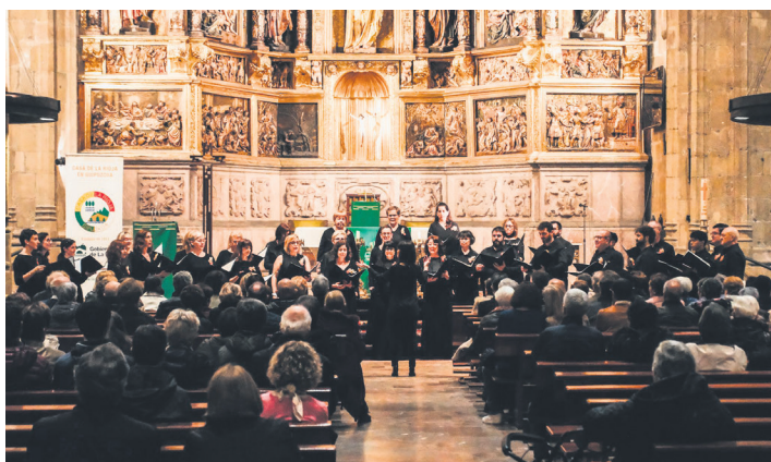
Albokako kideak, Donostiako San Vicente elizan emandako kontzertuan. ALBOKA