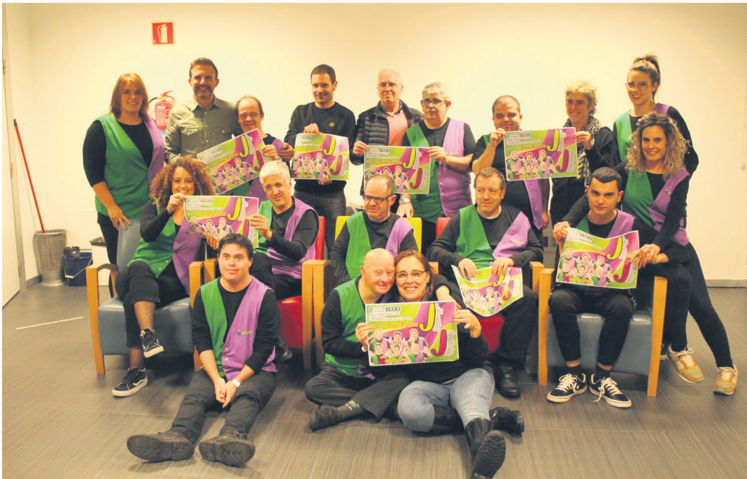
Jalgune elkarteko kideak, hainbat udal ordezkari ondoan dituztela, abenduaren 2ko jaialdia iragartzeko prentsaurrekoan.