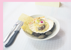
Bieira gratinatua. TXINTXARRI