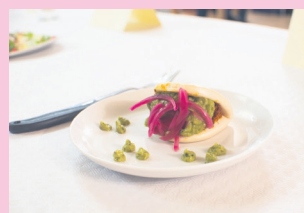
Txerri haragi marinatua. TXINTXARRI

HERRIKO ETXEA JATETXEA (KALBARIO BIDEA, 7)