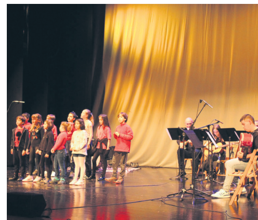
Ahotsak instrumentuekin uztartu zituzten. TXINTXARRI