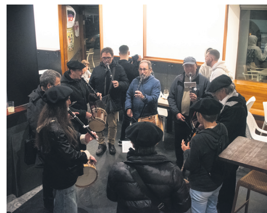
Jalgin amaitu zuten kalejira txistulariek. TXINTXARRI