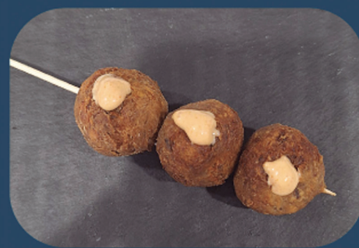
HERRIKO ETXEA JATETXEA Kimchi maionesarekin betetako haragi kruxpetak