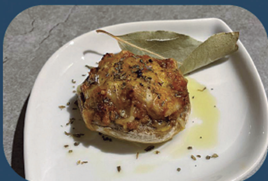
PLAN B KAFETEGIA Bolognesa haragi eta gaztarekin betetako txanpinoa