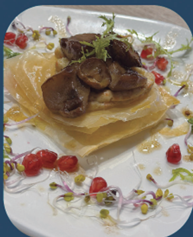
BUENETXEA TABERNA-KAFETEGIA Onddo, berdura bexamel eta trufa zuri oliodun kurruskaria