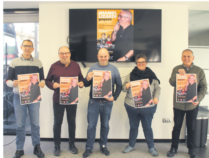
Mercero gunean aurkeztu dute, antolatzaileek, oroimen ekitaldia.