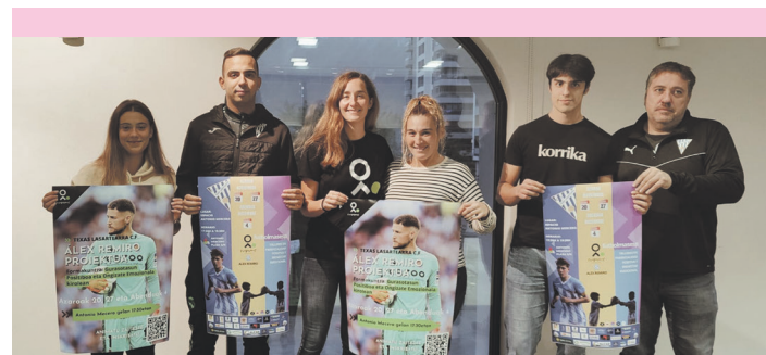
Texas Lasartearra CF, Remiro proiektuko zein udal ordezkariak. TEXAS LASARTEARRA CF

Eta horretarako erregionaleko jokalaria lanean ederki ari