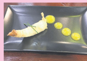
Tigre otarrainxka. TXINTXARRI

ARAETA JATETXEA (BERRIDI BIDEA 22, ZUBIETA)