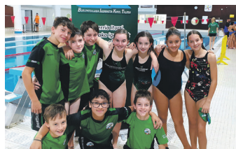
Alebin mailako igerilariak. BURUNTZALDEA

Guztiak ondo igeri egin zutela nabarmendu dute igeriketa talde-