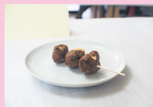
Haragi kruxpeta beteak. TXINTXARRI

BUENETXEA TABERNA-KAFETEGIA (PABLO MUTIOZABAL KALEA, 2)