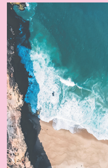
'Praia do Norte'.