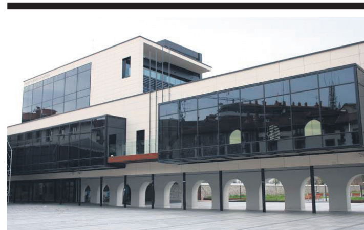
Lasarte-Oriako Udalaren artxiboko irudi bat. TXINTXARRI

Antolatzaileek kontzientzia hartzera eta Europako Mugikortasun Asteako jarduera horietan parte hartzera animatu dituzte herritarrak.