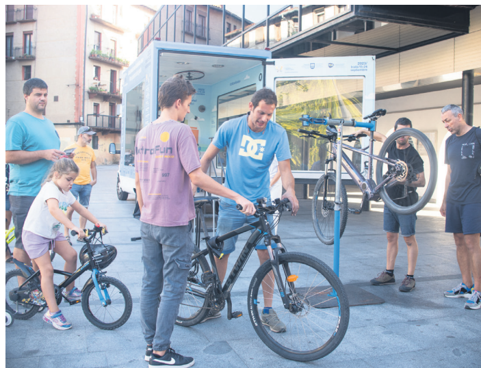
Bizikletak berrikusi eta konpondu dituzte Okendo plazan. TXINTXARRI

Esan bezala, aurten helarazi nahi duten mezua da baliabide jasangarriak eta gutxiago kutsatzen duten ibilgailuak erabili behar dituztela herritarrek, hala nola, oinez ibiltzea, bizikleta edo autobusa. Bestalde, udalak gogoratu du Mugikortasun Jasangarriaren plana egina dagoela eta bertan jasotakoa inplementatzea dagokiela orain. Norabide horretan, bi igogailu-Zabaleta auzora igoko da bat, eta besteak Kale Nagusia eta Goikale lotuko ditu, Zataraine-