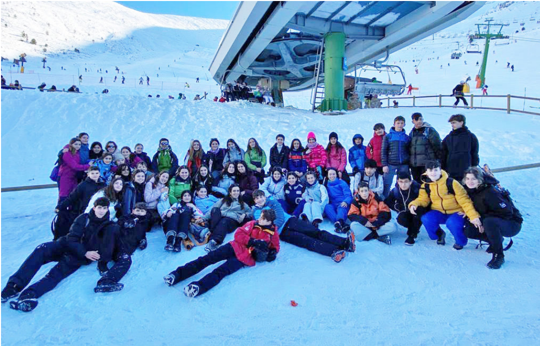
Kuadrillategiko partaide eta begirale talde bat, eski irteera batean. TTAKUN KULTUR ELKARTEA