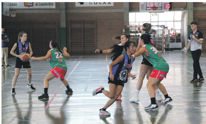
Junior Errendimendu taldearen neurketako irudia.

Lehen minutuetatik markagailuan behera joan zen herriko