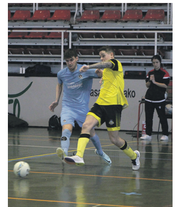
Iazko denboraldiko neurketa. TXINTXARRI

Mendi festaz gain, LOTMEko kideek urteko jardueri jarraipena emango diete urrian. Hil horretako 21ean eta 22an, bazkide eta elkarteo lagunek Pirinioetara egingo dute irteera, Panticosara (Huesca) zehazki eta Garmo beltza igoko dute.