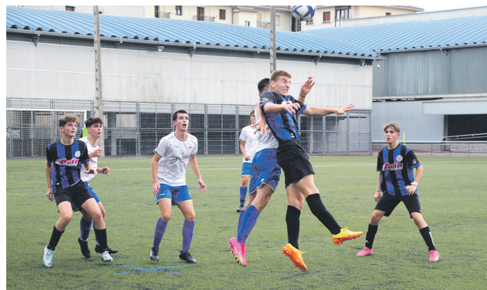
Ohorezko Jubenileko eta Añorgako jokalariek, baloia.

Aurkariak ere ez zuten arriskurik sortu. Etxeko taldearen akatsa bilatu eta gola egiteko asmoz jokatu ziren añorgatarrak erasoan. Defentsan, aldiz, Ostadarren jokoa oztopatzen saiatu ziren neurketa