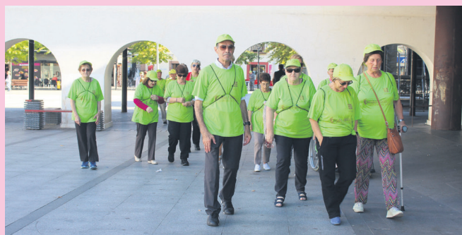
Herritar talde bat, paseo bati ekiten. TXINTXARRI

Datorren urteko ekainera arte, Okendo plazan elkartuko dira ostiraletan, 11:00etan. Paseoak luzeagoak izango dira aurten, 12:30era artekoak.