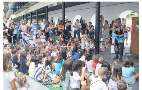
Ikus-entzule gaztetxoak, Amaluraren ipuinak entzuten. TXINTXARRI