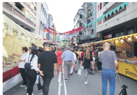
Jendetza ibili zen azokako postuetan.