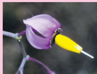
'Eguzkia gabon esanez'.