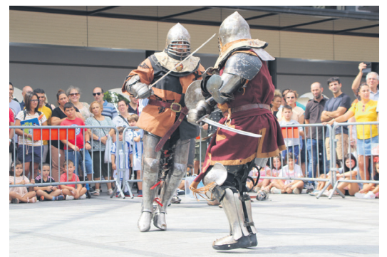
Borrokaldi ikusgarriak egin zituzten gerlariek. TXINTXARRI