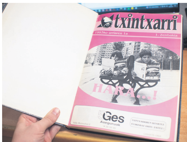
1993ko urriaren 1ean argitaratu zuen TXINTXARRI-k lehen zenbakia. TXINTXARRI

Hiru hamarkada hauetan metatutako artxiboa da TXINTXARRI-ren altxor preziatuenetako bat. Lasarte-Oriako Udaleko Euskara Batzordearekin eta Udal Liburutegiarekin hala adostuta, mila aldizkari baino gehiago eraman ditu duela gutxira arte biltegi izan den Erribera kaleko lokaletik kultur etxeko hirugarren solairura. Hilaren 29ko aldizkarian landuko du gai horri buruzko informazioa, luze eta zabal.