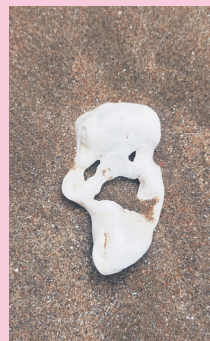
'El grito de Munch'.