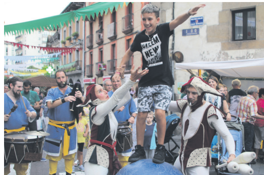
Akrobaziak egiteko aukera izan zuten herritarrek. TXINTXARRI

Ostiral arratsaldean izan ezik, antolatzaileek eguraldia lagun izan zuten feria aurrera eraman bitartean eta horrek ere lagundu zuen, jende ugari ibili baitzen postu eta ikuskizunetan barrena.