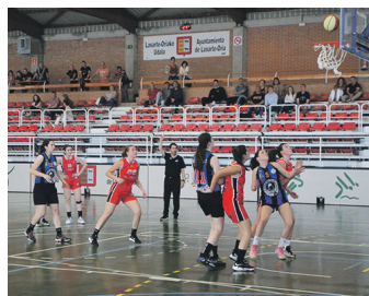
Iazko sasoiako neurketa bat. TXINTXARRI

Saskibaloiko zaletuek goiz pasa ederra egin dezakete, bi neurketak jarraian izango baitira. Lehenik kadeteak aterako dira