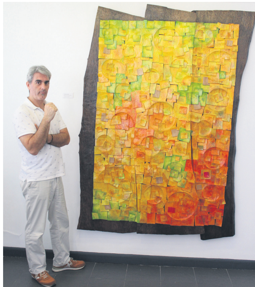
Huegun 'Udazkeneko euria' artelanaren aurrean. Udazken koloreko hostoak, eta euri tantak irudikatu ditu obra horretan. TXINTXARRI

'Arbasoak' izeneko erakusketa zabalik du eskultorea, Donostian. Bi solairuko erakusketa aretoan, hamasei artelanez atondua; lau eskultura eta hamabi mural. Guztiak zurezkoak