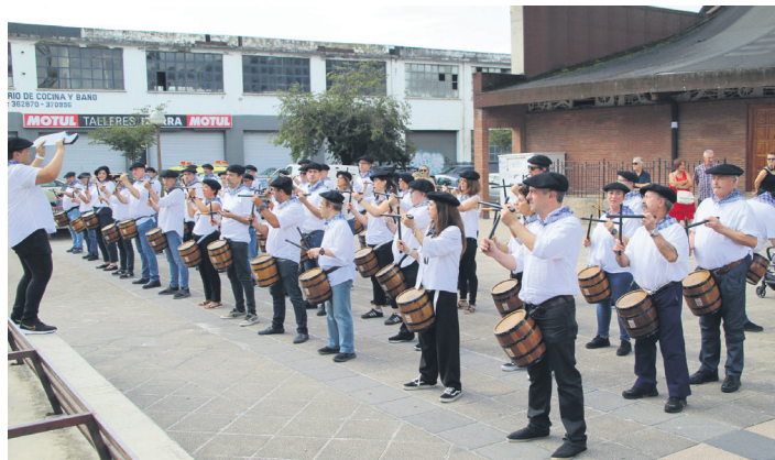
Geldialdi bat Arantzazuko Amaren parrokiaren aurrean egin zuten. TXINTXARRI