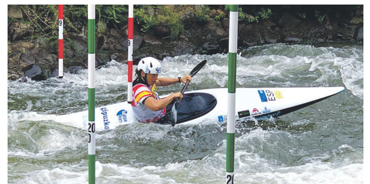
BAT BASQUE TEAM