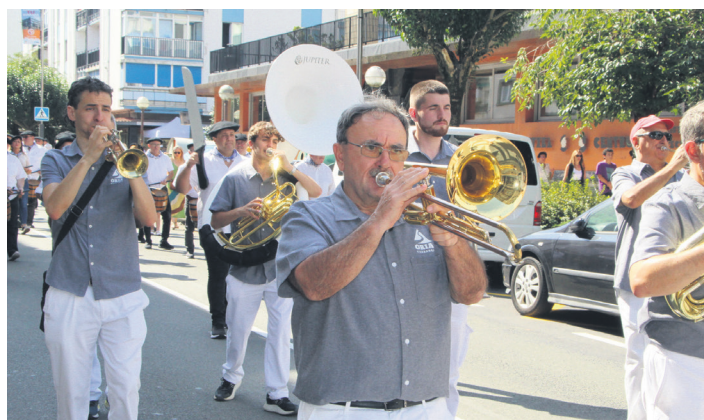
Oria txarangako musikariak izan zituzten lagun danbor jotzaileak. TXINTXARRI

ekainerako dena prest zegoen. "Data ofiziala da uztailekoa, orduan eman zuelako zabaltzeko baimena garaiko gobernadore