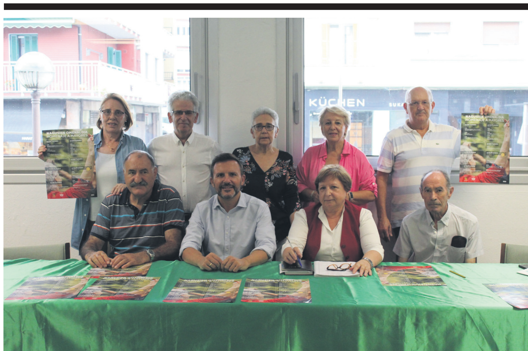
Biyak Bat egoitzako zuzendaritza batzordea eta udal ordezkariak ekimena aurkezten. TXINTXARRI