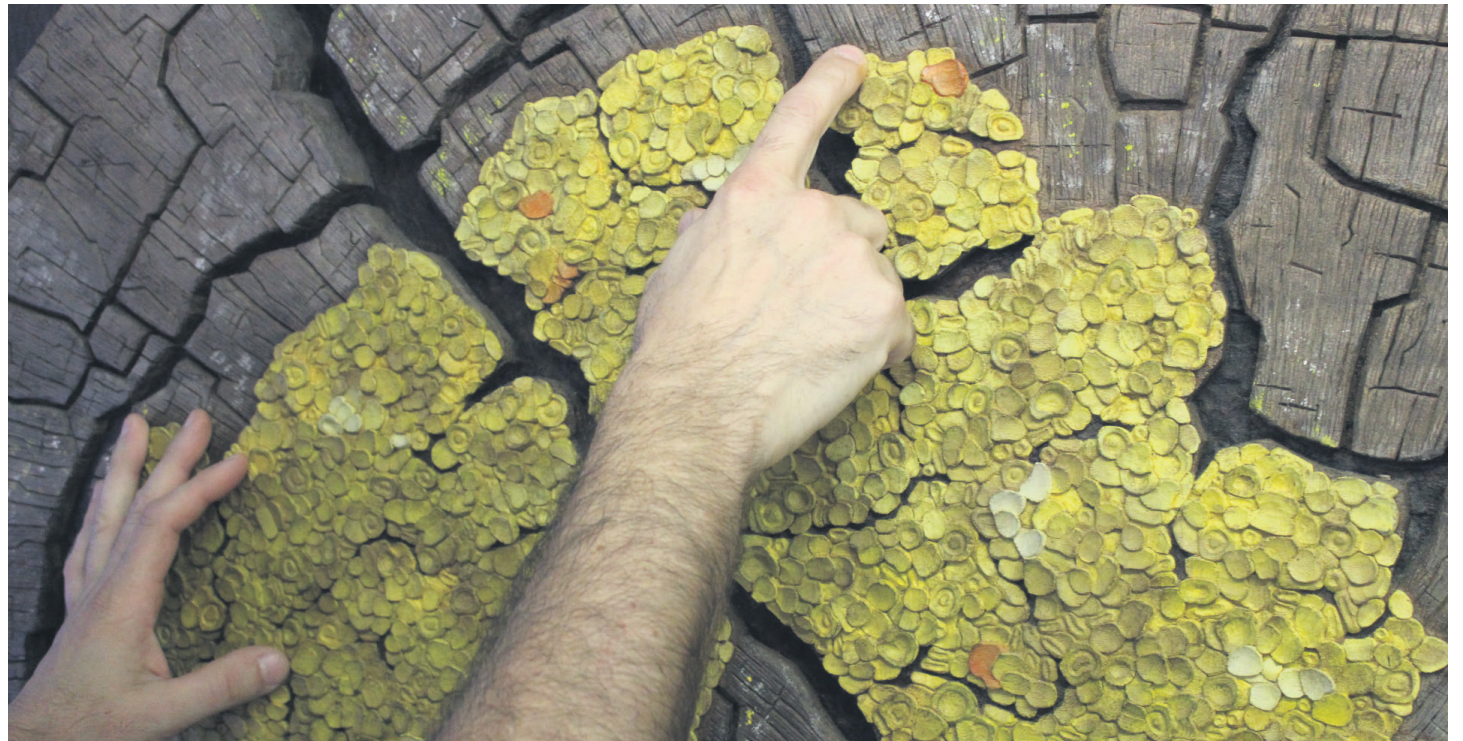
Huegunen eskuak, 'Liken I' artelanaren gainean. Obra hori izan da 'Arbasoak' osatzen duten guztietatik egin zuen lehena. TXINTXARRI

nortasun bat dauka; mendeetan zehar, gure etxeetako altzarieta- rako erabili diren egurrak dira, orduan, gurekin ere lotura hori badute.