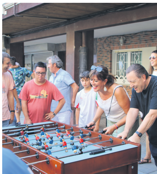
Jalgune elkarteak antolatutako futbolin txapelketa. TXINTXARRI