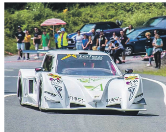
Manso, Talex M3a gidatzen. A. MANSO

Mendiko gidariak abuztuan atsedena izan duten arren, uzta-laren 22an, San Cosme igoerari eta hilabete hasieran Dimako