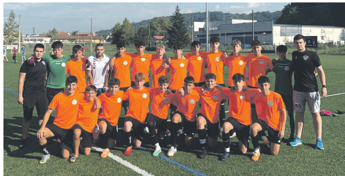
Kadete Ohorezko taldea, neurketa hasi baino lehen. OSTADAR SKT

Aldaketa batzuei esker, bigarren zatia indartsu hasi zuen ohorezko kadete taldeak. Alabaina, lehen zatia antzera, urdin-beltzek