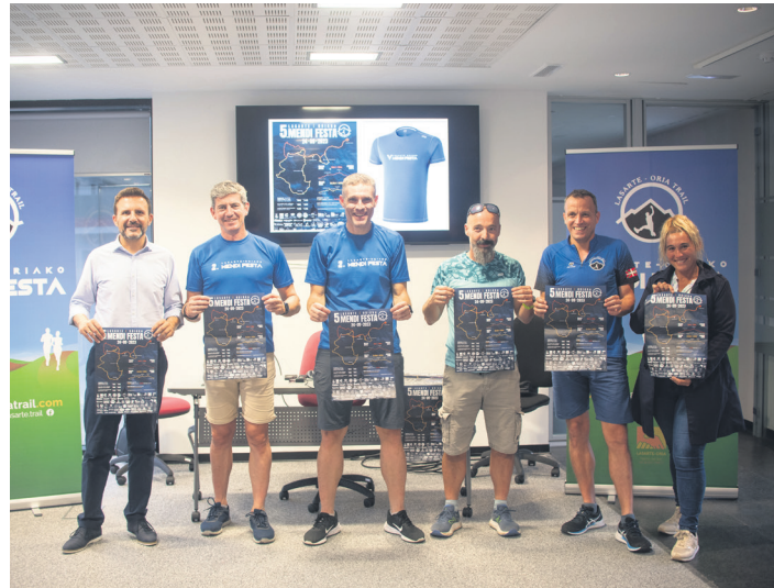
Udal ordezkariak eta LOTMEko kideak, aurkezpen prentsaurrekoan.

Horiek, aurreragorako kontuak. Aurtengo festari dagokionez, partaideak, ohi bezala, Okendo plazatik irtengo dira: ibilbide luzea egingo dutenak (26,5 kilometro eta 1.350 kilometroko desnibel positiboa), 07:00etan, eta motza gauzatuko dutenak (15 kilometro eta 700 metroko desnibela), 09:00etan. Olazagoitiak gogorazi du izen ematea zabalik dagoela eta tramitea www.lasarteoria-trail.com .