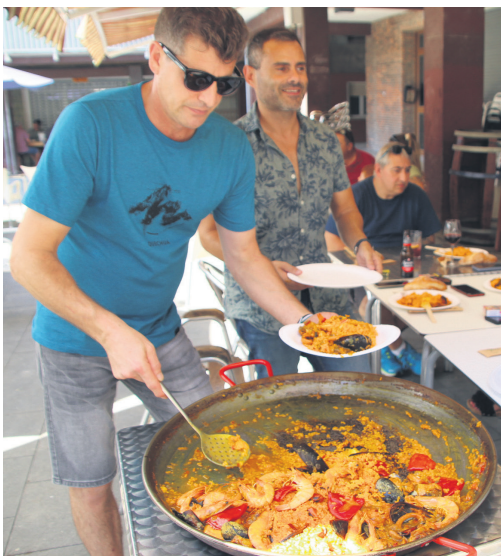
Paella goxo batekin indarrak hartzen. TXINTXARRI