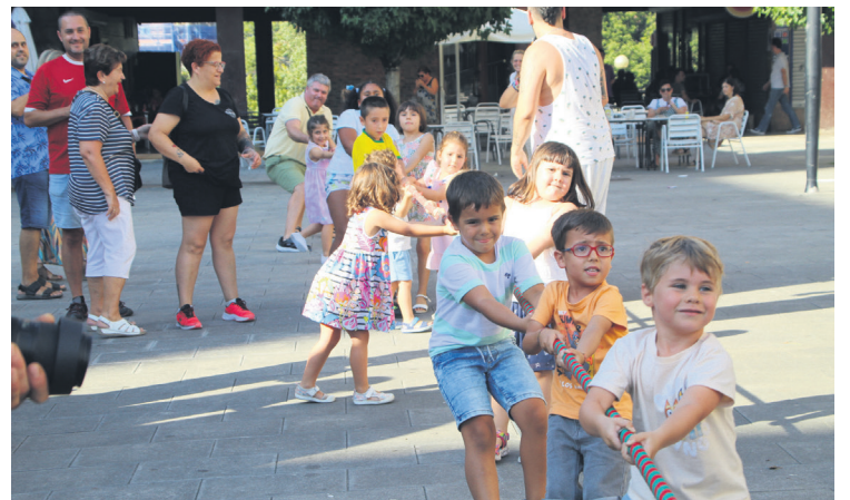
Haurrek ere primeran pasa zuten jaietan zehar. TXINTXARRI