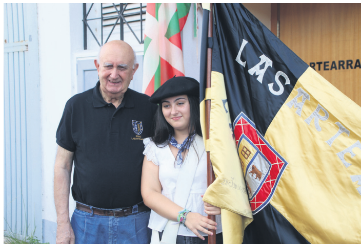
Belaunaldi desberdinetako herritarrek parte hartu zuten danborradan.

Lasartearra 1973ko uztailearen 31n inauguratu zuten, nahiz eta