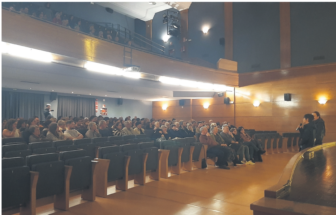
'20.000 especies de abejas' proiektatu osteko solasaldia, Estibaliz Urrezola zuzendariarekin. OKENDO ZINEMA TALDEA