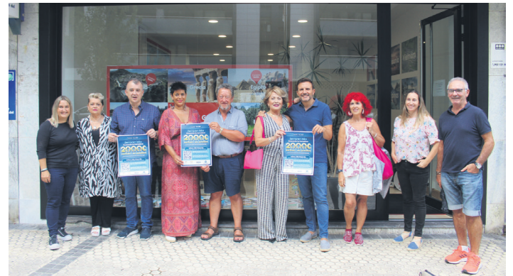
Merkatarien elkarteko kideak Noaia bidaia agentzian, Ferraren bila aurkezten. TXINTXARRI

Lasarte-Oriako Udalak dei egin die herritarrei kanpainarekin bat egin eta egitasmoan parte hartzera. Eskerrak eman dizkio merkatarien elkarteari herriko merkataritza sustatzeko egiten duten ahaleginagatik.