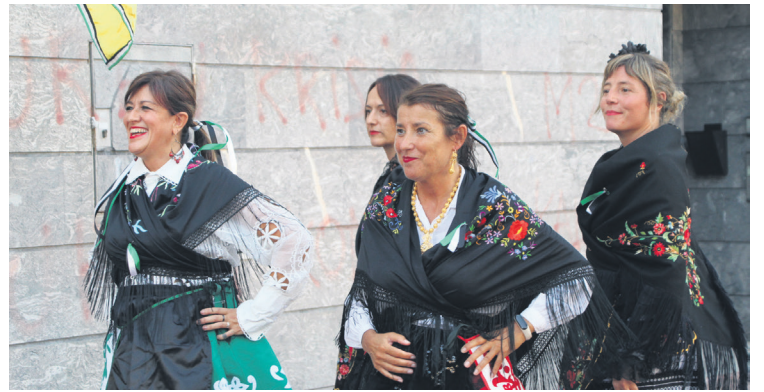
Extremadurako jantzi tradizionalen desfile koloretsu bat egin zuten.

Hitz gutxitan esanda, egun horietan zehar Sasoeta auzora bertaratu zenak Extremadurara bidaiatu zuen, gure herritik ateratzeko beharrik gabe. Adarra kaleko egoitzatik bandera kendu eta datorren urtera arte gorde badute ere, egitasmoak aurrera eramaten jarraituko dute Lasarte-Oria girotzen jarraitzeko.