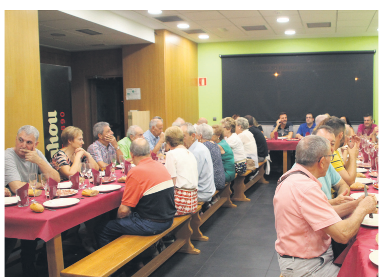
Elkartea lepo bete zuten afaltzera eseri ziren bazkide eta udal ordezkariak. TXINTXARRI