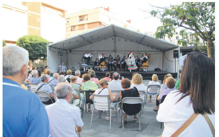
Brotos de Encina taldearen emanaldiak herritarren ikusmina piztu zuen. TXINTXARRI