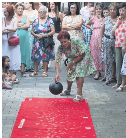
Bolo txapelketako partaideetako bat, jaurtiketa egiten.