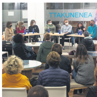
Mahai inguruko partaideak.