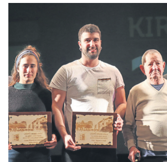
Aurtengo hiru sarituak. TXEMA VALLES

Hiru pozarren jaso zituzten aitortzak, eta hunkituta hitz egin zuten ikus-entzuleen aurrean. Ondoren, udal ordezkariak talde argazkia egin zuten irabazleekin, eta ostean, nahi zuenak izan zuten gauza bera egiteko aukera, kultur etxeko harreran jarritako photocallean.