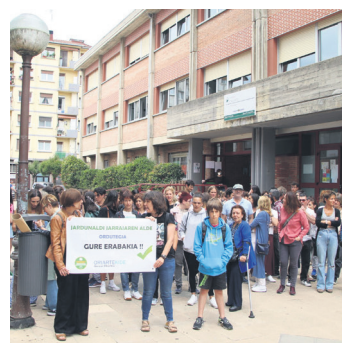
Mobilizazioaren une bat. TXINTXARRI

EAEko institutuek 2022-2023 ikasturtean lanaldi jarraiturik ez edukitzea erabaki zuen Eusko Jaurlaritzako Hezkuntza Sailak. Horrek "haserrea eta ezin ulertua" eragin zion Lasarte-Oriako Oriartekide institutuko komunitateari, eta kontzentrazioak egin zituzten ikastetxe atarian.