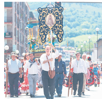
Semblantekoak, erromerian. TXINTXARRI

Huelvako El Rocion hilabete hasieran ospatu zuten erromeria eta astebete geroago Lasarte-Oriara ekarri zuen erromesaldiaren izpiritu bera Semblante Andaluzek. Hamaika ekimen izan ziren asteburuan. Igandea izan zen egun handia, Zumaburuko Arantzazuko Ama parrokian ohiko meza rozieroa egin zuten. Altarearen albo batean Rocioko ama birjinaren irudia zegoen, bestean, berriz, eskaintzarako olibondoa, gozoak eta olioak. Semblante Rociero koruak girotu zuen elizkizuna, eta amaieran, Duende taldeko lau neska gaztek dantza egin zuten. Aitzakia hori baliatu zuen elkarteak, bere 30. urteurrena ere ospatzeko.