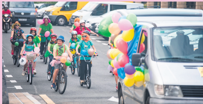
Kukukako kideek desfile koloretsua egin zuten herrian barrena. TXINTXARRI

Kukuka eskolako kideek, XX. Antzerki eta Dantza Astea ospatu zuten, lanabes ugariarekin herria koloreztatu zuten: desfilea, antzerkia, euskal dantza, sorkuntza, dantza garaikidea... Manuel Lekuona Kultur Etxean diziplina horietan guztietan oinarritutako emankizunak egin zituzten, eta, ordainetan, ikus-entzuleen txalo zaparrada ederrak jaso.