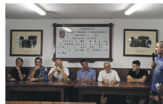
Pilotari buruzko mahai ingurua. TXINTXARRI

Herrian zehar "estrategikoki" kokatuko dituzten sei instalazioren bidez, udalerriko ia biztanle guztientzat energia trantsizioa ziurtatuko du TEK energia komunitateak. Eusko Jaurlaritzak, Gipuzkoako Foru Aldundiak eta Next Generation funtsak diruz lagunduko dituzte egitasmoak; inbertsioa 1.500.000 eurokoa da.