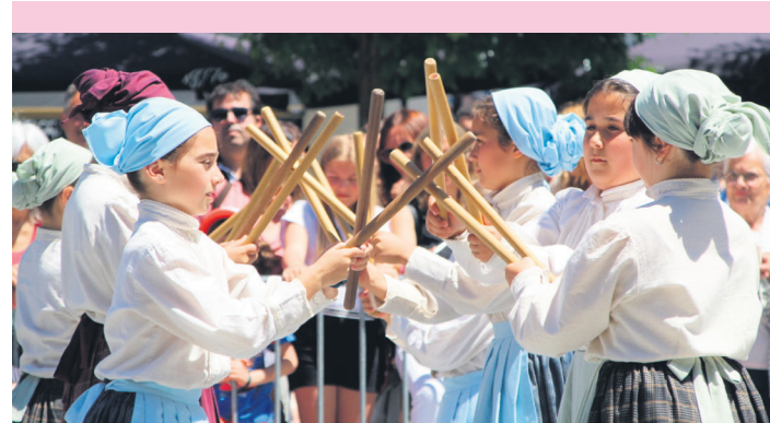
Dantzari Txiki Egunean parte hartu zuten dantzari batzuk, emanaldian. TXINTXARRI

Zabaleta Auzolan elkarteak lagunak mimo eta ilusioz prestatu zuten 2022. urteko festen egitaraua: hamaika jarduerak iragarri zituzten, eta horien berri emateko, elkarrizketa egin genien aldizkarian. Aukera hori baliatu zuten lasarteoriatar guztiak jaiez gozatzera gonbidatzeko.