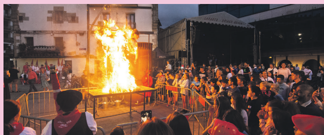
Santa Ana eguneko epaiketaren ostean, deabruak akusatua erre zituen. TXINTXARRI

Gure herriko usaioari jarraikiz jarduera ezberdinak antolatu zituen hilaren 26an Ttakun Kultur Elkarteak udalaren laguntzaz. Goizean meza, luntxa eta