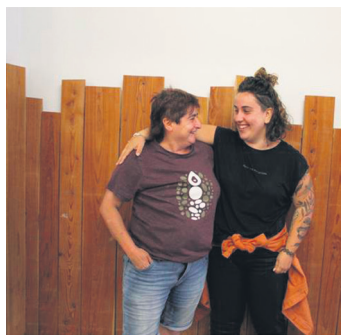
Izan Inurriko bi kide.

Ostadar SKTren Auzolan saria jaso zuen Izan Inurri elkarteak, eta aintzatespen hori aitzakia hartuta, elkarrizketa egin genien. Ohore handia" izan zen aitortza elkarteko kideentzat, eta bertan bizitako berri eman zioten -ri. Horrekin batera, Tabuen kutxatik oholtzara bertso saio musikatzu ere hitz egin zuten.