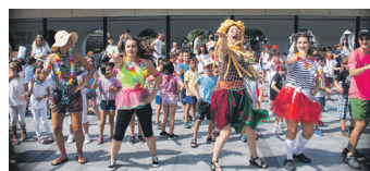
Udako Txokoetako haurrak dantzan. TXINTXARRI

Ttakun Kultur Elkarteak antolatutako Udako Txokoak eta kanpandiak burutu ziren. Haur eta gaztetxoek primeran pasa zuten.