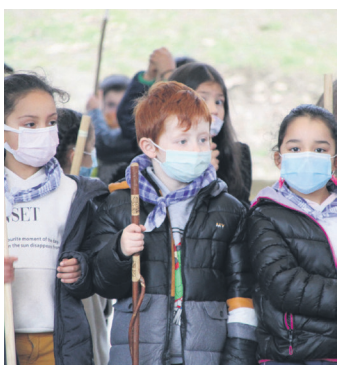
Ikasleak makilak astintzen. TXINTXARRI

Herriko zenbait eragilek bertan behera utzi zituzten aurtengo saioak, baina, hala ere, usadioari eutsi zioten Erketz EDT dantza taldeko kideek eta santa eskean irten ziren. Halaber, herriko ikastetxeetako ikasleek ere makilak astinduta oles egin eta herriko kaleak girotu zituzten.