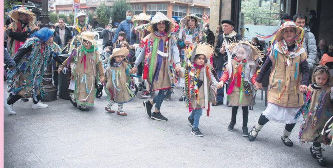
Txantxoak dantzan eta kantuan ibili ziren Euskal Inauterietan. TXINTXARRI

Osasun neurri ia denak kenduta, gogotsu bizitu zituzten Inauteriak lasarteoriatarrek. Ikastetxeetako irakasle eta ikasleak izan ziren irudimena (eta gorputza) dantzan jartzen lehenak. Ondoren, Ttakun Kultur Elkartearen Amarauna Kluba, Gazte Kluba eta Kuadrillategiko gazteak. Larunbatean, berriz, herritarren eta konpartsen txanda izan zen, eta igandean, Euskal Inauteriana.