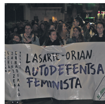
Asunak-en elkarretaratzea. TXINTXARRI

Azaroaren 25aren harira, askotariko ekimenetan parte hartu zuten, beste behin, indarkeria matxista gaitzetsi eta horrekin amaitu behar dela eskatzeko. Horren harira, kontzentrazio eta manifestazio bana aurrera eraman zituzten udalak eta Asunak talde feministak, hurrenez hurren.