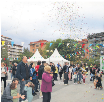
Andatza plazako txupinazoa.