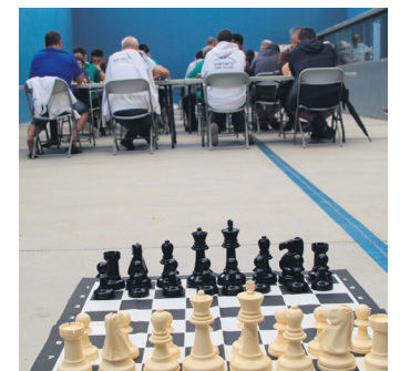
Txapelketako partaideak.

Pilota hotsek erlojuen soinuei egin zieten lekua Mirentxu Trinketeen. I. Lagunarteko Taula Xake txapelketa jokatu zen bertan eta Abadiñoko taldea izan zen nagusi. Bizkaitarrek sari nagusia eraman zuten arren, asko ikasi zuten jokalariek guztiek, baita txapelketako antolatzaile Taula Xake Klubeko kideek ere.