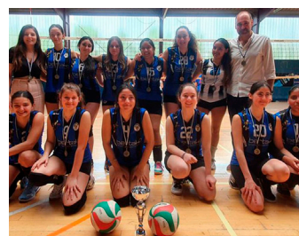
Boleiboleko jubenilak. OSTADAR BOLEIBOLA

Ostadar Boleibola saileko jubenilek Aldapeta Maria A taldea garaitu zuten Gipuzkoako txapelketako finalean. Lehen seta galtzen hasi arren, jokalaria urdin-beltzek gogor borrokatu eta itzulua eman zioten neurketari, merezitako saria eskuratzeko.