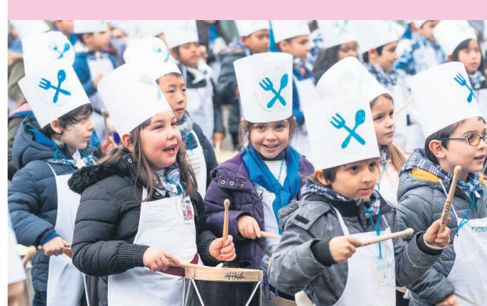
Ikastetxeetako hurrek gogotsu jo zituzten martxak.

Euskara familiartein indartsuago transmititu dadin lanean ari dira