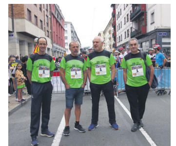
Aurtengo omenduak.