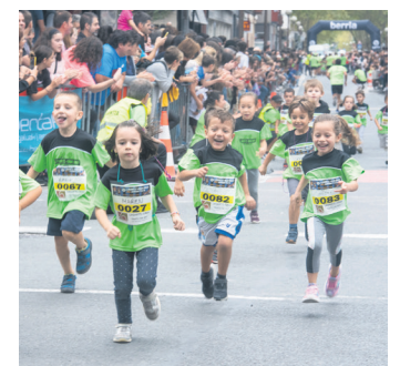
Korrika Festa. TXINTXARRI