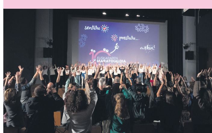
Herritarrek dantzan jarri zituzten Euskaraldiaren aurkezpenean. TXINTXARRI

VI. Txerria Hiltzearen jaia ospatu zuten Ama Guadalupe