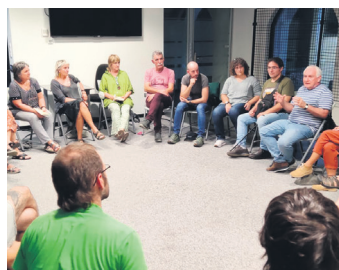
Sarrionandia, herrian. IRAKURLE TXOKOA