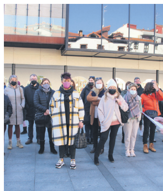
Elkarretaratzeko irudia. TXINTXARRI

Aterpeak deituta elkarretaratzea egin zuten herriko saltokietan izandako lapurretak salatu, eta kaltetuei elkartzuna adierazteko. Asteburu berean hamar bat lapurreta egin zituzten. Gertaerak ikertzeko baliabideak eskatu zizkioten udalari eta Eusko Jaurlaritzari eta errudunak epaileen esku uzteko.