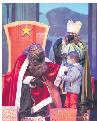
Errege Magoei harrera.

Urte berriari ongietorria emateko lehen hitzordua Errege Magoen bisita izan zen. Koronabirusa tarteko, ez zituzten herririko kaleak zeharkatu urtarrilaren 5ean, jende pilaketak saiheste aldera ekitaldi hori bertan behera uztea erabaki baitzuen udalak. Melchor, Gaspar eta Baltasar Manuel Lekuonan izan ziren; bertan jaso zituzten haurren eskutitzak eta harrera beroa. Eskatutako oparien zerrenda postontzietan sartu, eta pajeeek goxokiak eman zizkieten.