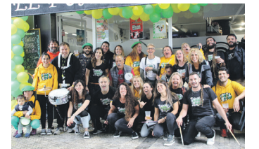
Batupoteoan ederki ibili ziren. TXINTXARRI

kontzertua. Taldeko kide eta kide ohiak batu zituzten batupoteoa eta bazkaria ere izan ziren.