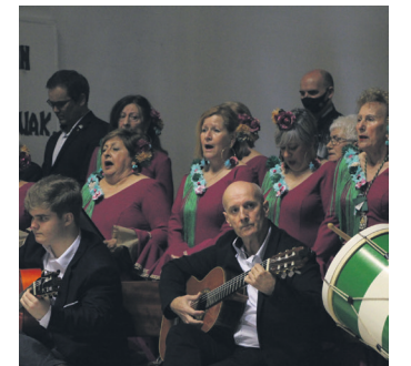
Semblante Rociero, meza.