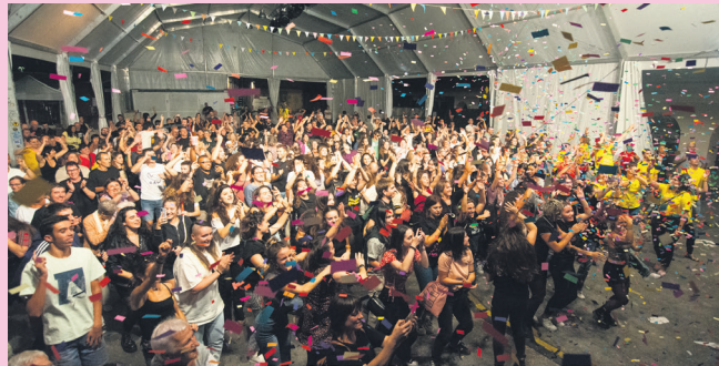
Herritarrek gogotik gozatu zuten Sentitu faseaz. TXINTXARRI

Sei urte luze eta gero, Lasarte-Oriak bere festa kuttunenetako batez gozatu zuten, Euskararen Maratoiak. Lasarte-Oriako Udaleko Euskara Zerbitzuak eta Ttakun Kultur Elkarteak 42 eguneko egitasmo bat antolatu zuten, Maratoia bera eta Euskaraldia lotzeko, hiru fasetan banatua: Sentitu, Prestatu eta Eta ekin!. Urriaren 22an hasi zen bide hori, esan bezala, festa giroan.