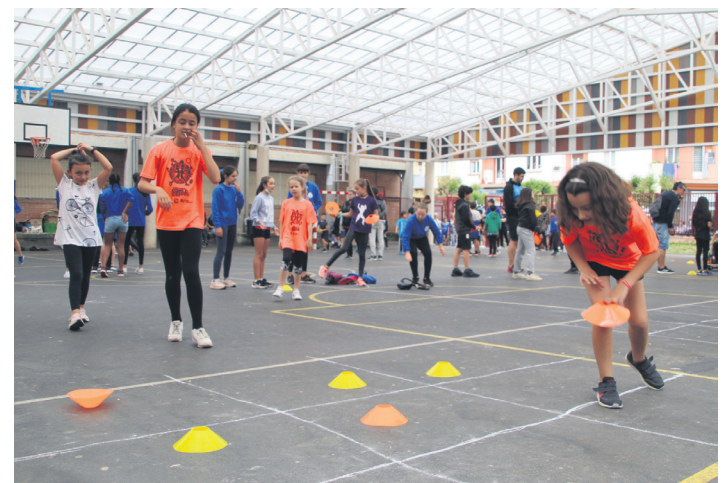
Nekatu arte jolasean aritzeko aukera izan zuten sari banaketa arteko tartean. TXINTXARRI