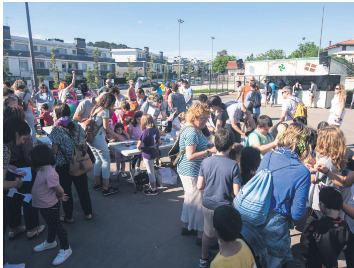
Haurrak izan dira lehenengo festa egunetako protagonistak. TXINTXARRI

Lantaldea aldizkari hau inprentara bidaltzen ari zen