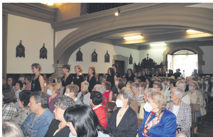
Bi koruetako kideak, Ama Brigitarren komentura sartzen.