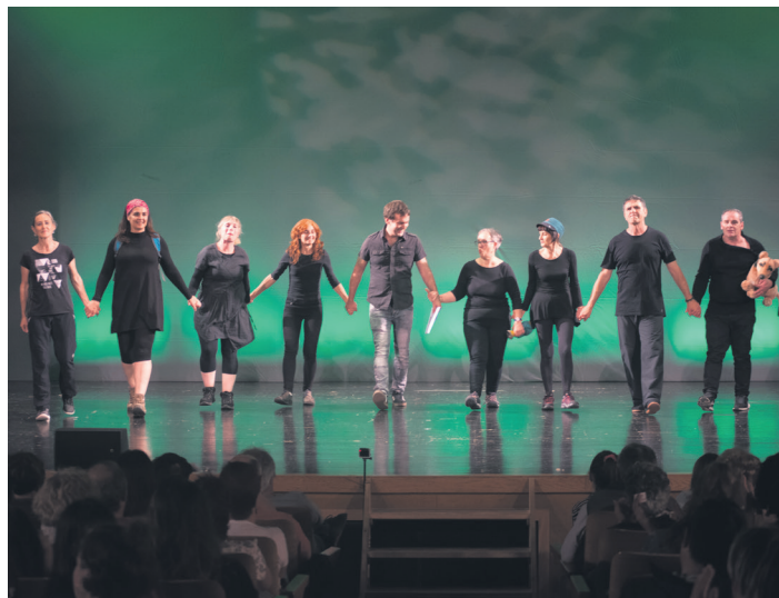
Helduen antzerki taldeak 2019an egindako emanaldi bat.

Bien bitartean, adin ugariak ikasleek zapalduko dute Manuel Lekuona Kultur Etxeko oholta, goizez zein arratsalde, astegun nahiz asteburu. Antzerkia, euskal dantza, euskal dantza sorkuntza eta dantza garaikidea jorratu dituzte kurtso honetan, eta diziplina horietan oinarritutako lanak partekatuko dituzte ikusentzuleekin. Kukukako arduradunek jakinarazi dutenez, haurren emanaldiek ikusteko sarrerek euro bat balio dute, eta helduenek, 3 euro (hilaren 11ko funtzio guztiek ere bai, larunbatekoek). Herriarrek