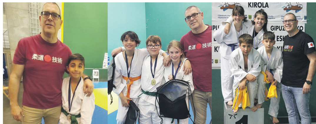
Alebin eta Alebin Txiki mailako judoketako batzuk eskuratutako domina eta sariekin. LOKE JUDO