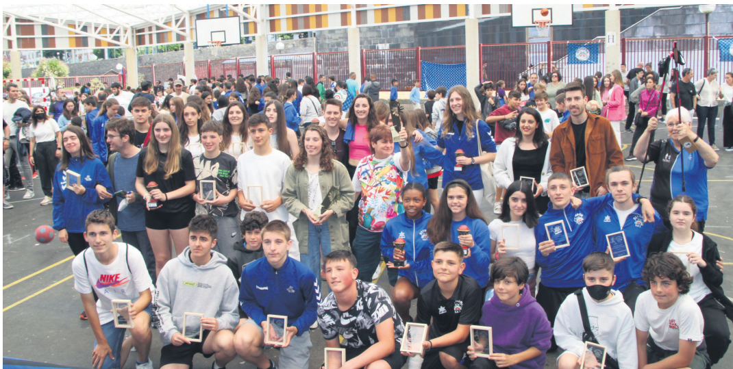
Sari banaketaren amaieran, Ostadarreko aurtengo jatorrenek elkarrekin egin zuten talde argazki bat.