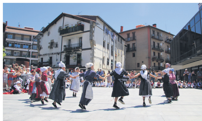
Dantza taldeetako gazteek Okendon egin zituzten emanaldi nagusiak. TXINTXARRI