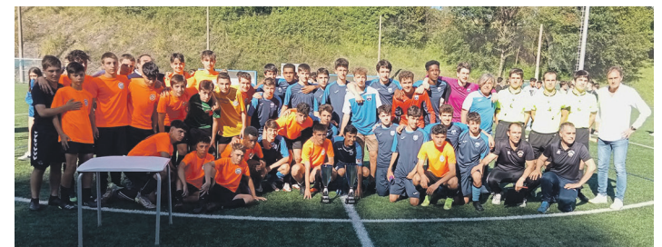
Ostadar eta Kostkaseko jokalariek partida amaitzean.