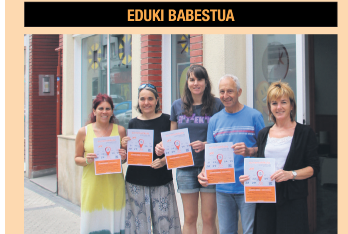
Muntteri AEK euskaltegiko kideak, eraikinaren atarian.