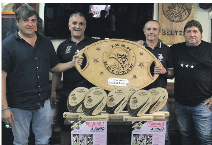
Beltzak RT taldeko kideak eta oroigarrien egilea, aurkezpenean. TXINTXARRI

Eguerdian errugbi neurketak hasiko dira. Cominter Tisu Hernanik Getxoko eta Eibarreko jokalariek osatutako talde bat izango du aurrez aurre. 16:00etan, aldiz, Beltzak Lasarteorians eta Atletico San Sebastian taldeen arteko norgehiagoka izango da.