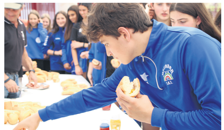
Festa amaieran zer jana ere izan zen errugbi taldeko kideei esker.