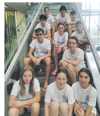
Gasteizen lehiatu ziren Buruntzaldea IKTko igerilariak. BURUNTZALDEA IKT

Udako txapelketako gutxieneko markak buruan, lehiatu ziren