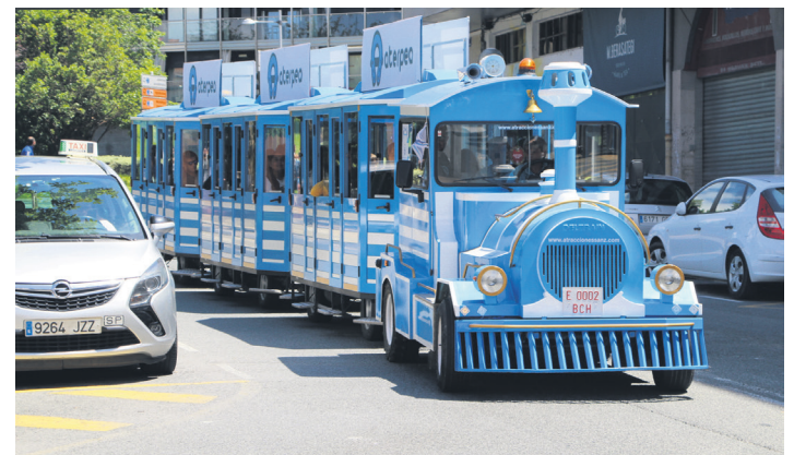
Txu-txu trenak herriko kaleak zeharkatu zituen. TXINTXARRI

Zuzeneko musikak ere izan zuen tarterik egitarauan: Nahio arropa dendaren alboan DJ batek girotu zuen arratsaldea, eta The Noise Makers taldeak rock doinuak eraman zituen Largonea kaleko Arkupe tabernara. Udaberri Festa amaituta, tokiko merkataritzaren aldeko ekimenak prestatzen jarraituko du Aterpeak.