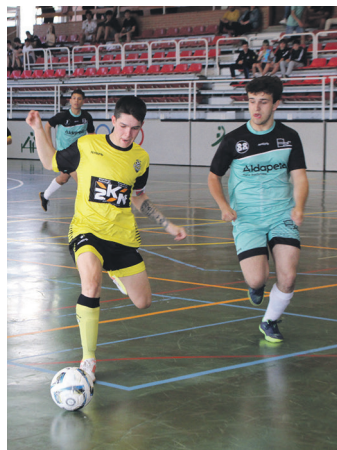
Finaleko momentuetako bat.

Prestatzailea pozarren dago jokalariek egindako lanarekin. "Torneoa irabazteak balio handia du, ligan jokatu duten talde guztiak parte hartu dute. Eta