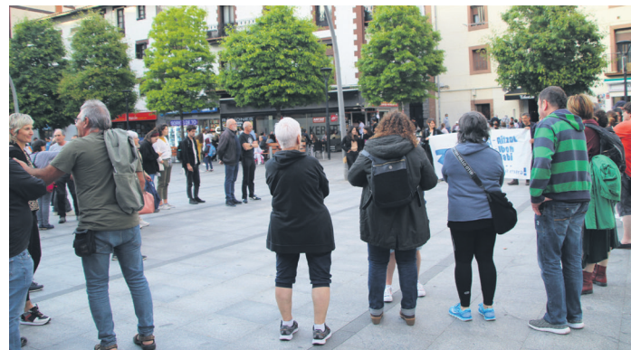
30 bat lagun batu dira maiatzeko Azken Ostiralean. TXINTXARRI

Aurrematrikularen prezioa (lehenengo ordainketa): 100 euro. Ikastaroa ez egitea erabakitzen bada, aurrematrikularen %100 itzuliko da ikastaroa hasi baino lehen jakinaraziz gero. Behin ikastaroa hasita, matrikula itzultzeko ohiko baldintzak aplikatuko dira.