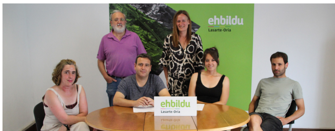
Lasarte-Oriako EH Bilduko kideek 2022ko aurrekontuetarako egindako lan ildoen proposamenak jakinarazi dituzte.