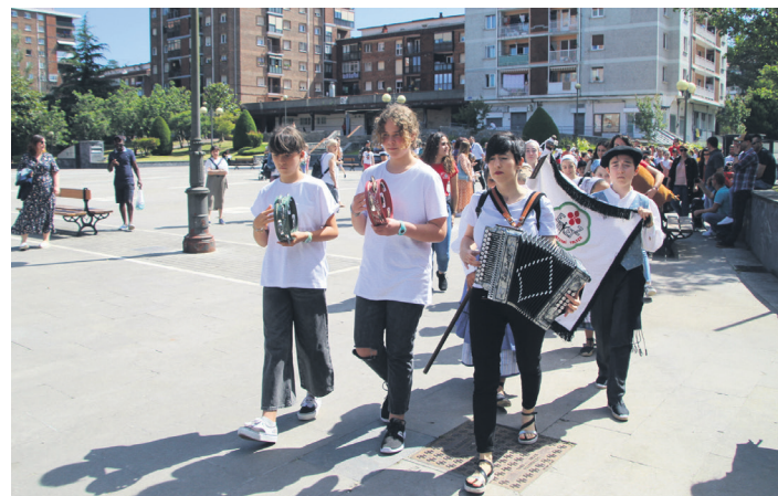
Ttiriki Ttarraka eskolako lagunek gidatu zuten desfilea. TXINTXARRI

dantzari txiki guztiak. Mugaren beste aldean, ikusleak. Eguraldi onak lagunduta, asko izan ziren saioa ikustera joandakoak. Talde bakoitzak prestatutako dantza bat edo bi egin zituen, arkuekin, makilekin, sueltoan, binaka, taldean... Era askotan mugitu zuten gorputza. Batzuetan, borroka jolasean ari zirela zirudien, are gehiago barrez lehertzen ari zirelako neskatoak. Ondo pasatu zuten seinale. Eguzkipean erakutsitako trebeziak ere bere saria izan zuen, eguna bezalako txalo sorta beroa. Bazkalostean, elkarri agur esan aurretik, jokoak egin zituzten plazan bertan.