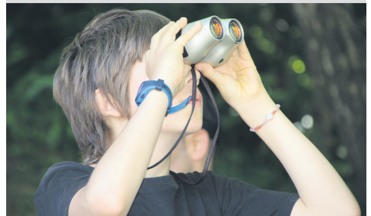
Gaztetxo bat, prismetikoak hartuta, hegazti bila. TXINTXARRI

Batetik, nahiz eta jendeari horrela ez iruditu, oso praktikoak eta erabilgarriak dira. Leku izenik gabe, oso zaila izango litzateke bizitzea guretzat. Esate baterako: gu biok hitzordu bat jarri behar badugu nonbait, toponimo bati