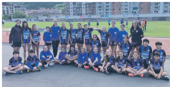
Alebin txapelketan parte hartu zuten taldeetako kideak.

Era horretara, Landaberri B taldea 64,5 puntu lortu zituen eta Gipuzkoako txapelketa euskarazetik gertu izan zen. Garaile izan zen Ordiziako Jakintza ikastolatik puntu erdira geratu zen.