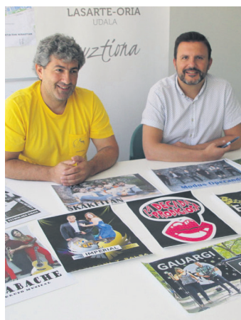
Udal ordezkariak aurkezpenean. TXINTXARRI

Kinada talde lasarteoriatarra izango da Okendoko oholztara igoko den lehena; ekainaren 29an joko du. Uztailaren lehen, berriz, Motxila 21, El Drogas eta Zea Mays taldeen txanda