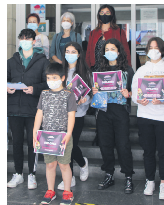
Kukuka eskolako kideak. TXINTXARRI

Txapelketako lehen saria irabazten duenak, Avenida tabernan bapo bazkaltzeko lau menu poltsikoratzeaz gain, 50