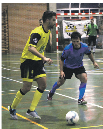
Neurketako irudia. TXINTXARRI

Markagailua murrizte aldera erasotzen jarraitu zuen Lasarte-Oriako taldeak. Tolosarrek ere aukerak sortu zituzten eta