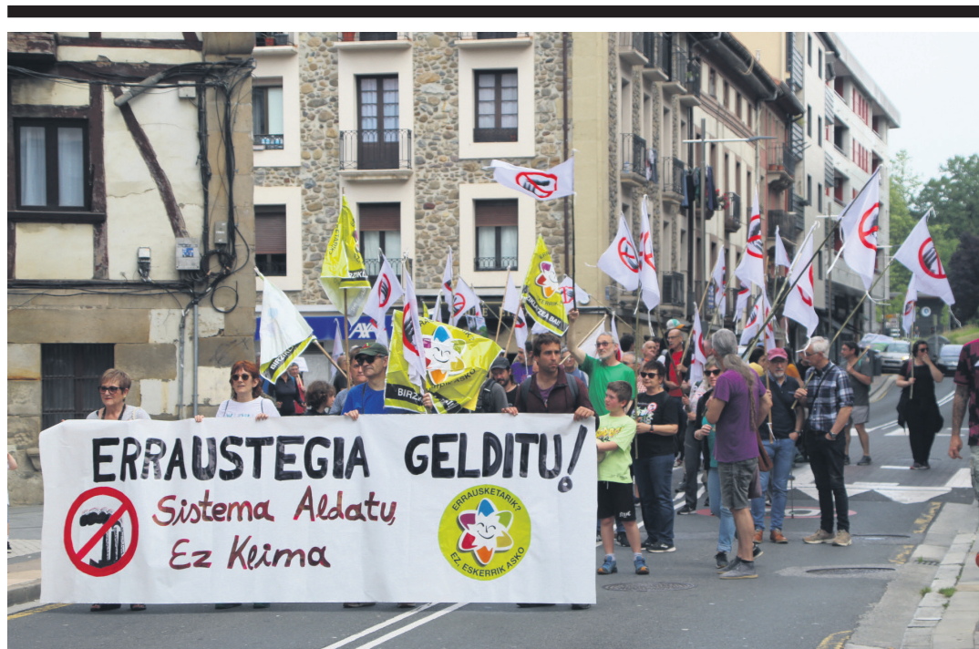
Zubietako erraustegira joan ziren martxalariak Okendo plazatik abiatu eta Kale Nagusia zeharkatu zuten. TXINTXARRI