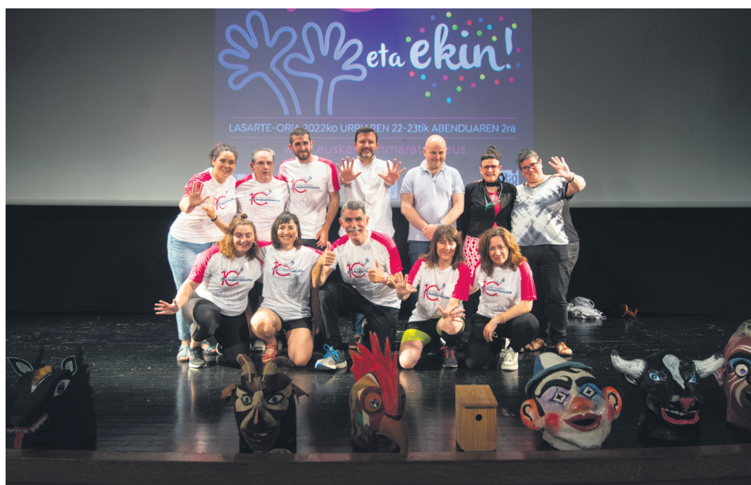
Zortzikotea hamabiko talde bilakatu zen bat-batean: Valdivia, Antxordoki, Egizabal eta Ormazabal batu ziren argazkira.