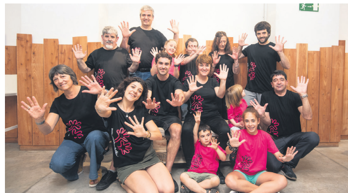
Hainbat herritar animatu ziren kamiseta berrieekin desfilatzera. TXINTXARRI

ekin! , Euskaraldiari "martxa ongi hartzeko". Abenduaren 2an bukatuko da erronka.