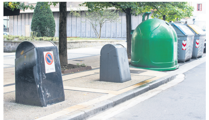
Uistin kaleko lurpeko zabor edukiontzien artxiboko irudi bat.

Udalbatzarra zuzenean jarraitzea joandako herritar batek ere hartu zuen hitza; lokal komertzialei irtenbide bat emateko proposamen bat luzatu zion udal korporazioari.