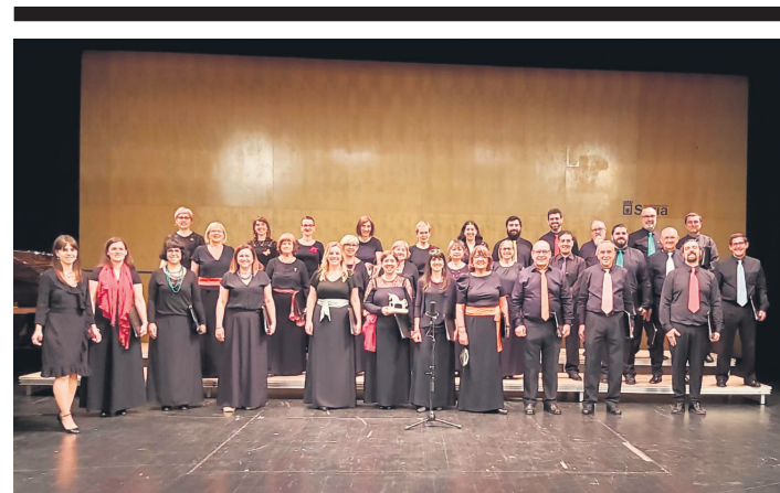
Alboka abesbatzako kideek emanaldi bikaina egin zuten Sorian. ALBOKA ABESBATZA

Goiz osoan zehar etengabeak izan ziren erraustegia gelditzeko aldarriak. Errausketaren Aurkako Mugimenduak antolatu zuten martxa, hainbat eragileren babesarekin: Eguzki, Greenpeace, Ekologistak Martxan eta Donostia Bizirik. Lasarte-Orian Aire Garbia plataformak ere bat egin zuten protesta ekintzarekin.