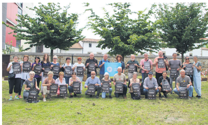
Aurkezpenaren ondoren, talde argazkia egin zuten Askatasuna parkean.

Guztira 300 tontor argiztatuko dituzte. Helburua, ordea, "gailur handiagoetara heltzea da", eta Pirinioetako ekimena aitzaki hartuta, "erabakitzeo eskubidearen aldeko sarea indartzea, dinamikara jende berria batzea". Bide horretan urratsak egiten hasteko, ekainaren 11n girotzea egingo