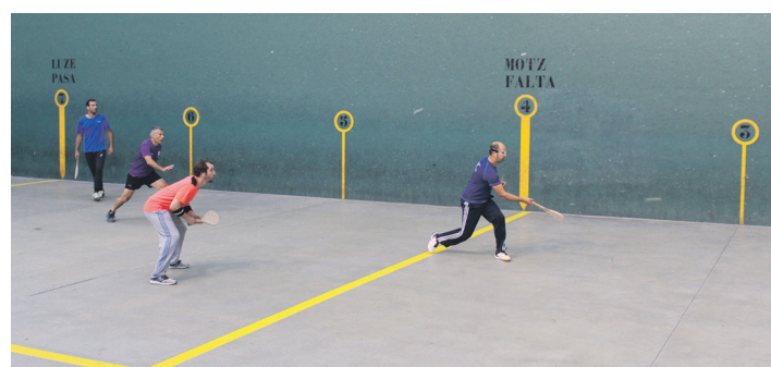
2019ko Santa Ana txapelketako ligaxkakako irudia.