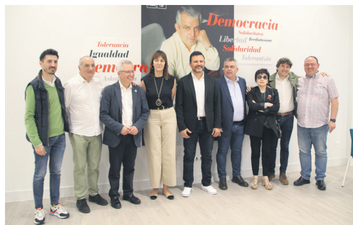
PSE-EEren gaur egungo nahiz garai bateko zenbait ordezkari izan ziren ekitaldian.