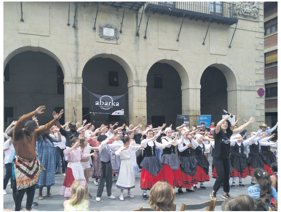
Iragan larunbatean 'Munduko Dantzak' egitasmoa antolatu zuen Abarkak Oiartzunen. MAITANE REBE