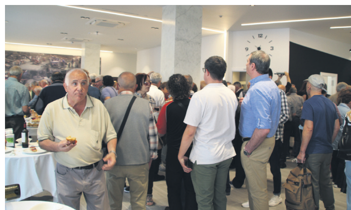
Ekitaldi politikoa amaitzean, egoitzako tabernak atek ireki zituen.