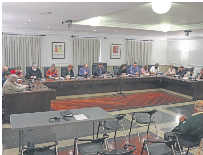
Urteko zazpigarren udalbatzarra egin du udal korporazioa hilaren 12an. TXEMA VALLES

Puntu horretan agertu ziren lehenen desadostasunak. Arau Subsidiarioetako Hirigintza Arauen IV. Tituluko 4.5 A2 artikulua aldaketa puntuala egitea eztabaidatu zuten. PSE-EE, EAJ eta ELOP alderdiek aldaketaren alde bozkatu zuten eta EH Bilduk, berriz, aurka. Bozketaren ostean alderdi horrek