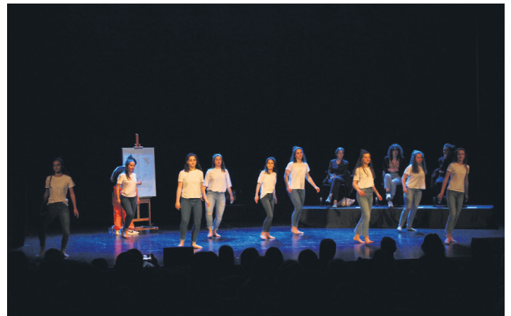
Kukuka Antzerki eta Dantza Eskolako kideek 'Buruz behera' dantzatu zuten. TXINTXARRI

Aurreikusita zeudenek eta bat-batean agertu zirenek talentuz bete zuten oholtza. Haiek ere, akaso, amets bat beteko zuten, gora beherak gora behera, Egizabalek egin bezala.