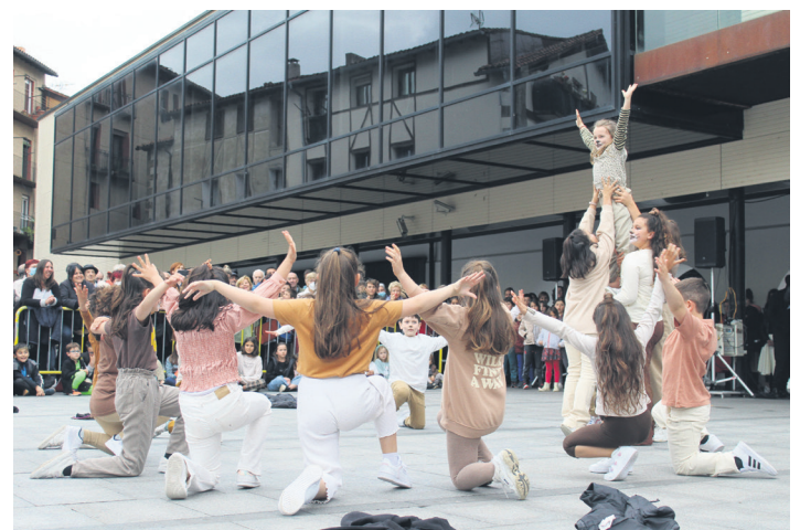
Trebetasun handia erakutsi zuten lehoi gaztetxoek, funky erritmora dantzan. TXINTXARRI