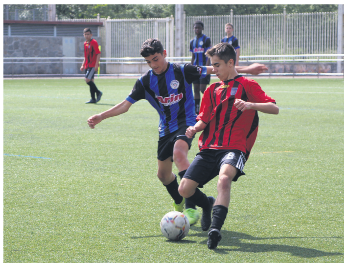
Kadeteen bigarren taldeak 0-3 galdu zuen Mundaizen aurka. TXINTXARRI

Ostadarrek bi talde izan ditu lehiakategoria bakoitzean, lau guztira, baina bik soilik lortu dute fase erabakigarriko txartela. Gogotik saiatu arren, emaitzak ez dituzte lagun izan beste biek: azken jardunaldian 1-7 galdu zuten jubencil Santo Tomas Lizeoaren aurka; kadeteak, aldiz, Mundaizek garaitu zituen, 0-3. Atsedean