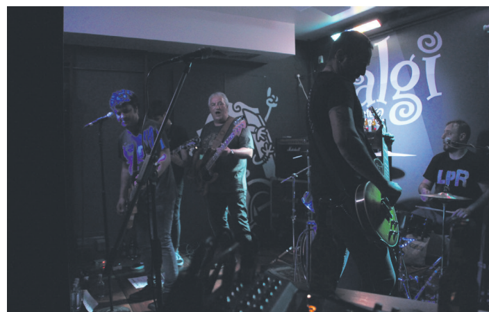
The Noisemakers taldeak bertsio ezagun ugari jo zituen. TXINTXARRI