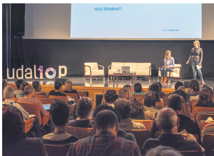
Udaltopen X. aldiko hitzaldietako bat, kultur etxean, ikus-entzulez lepo. TXINTXARRI

Egitarauak "lau ardatz nagusi" izango ditu: eskola, ikuspegi orokorra, talde lana eta eskolaz kanpoko jarduerak. Aurtengo aldia ere euskararen lurralde guztietako erakundeek antolatu dute: Euskal Hirigune Elkargoa; Eusko Jaurlaritzak; Nafarroako Gobernuak; Araba, Bizkaia eta Gipuzkoako foru aldundiek; Lasarte-Oriako Udalak; eta, aurtengo aurrenekoz, Jaurlaritzako Hezkuntza sailak. Erakunde horren baitan dagoen Berritzeguneetako Hizkuntza Normalizaziorako Aholkularitza Zerbitzua batu izana da XIV. Udaltopen "nobedade apagarrietako bat". "Komenigarria,