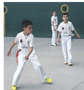
2019ko txapelketako irudia.

Intzako kideek azaldu dutenez, lehiaketa hiru maila ezberdinduko dira: benjaminak (2012 eta 2013 urtean jaiotakoak), alebinak (2010 eta 2011 urtean jaiotakoak) eta infantilak (2008 eta 2009 urtean jaiotakoak). Guztiak pilota goxoarekin jokatuko dute eta antolakuntza egingo da piloten kargu.