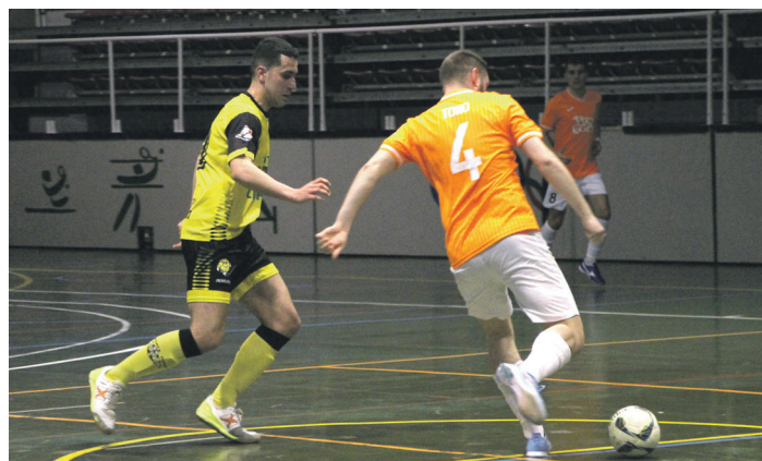
Defensa lan ederra egin zuen Eguzki ISU Leihoak taldeak neurketan zehar. TXINTXARRI

Bigarren zatian hasieran, Jon Arozenak zuzentzen duen taldeak ez zuen eroso jokatu baina entrenatzaileak aitortu modura, bazekiten defentsan sendo mantenduz gero aukerak iritsiko zirela. Horregatik, bigarren zati