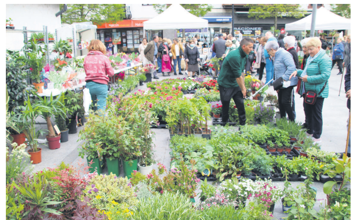
Lore eta landare eskaintza zabala ekarri dute haztegiek Okendo plazara.