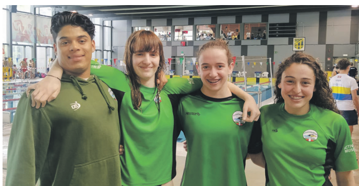
San Marcial proban lehiatu ziren Buruntzaldea IKTko igerilariak. BURUNTZALDEA IKT

Imazek junior mailako hirugarren postua eskuratu zuen 4.000 metro libre saioan egindako markari esker. Nahiz eta bere marka ez hobetu, herritarrek 4.38,49 egin zuen eta horrek 592 FINA puntu eman zizkion, junior mailako podiumera igotzeko adina.