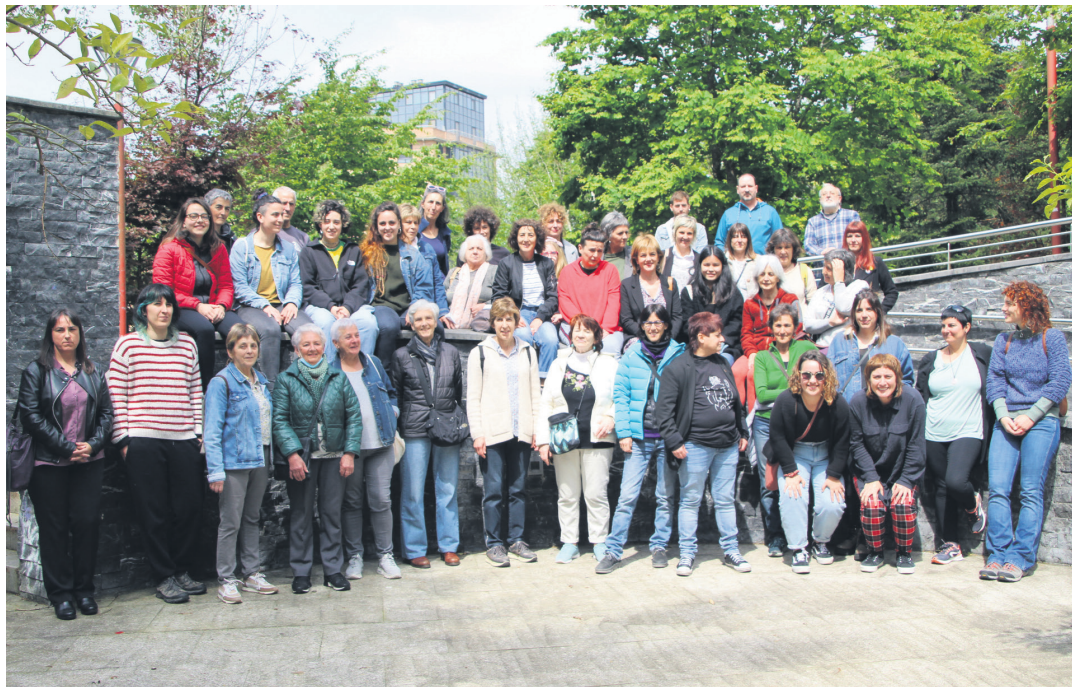
Norbanako eta mugimendu feministako kide ugari elkartu ziren apirilaren 30ean, Mirentxun. TXINTXARRI