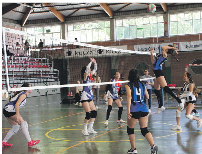
Ostadarreko eta Fortunaren partida borrokatua jokatu zuten. TXINTXARRI

Partida ez zen ongi hasi, ordea. Jokalari gehienek lehen urtea izanik, taldea urduri ateratu zen kantxara. "Finala eskura izateak presioa eragin zien jokalariei eta lehen zatian ez ginen gai izan Fortunari aurre egiteko", azaldu du Ostadarreko prestatzaileak.