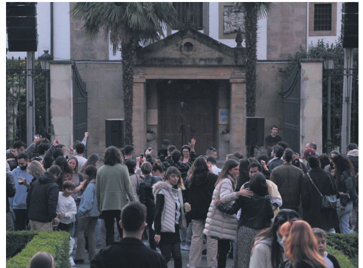
Mila pertsona baino gehiago bildu ditu Dantz Point egitasmoak herrian.

Aipatu egitasmoak ondarea musika elektronikoarekin eta abangoardiakoarekin bateratzea du helburu, eta Gipuzkoako Foru Aldundiko Kultura Departamentuaren laguntzarekin antolatu dute.