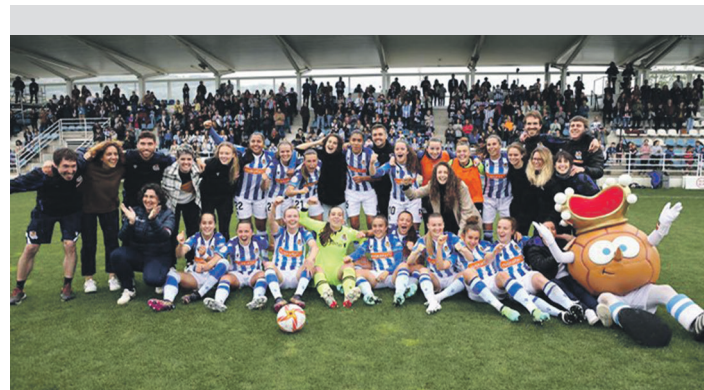
Reala Txapeldunen Ligarako sailkatzea ospatzen. REAL SOCIEDAD SAC

dago kanporaketetarako txartela poltsikoratu izanaz, eta azpimarratu du urdin-beltzen helburua "urrutira iristea" dela. "Badakigu zaila izango dela fasea, baina kopa oso serio hartu dugu; ea zer nolako jokoa