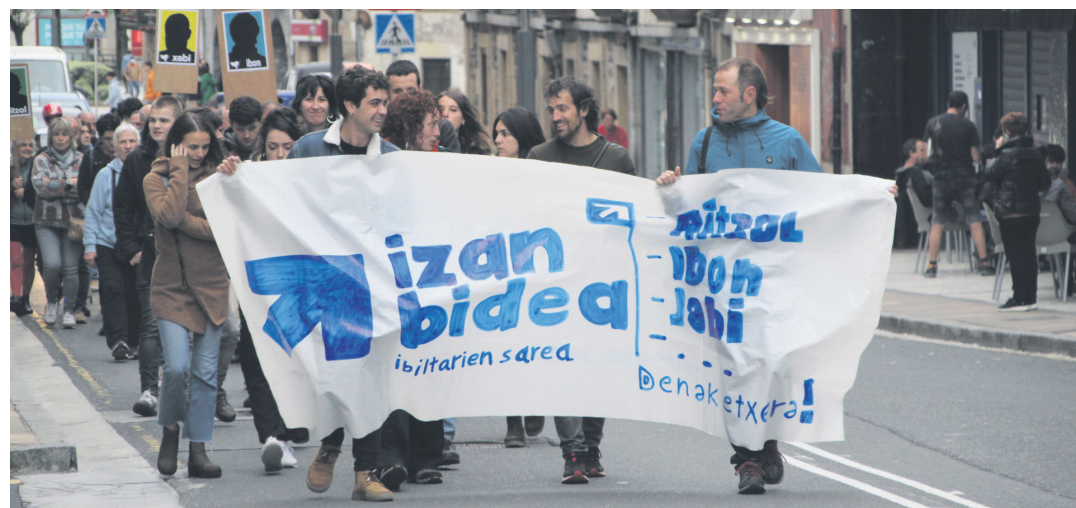
Apirileko Azken Ostiralean parte hartu zuten herritarrak, Kale Nagusia zeharkatzen.

Esan bezala, martxa Okendotik abiatuko da, 11:00etan. Antolatzaileek zehaztu dutenez, elektrotxaranga batek eta joaldunek lagunduko dituzte martxalariak. Lasarte-Orian Aire Garbiak bat egin du aldarrikapen egitasmo horrekin; herritarrak animatu ditu parte hartzera.