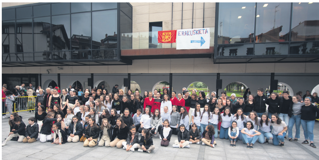
Egitasmoaren amaieran dantzari guztiek talde argazkia atera zuten elkarrekin. TXINTXARRI