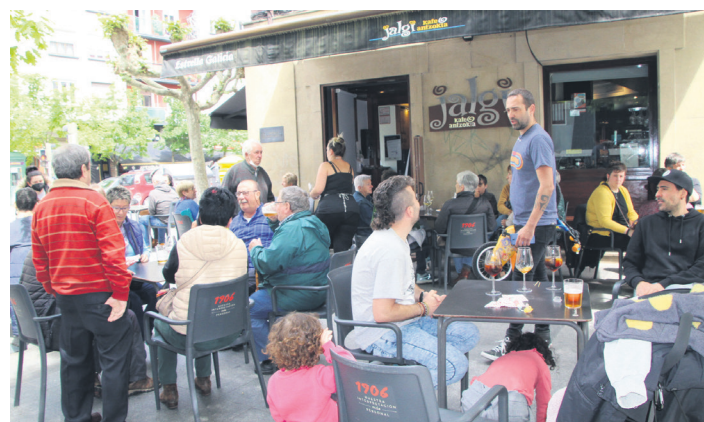
Jalgi kafe antzokiko terraza, bezeroz lepo. TXINTXARRI

Musika emanaldien aurretik, indarrak hartzeko, Manuk moztutako urdaiazpikoa dastatu zuten bezeroek, eta bermutarekin nahiz beste edari batzuekin busti. Eguraldi onak lagundu zuen horretan.