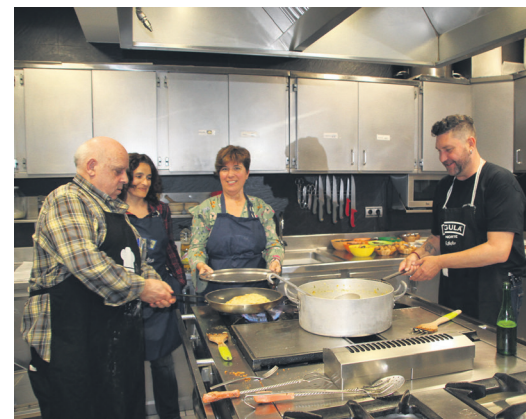
Ezkerrean, jatunetako batzuk txotx egiten. Eskuinean, sukaldari taldea, menu goxoa prestatzen. TXINTXARRI