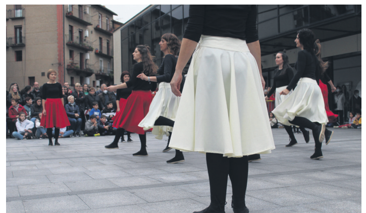
Kukukako kideek euskal dantza sorkuntza piezak dantzatu zituzten. TXINTXARRI