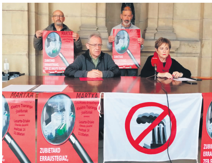
Martxaren antolatzaileak, prentsaurrekoa hasi aurretik. ERRAUSKETAREN AURKAKO MUGIM.

Martxari ez diote lelo hori kasualitatez jarri Errausketaren Aurkako Mugimenduak eta ekintzarekin bat egin duten eragileek (Donostia Bizirik, Eguzki, Greenpeace eta Ekologistak Martxan). Prentsaurrekoa eman zuten hilaren 4an, eta bertan azaldu zuten zergatia: "Erraustegiaren kudeatzaileek eta Gipuzkoako zein Euskal Autonomia Erkidegoko agintariek hainbat gauza ilun ezkututzen dizkigute herritarroi". Hainbat adibide aipatu zituzten: azpiegitura horretako labeetan erretzen duten hondakin tona bakoitzeko zenbat karbono dioxido botatzen duten