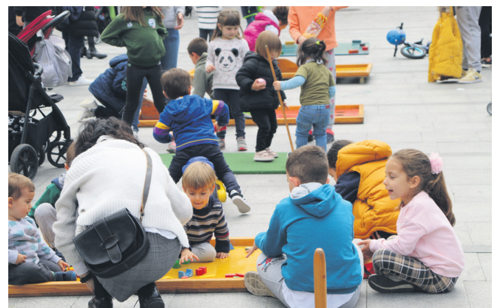
Egurrezko jolasetan aritu dira etxeko txikiak.