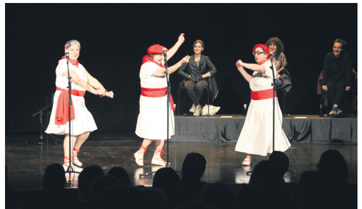
Hiru 'espontaneo' agertokira igo ziren jota bat dantzatu eta abestera. TXINTXARRI