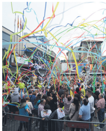
2018ko helduen txupina.

Dirulaguntza eman ala ez erabakitzerakoan, udalak zenbait irizpide izango ditu kontuan: programaren aurrekontuak 40 puntu balioko ditu, asko jota; partaide kopuruak, hogei; jardueraren finantzazio tasak, hamabost, eta errotza mailak, hamar; antzeko proposamenekiko koordinazioak, beste hamar; eta,