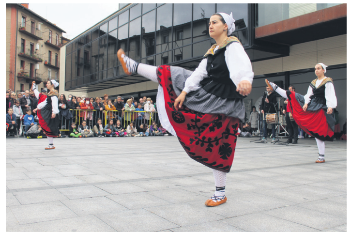
Erketz EDTko dantzariak ekimenari hasiera emateko aureskua dantzaten.

Muxikoen erritmoekin dantzan amaitu zuten emanaldia eta talde argazkia atera zuten amaieran.