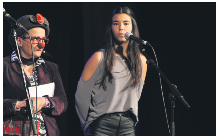
Earra bertso eskolako Norak gaia jarri izana ez zitzaion gehiegi gustatu Egizabali. TXINTXARRI