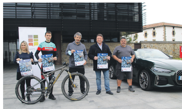
Udal ordezkariak, antolakuntzako kideak eta babesleak, aurkezpenean. TXINTXARRI

Era berean, Larreak eskerrak eman nahi izan dizkie Lasarte-Oriako Udalarari eta Lurauto BMWri eman dute