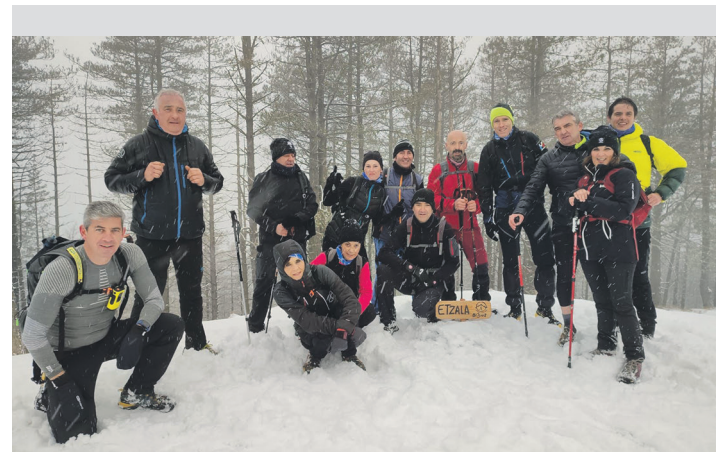
Lasarte-Oria Trail elkarteko kide eta lagunak, Etxala mendian. LASARTE-ORIA TRAIL

Prestatzaileek espero dute bi probetan atleta gazteak lehen postuetan egotea.