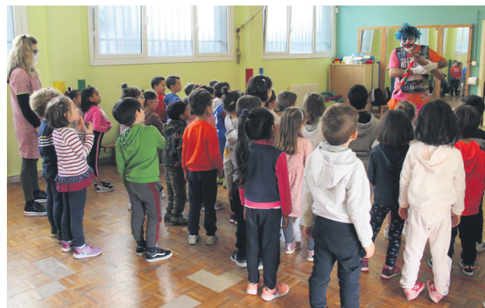
Korrika herrira iritsi bitartean, herriko ikasleekin egon da Porrotx. TXINTXARRI