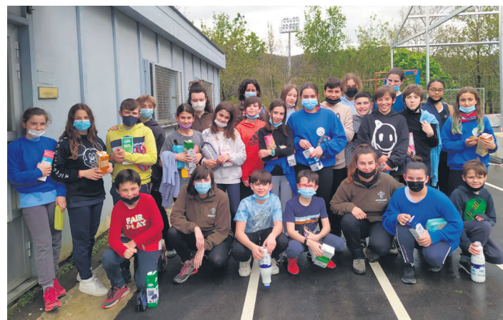
Landaberriko ikasleak Aranzadi kideekin txorientzako jantokiak eskuan. J.M.AGIRRETXE

Hilaren 7an, berriz, herriko pailazo bihurriaren bisita izan zuten Zumaburuko HH 3, 4 eta 5. mailako eta Garaikoetxeako HH 3, 4 5 eta LH 1 eta 2. mailako ikasleekin. Korrika herrira iritsi bezperan, motorrak berotzeko.