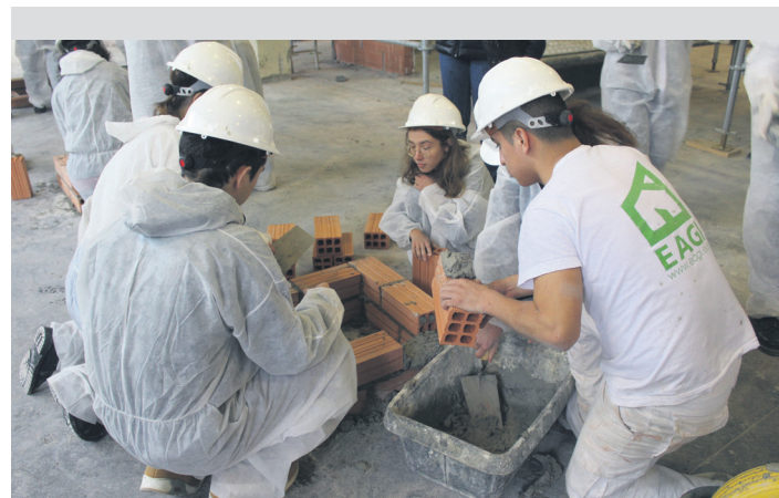
Lasarte-Oriako EAGI zentroko ikasle talde bat, lanean. TXINTXARRI

Gizarte larrialdietako laguntzak jasotzen dituzten herritarrek gainerako udal zerbitzuetan dituzten hobari berak izango dituzte, %25 eta %100 artekoak. Bestalde, seme-alaba bat baino gehiago matrikulatzen den kasuetan ere hobariak izango dira: bi kide direnean, %10; hiru kide direnean, %30; eta lau edo gehiago badira, %50. 943-37 61 84 edo 644 53 32 70 telefonoetara dei daiteke informazio gehiago eskuratzeko.