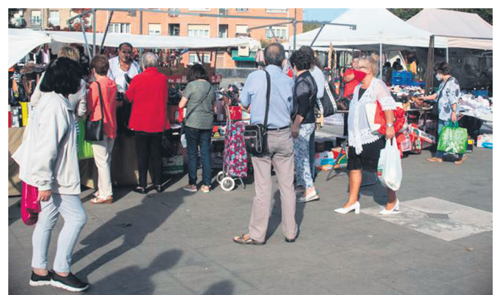
Herritarrak, Andatza plazan astero egiten den merkatuan erosketak egiten.

Ohar bidez, eskerrak eman dizkiete aste hauetan zehar era batera edo bestera lagundu duten herritarrei, eta horretan jarraitzea animatu. "Materialez betetako beste furgoneta bat bidali dugu berriki, mila esker denoi!"