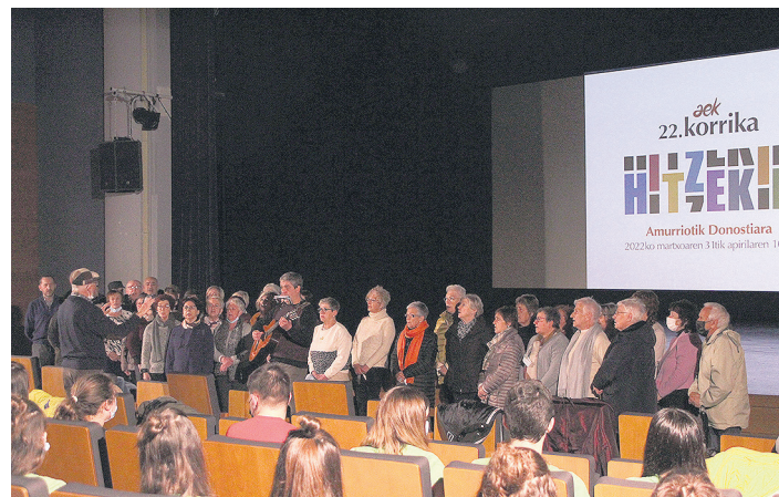
Xumela koruko kideek bi abesti ezagun kantatu zituzten.