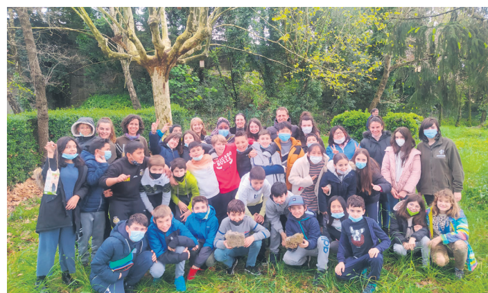
Sasoetako ikasleek ere txorientzako habia kutxak egin dituzte. J.M.AGIRRETXE