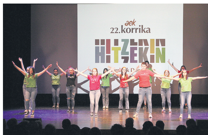
Kukuka Antzerki Ta Dantza Eskolako gazteek Hitzekin dantzatu zuten.