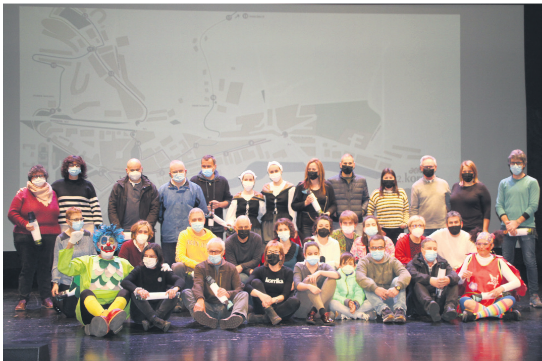
Korrika 22ko kilometroren bat erosi dute herriko 32 eragile, elkarte eta erakunde gehienek euren petoa jaso zuten. TXINTXARRI