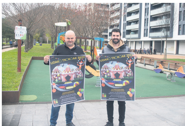
Udaleko eta Loiri enpresako ordezkariak, txokoaren aurkezpenean. TXINTXARRI

"Printzipioz, 450 toki eskainiko ditugu, eta izena eman dutenen hurrenkera izango da horiek esleitzeko irizpidea", nabarmendu du Antxordokik. "Lasarte-Orian erroldatuta dauden haurrek izango dute lehentasuna". Edonola ere, herrian erroldatuta ez baina herriko ikastetxeren batean ikasturte hau egiten ari diren haurrek ere matrikulatu ahal izango dira. "Toki guztiak beteko ez balira, baldintza horietako bat bera ere betetzen