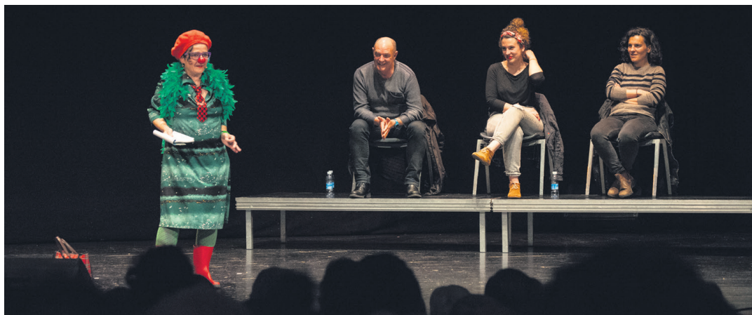
2018ko udaberriko bertso saioa. Aurtengoan ere parte hartuko dute Egizabal, Labaka eta Lujanbiok. TXINTXARRI