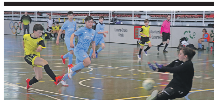
Infantil mailako Eguzki Areto Futbol taldeko jokalaria atera jaurtizten. TXEMA VALLES

Nahiz eta Liga amaitu, entrenamenduekin jarraitu beharko du Vithas Gaztedi taldeak. Apirila amaieran, Ohorezko B Mailako igoera fasea jokatuko du.