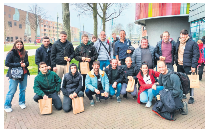
USURBILGO LANBIDE ESKOLA

eta erregelamenduak egiteko prozeduran parte hartzeari buruzko 133 artikuluan ezartzen duenez, legearen edo erregelamenduaren proiektua edo aurreproiektua egin baino lehen kontsulta publiko bat egin behar da. Apirilaren 29ra arte egongo da parte hartzeko aukera eta hauek dira udalari proposamenak bidaltzeko bideak: udal erregistroan idatzi bat aurkeztuz; partehartzea@lasarte-oria.eus helbidera mezu bat bidalita, edo www.lasarte-oria.eus/eu/partehartzea web atariaren bidez.