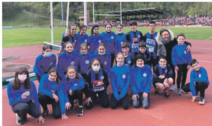
Eskolarteko Gipuzkoako txapelketan parte hartu duten atletetako batzuk. OSTADAR ATLETISMOA

Podiumetik gertu ere izan ziren beste kirolari gazte batzuk ere.