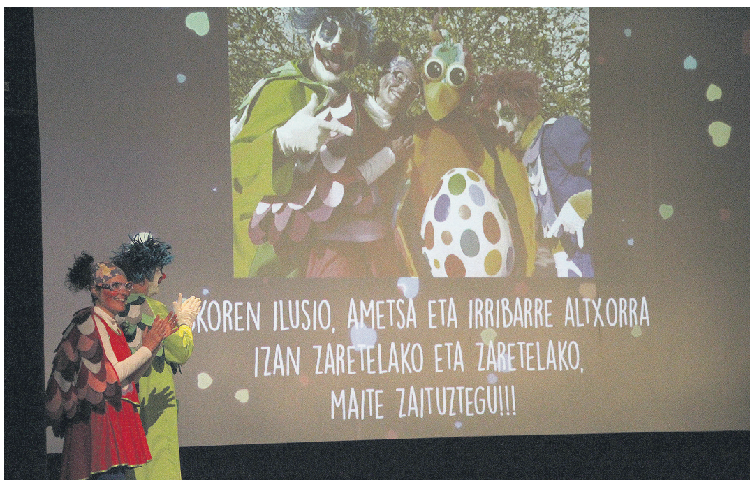
Porrotx eta Marimotots oso presente egon ziren gala osoan zehar: dantzatu, hitz egin eta petoak banatu zituzten. TXINTXARRI