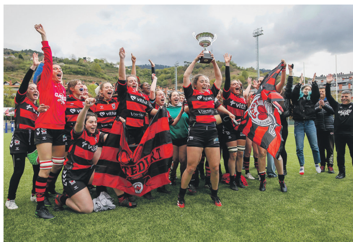
Vithas Gaztediko jokalariek trofeoa eman ostean.

Markagailua aldeko izan ez arren, atsedenaldiraren ostean, Liga lortzeko bonusaren bila ateratu zen Racamonde kide duen taldea. Ederki ari zen Vithas