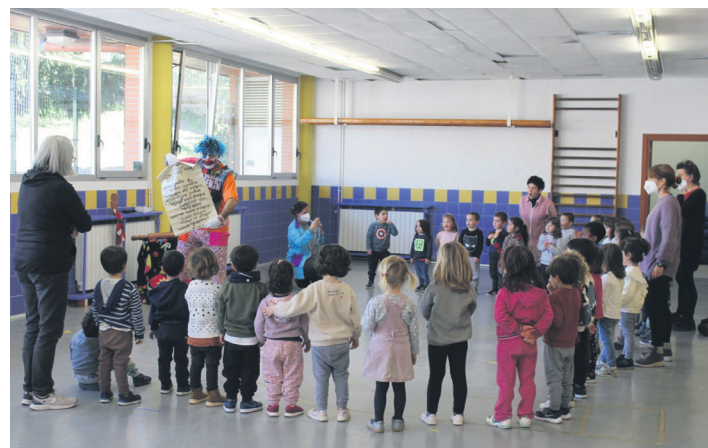
Garaikoetxeako haurrek ere ederki pasa dute Porrotxekin. TXINTXARRI