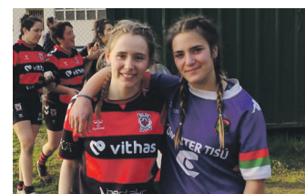
Racamonde (ezker) eta Vega (eskuin) herritarrek lehiatu ziren. A. VEGA

Moda, Bideo Lagunak, Ola Enmarcacion eta Buenetxea taberna sariak banatuko dituzte.