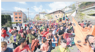
2019ko Korrika, azkena. TXINTXARRI