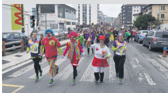
Jalguneakoak, sudurgorri. TXINTXARRI

XX. Korrika gauez iritsi zen herrira, eta eguraldia oso kaxkara izanagatik, inor ez zen etxean geratu.