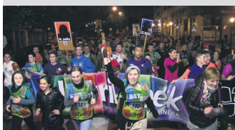
2017ko Korrika, gauez. TXINTXARRI

Pandemia aurreko azken Korrika 2019ko apirilaren 12an pasatu zen herritik, bazkalostean.