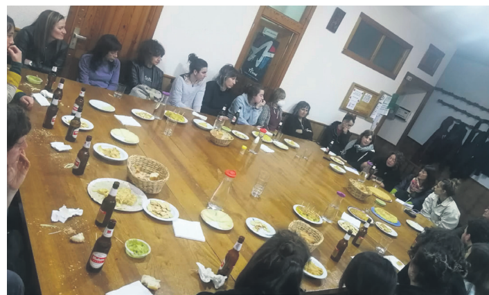
'Emakumea* eta kartzela' solasaldia egin zuten Xirimiri elkartearen. ASUNAK

Zabal mintzatu ziren emakumezkoen eta gizonezkoen espetxealdien arteko aldeez. "Ez lekua" deitu zioten kartzelari hizlariek, nabarmenduz "sistemaren ardurak urratzen dituen" gizartetik aldentzeko pentsatutako azpiegitura dela. Azpimarratu zuten, orokorrean,