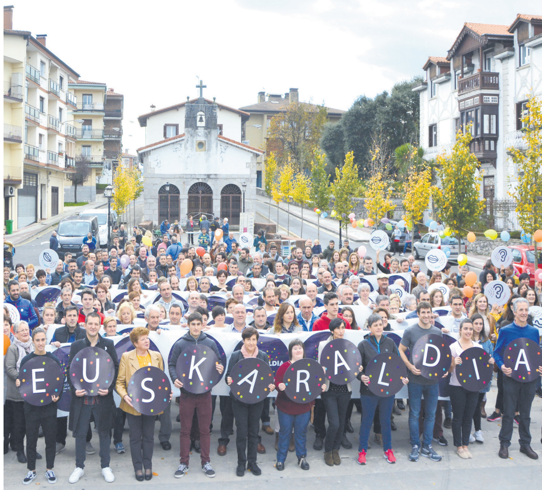
Euskaraldiaren lehen edizioa gogoz hartu zen Urnietan. AIURRI

Lorpenetan ipini dute aurten begirada, eta, horretarako, erronka pertsonalak hartzeko gonbitea luzatzen diete antolatzaileek ahobiziei nahiz belarriprestei. "Konpromisoarekin lotura zuzena duen hitzordua da", azaldu du Saizarrek. Amua Euskaraldiak