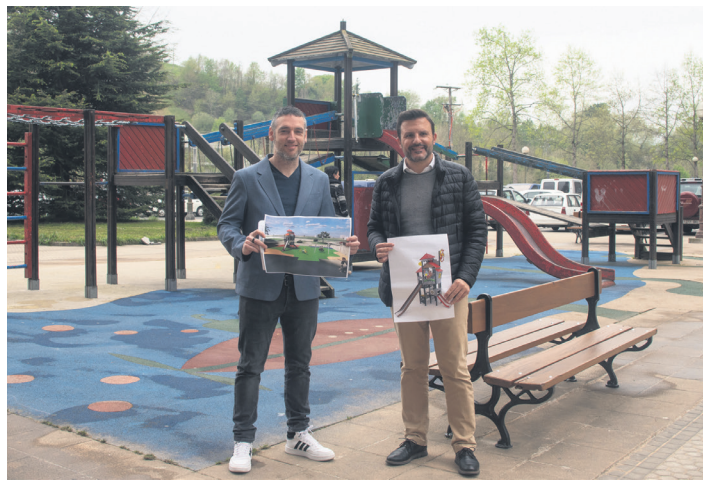
Mateos eta Valdivia, Juan XXIII plazako parkean. TXINTXARRI

Alkateak adierazi du lan sorta horretarako dirua 2021eko aurrekontuetakoa dela, eta