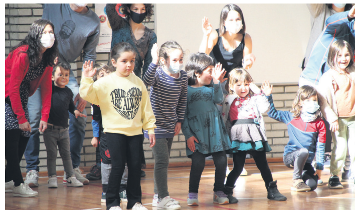
Haurrek zein gurasoek ederki pasa zuten familientzako antzerki tailerrean.