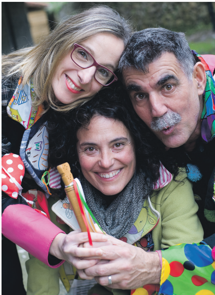
Pirritx, Marimotots eta Porrotx, Korrikaren lekukoa eskuetan dutela. AMAIA ZABALO

Aintzatespena guri egiten zaigu, baina gu bezala herrigintzan ari diren eragile eta herri elkarte eta kultura talde zein sortzaile askorena ere bada. Gure lana sortzeko kolaboratzaile sare zabala dugu eta ezin gara horiekin