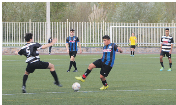
Jubenil B eta Lengokoak B taldeko jokalaria baloia lortzeko borrokan. TXINTXARRI

Jubenil A taldeak ezin izan zituen puntuak eskuratu. Ondorioz, sailkapeneko azken aurreko postura jaitzi da. Helburua, ordea, laugarren postua da. "Laugarren postuak hurrengo faserako sailkapena