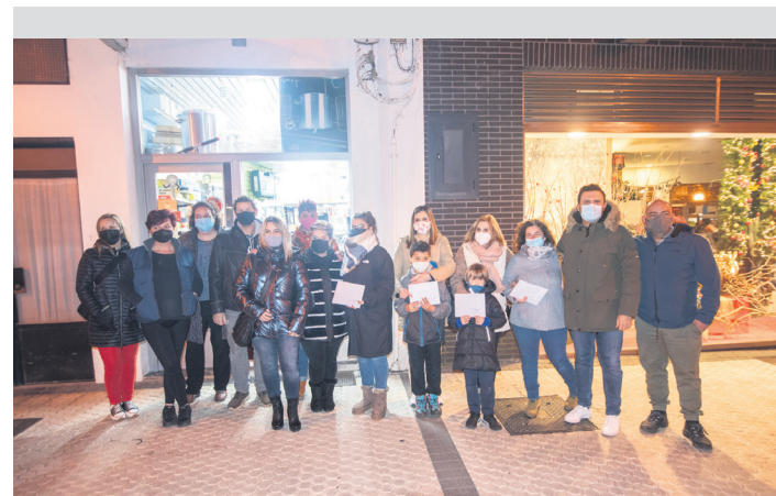
Saridunak eta Aterpeko zein udaleko ordezkariak.

Egitasmoan parte hartuko duten 25 establezimenduen zerrenda www.txintxarri.eus atarian ikus dezakezue.