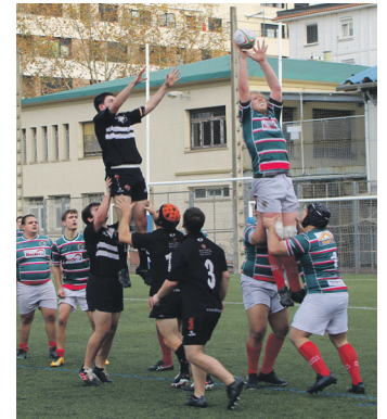
Neurketako irudia. TXINTXARRI

Bestalde, Beltzak Rugby Taldeak jakinarazi du Gabonetako saskiko