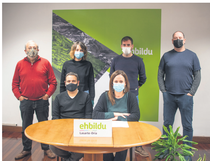
2022rako lan ildo estrategikoak aurkeztu ditu Lasarte-Oriako EH Bilduk.

Lasarte-Oriako EH Bilduk 2022an jorratuko dituen lan ildoak aurkeztu ditu: "Urte osoko lanak eman duen fruitua da". Adierazi du udal gobernuarekin partekatuko duela zerrenda: "Prest gaude herriaren beharren analisi partekatu batean oinarrituta, hura eraikitzen jarraitzeko, eta lasarteoriatarren interesen alde beharrezkoak diren pausoak emateko". Horren harira, udal gobernuak kritikatu du, oraindik ez duelako aurkeztu datorren urterako aurrekontu proiekturik. "Ez dakigu zein diren 2022ari begira sustatu nahi dituen egitasmo estrategikoak".