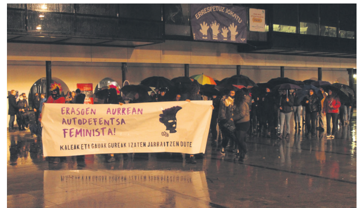
Buruntzaldeako neska* gazteek deituta manifestazioa egin dute.