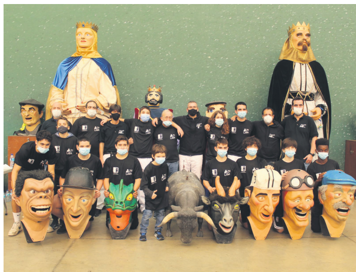
Taldearen aurkezpena egiteko baliatu du hitzordua LOZETek.

Geltoki kalean barrena, Okendo plaza atzealdera iritsi ziren. Bertan egin zuten lehen