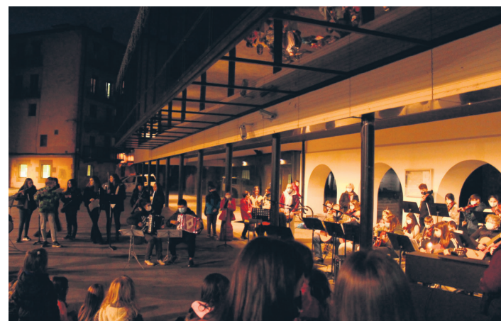
Udal musika eskolako musikariak, Okendo plazan eskaini dute emanaldia. TXINTXARRI

Zumaburuko Arantzazuko Ama parrokian 11:30ean hasi zen elizkizuna, eta bertan abestu zuten Albokako kideek. Mezak aurrera egin ahala entzun ahal izan zituzten bertaratu zirenek hainbat abesti, horien artean Laudate nomen Domini , Virgo dei genitrix eta Kantuz . Elizatik kanpo ere kantatu zuten eta gustura entzun dute elizkizunera joan diren fededunek. Wellerman eta Let it shine abestiak eskaini dituzte eta handik Sagardotegi kalera lekualdatu ziren. Han amaitu zuten kontzertua.