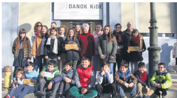
Lan guztiak San Pedro elizan jarriko dituzte; garaileak, Muebles Azeptian. TXINTXARRI

Lanak aurkezteko baldintzak honakoak izango dira; 80x60zmm-ko neurria izan beharko dute