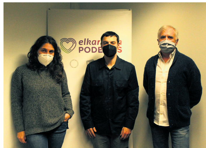
Elkarrekin Lasarte-Oria Podemos alderdiko kideak, udaletxean. TXINTXARRI

Ingurumenari dagokionez proposatu du lurpeko edukiontzia kentzeari behin betiko irtenbidea emateko eta irisgarritasuna bermatuko duten edukiontzia ezartzeko beharrezko partida bideratzea. Hori, gainera, kontzientziazio kanpaina batek lagunduta egitea nahi du alderdiak. Bestalde, udalerrian animalien aisialdirako espazio mugatu bat sortzeko kokapenik onena aztertzea ere proposatu du, "maskotak edukitzearekin lotutako arazoak konpontzen laguntzeko". Eta hiri baratze