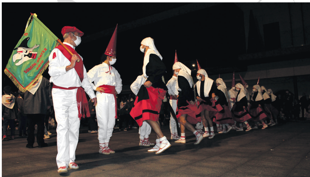
Sorgin Dantzako zortzikoteak eta haur eta gazte taldeak ederki egin zuten dantza Okendo plazan. TXINTXARRI