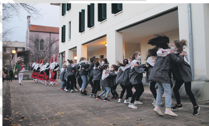
Sorgin Dantza doinuak entzun zituzten, berriro ere, Oriako auzotarrek.