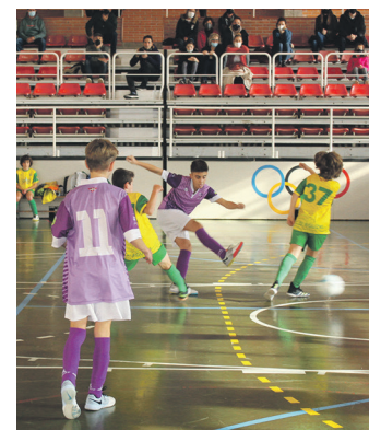
Neurketako irudia. TXINTXARRI

Era berean, taldeak garatzeko aukera asko dituela ere aurreratu du infantil taldeko entrenatzaileak. "Aurtengo ikasteko urtea da eta jokalaria