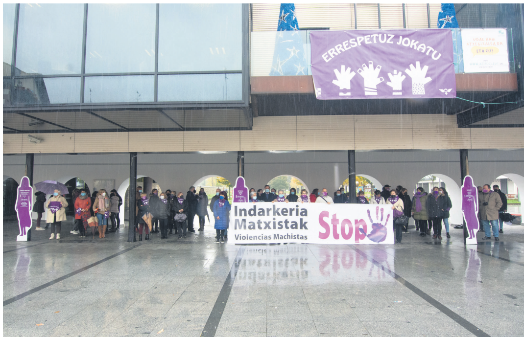
Dozenaka herritar bertaratu dira Lasarte-Oriako Udalak deitutako kontzentrazioa. TXINTXARRI