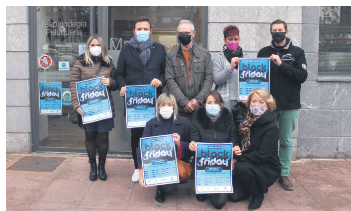
Aterpeko kideak eta udal ordezkariak, 'Black Friday' egitasmoa aurkezten.

Bestalde, Osakidetzako ospitaleetan 179 pertsona daude ingratuta koronabirusagatik; horietatik 36 larri daude, Zainketa Intentsiboetako Unitateetan.