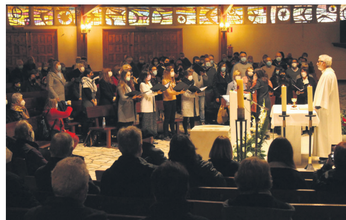
Abokak Zumaburuko elizan abestu du, eta Sagardotegi kalean ere bai. TXINTXARRI