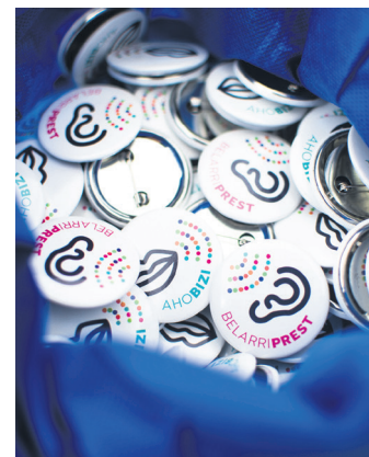
Ahobizi eta belarriprest txapak. TXINTXARRI

izandako eragina gaintututa, jauzi garrantzitsu bat eman nahi dugu", adierazi dute sustatzaileek. Hitzaren bidez eragiteko deia egin nahi diete herritar eta entitateei, hori baita "hizkuntza ohiturak aldatu eta inertiak apurtzeko tresna nagusia". Halaber, hitzaren bidez kalea berriro hartzeko deia egin dute, COVID-19ak nabarmen eragin baitzuen 2020ko azaroan eta abenduan egindako bigarren edizioan: "Batetik, euskararen aldeko giro sozialak kale presentzia areagotzea nahi dugu, eta bestetik,