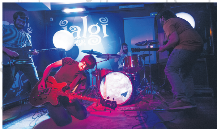
Rukula taldeko kideek barnean zuten guztia eman zuten kontzertuan. TXINTXARRI