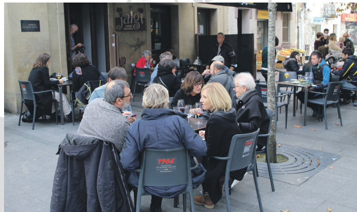
Solaskide eta bazkideek pintxo pote eder batez gozatu zuten. TXINTXARRI

Rukula talde instrumentalaren doinuekin eman zioten amaiera ospakizun egunari. Bost urte eta gero, Lasarte-Oriara bueltatu zen taldea kontzertua ematera, eta kideek barruan zeramaten guztia utzi zuten Jalgi kafe antzokiko eszenatokian. Zaleek gogotik dantzatu zuten gipuzkoarren errepertorioarekin.