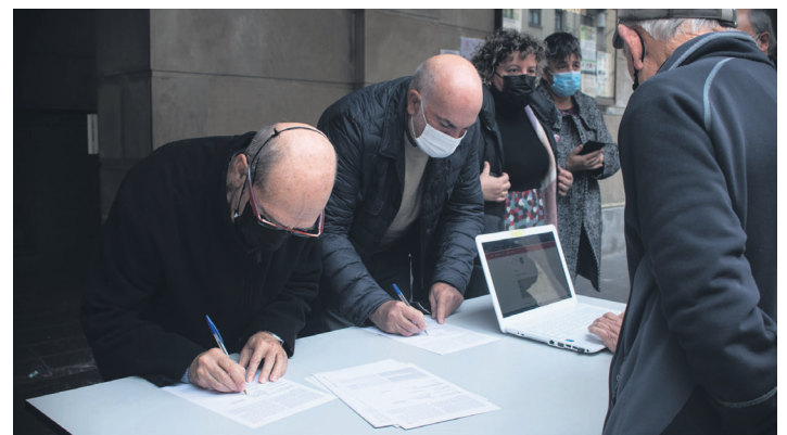
Dozenaka herritarrek sinatu dute erreferendumaren alde. TXINTXARRI