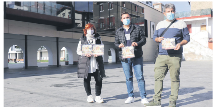
Udal ordezkariak espero dute 2022ko Inauteriak "normaltasunez" ospatzea. T. VALLES

Hurrengo urratsa izan da Euskal Herriko eta herriko motibazio politikoko indarkeriarekin lotutako historia eta bizipenak lasarteoriatarrei ezagutaraztea, erakusketa horren bidez.