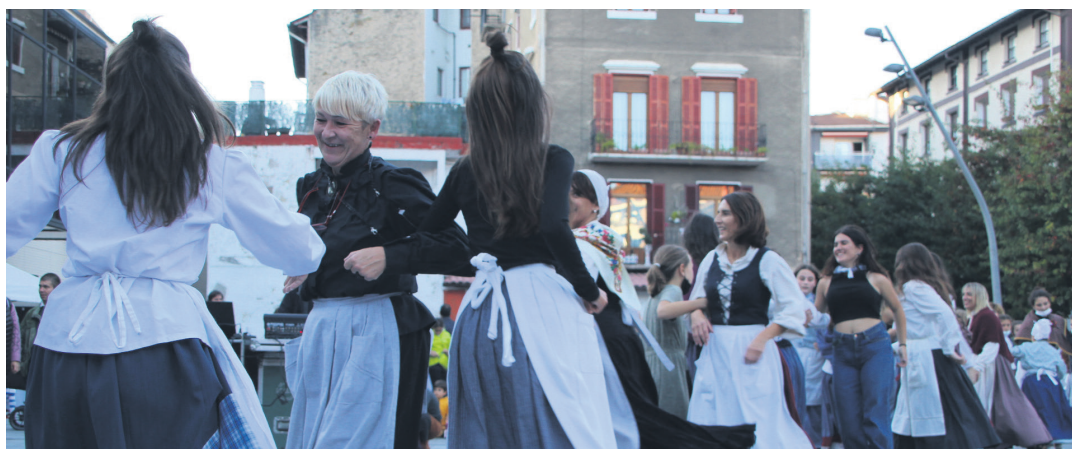
Lasarteoriatarrek gogotik abestu eta dantza dute arratsaldeko erromerian. TXINTXARRI