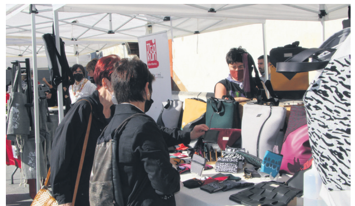
Herritar ugari bertaratu dira Okendo plazako azokara. TXINTXARRI