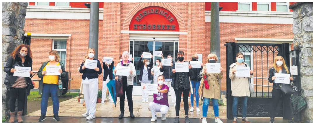
Atsobakarreko langileek bat egin zuten urriaren 22ko mobilizazioarekin. Egoitza kanpoan egin zuten protesta. ATSOBAKAR EGOITZA