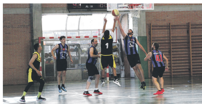
Ostadar eta Eibarren arteko lehia berdindua izan zen lehen bi laurdenetan.