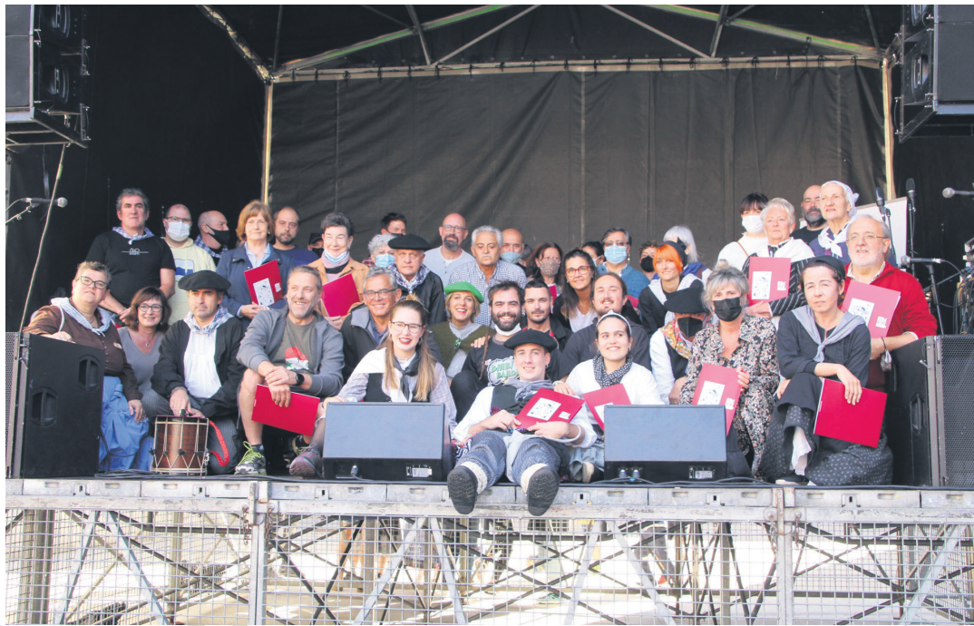
Makina bat elkarte eta eragilek lan egin dute Ttakun Kultur Elkartearekin azken 30 urteetan zehar. TXINTXARRI