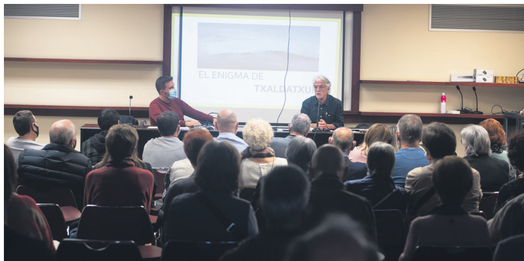
Jakin-mina piztu du lasarteoriatarrengan 'El enigma de Txaldatxur' liburuak. Lepo bete da kultur etxeko hitzaldi aretoa. TXINTXARRI

Lasarte-Oriako Udalak jakinarazi du liburu eskuratu nahi duten herritarrek udaletxeko lehenengo soilaruan dagoen alkatetzara joan behar dutela.