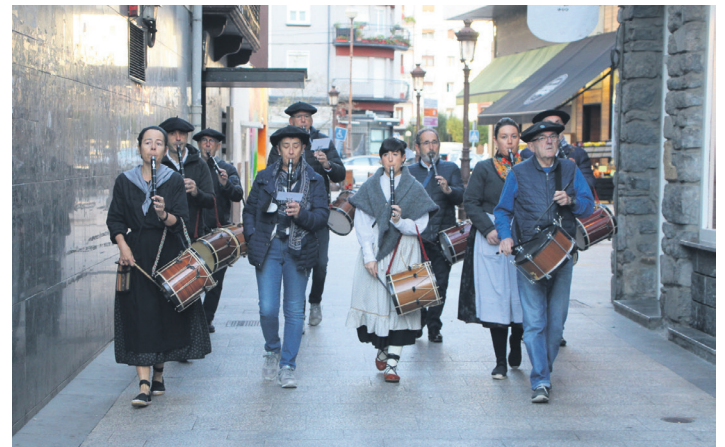
Txistulariek esnatu dute herria; erdigunean zehar egin dute diana. TXINTXARRI

Hala, 17:30ak heldu ziren. Orduan, Okendoko oholtzara bidea hartu zuten Ttiriki Ttarrakako kideek erromeria hasteko. Plazan dantzarako gogoz zeuden haurrei poliki-poliki gaztetxoak eta helduak batzen joan zitzaizkien. Hasi eta ordubetera, plaza lepo zegoen, eta inor ez zegoen geldirik. "Gogoa baguenen" bat baino gehiago entzun zen, eta argi utzi zuten nahia edo beharra bazutela.