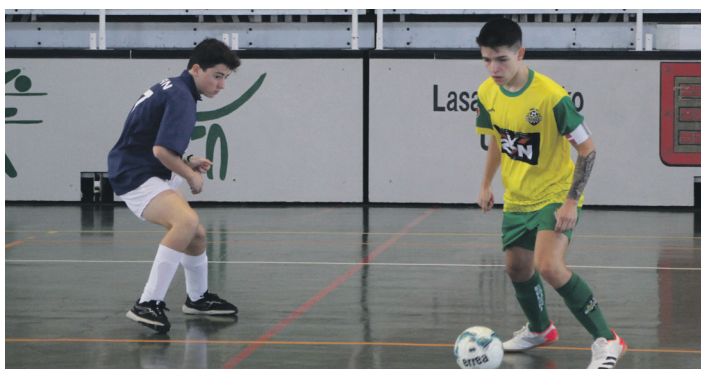
Eguzki 2kn nagusi izan zen Erainen aurka. TXINTXARRI

Azaroaren 21eko asteburura arte, itzuli bateko sailkapen fase bat izango da. Multzoko bakoitzeko lau hoberenek -guztira, zortzi talde- liga