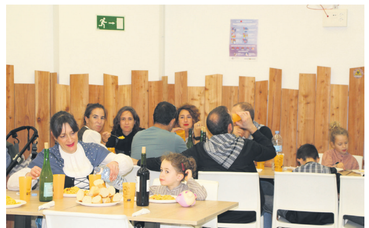
Paella goxoa jan dute 70 bat lagunek Ttakunenea elkartearen. TXINTXARRI