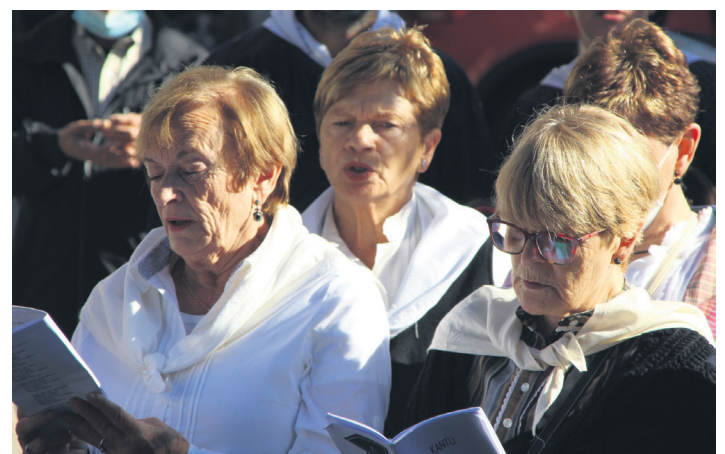
Xumela koruko zenbait kide, eguerdiko kantu dantza jiran. TXINTXARRI