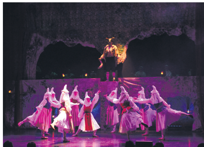
XVII. mendeko Donibane-Lohitzunetik abiatuta, lau ataletan banatu dute ikuskizuna. TXINTXARRI