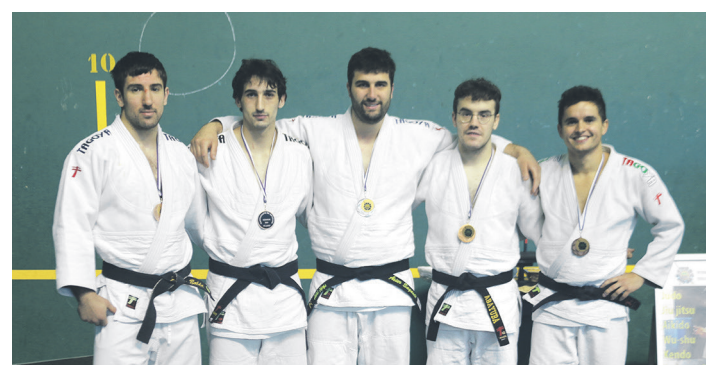
LOKEko judokak, Gipuzkoako txapelketan lortutako dominekin. TXINTXARRI

GESALAGA OKELAN ZARAUTZKO SENIOR TALDEEK VITHAS GAZTEDI HARTU DUTE MENDEAN