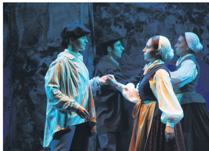
Dantza taldeko 70 dantzarik parte hartu dute Lasarte-Oriako Higa ikuskizunean.