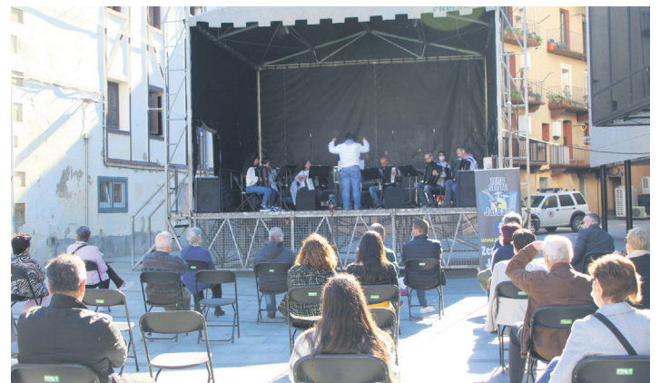
Herritarrek Zero Sette akordeoi taldearen musika emanaldiaz gozaten. TXINTXARRI