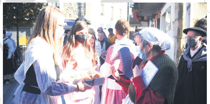
Emanaldiak egin dituzte eragileetako batzuk, eta gailetak jaso ere bai. TXINTXARRI