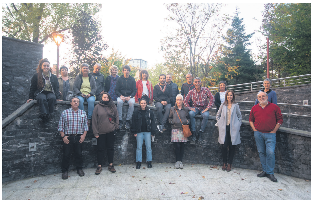
Lasarte-Oriako hainbat eragile ari dira erreferendumaren aldeko sinadura bilketa sustatzen.