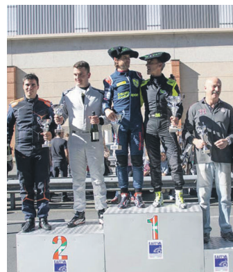
Manso (txuriz), probako podiumean.

Garaipeneko bi puntuak eskuratu ostean, azaroaren 6ra arte atsedena izango du taldeak.