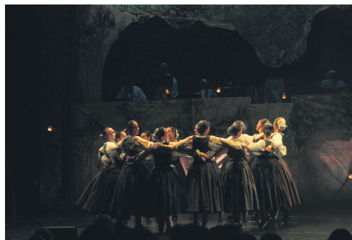
Gogoetarako bide ematen duen emanaldia eskaini du Gero Axularrek. TXINTXARRI