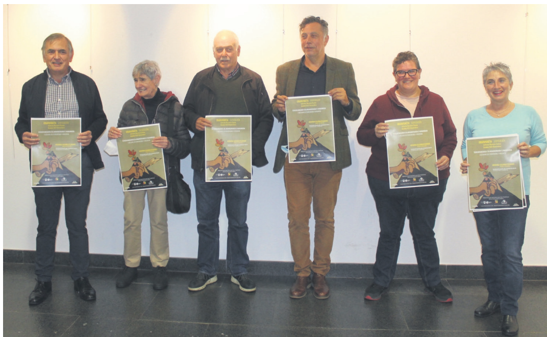
Bizikidetzarako foroak kideak urriaren 22an egindako erakusketaren aurkezpenean. TXINTXARRI