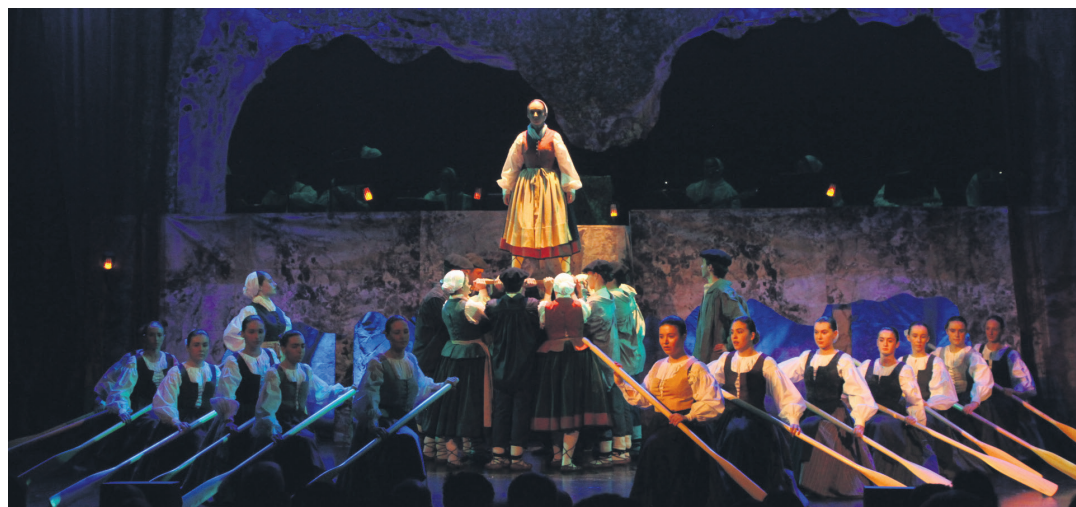
Zuzeneko musikak lagunduta osatzen ditu dantza taldeak oholtzan gainera emanaldi guztiak. TXINTXARRI