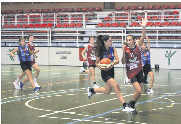
Kadete Errendimenduko taldeak ezin izan zuten Innova Hertz Klinika garaitu. TXINTXARRI

Ostadarrek kadeteak ederki borrokatu ziren markagailuari buelta emateko eta bigarren laurdeneko partzialean puntu batengatik irabazi zuten.