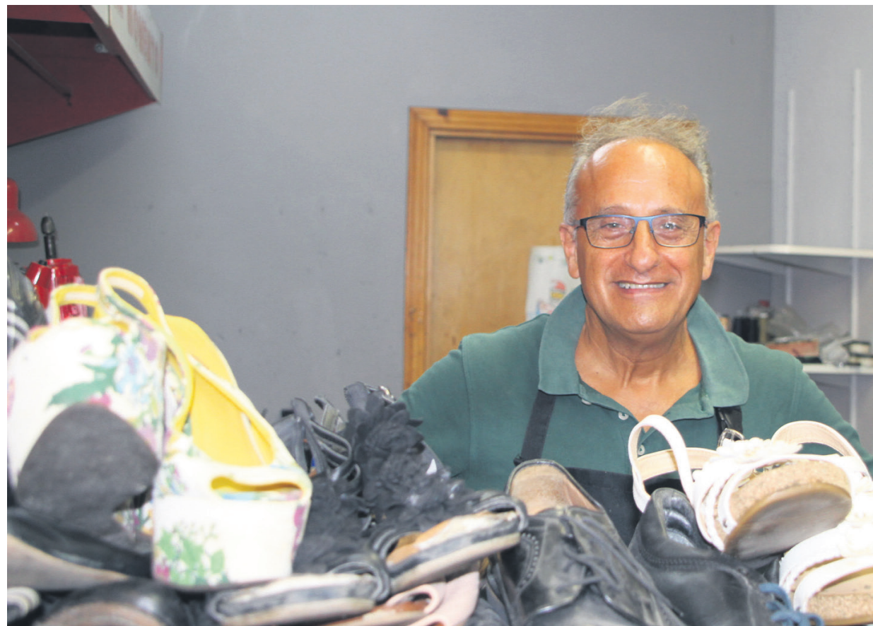
Sasoetan duen lantegiko mahaiak lanez bete zaizkio Justeli, udako oporralditik bueltan. Konpontzeko oinetakoak eta poltsak ez zaizkio falta. TXINTXARRI

Zola edo tapa batzuk jartzea, barne-zolak aldatzea... Hori ez da aldatu, ibiltzeko modua eta igatzekoa bera baitira. Aldatu dena teknologia da. Haurra nintzenean zapatariak eserita egoten ziren beti eta dena eskuz egiten zuten. Niri, jada, ez zidaten hala irakatsi. Ez naiz egun osoan esertzen, josteko bakarrik.