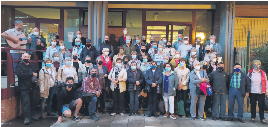
Astelehenero elkartuko dira Xumelako kideak, 19:30etik 20:30era, elkarrekin kantuan eginez, ondo pasatzeko. TXINTXARRI