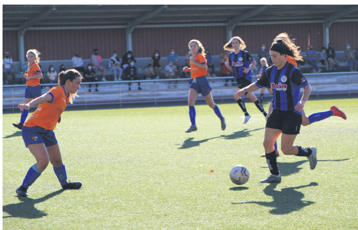
Ostadar SKTk Tolosa garaitzeko aukera ugari izan zituen partidaren. TXINTXARRI

Aipatu ligako lehen jardunaldian, Tolosa izan zuen aurrez aurre Ostadar SKTk eta bana berdindu zuten. Partidako lehen minutuetan urduri zeuden Ostadarreko jokalaria. Segituan ulertu zuten ordea, zertarako zeuden zelaian. "Gure helburu nagusia futboleko jokatzeko zen, atzetik baloia jokatzen hasia eta urduritasunak alde batera