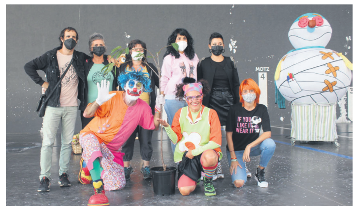
Intxaurren bat landatuko dute Zabaletan, auzoko hildakoen oroimenez. TXINTXARRI

Ikuskizuna amaitu baino lehen, intxaurren bat oparitu diete pailazoen auzo elkarteko kideei; auzoko hildakoen omenez landatuko dute.