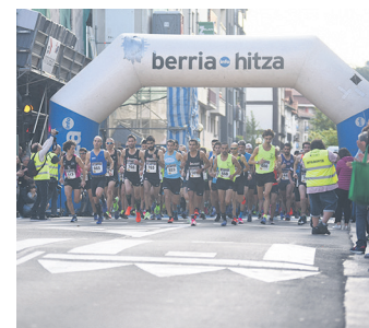
2019ko irteerako irudia. TXINTXARRI

Erabakia ongi hausnartu ostean, hartu dutela jakitera eman dute