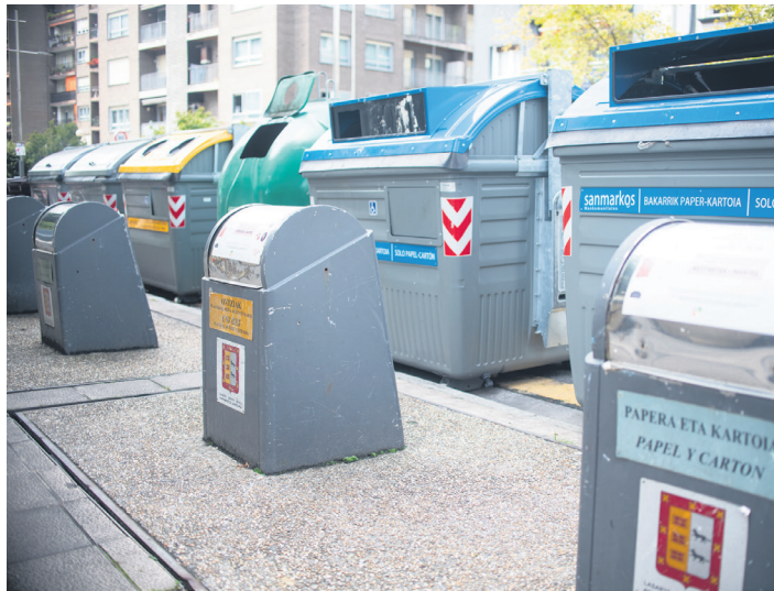
Hipodromo Etorbideko lurpeko edukiontzia.

Eragileari "tamalgaria" iruditzen zaio gai horri lehenago heldu ez izana: "Galdutako egun bakoitzak itzulezinezko kaltea dakar birziklapenaren aldeko borrokan". Hori dela eta, udalak