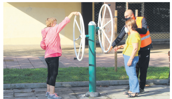
Nagusien parkeko makinak erabiltzen ikasi dute zenbait lasarteoriatarrek. TXINTXARRI

Bizikleta martxa, kale jolasak, Ipar Martxako erakustaldia, eta Bizikleten bigarren eskuko azoka izango dituzte ostiralen, irailaren 24an, eta auto elektrikoaren gaineko informazioa ere gertutik jaso ahal izan dute; Usurbilgo Lanbide Eskolaren auto eta bizikleta elektrikoak jarriko dituzte ikusgai.