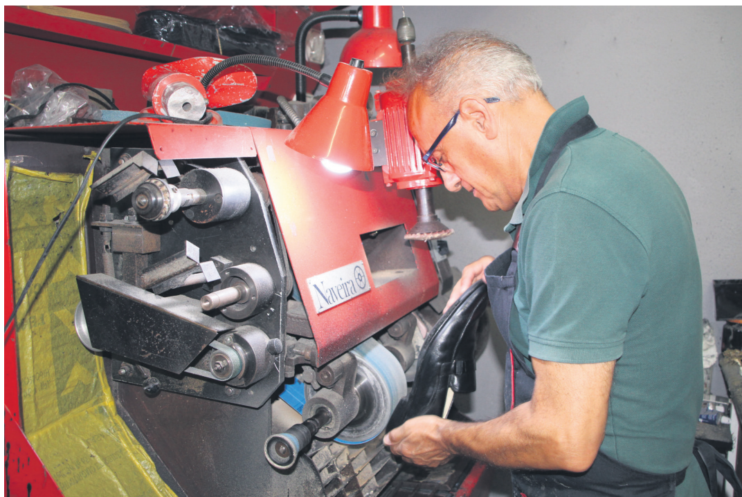
Teknologia barneratu eta makinak hobetzen joan badira ere, zapatari lanak betikoa izaten jarraitzen du. TXINTXARRI

Daudenak hartu, eseri, eta jarraian egiten ditut denak. Hala ere, bada oraindik ideia hori buruan duenik: zapatariok eserita lan egiten dugula... Inondik ere ez! Guztiz kontrakoa. Josteko makina elektrikoak ere badaude, baina niretzat ez dira batere praktikokoak, betikoa nahiago dut.