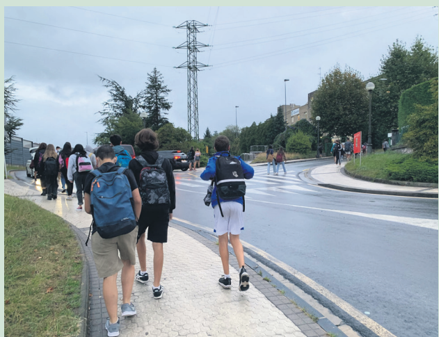
Ikasle talde bat, Oriarte Larrekoetxe ikastetxera bidean. TXINTXARRI