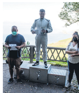
Manso, 7. mailako podiumeko gorenean.

Mansok BRC B49 ibilgailura eta maila berrira ongi moldatzen ari dela erakutsi du. Tamalez, azken txandan lehen lasterketan egindako denbora gainditu eta Lagun Artea taldeko Porsche GT3ak eraman du bigarren postua.