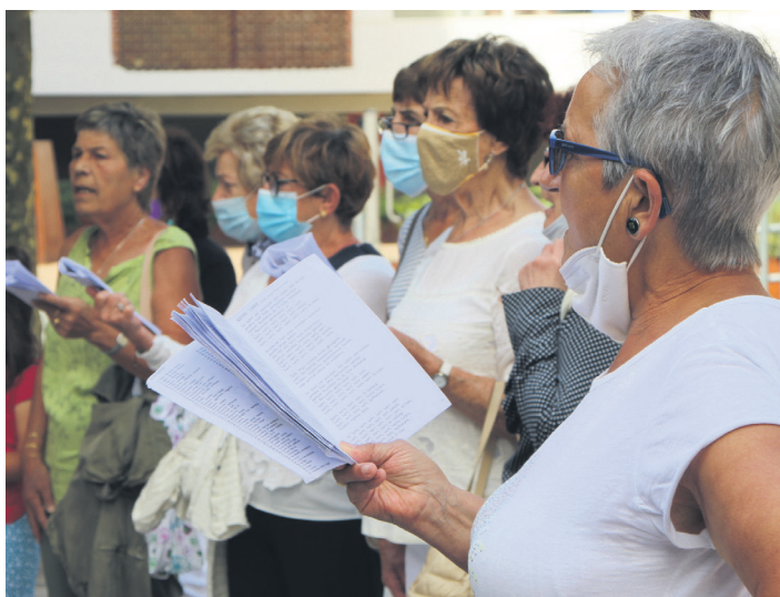
Euskal abestiz betetako errepertorioa dute Xumela koruko kideek. TXINTXARRI

Koruko kide izan eta euskaraz giro ederrean abestu nahi