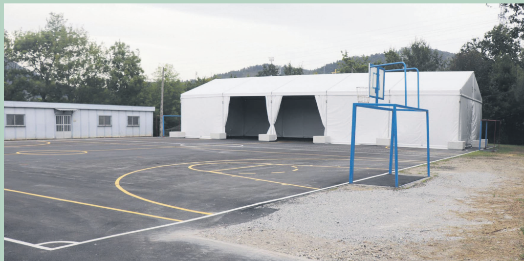
Landaberri LH ikastetxeko goiko patioan karpa bat jarri du udalak, soinketa bezalako jarduerak egin ahal izateko. TXEMA VALLES