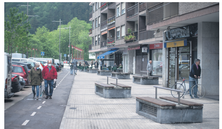
Lasarte-Oriako intzidentzia-tasa 267,79 izan da irailaren 8an. TXINTXARRI

Gazte zein helduentzako ikastaroak, auzoetako jarduerak eta 5+1 ikastaro irekiak egitasmoa eskaini ditu udalak. Azken horren