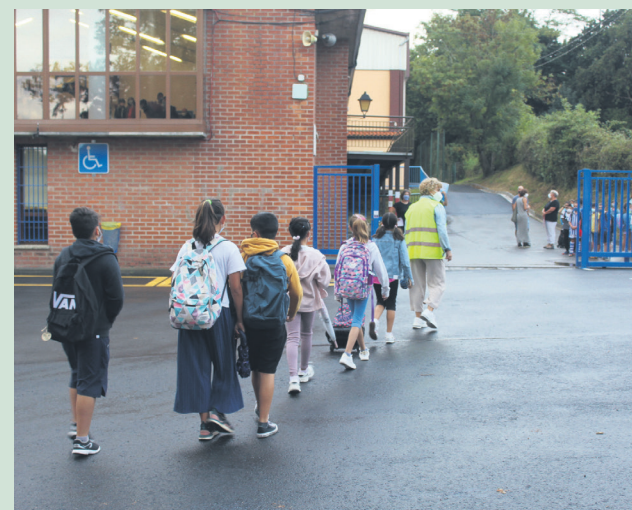
Landaberri LHko ikasleak, autobusetik jetsita, ikastetxera iristen. TXINTXARRI