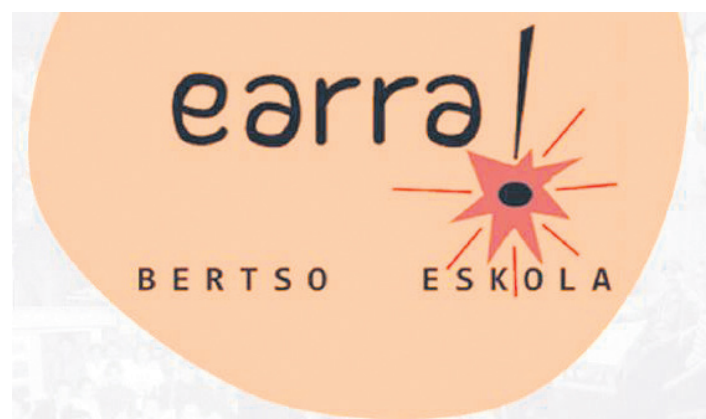
Earra bertso eskolako hiru gaztek parte hartu dute lehiaketan.

Ekintzetan parte hartzeko izena ematea beharrezkoa da, 943 67 02 49 telefonora deituta. Aste Berdea antolatzeko 7.955 euro esleitu zaizkio Artelatzi. Bi jardueraz gain, Froilan Elespe parke botanikoko informazio panelak berrituko dituzte.