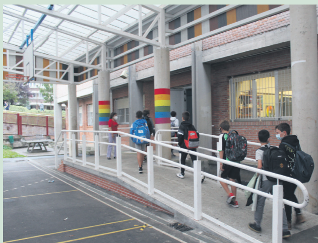
Oriarte Landaberriko ikasleak patioatik sartu dira. TXINTXARRI

Edonola, egoerak ahalbidetzen duen heinean, zenbait ekimen berreskuratzen joateko asmoa dute. Esaterako, pantailak atzen utzi eta saiatzen ari dira bilera batzuk aurrez aurre egiten, "jendeak pila bat eskertzen du"; halaber, irteera "xume" batzuk egitea ere aurrekusten dute, arinegi ibili gabe, "eskua zabaldu, baina tentuz".