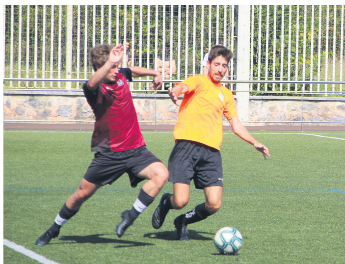
Ostadar SKTko (laranjaz) eta Vasconia jokalariek, baloiaren jabetza lehiatzen.

Entrenamenduetan gogor lan egiteaz gain, denboraldiaurrean bost lagunarteko jokatu ditu Erregional Gorengoak. "Iaz ez lehiatzea erabaki genuen, eta baloiarekin 'adiskidetzeko,' ahal