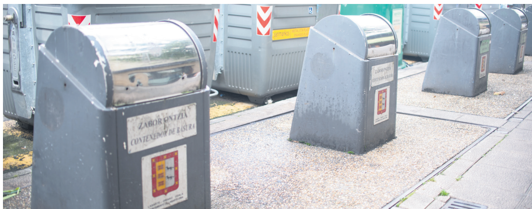
Udal gobernuak lur azpiko edukiontzia kentzeko proposatu du. Asmo hori txalotu egin du Lasarte-Oriako EAJk. TXINTXARRI