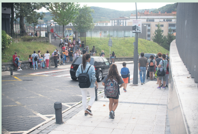
Senide ugari ikasleak lagundu dituzte ikastetxe sarrerara. TXINTXARRI

Sastre agurtu aurretik, sarrerako korridorera atera gara, eta bospasei ikasle hara eta hona zebiltzan, irakasle batekin, ikastetxea ezagutzen. Zuzendariak azaldu duenez, kurtsoa lehen egunean harrera berezia egiten diete ikasle berriei, hasiera ez dadin horren arrotza izan.