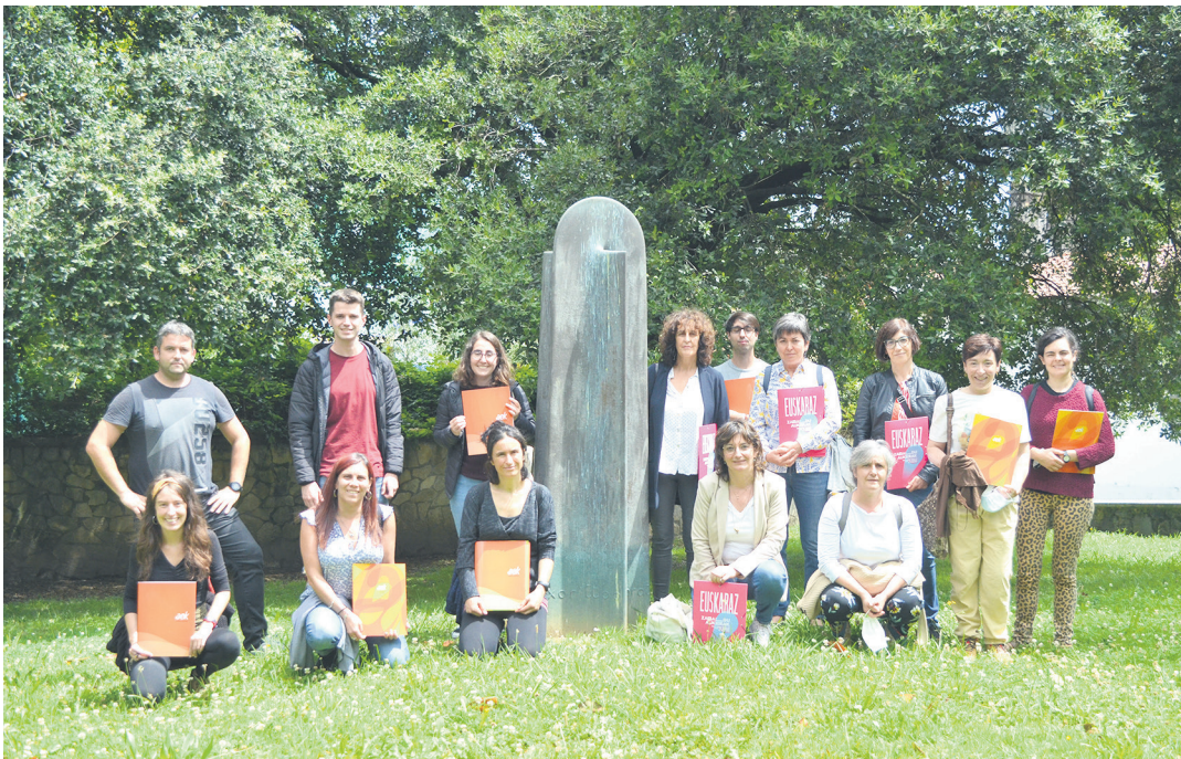
Buruntzaldeko eskalategien zein Udaletako euskara zerbitzuen ordezkariak Urnietan ateratako argazkian.