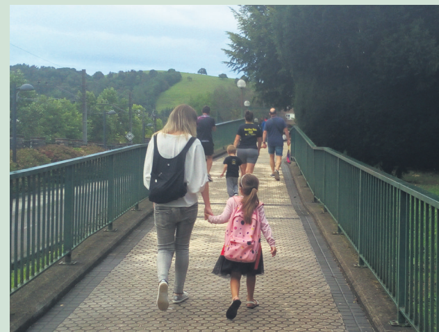
Senideek lagunduta iritsi dira haurrak lehen eskola egunera. TXINTXARRI

Hain zuzen ere, Sasoeta-Zumaburuko, Landaberri-Garaikoetxeako eta Oriarteko zuzendaritza taldeekin hitz egin du TXINTXARRI-K, 2021-2022 ikasturtearen nondik norakoak biltzeko.