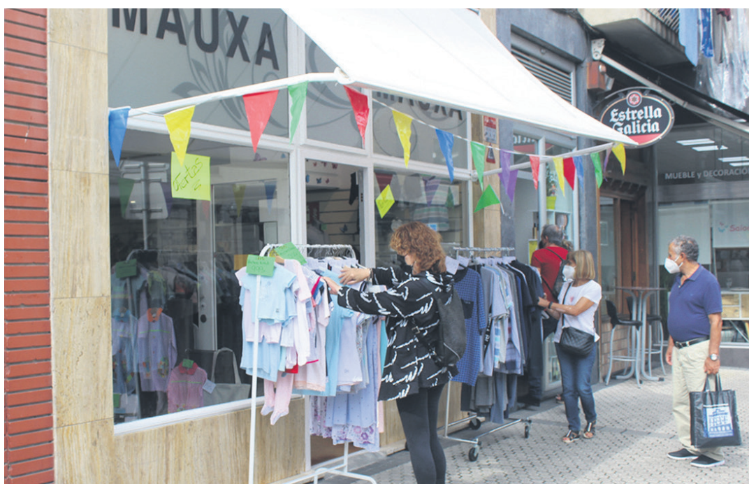
Lasarte-Oriako Merceria Mauxak gizonezkoen kaleko arroparen eskaintza egin du, gehienbat, aurtengo Stock Azokan. TXINTXARRI