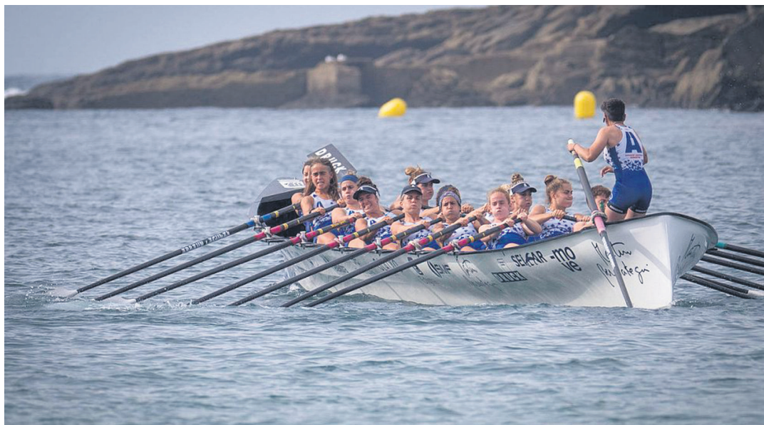
Donostia Arraun Lagunak, Kontxako banderako sailkapenean lehian. DONOSTIA ARRAUN LAGUNAK