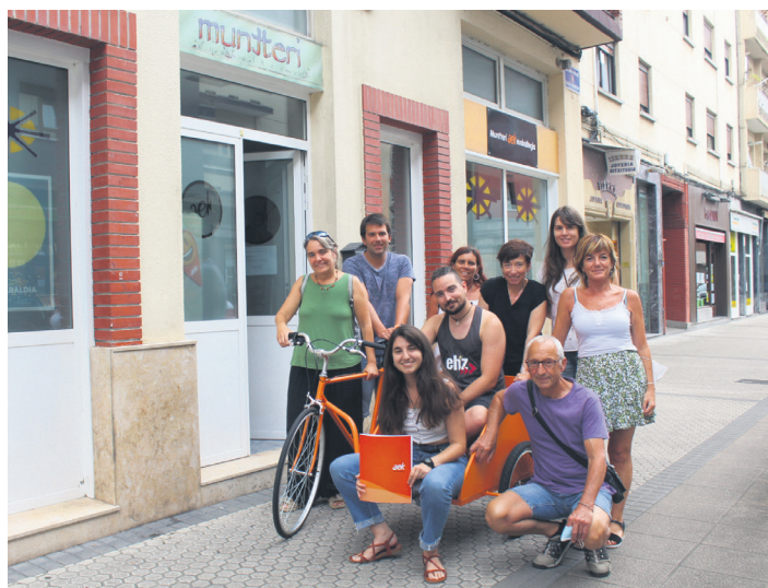
Muntteri-AEK euskaltegiako ikasle eta irakasleak, hasteko irrikaz. TXINTXARRI

Matrikulazio kanpaina irail osoan zehar dago zabalik, baina