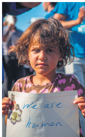
Erakusketako irudi bat. M.BARDAJI

Orduko ekitaldira gerturatzeko aukerarik izan ez zutenek, badute bertan aurkeztutakoa ikusteko aukera oraindik. Izan ere, ekitaldia bideoz grabatu zuen lantaldeak, eta honako bi helbidetan ikusi daitezke.