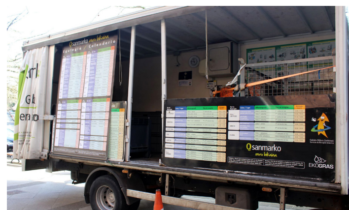
Andatza plaza ondoan jartzen da furgoneta, asteazkenean.

COVID-19ari aurrea hartzeko neurriak direla eta, gonbidapenak behar dira jardunaldietan parte hartzeko. Gehienez bi banatuko dira pertsonako, eta kultur-etxean jaso behar dira 10:00etatik 13:00etara, eta 17:00etatik 20:00etara, eta, sarrerarik eskuragarri geratuz gero, jardunaldien egunean bertan, ordubete lehenago leihatilan ere eskuratu ahal izango dira.