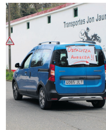
Larunbateko argazki bat.

Ostalaritza Lasarte-Oria elkarteak prentsa-agerraldia egingo du gaur, ostiralarekin, otsailak 26, 18:00etan Okendo plazan. Herritarrak kontzientziatzeko kanpaina bat aurkeztuko dutela iragarri dute, eta, horrez gain, iragan astean udalak egindako adierazpenei ere erantzuteko asmoa agertu du eragile horrek.