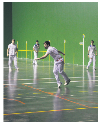
Intzako senior bikotea, jokoan. TXINTXARRI

Trinketako lehiak Intzako Haritza Diaz de Gereñu eta