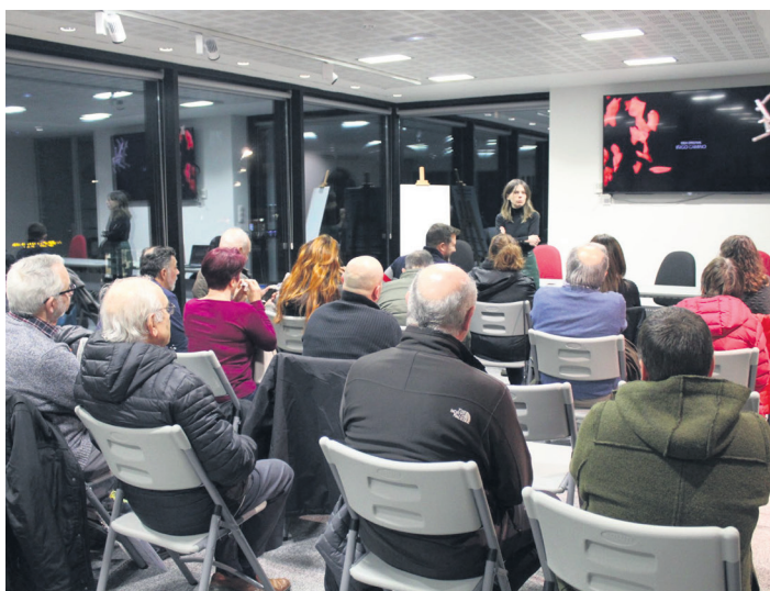
Herritarrak, iazko bizikidetza jardunaldietan parte hartzen. TXINTXARRI

Egoera horretan kokatuko ditu ikus-entzuleak dokumentalak, eta, proiektzioa