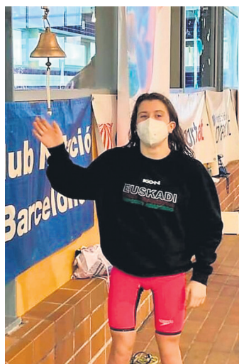
Zudaire, Espainiako errekorren kanpaia jotzen. BURUNTZALDEA IKT

Igandean, berriz, 200 metro libre eta 100 metro tximeleta probetan lehiatu zen. Goizeko sailkapen probak gainditu eta finaleran izan zen. Tximeletako proban bigarren sailkatu zen 1:24,39 markarekin eta estilo libreko proban, berriz, hirugarren