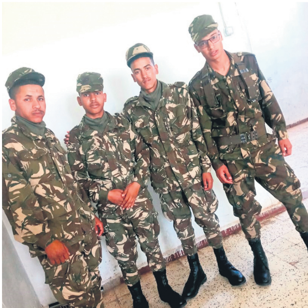
Nazioarteak Mendebaldeko Sahara "abandonatu" duenez, bide bakarra gerra dela uste dute gazte askok TXINTXARRI

M.S.B.: Gatazkaren erantzulea eta lehen erruduna da. Joan egin zen Mendebaldeko Sahara bitan banatuta, Maroko eta Mauritania artean, bertan herririk ez balego bezala.