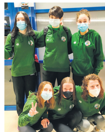
Buruntzaldea IKTKo igerilariak.