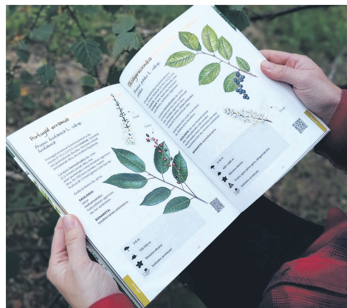
Liburuaren azala eta barruko orrialdeak. GOIZANE LÓPEZ ELIZONDO