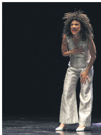
'Mi 3er acto' antzezlanaren oholtzaratu. TXINTXARRI

Kuadrillategi egitasmoa lagun talde baten Begiak itxi ditzala horrela ez nauenak gustuko ikusentzunezkoa izan da Beldur Barik lehiaketaren garailea, eta, udal ordezkariak azaldu dutenez, kalitate tekniko eta artistikoaren gaintik, "hausnarketarako eta eztabaidarako sortzen duen aukera" baloratu dute. Neska gazteen ahalduzaren aldeko mezua zabaltzeaz gain, mutil gazteek matxismoaren aurka agertzen duten jarrera ere baloratu dute. Azaroaren 26an