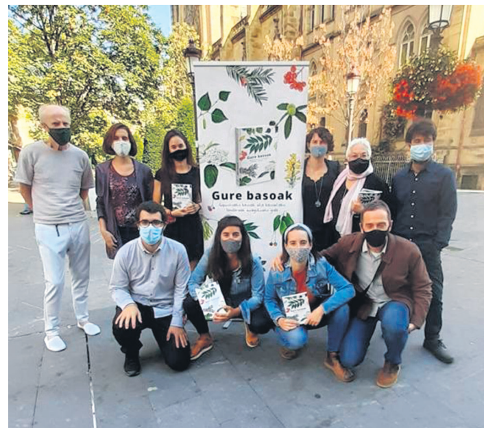
'Gure basoak' liburuaren aurkezpena egin zen irailan. ARANZADI ZIENTZIA ELKARTEA

Bai. Horregatik, eskerrak eman nahi dizkiegu liburuan sinetsi eta proiektua bultzatu dutenei, hain zuzen ere, Kutxa Ekoguneari, Gipuzkoako Foru Aldundiari, Viveros Pagolari, Txukun Lorazaintzari eta BERRIA egunkariari.