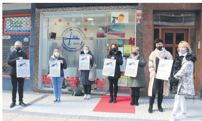
Ana ile-apaindegiaren aurrean egin dute agerraldia. TXINTXARRI

kanpainarekin, eta zozketan parte hartzeko, egindako erosketen truke, papertxo bat jasoko dute erosleek. Horiek datu pertsonalekin bete beharko dituzte. Abenduari hasiera ematearekin batera abiatu dute azken kanpaina hori, eta hilaren 29an amaituko da, asteartez. Horrekin batera, aurreratu dutenez abian duten azken kanpaina, ez da izango merkatarien elkarteak urte honetan egingo duen azken ekitaldia. Ez dute aurreratu zein izango den hori.