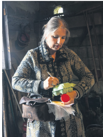
Lehen langin-bilketako irudia.

Zubieta Lantzenek eta Erraustegiaren Aurkako Mugimendua kontrolaren abiapuntuko emaitzak jakitera