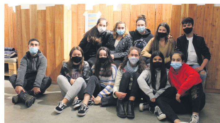
Asteazken honetan bildu da TXINTXARRI Gazte Batzordeko kideekin. TXINTXARRI

Nerabeen Euskaraldirako txapak Nerabeen Euskaraldirako txapak ere prestatu dituzte. Haiek diseinatu eta egin dituzte, banan-banan, egitasmoan parte hartzerantz. Dinamika hori eragingarria dela argi dute gazteek: "Mugimendu honekin jendea kontzienteago da; gure inguruan euskara gehiago