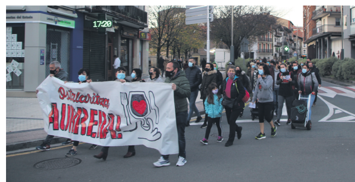
Herritarrek bat egin dute ostalariekin aldarriekin beste behin. TXINTXARRI