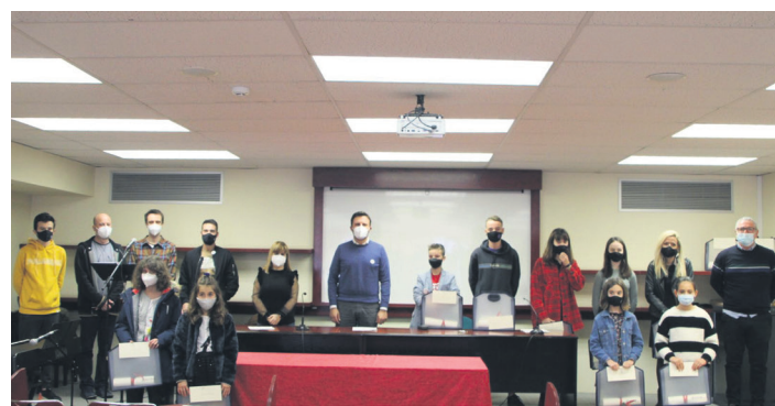
Literatur lehiaketako sarituak, oroigarriak eskuetan dituztela.