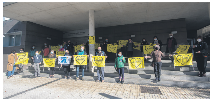
'Bidea gara, bidean gaude' ekimenarekin bat egin du Lasarte-Oriako Sarek. TXINTXARRI

Lehen azalpena gradu bakoitzaren baldintzei buruzkoa izan zen. Lehen graduan, patio orduak mugatuak, ezin dute ekimenetan parte hartu, komunikazioak interbenituta dituzte,