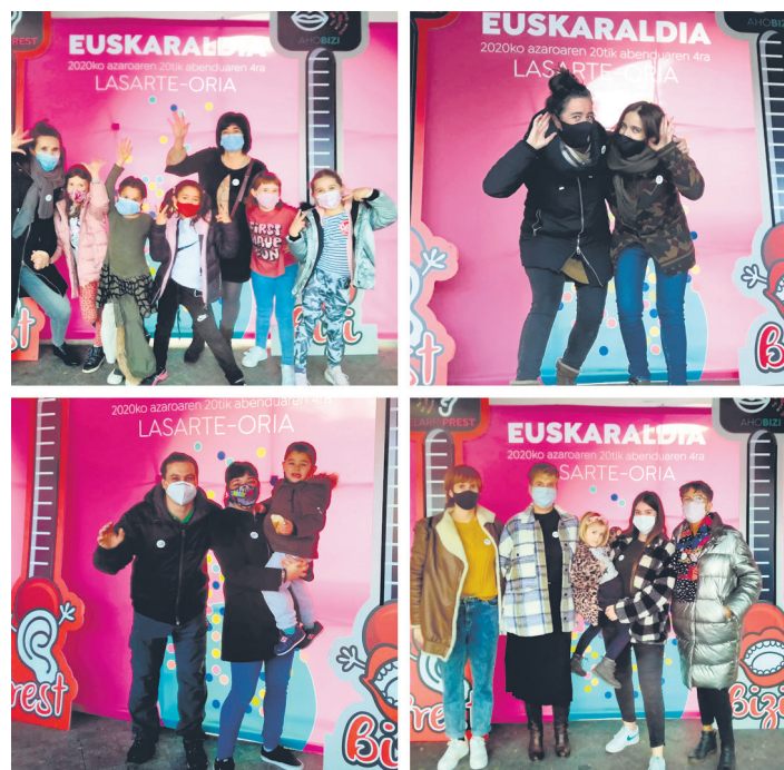
Txapak jasotzeaz gain, photocallean argazkiak atera dituzte herritarrek. TXINTXARRI

Ttakun Kultur Elkarteak 11 barne arigune ehundu ditu, eta kanpoko 61. 118 kidek osatzen dituzte euskaraz lasai hitz egiteko gune horiek.