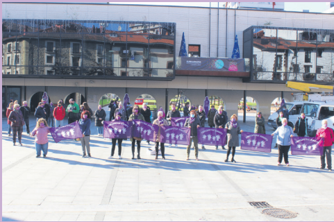
Okendo plazan egin dute elkarretaratzea. TXINTXARRI

Indarkeria matxistaren aurka Elkarretaratzea egin dute udal korporazioko kideek eta herritarrek Okendo plazan. Indarkeria matxistaren biktima izan diren emakumeak gogoratu dituzte, eta, kasuen igoera dela eta, kezka adierazi dute.