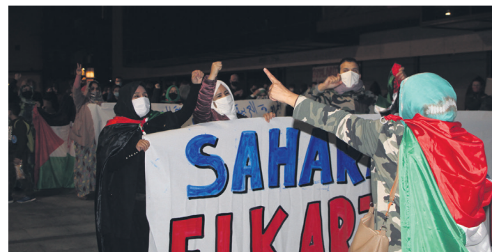
Eskualdeko saharar ugari parte hartu dute elkarretaratzean. TXINTXARRI