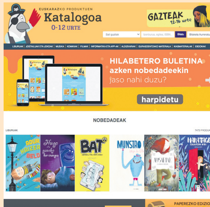
Buletinera harpidetzeko gunea eta nobedadeak dauzka, 'katalogoa.eus' webguneak

Doako harpidetzaren bitartez, hilero jaso daiteke Katalogoa