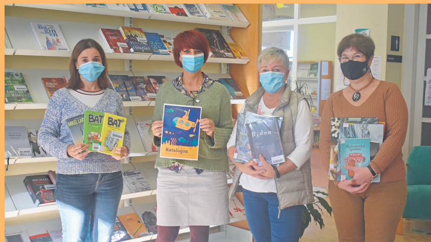
Hernaniko Udal Liburutegiko arduradunak, haur eta gazteentzako liburuekin.