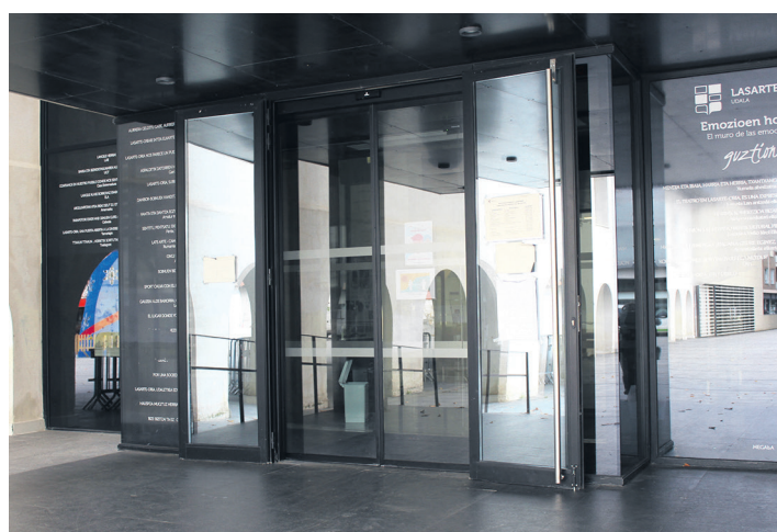
Udaleko sail batzuetarako hitzorduak Internet bidez eskatu ahal dira. TXINTXARRI