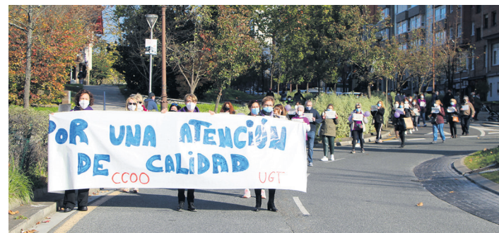
Atsobakar zahar egoitzeko langileak lan baldintza duinen alde kalera atera dira. TXINTXARRI

Bukaeran hitza hartu du Hassana Aalia aktibista sahararrak: "Egoera zaila da, Maroko okupatutako lurretan dauden herritarren giza eskubideak urratzen ari da. Argi dugu modu guztietan borrokan jarraituko dugula independentzia lortu arte". Halaber, erantzuleak ere izendatu ditu. "Erruduna Espainia, nazioartea eta NBE dira urte guztietan ez baitute Maroko behartu autodeterminazio erreferenduma egitera".