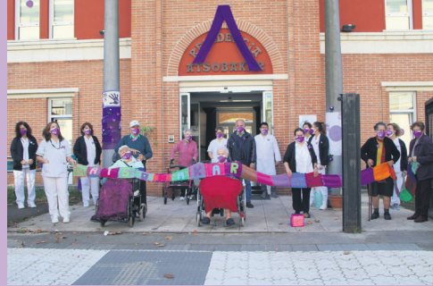
Atsobakar egoitzako egoiliarrek eta langileak. TXINTXARRI

Indarkeria matxistaren aurka Elkarretaratzea egin dute udal korporazioko kideek eta herritarrek Okendo plazan. Indarkeria matxistaren biktima izan diren emakumeak gogoratu dituzte, eta, kasuen igoera dela eta, kezka adierazi dute.