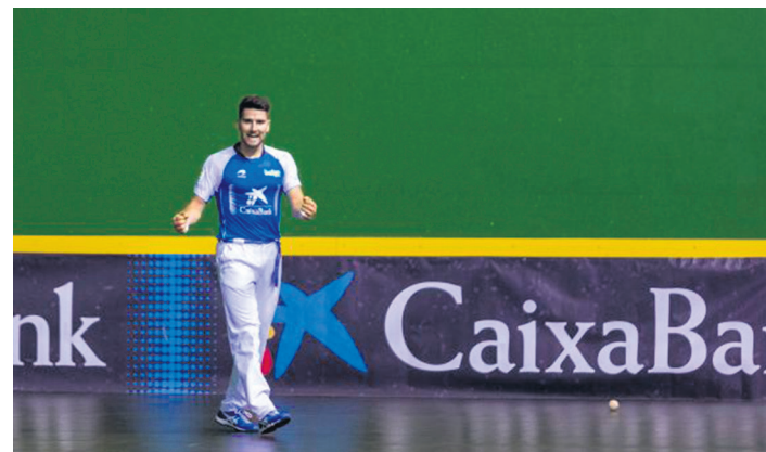
Arteaga II.a garaipen bat ospatzen. BAIKO PILOTA

2017. urtean jantzi zuen txapela estreinakoz, Bakaikoari 22-18 irabazita. Urte bikaina egin zuen herritarrek, hilabete batzuk lehenago Promozio binakakoa irabazi zuelako Erasunekin batera.