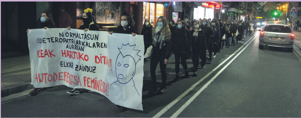
Herritar ugariak parte hartu dute eskualde mailako mobilizazioan asteazken arratsaldean.

'Elkartasun matxak' egitasmoarekin bat Atsobakar adinekoren egoitzako egoiliarrek hariarekin landutako lanak aurkeztu dituzte egoitzaren harreran. Bufanda hori Erribera kalean dagoenarekin lotu eta Astigarragako Harituz elkartera bidaliko dute.