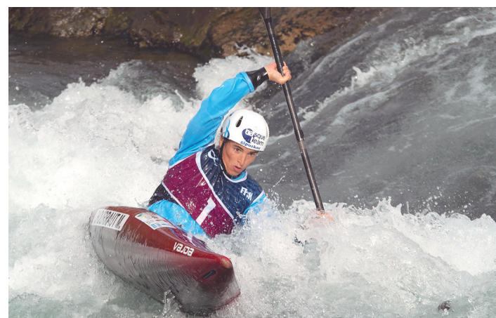
BAT BASQUE TEAM

Pasako marra sei eta erdiko koadroan jarriko da. Parte hartzaileek botileroak izango dituzte txapelketako partidetan beste enpresako pilotarien aurka jokatzeko dutenean eta botilero moduan, enpresako teknikariek bakarrik lagundu ahal izango dute. Gainera, ez da partidari atzeratuko.