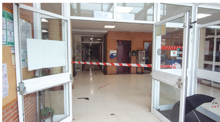
Udal instalakuntzak 21:00ak arte irekita egongo dira. TXINTXARRI

Ostadar Ipar martxako kideek jakitera eman dutenez, hilabete honetan aurreikusitako zituzten