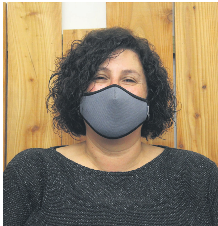
Bizitzen ari den egunerokoaren berri eman dio herritarrek TXINTXARRI-ri . TXINTXARRI

PCR probarik egin ez, hortaz koronabirusarekiko susmorik ez zuten medikuek.