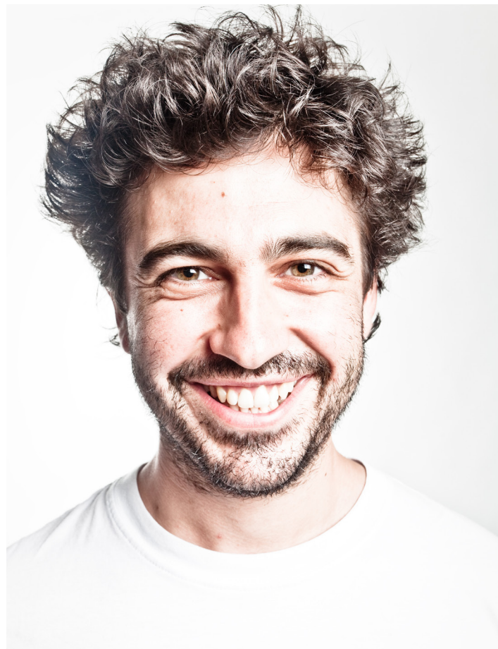
Zenbait talde eta orkestratan jotzeaz gain, biolin irakasle ere bada lasarteoriatarra.

"MUGURUZAREN MUSIKA IZAN DA 10-12 URTE NEUZKANETIK ETXEAN ENTZUN DUDANA"