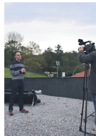
USURBILGO LANBIDE ESKOLA

Azaroaren 19an emitituko duten Teknopolis saioan, besteak beste, hitz egingo dute Usurbilgo Lanbide Eskolari buruz. "Berrikuntza nola lantzen dugun ikustera etorri dira", adierazi du eskolak. Long life batteries egitasmoaz hitz egin dute. Usurbilgo Lanbide Eskola lankidetzan ari da San Viator eta Don Boscorekin. Aztertu nahi dute ea erabiliak izan diren autoen bateriek balio duten etxebizitzetan sortutako energia gordetzeko.