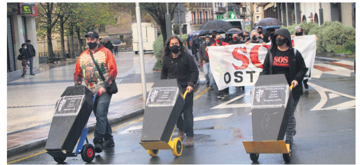
Bizitzen ari diren egoera salatzen ostalariek egindako manifestazioa.

Astelehenaz geroztik, Lasarte-Oriak herri ezezaguna dirudi. Herriko tabernen giro eta hotsa