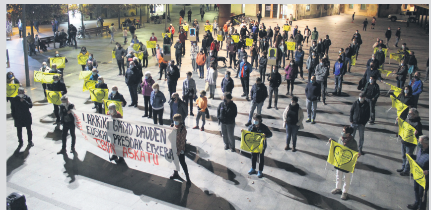
Dozenaka herritar elkartu dira Okendo plazan asteazken arratsaldean.