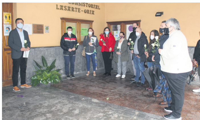
Udaletxe zaharraren atarian egin dute Memoriaren Eguneko ekitaldia.

Iraganeko akatsak ahazten dituen gizarteak akats horiek berririo errepikatzeak arriskua duela azaldu du alkateak