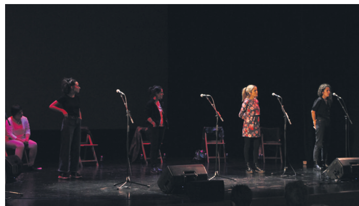
Ia bi ordu iraun zituen azaroaren 8ko bertso saioak. TXINTXARRI