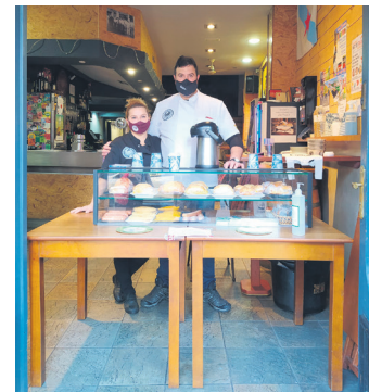
Avenida tabernako Yon eta Liza. TXINTXARRI