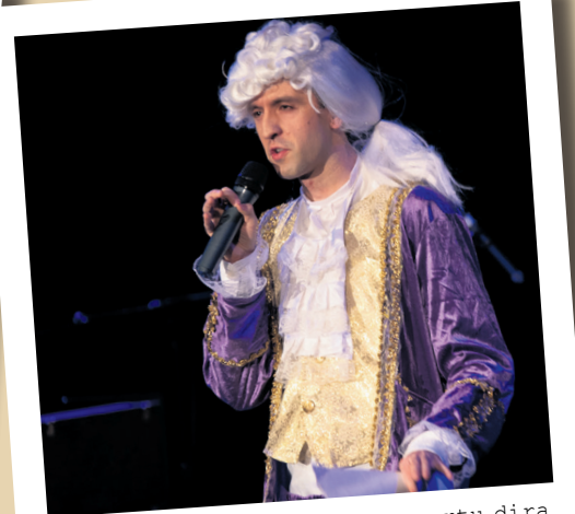
Mozorro dotoreak jantzita agertu dira oholtzara emanaldi osoan zehar. TXINTXARRI