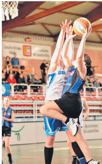
Kadeteen aurtengo partida bat. J. SANCHEZ

Freskoago eta indartsuago ekin zioten urdin-beltzek bigarren laurdinari, eta nabaritu zen hori markagailuan: 24-15ekoa