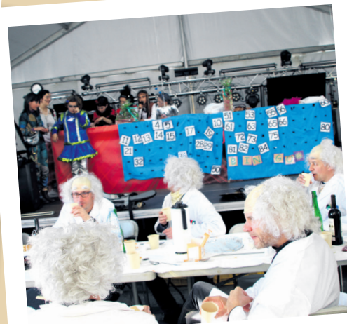
Bazkalostean bingoan parte hartu dute Okendoko karpan bildutakoek. TXINTXARRI