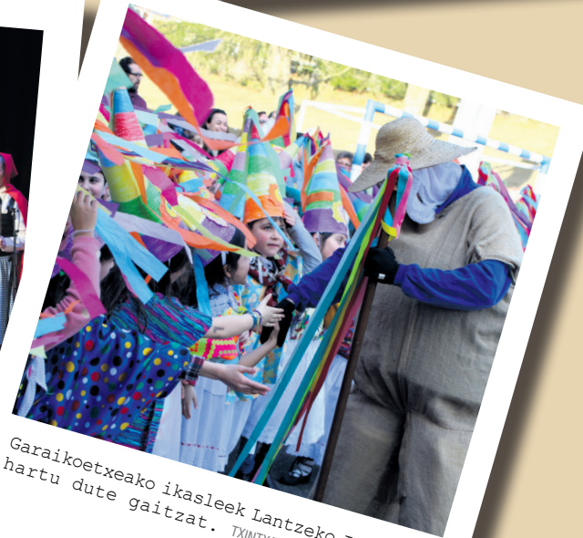
Garaikoetxeako ikasleek lantzeko Inauteria hartu dute gaitzat. TXINTXARRI