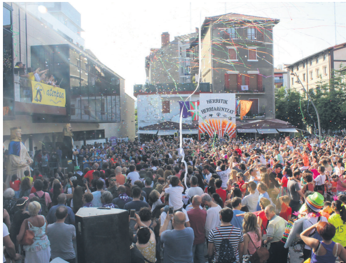
Argazkian, iazko helduen txupina, ostiral arratsaldekoa, Okendo plazan.

Esan bezala, martxoaren 27an itxiko da epea diru-laguntza horiek eskatzeko. Behin eskaera guztiak eskuetan, udalak baloratu egingo ditu horiek. Irizpide sorta bat prestatu du horretarako, eta puntu kopuru bat eman bakoitzari. Jarduera edo egitasmoaren aurrekontuak 40 puntu balioko ditu, adibide bat