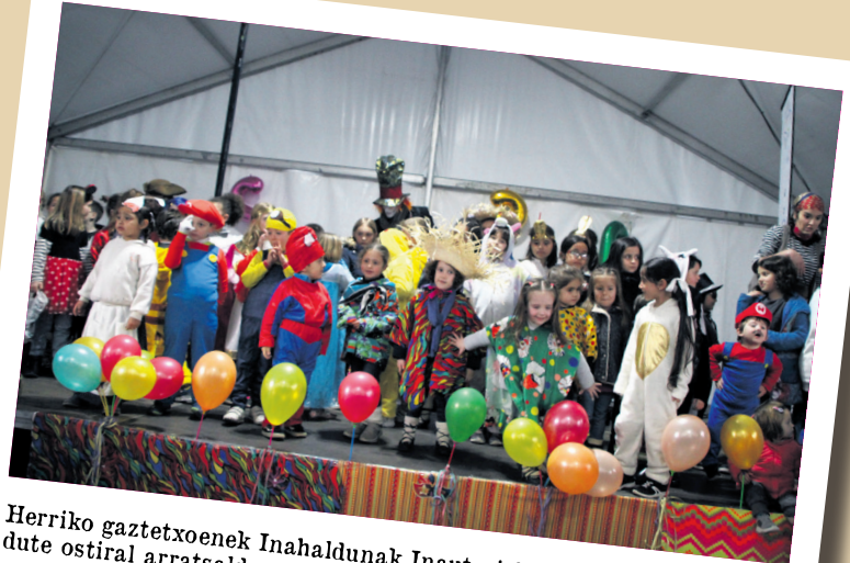
Herriko gaztetxoek Inahaldunak Inauteri festaz gozatu ahal izan dute ostiral arratsaldean.