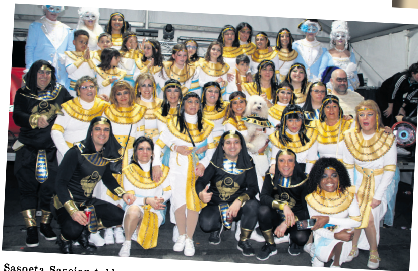
Sasoeta Sasoian taldearen konpartsa izan da aurtengo garailea. Zintzarria lortu zuten oroigarri gisa. TXINTXARRI