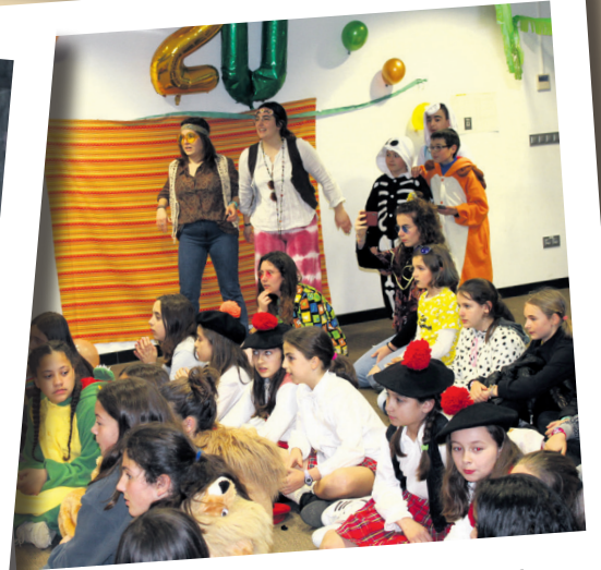
9 eta 16 urteko gazteek ere Inauteri festa ederraz gozatu dute Gaztelekuan. TXINTXARRI