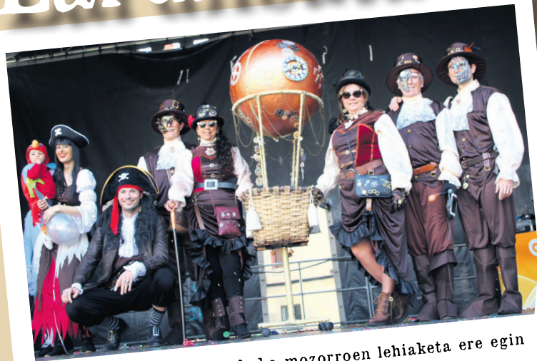
Larunbat goizean, bakarkako mozorreen lehiaketa ere egin zuten Okendo plazan. TXINTXARRI