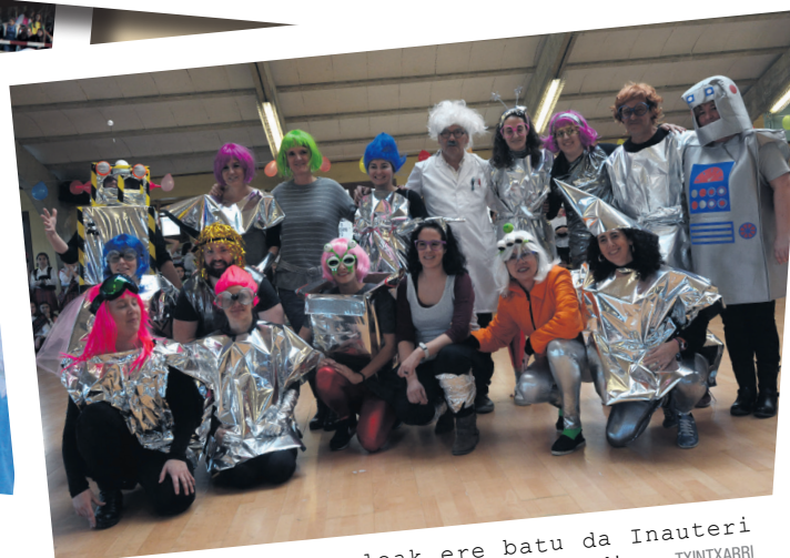
Landaberriko irakasleak ere batu da Inauteri festara; 4.500. urteko gizakia bilakatu dira. TXINTXARRI