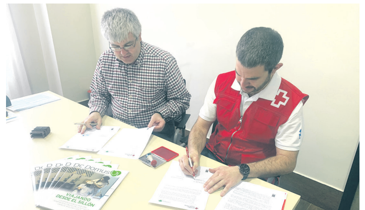
Gurutze Gorriko eta Domusvi enpresako ordezkariak hitzarmen sinaketan. GURUTZE GORRIA

Gurutze Gorriak 2000. urtetik eskaintzen ditu garraio egokituko zerbitzuak. "Helburua da mugikortasun urria duten pertsonak ahalik eta gehien gizarteratzea", nabarmendu du elkarteak. "Ez da erraza aisia eta denbora libreko ekintza horietan parte hartzea pertsona horientzat, aukera bakarra garraio publikoa denean".