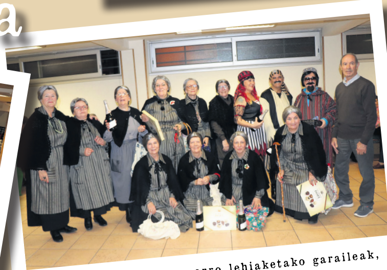
Zaharren egoitzako mozorro lehiaketako garaileak, sariak eskuarteant dituztela. TXEMA VALLES