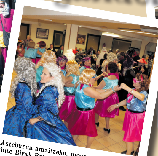
Asteburua amaitzeko, mozorro jaialdia egin dute Biyak Bat egoitzan. TXEMA VALLES