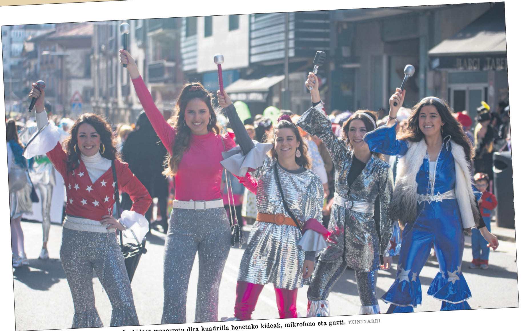
Abba musika talde suediar ezaguneko kideez mozorrotu dira kuadrilla honetako kideak, mikrofono eta guzti. TXINTXARRI