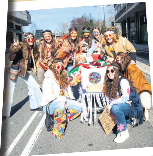
Hippi kuadrila bat ere ibili da herriko kaleak girotzen. TXINTXARRI