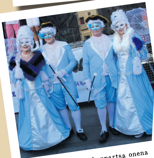
Aterpeak egin ditu konpartsa onena aukeratzeko epaile lanak. TXINTXARRI