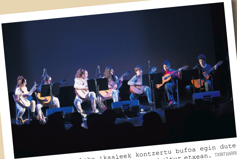
Udal Musika Eskolako ikasleek kontzertu bufoa egin dute ostegun arratsaldean, Manuel Lekuona kultur etxean.