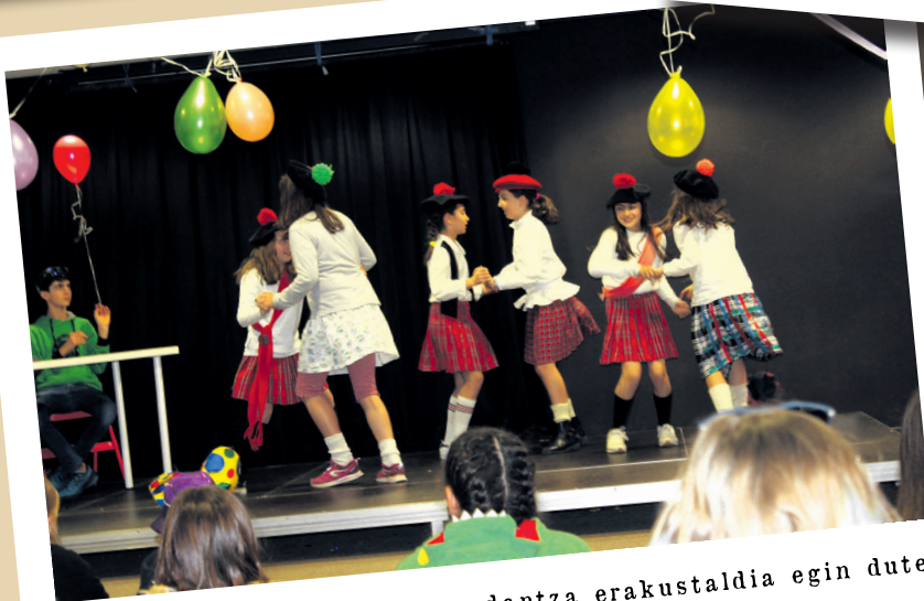
Eskoziako jantziak soinean, dantza erakustaldia egin dute lagun talde batek, ostiraleko saioan.