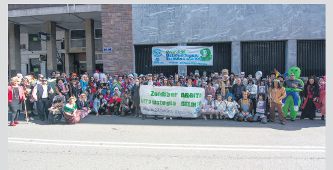
Zaldibar argitzeko eta erraustegia geratzeko eskatu dute. TXINTXARRI

Hori kontuan hartuta, eskaera bat egin diete agintariei: osasunean ez ezik, ingurumenean eta kliman ahalik eta eragin gutxien izango duen moduan kudeatu ditzatela hondakinak. "Kudeaketa horrek, jakina, hondakinengandik errausketa eta horren ondorioz sortutako zepena eta erraustsen zabortegeetako metaketa bertan behera uztea eskatzen du". Agerraldia amaitu aurretik, "klase politiko eta erakunde guztiei" ere zuzendu dizkiete azken hitzak. Eskatu diete osasuna euren politika guztietan txertatzea, ingurumen osasungarriagoak sortzeko eta gaixotasunak ekiditeko, Munduko Osasun Erakundearen gomendioari eta "gizartearen nahia" jarraiki.