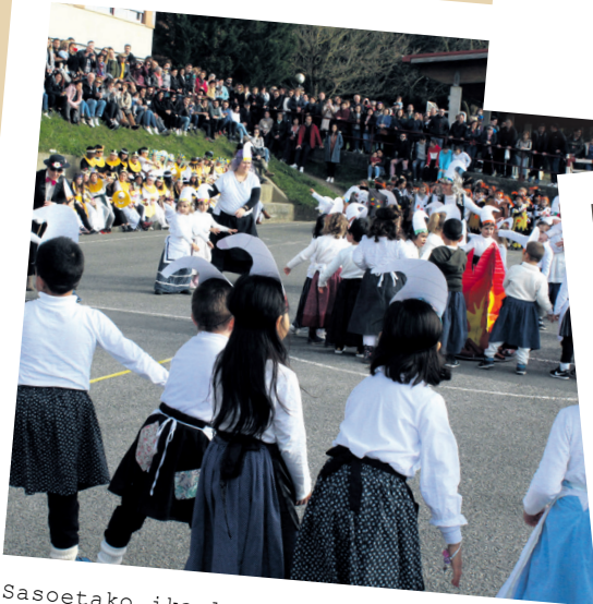
Sasoetako ikasleek denboraren makinaren bitartez iraganera egin dute bidaia. TXINTXARRI