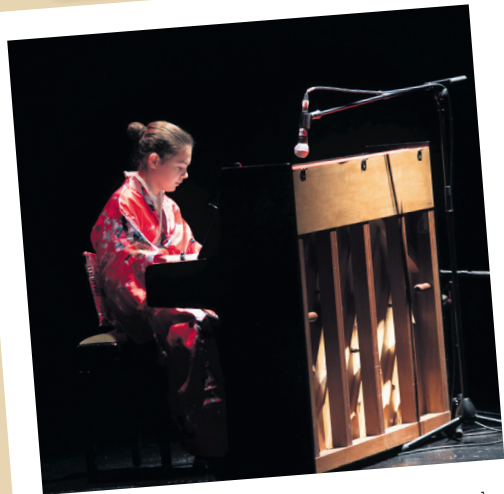
Piano jotzaile bat osteguneko emanaldiaren une batean. TXINTXARRI