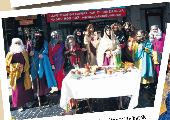
Jesusen 'Azken Afarria' irudikatu du herritar talde batek larunbateko Inauteri egunean.