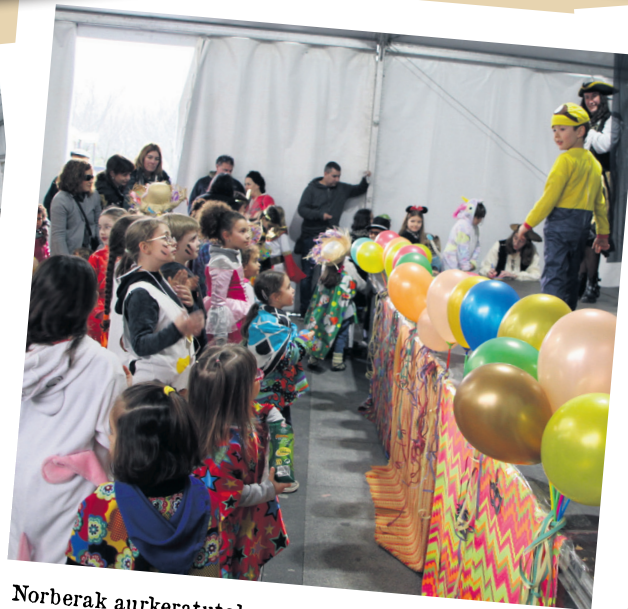
Norberak aurkeratutako mozorroak jantzita agertu dira gaztetxoak Ttakunen festara. TXINTXARRI