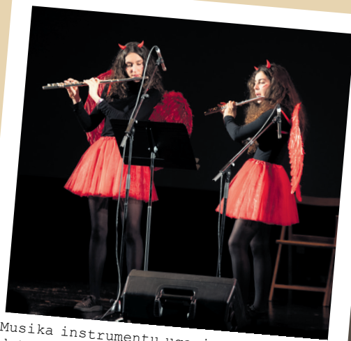
Musika instrumentu ugariarekin eskaini dute emanaldia musikariek. TXINTXARRI