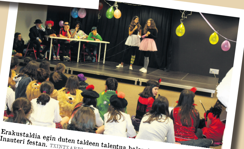
Erakustaldia egin duten taldeen talentua baloratu du epaile talde batek Inauteri festan. TXINTXARRI