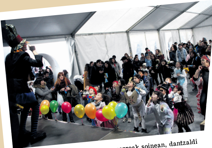
Musikaren laguntzarekin eta mozorroak soinean, dantzaldi animatua egin dute Okendoko karpan. TXINTXARRI