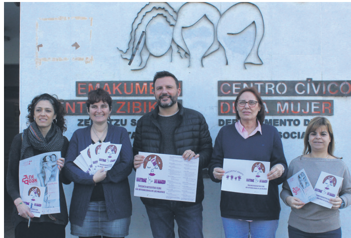
Udal ordezkari eta teknikariak egitarauaren aurkezpenean.

Martxoaren 8an bertan, Emakumeen Nazioarteko Egunean, igande eguerdian, elkarretaratzea egingo da, Okendo plazan. Aurretik, 2021. urteko Emakumeen Nazioarteko Eguneko kartel lehiaketako aukeraketak emango dio hasiera egitarauari. Herriko gazteen proposamenen erakusketa irekiko da Emakumeen Zentroan. Martxoaren 4an, 18:00etan egingo da sari banaketa, asteazkena.