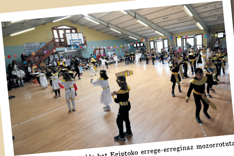
Landaberriko gazte talde bat Egiptoko errege-erreginaz mozorrotuta irten da agertokira, dantzara.