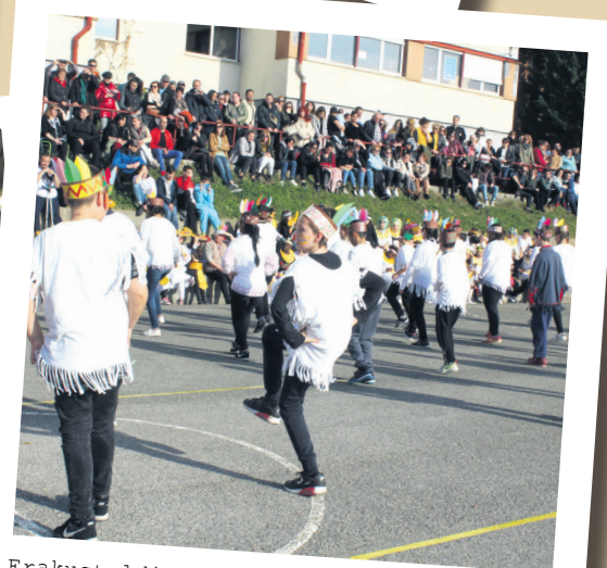
Erakustaldi koloretsua eta animatua egin dute Sasoetako ikasle guztiek.