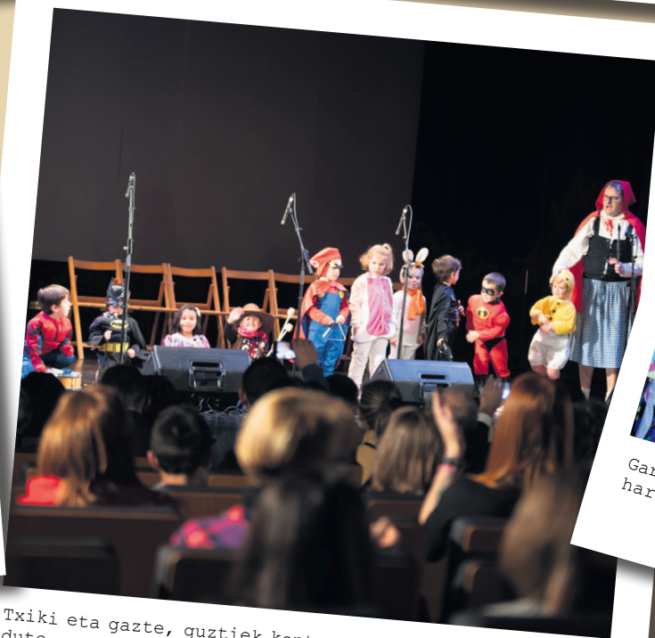
Txiki eta gazte, guztiek kontzertu dibertigarria eskaini dute aurtengo kontzertu bufoan ere. TXINTXARRI