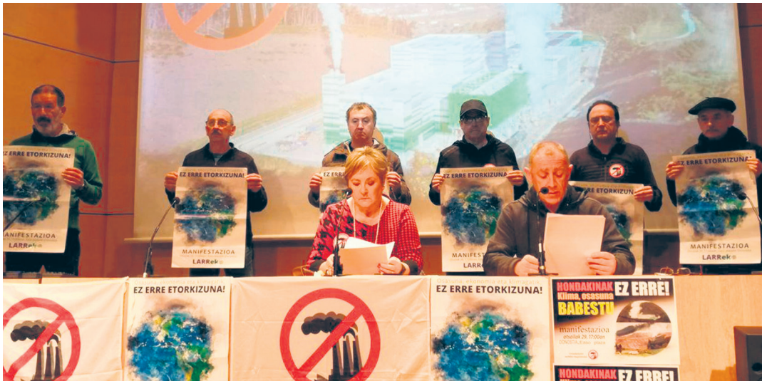
Asteartean egin du agerraldia prentsaren aurrean Erraustegiaren Aurkako Mugimenduak, Donostian. TXINTXARRI