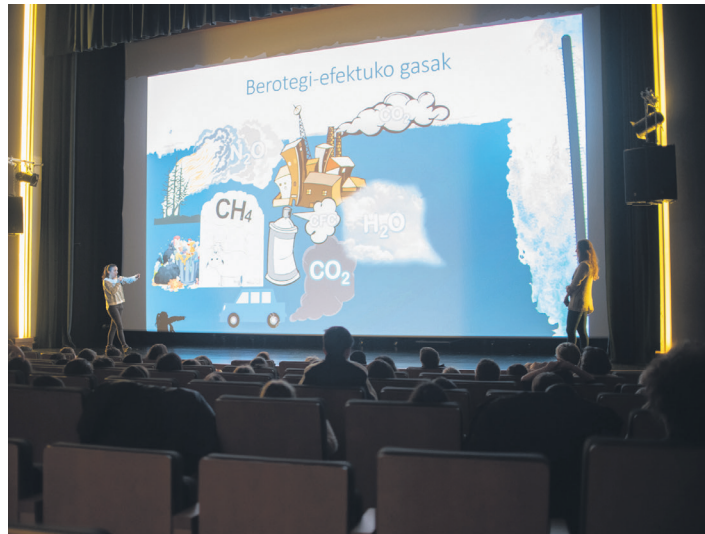
Kontzeptu interesgarri asko sakondu dituzte ikastetxeetako haurrek. TXINTXARRI

Gaur egungo gaztetxoek harridura eta lilura oihu horiek kezka eta tristurazkoak bilaka daitezke urte gutxiren buruan. Itsasoko kutsaduraz ohartarazi die beste film labor batek haurrei. Datu bat: plastiko kontsumo eta kutsadura erritmo honekin jarraituz gero -2019a izan da urterik kutsagarriena, dokumentalaren arabera-, 2050. urtean animalia baino plastiko gehiago egongo da ozeanoan eta itsasoetan. Itsasoa ezagutzeaz