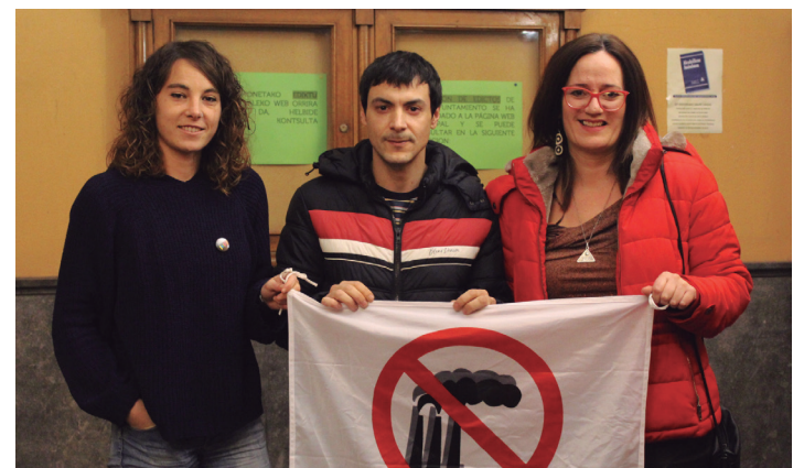
EH Bilduk eta Elkarrekin Lasarte-Oria Pudek babestu dute hitzordua. TXINTXARRI

Gorputza astintzeko Ttirriki-Ttarrakako kideen erronoi doinuak izango dira eta ostean, plaza dantzak. Azkenik, Oaintxe in deul txarangak kaleak alaituko ditu, iluntzean.