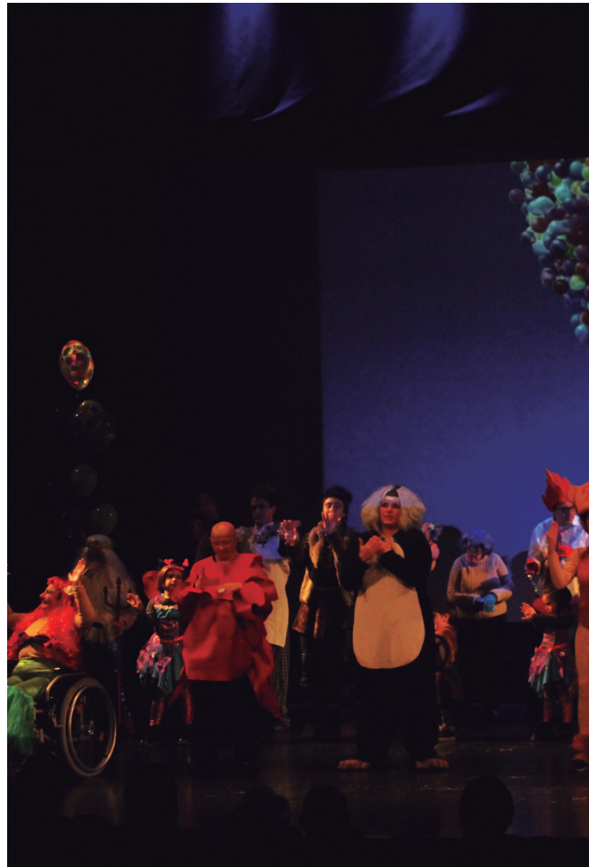
Disneyko doinu ezagunek eman diote hasiera jaialdiaren XIII. edizioari. Lehoi erregea eta