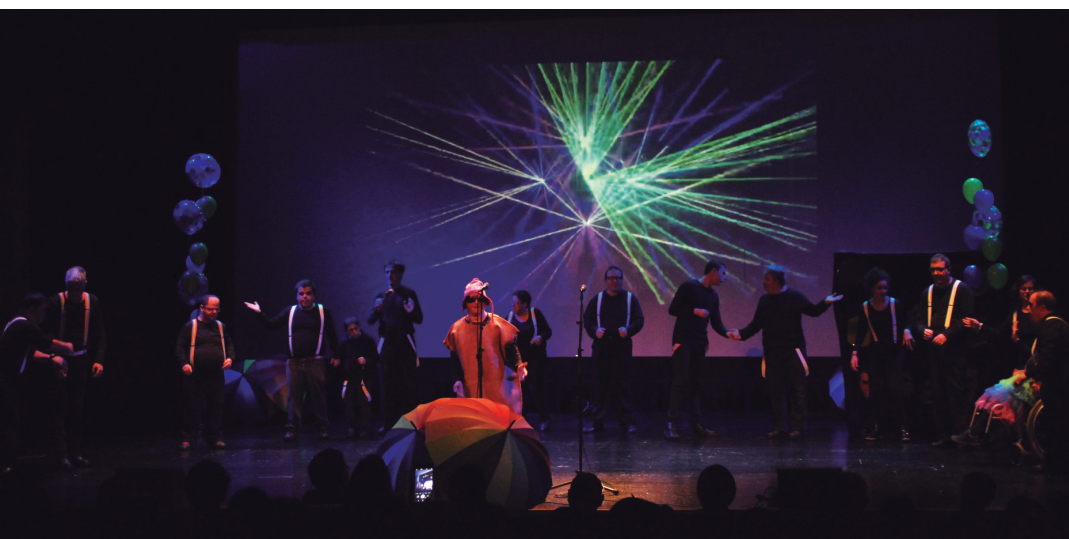
Askotariko dantza eta kantuekin gozarazi dituzte emanaldia ikustera gerturatu diren ikus-entzuleak.