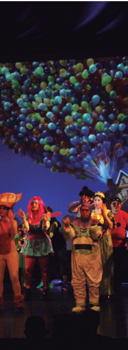
Merida printzesa irudikatu dituzte. TXINTXARRI