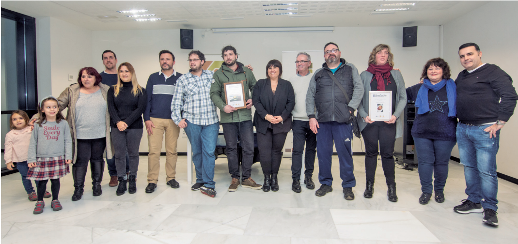
Parte-hartzaileak eta Aterpeko zein udaleko ordezkariak, sari-banaketa ekitaldia bukatu eta berehala. TXINTXARRI