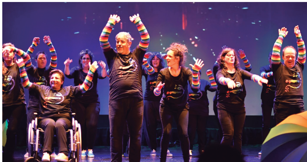
Jaialdi koloretsua oholtzaratu dute Jalguneko kideek; primeran pasa dute emanaldi osoan zehar. TXINTXARRI