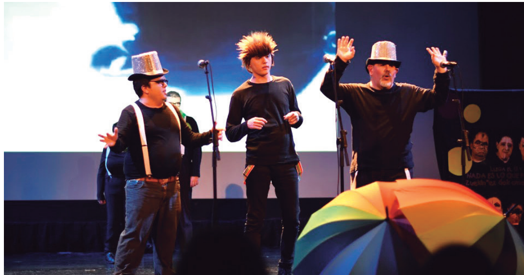
Mozorroak soinean jarrita, ederki moldatu dira oholtza gainean Jalguneko lagunak. TXINTXARRI