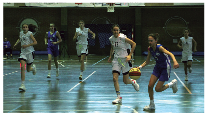
Infantil mailako lau selekzio izan dira lehiatzen. Argazkian, Asturias-Galizia neurketa. TXINTXARRI

Ez da hori Buruntzaldea IKTKo igerilarien urteko azken lehiaketa izango. Asteburu honetan, esate baterako, infantil, junior eta absolutu mailako igerilariak Neguko Ligako laugarren jardunaldian eta Irun Hiria Sarian lehiatuko dira; masterrek, berriz, Gipuzkoako Txapelketa jokatuko dute.