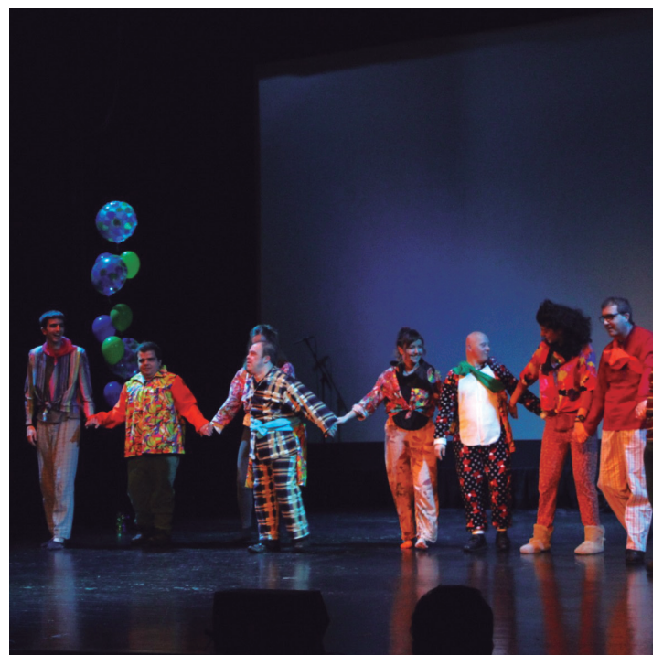
'Txozneroak' abestia dantzatu dute Sorgin Jaietako lagunekin batera. TXINTXARRI