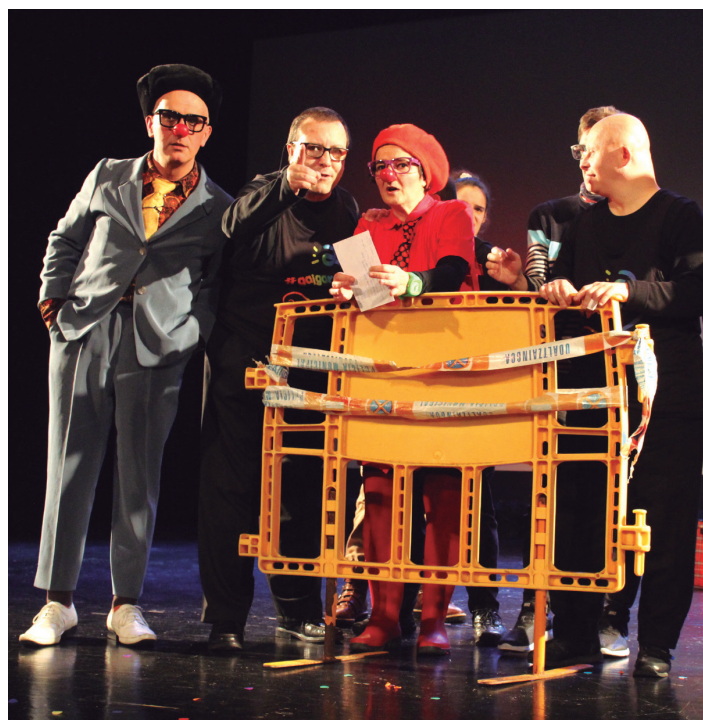
Abenduaren 3ko bideo emanaldia clown ikuskizunak girotu zuen.