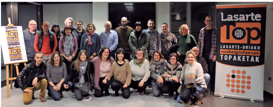
Euskara sustatzeko lanean ari diren eragileek eta herritarrek parte hartu dute prentsaurrekoan. TXINTXARRI