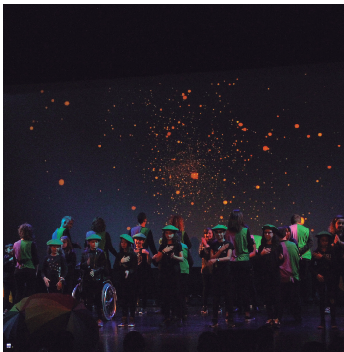
Gazteklubekoekin baloreetan oinarritutako kantak dantzatu dituzte. TXINTXARRI