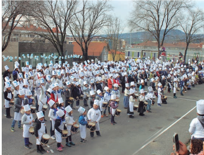
Sasoeta-Zumaburuko haurrak iazko danborradan. TXINTXARRI

Landaberri ikastetxeek ere joko dute danborra. Garaikoetxea eraikinean, 16:00etan bilduko dira danbor doinu ezagunak jotzeko, eta Landaberri eraikinekoek ere ordu berean ospatuko dute danborrada, erdiko