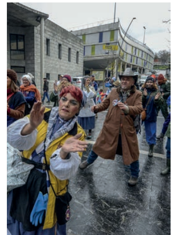
lazo inauteriak. TXINTXARRI

Inauterietan zerikusia duten jarduerak garatuko dituzte pertsona fisiko edo juridikoak eskatu ahal dituzte laguntzak. Urtarrilaren 25era arteko epea dago.