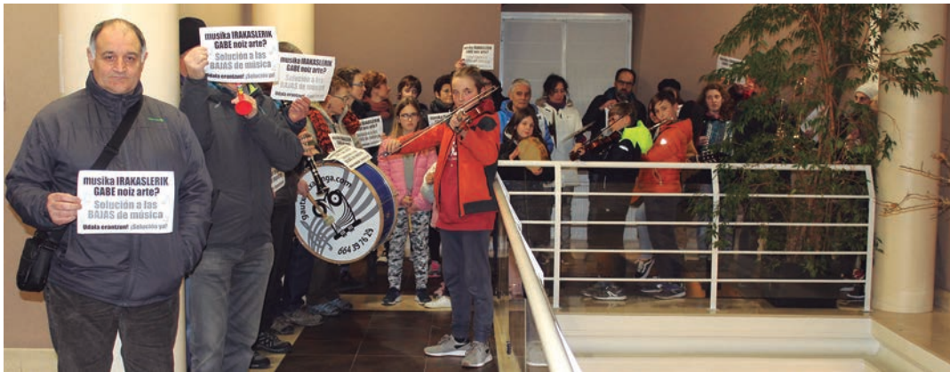
Musika eskolako ikasle eta gurasoek instrumentuak hartuta salatu dute egoera. TXINTXARRI