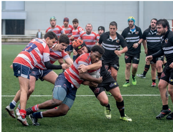
Defentsa laneta gogor jardun zuten beltzek. TXINTXARRI

Bigarren zatian ausart jokatu zuten, jakin arren indarrak noizbait agortuko zitzaizkietela. Jokoa aurkariaren zelaira