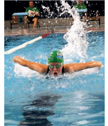
Buruntzaldea IKT, Andoainen. BURUNTZALDEA IKT

Bestalde, Andoainen Neguko Ligako lehen jardunaldia lehiatu zuten infantil, junior eta absolutuek. Hamasei igerilari aritu ziren guztira, eta 25 marka pertsonal lortu zituzten, taldeko