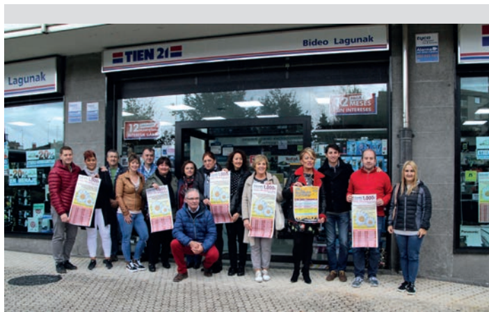
Aterpeko kideak eta udal ordezkariak, kanpaina aurkezpenean. TXINTXARRI