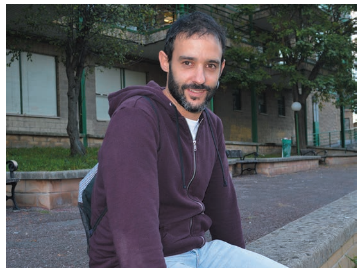
Etxeko guztiekin, familian ari dira euskarati eusten, Apaolazaren kasuan. KRONIKA

Ia urtebeteko esperientziaren ondoren, lortutakoari luzaroan eusteko itxaropena dauka Apaolazak. "Giltza ohitura aldatzen duzun bezalaxe. Gero,