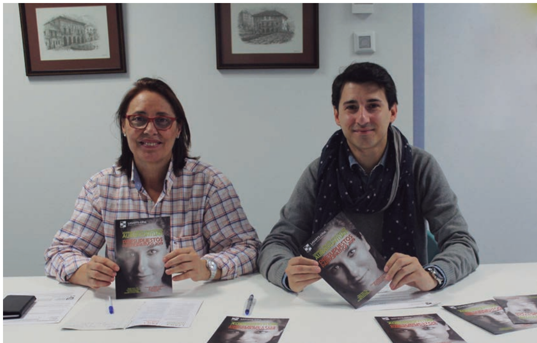
2019. urteko udal aurrekontuetarako parte hartze prozesua aurkeztu dute udal ordezkariak. TXINTXARRI