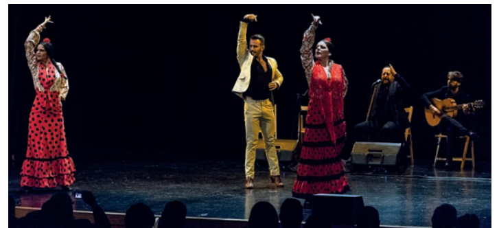
Malagako Cuadro Flamenco taldeko kideek erritmoz bete zuten aretoa. TXINTXARRI

Sari bakarra izango da zozketan. Irabazleak erosketa-bonuetan 1.000 euro jasoko ditu; 10 euroko ehun bonu, hain justu. Establezimendu bakoitzean gehienez hamar bonu gastatu ahal izango ditu, alegia, ehun euro. Azaroaren 29an, ostegunean, izango du horretarako astia, 17:00etatik 20:00etara.