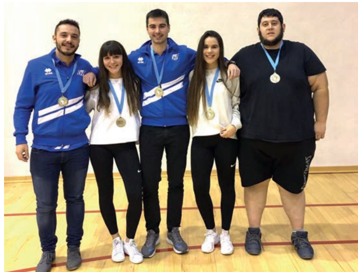
Lasarte-Oriako boskotea. Otaegi, erdian. TXINTXARRI

Gipuzkoako taldeak Euskal Ligako lehen postuetan aritzen dira, eta horrexek egiten zuen faborito Otaegiren taldea Arabaren aurka. Halere, Ostadarreko seniorren entrenatzailea ez zen fio. Eta