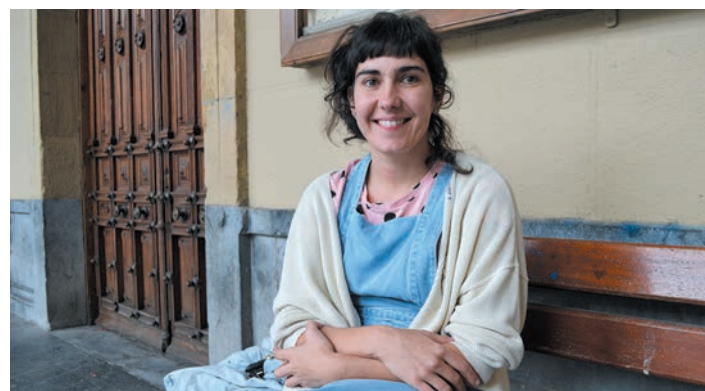
Euskaraldian ere parte hartzeko prest dago Axi, aitarekin erronkari eutsita. KRONIKA

Horregatik eman zuen izena; bereziki, aitarekin euskaraz egiteko ohitura berreskuratzeko. Ez zuen amarekin beste erronka bati eustea pentsatu, zailagoa zelakoan. "Denok egiten dugu zerbait, amak ere, gu entzunda, zer edo zer atera baitezake". Eta uste baino gehiago atera dute denek. "Pixkanaka ari gara. Orain gutxi, aita whatsapp erabiltzen hasi da, eta euskaraz. Aurrerapena da hori. Alfabetatu gabeta da, eta agian, Kronika irakurtzen duelako edo, animatu da, eta nahiko txukun!". Horrez gain, amarekin ere sorpresa hartu duela dio. "Erronka hori hartu ez banuen ere, zeharkako erronka izan da amak ere euskaraz gero eta gehiago entzun