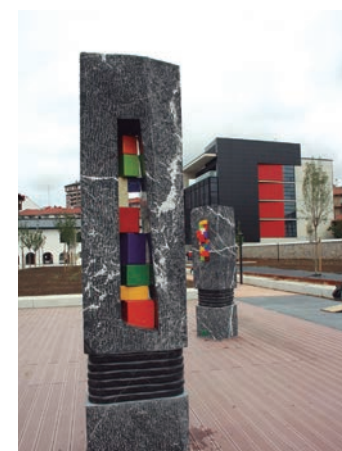
Askatasunaren parkea. TXINTXARRI

Larunbat eguerdian bilduko dira Lasarte-Oriako Udaleko ordezkariak Askatasunaren parkean. Udalak prestatutako adierazpena irakurriko dute, urtero moduan. Iragan urtean argitaratu zuten Memoria partekatuta baterantz txostena eta bertan bildutakoak ere ekarriko dituzte gogora agerraldian. Udalak bi konpromiso ditu memoriarako bidean: topaketarako eta eztabaidarako espazioak ugaritzea eta, kontaketa bat eraikitzea, biktime guztiak errespetatuko dituen.