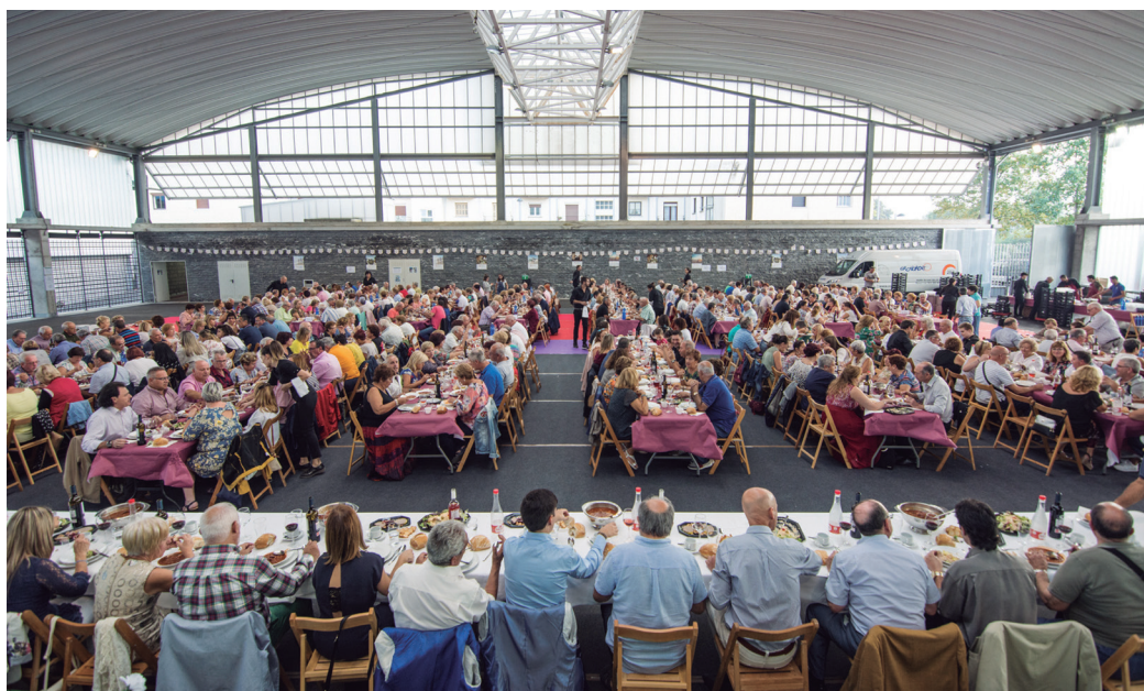
Lauhun pertsonak bapo bazkaldu zuten. Sukalde catering enpresak prestatu zuen menua. TXINTXARRI