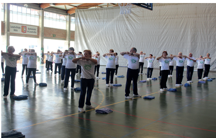
Fisikoki osasuntsu daudela erakutsi dute gimnastika erakustaldian. TXINTXARRI