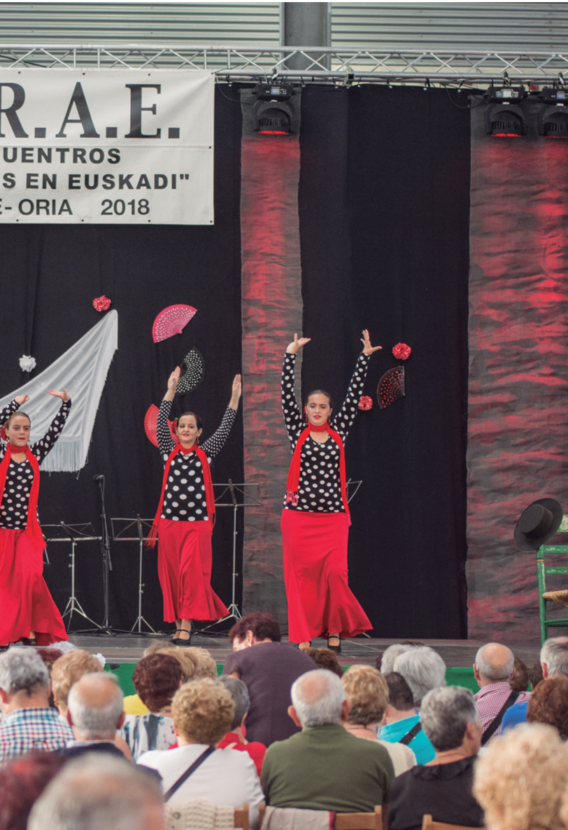
teza, baina mesedea eskatu diete. Udalaren laguntzarekin, onartu egin dute. TXINTXARRI