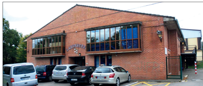
Landaberri ikastola.

Hiruki honen barruko barne mugimenduak hasten direnean, ordea, guztia errazten hasten da. Haurrak lehen egunetik naturaltasunez barneratzen du prozesua. Batzuetan negar eginez, beste batzuetan pozik jolasean, eta tarteka indiferentzia puntu batekin; baina natural. Gurasoek, ordea, egokitzapenaren bide honetan zalantza, kezka eta urduritasunaren zurrunbiloan jarraitzen dugu, askotan gure sentimenduak ezkutatu, besteen aurrean dena ongi edo gaizki dagoenaren itxura emanaz, eta neurri batean, konturatuz egokitzapena ez dela gure seme alabentzako ematen den prozesu soila, helduoi haurrarentzat banatzeko, sistemak jartzen digun frogua moduan ere har genezakeela. Hau naturala al da, ordea?