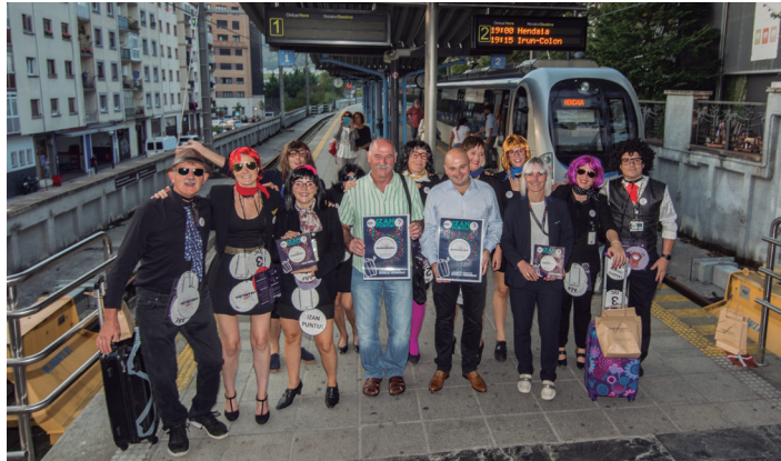
Hamaikakoak eta erakundeetako ordezkariak familia argazkia atera zuten.

Ttakunenean entseatu zuten ostiral arratsaldean. 17:30ak aldera abiatu ziren tren geltokira, eta 18:00etatik 20:00etara bidaiatu zuten, etenik gabe. Bukatutakoan, Okendo plazatik pasa ziren.