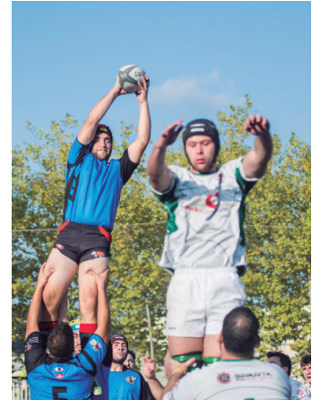
Bi taldeak, 'Touch' bat jokatzen. TXINTXARRI

Ohorezko B mailako Babyauto Zarautzek martxa ederra hartu du: bigarren garaipena lortu du jarraian. Valladoliden jokatu zuen asteburuan, El Salvadorren aurka. 17-24 irabazi zuen.