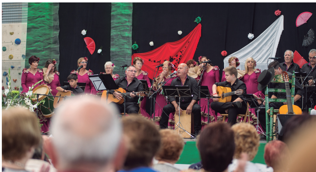
Semblante Rociero koruak ireki zuen larunbateko emanaldi sorta.