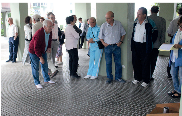
Euria dela eta, aterpera joan behar izan dira igel eta pote jokalaria.