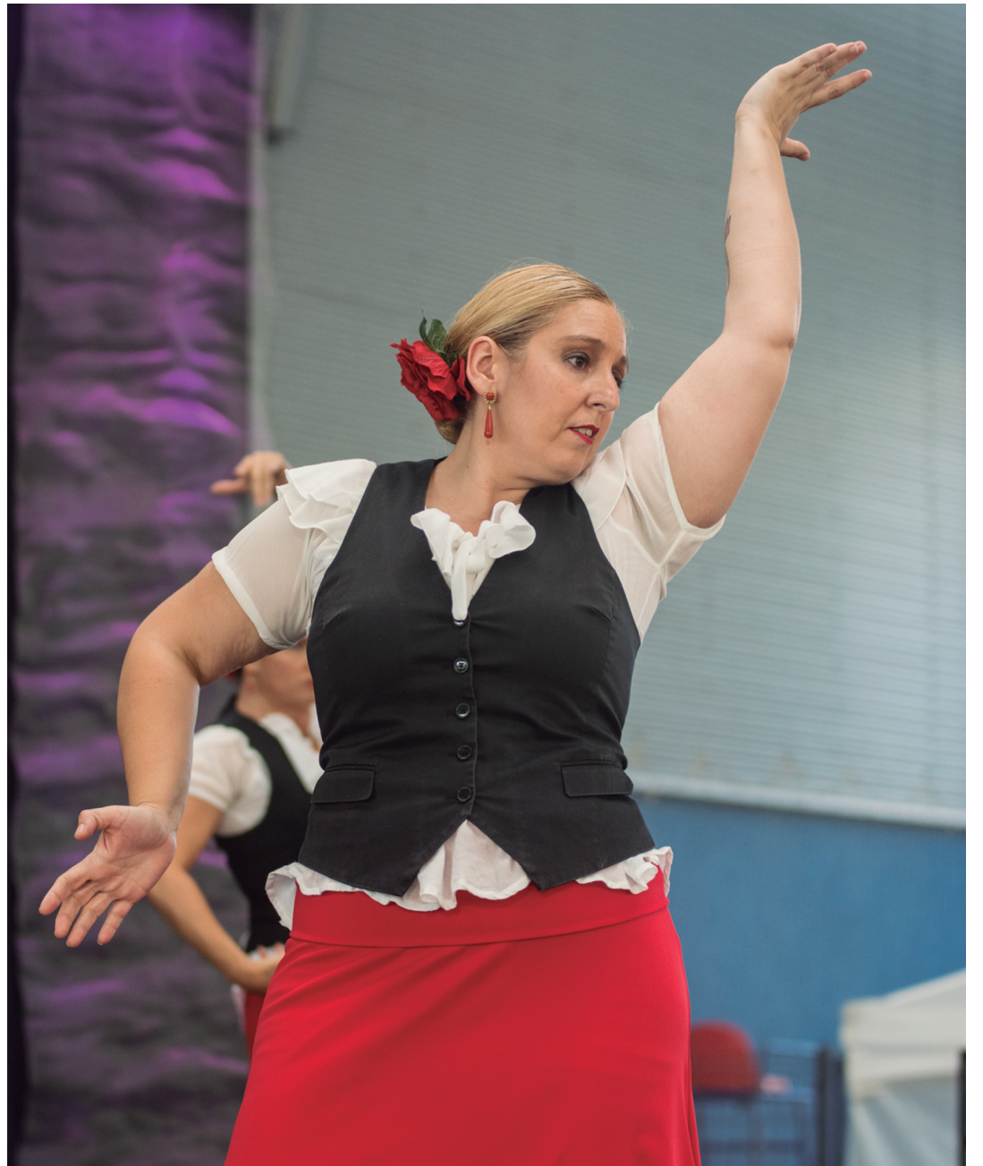
Durangoko El Sur taldeko kideetako bat, dena ematen. Arratsaldeko bigarren ikuskizuna izan zen eurena. TXINTXARRI