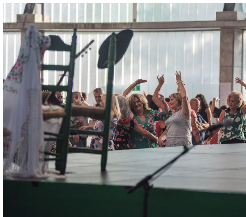
Bazkalostean, arratsaldeko kontzertuak hasi baino lehen, kantuan eta dantzan aritu ziren ia ordubet