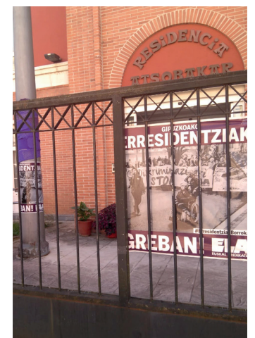
Afixak egoitzan. ATSOBARKARKO LANGILE BATZORDEA

Atsopakarko langileek greba egin zuten irailaren 28an, ostiralean. Gutxiengo zerbitzuak ezarri eta Donostiako Aldundira joan ziren lan baldintzengatik protesta egitera. Langileek soldata igoera, atsedena ordaindua eta ratio hobeak eskatzen dituzte, besteak beste. Ia bi urte eman dituzte negoziatzen, baina ez dute emaitzarik lortu. Urrian ere greba egitea aurreikusten dute, hilaren 24tik 26ra bitartean.