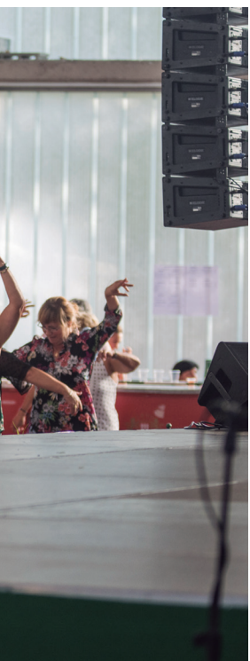
ez. Ez da digestioa egiteko modu batere txarra. Ilundu arte jarraitu zuten. TXINTXARRI