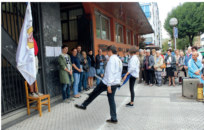
Udal Musika Eskolako trikitilariak agurra dantzatu dute hasiera ekitaldian. TXINTXARRI