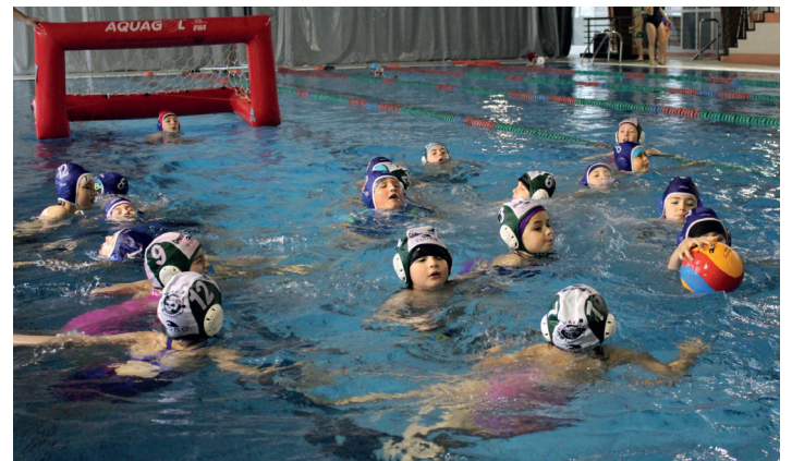
Ttakun Kultur Elkartearekin eginiko urpoloko topaketa. TXINTXARRI

Garoa taberna taldearen denboraldia itxaropentsua da. "20 bat jokalaria daude, eta indartsu hasi dira lanean. Lehen lagunartekoan 0-9 irabazi zuten. Ikusi beharko da garapena. Lehen postuetan lehian egongo dira, baina lan zaila izango dute, Ordiziako taldea bigarren nazional mailatik jaitsi da eta".