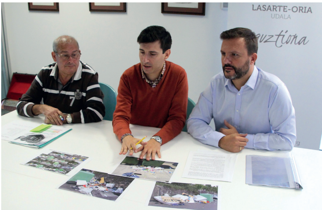
Urdepilleta Zerbitzu Publikoen zinegotzia, Zaballos alkatea, eta Valdivia zinegotzi eta mankomunitateko ordezkaria. TXINTXARRI