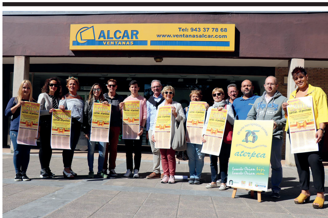
Bezeroaren Hamabostaldia kanpaina aurkeztu dute Aterpea merkataritza elkarteak kideek eta udal ordezkariak. T.VALLÉS