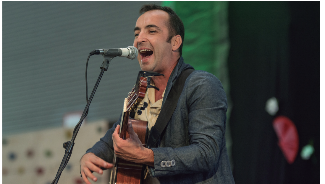
Malagatik etorritako SonSonySal taldearena izan zen topaketetako emanaldi nagusia. TXINTXARRI