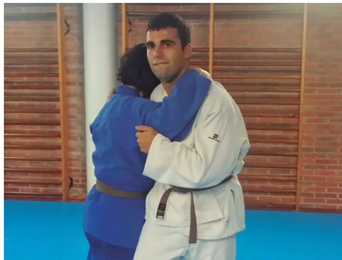
Duela zortzi urte hasi zen Oscar judoa egiten. LOKE KIROL ELKARTEA

"Oso-oso pozik gaude denak. Aukera bikaina da kirolaren festa honetan parte hartzea;