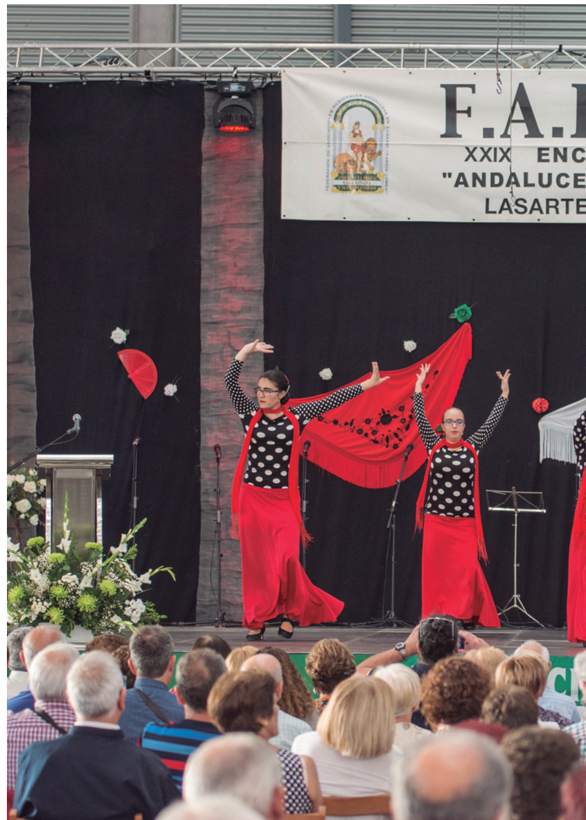
Duela lau urte antolatu zituen Semblantek FARAE topaketak. Aurten ez zegokien beraiei lan hori har