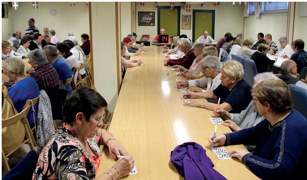
Arreta handiz jarraitu dituzte lehiakideek bingoan esandako zenbakiak. TXINTXARRI