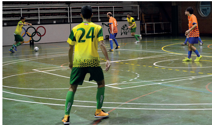
Aldatz HK lehen taldeko babesle izango da; ISU Leihoak bigarren taldekoa.