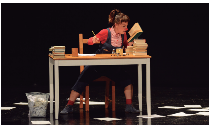
Emanaldi dibertigarria izan da Zirriborro klown. TXINTXARRI