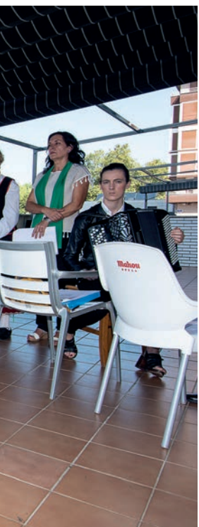
ren gaztetxoak, Jaizkibel plazan. Momia jokoan, esate baterako. TXINTXARRI