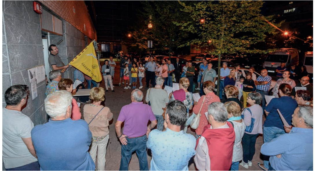
Extremadura etxeke bandera altxatzearekin batera lehertu zen festa giroa Sasoeta auzoan, ostiral iluntzean. TXINTXARRI