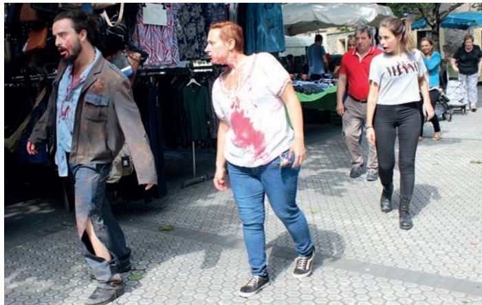
Iluntasunaren jaunak asteazkenean zombiak bidali zituen herria ikuskatzera. TXINTXARRI

Era berean, jokoaren araudia betetzen zorrotzak izan nahi dute, eta jendeari jokotu bitartean alkoholik ez edateko gogorarazi diete, baita segurtasun neurriak jarraitzeko ere. "Iaz jendea kaleratu zuten". Horregatik, ekimeneko informazio eta araudi guztia Survival Zombieko orrialdean eskuragarri dagoela jakitera eman dute.