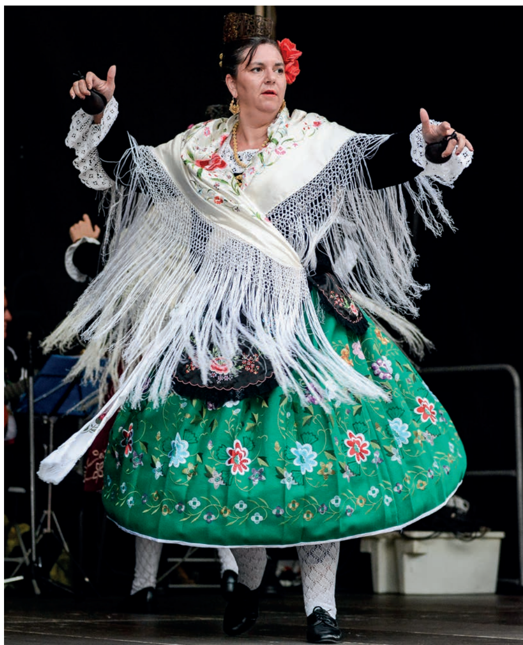
Nafarroatik etorritako Brotes y Raices taldeak emanaldi ikusgarria eskaini zuen larunbat arratsaldean. TXINTXARRI

Aurten 40 urte bete ditu Ama Guadalupekoa Extremadura etxeak. Aurtengo festak oraintxe bukatu badira ere, datorren urtekoak antolatzen hasiko dira laster alor kulturala sustatzen jarraitu nahi duten bazkideak.