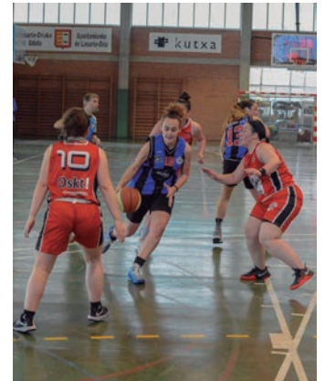
Senior neskek. TXINTXARRI

Argazkiak ateratzen ostean, lagunarteko partida jokatu du emakumezkoen senior taldeak, BKL Beasain taldearen aurka 11:00etan. Gainerako taldeek ligari hasiera emango diote asteburu honetan jokatu dituzten partidekin.