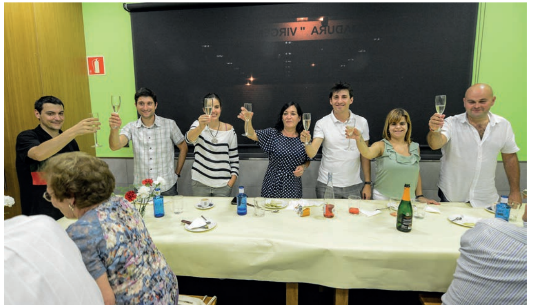
Hainbat udal ordezkarik bapo afaldu zuten bazkideen afari ofizialean. Elkartearen 40 urteengatik egin zuten topa. TXINTXARRI