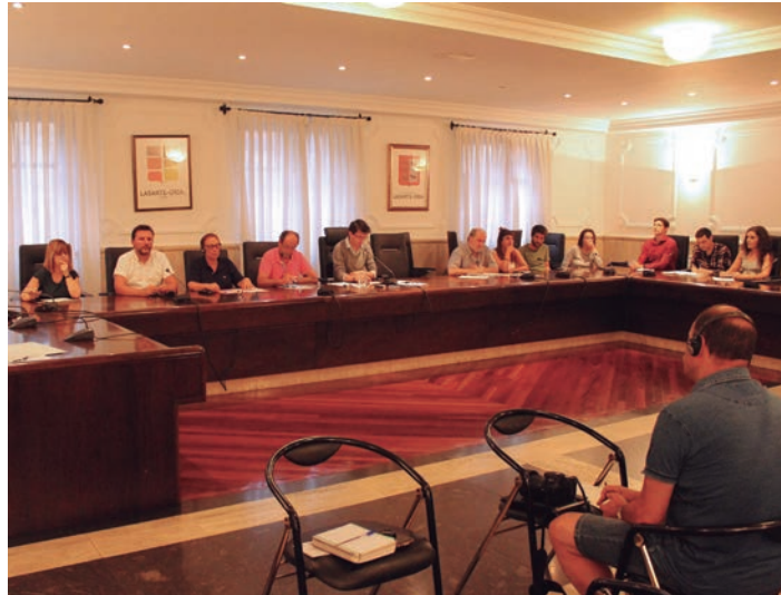
Ezohiko udalbatzarra egin dute herriaren egoera aztertzeko. TXINTXARRI

Horri helduta jarri dute mahai gainean Atsobakarreko futbol zelaiaren gaia ere. Usurbilgo Udalarekin akordioa lortzea "ezinezkoa" izaten ari da Lasarte-Oriako Udalarentzat, eta desadostasun hori, proiektua "atzeratzen" ari dela salatu du. Egoera horrek bultzatuta, gaia behin-behinean alde batera uztea