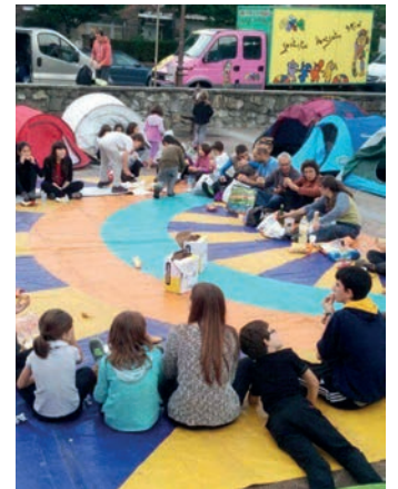
Duela bi urteko irudia. ZABALETA AUZOLAN

Iritsi da hainbeste itxarondako eguna. Gamusinoen bila aterako dira gaur gauean, ostiralean, Zabaleta auzoan. 21:00etan jarri dute hitzordua, kanpin dendak jartzeko auzoko plazan. 21:30ean afalduko dute, bakoitzak etxetik ekarritako janaria. 22:00etan bideoa ikusi, eta 22:30ean hasiko dira gamusinoak bilatzen. 23:30etan jarri dute lotarako ordua. Biharamunean txokolatada prest izango dute gosaltzeko. Zartagina, koilara, linterna eta mendiko arropa eramatea gomendatu dute.