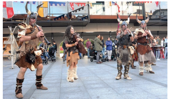
Aurten musika taldeek oholtzan eskainiko dituzte hainbat emanaldi. TXINTXARRI

Jantzia egin nahi duenak aukera ederra du ikastaro honetan. Gizonezkoak ere pausoa ematera gonbidatzen ditut.