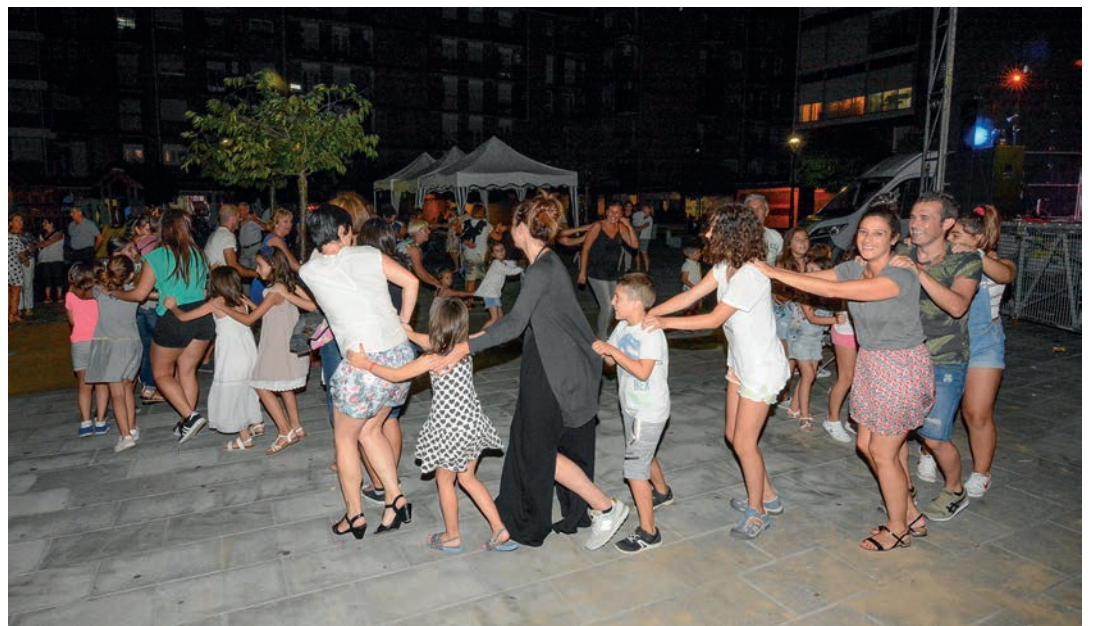
Gazte eta helduek ederki pasa zuten larunbat gaueko erromerian. Dantatzera ere animatu ziren asko. TXINTXARRI