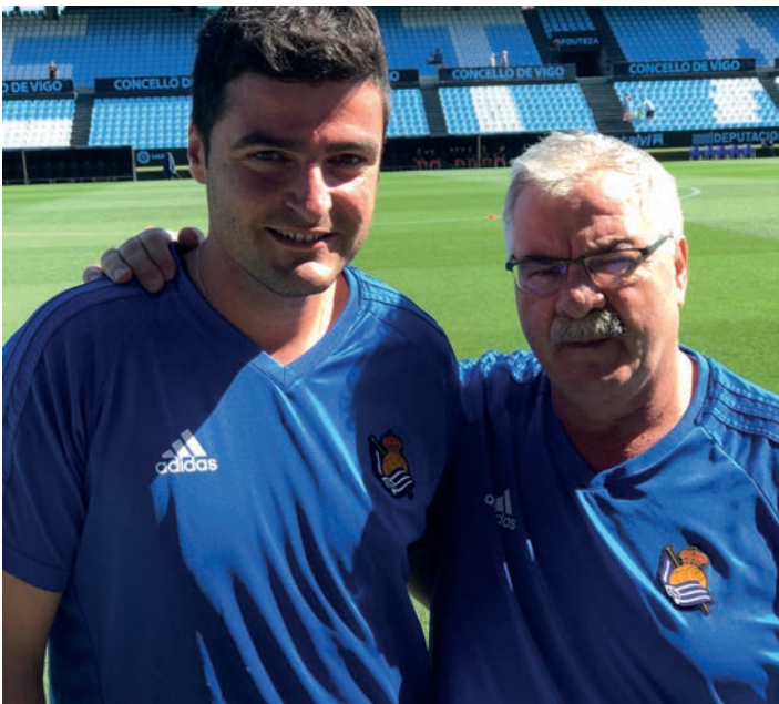
Aita-semeak, elkarrekin lanean hasi zirenean. UNAI OLAIZOLA