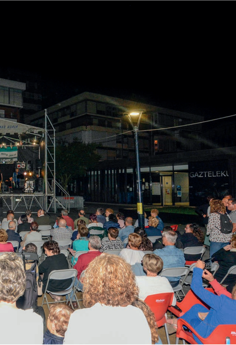
Leitu zuena. Lepo bete zen Jaizkibel plaza ostiral gauean. TXINTXARRI