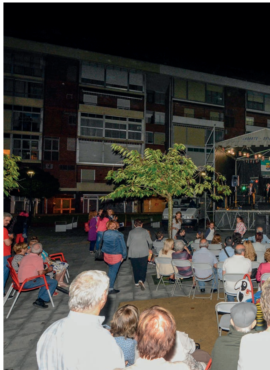
Extremaduratik etorritako Los Cabales taldearen emanaldia izan zen asteburuan zehar arreta gehien d