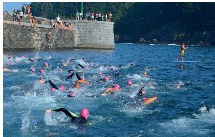
Mutrikutik aterako dira asteburu honetan Flysch Beltza zeharkaldian. FLYSCH BELTZA