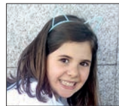
Uxue Zorionak printzesa zure 8. urtebetetzean! Muxu handi bat familiaren partez!