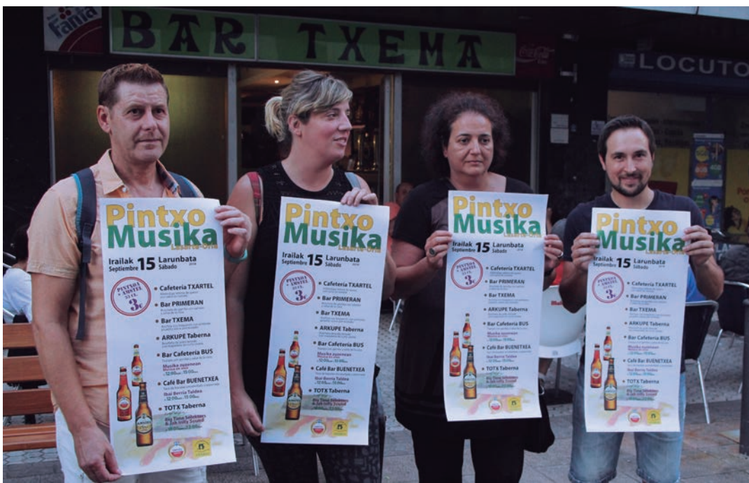
Zumaburuko Txema tabernan aurkeztu dute aurtengo ekitaldia. TXINTXARRI