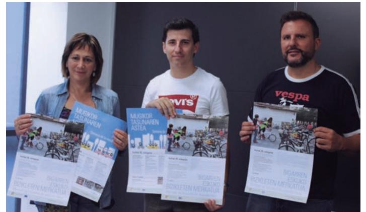
Mugikortasun astearen antolatzaileak, udal ordezkariekin. TXINTXARRI

Aurten ostalariak ez ezik, beste komertzioak ere gonbidatu dituzte babesleku izatera. "Horrelako jokoa interesgarria izan daiteke beste denda batzuentzat ere, hala nola, litxarrerria dendak". Era honetara, herritarrak eta komertzioak gonbidatzen dituzte jokoan parte hartzera.