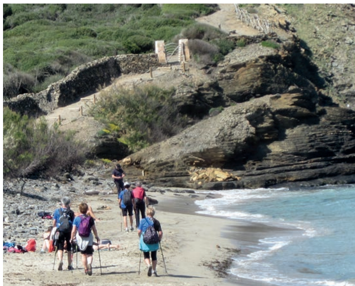
Menorcara joango dira aurten ere Ostadar Ipar Martxako kideak. OSTADAR IPAR MARTXA

Taldea osatzeko ere Menorcara egingo du bidaia. Iaz lehenengoz joan ziren, eta esperientzia urtero errepikatzeke asmoa dute. Ekintza berezi bezala, urriaren 21ean, Kursaallean Aspanogiren alde egingo den emanaldian parte hartuko dute. Hau guztiaz gain, aurten lehenengoz Lasarte-Oria Bai! Krosean parte hartuko dute ipar martxako kideek. Proba modura egingo da eta 40 martxalari izango dira lasterketan.