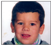
Unai Zure iraganeko onena, zure etorkizuneko txarrera izan dadila. Zorionak!