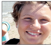
Uxue Zorionak ebeko saltserari 13 urte betetzeagatik. Jarraitu horrela!!