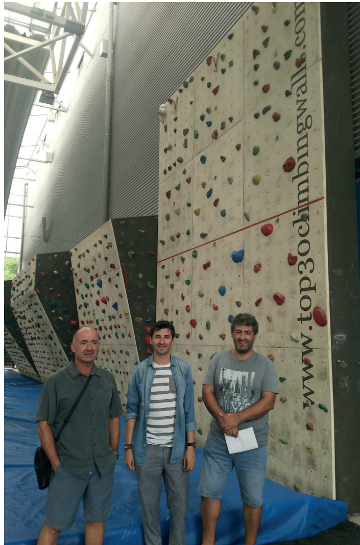
Rokodromo berria, Michelinen. LASARTE-ORIAKO UDALA

Rokodromoa lekualdatzeko lanak Horma Rokodromoak enpresak egin ditu, 20.320 euro ingururengatik. Gainera, instalazioak hobetu dituzte; 300 helduleku baino gehiago jarrita, eskalatazailerak aukera gehiago izango dituzte haien ibilbidea egiteko.