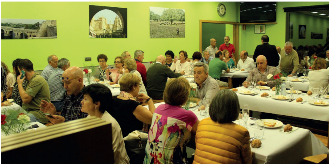
Urtero bazkideen afari ofiziala egiten du Ama Guadalupekoa Extremadura Etxeak. TXINTXARRI