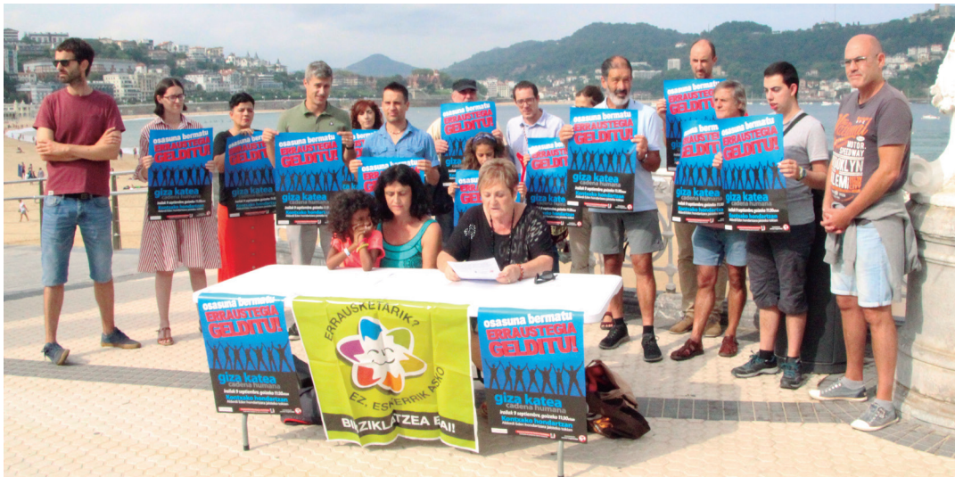
Erraustegiaren aurkako mugimenduak dei egin du igandeko mobilizazioan parte hartzera. TXINTXARRI