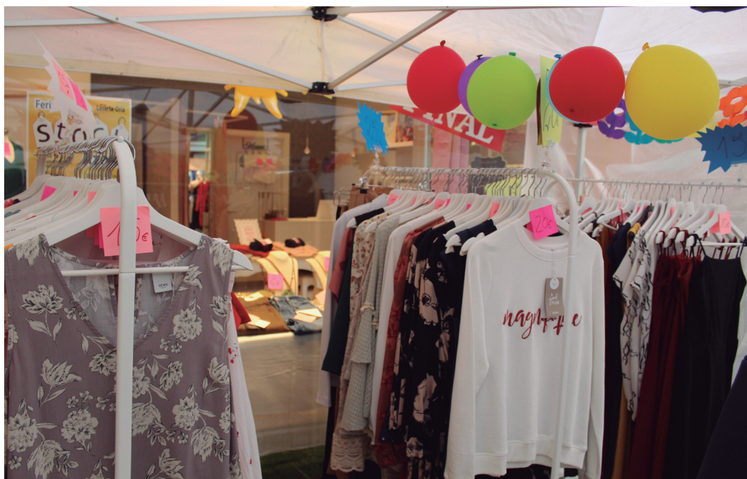
Deskontu onak izan dituzte bezeroek ikasturteari hasiera emateko. TXINTXARRI