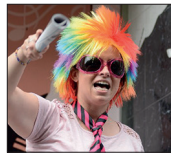
Naiara Zorionak! Zure eguna ederki ospatzeko ordu gutxi geratzen dira! Txintxo ibili!! Ttakuneko lankideen partetik.