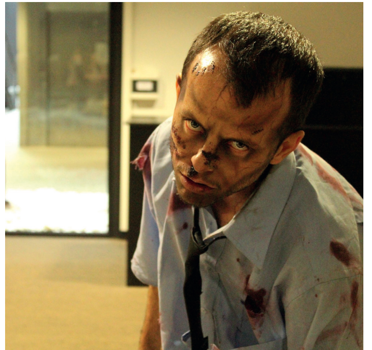
Zonbi bat, Lasarte-Orian, iazko ekitaldiko aurkezpenean. TXINTXARRI