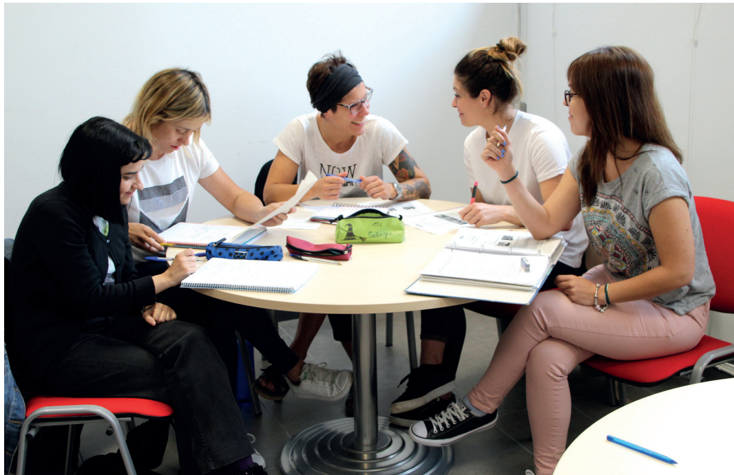
Euskaltegietako ikasleak, apunte artean, ikasturte amaierako azterketarako prestatzen. BURUNTZALDEKO UDALAK

Horrez gainera, HABE Helduen Alfabeta eta Berreuskalduntzerako Erakundeak ere laguntzak ematen ditu. 2018. urtean 1.800.000 euro emango ditu, eskatzaileen artean banatzeko. Ondokoak dira baldintzak: batetik, 2017ko martxoaren 17tik 2018ko abuztuaren 31ra euskaltegi edo